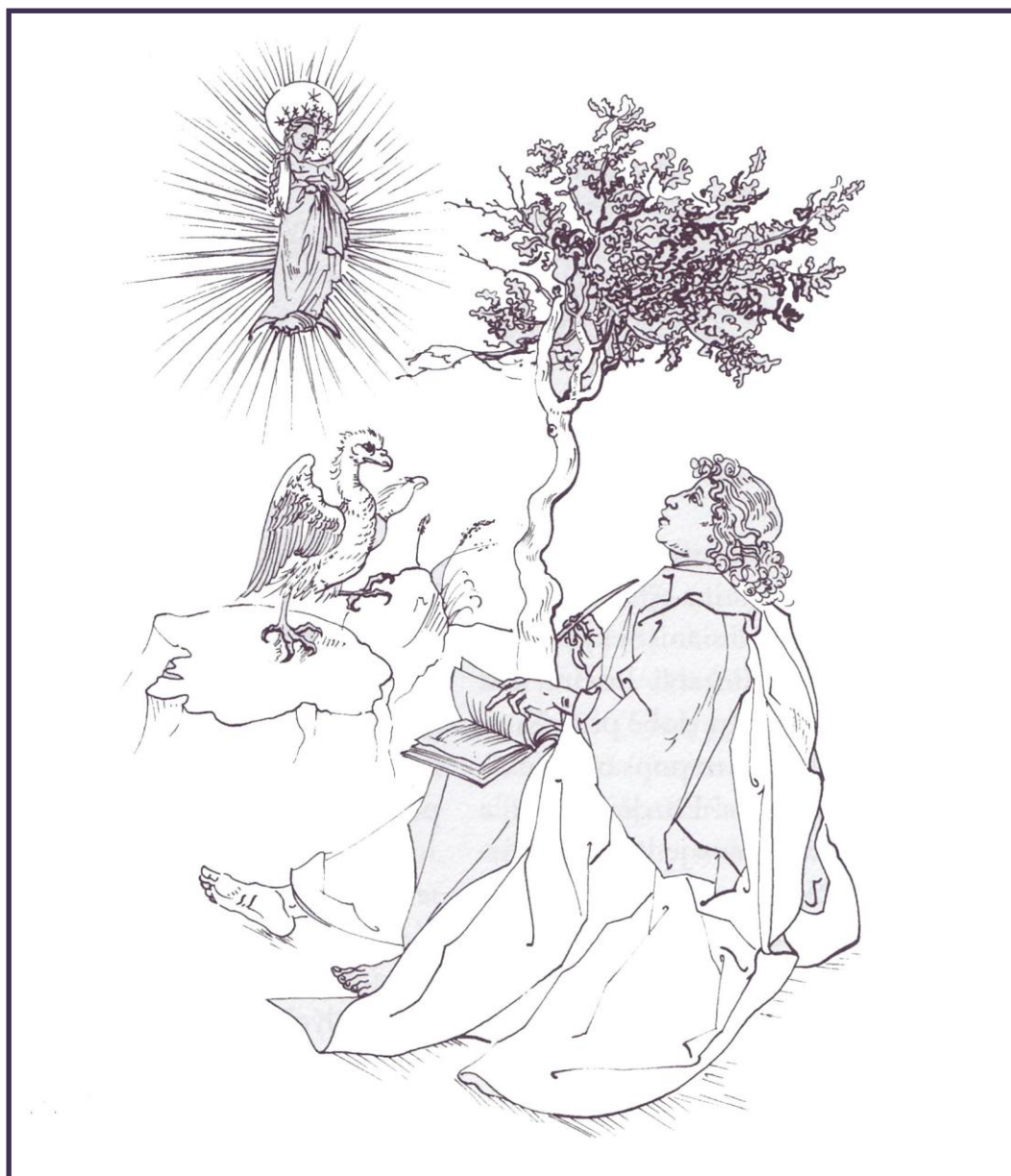
SV. JÁN EVANJELISTA NA OSTROVE PATMOS ( 1498 ) KRESBA PODĽA DREVOREZU DÚREROVEJ APOKALYPSY