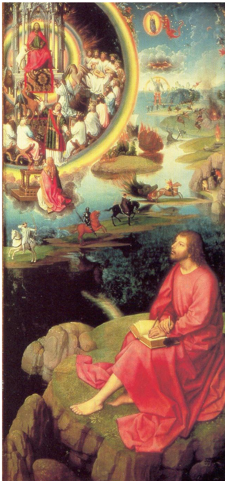
SV. JÁN NA OSTROVE PATMOS ( 1479 ) HANS MEMLING