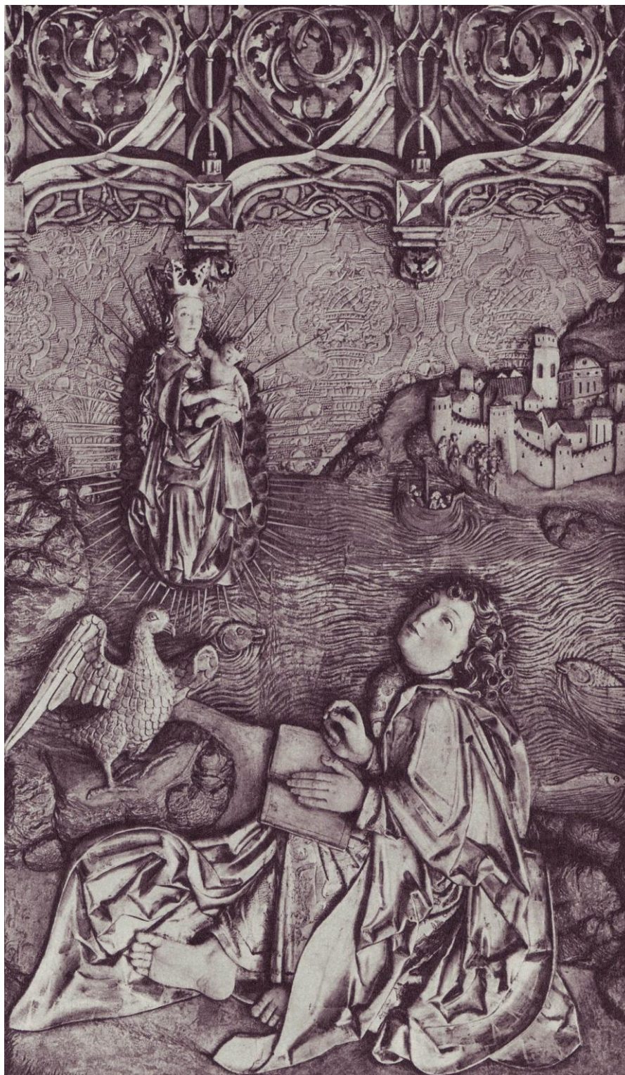
MUČENIE SV. JÁNA ( 15. – 16. STOROČIE ) LEVOČSKÝ OLTÁR