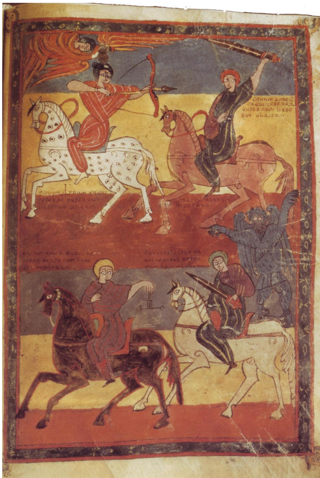
ŠTYRIA APOKALYPTICKÍ JAZDCI (980) RUKOPIS APOKALYPSY Z VALLADOLIDU