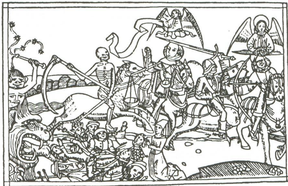
APOKALYPTICKÍ JAZDCI ( 1478 – 1479 ) KOLÍNSKA BIBLIA