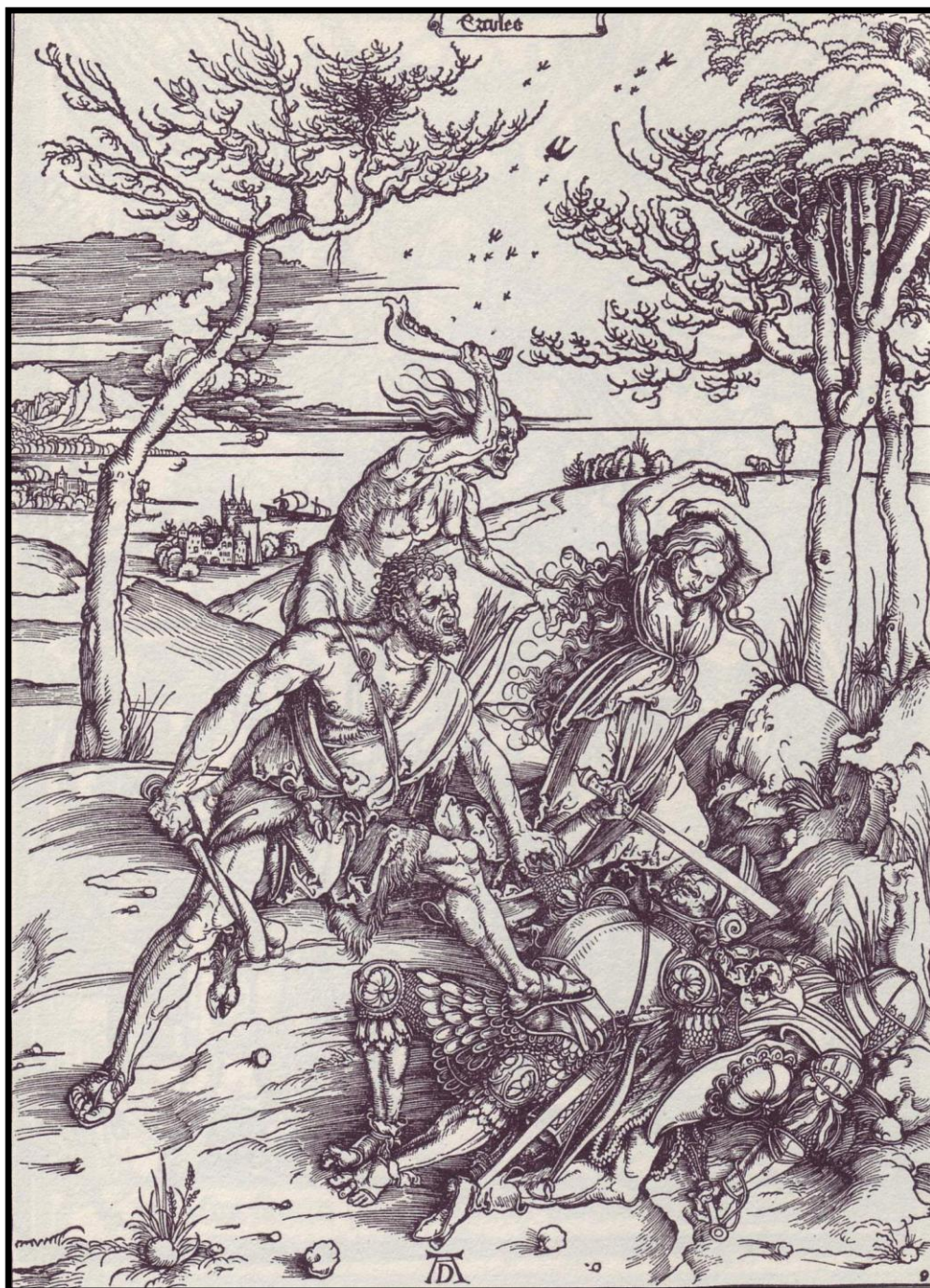
BOJÚJÍCI ( 1497 – 1499 ) ALBRECHT DŮRER