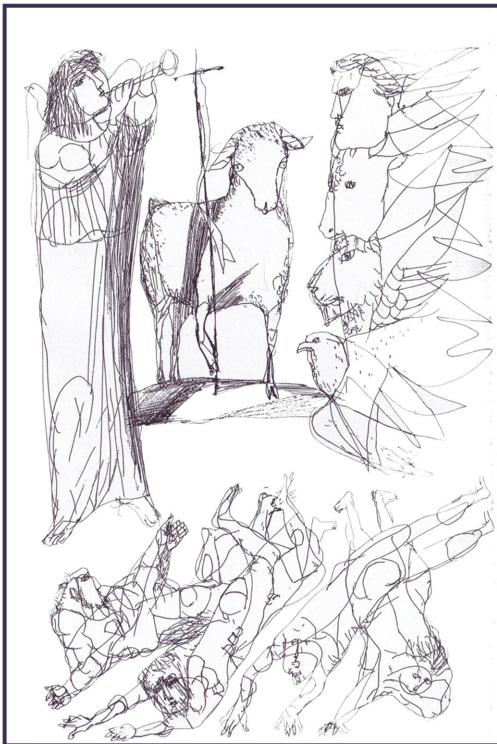
OTVORENIE SIEDMEJ PEČATE ( 20. STOROČIE ) LAJOS SZALAY