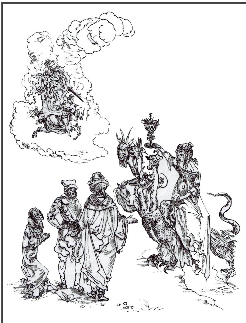
JAZDEC PRAVÝ A VERNÝ, DETAIL GRAFICKÉHO LISTU VELKÁ NEVIESTKA BABYLONSKÁ ( 1493 ) ALBRECHT DÜRER KRESBA PODĽA DREVOREZU