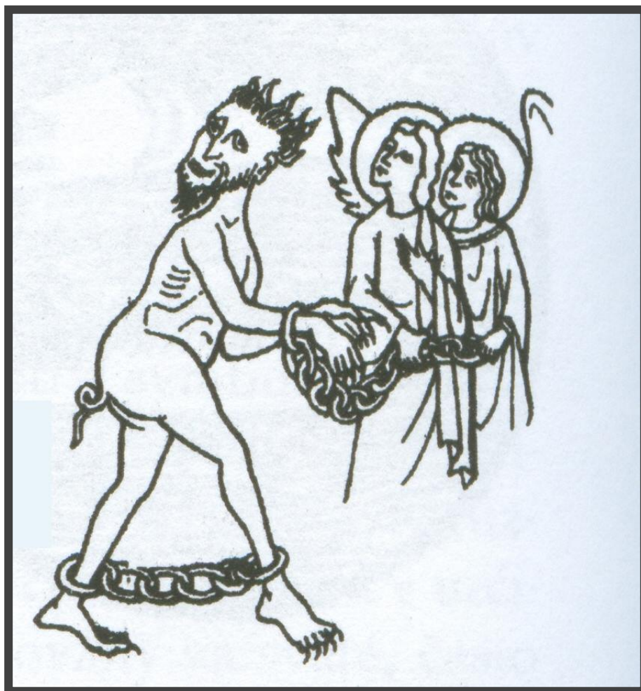
SATAN SPÚTANÝ REŤAZOU KRESBA PODĽA ALSASKEJ MINIATÚRY