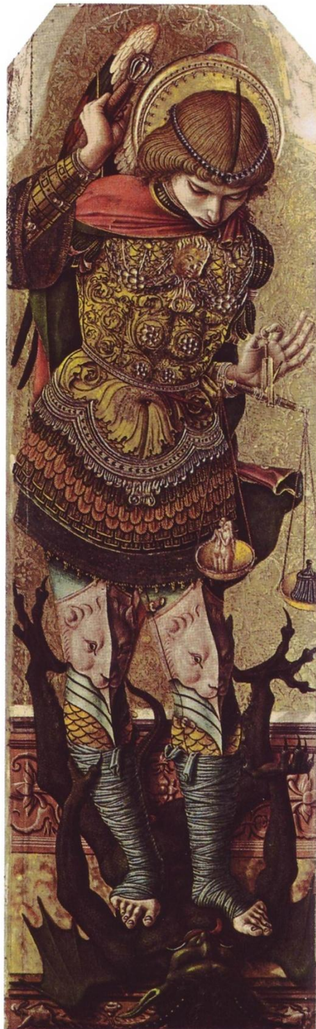
VÁŽENIE DUŠÍ (1476) CARLO CRIVELLI KRÍDLO POLYPTYCHU SV. DOMINIKA