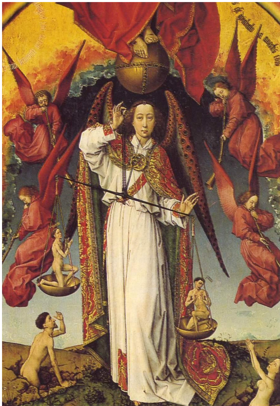
VÁŽENIE DUŠÍ ( 1449 ) ROGIER VAN DER WEYDEN DETAIL CENTRÁLNEJ TABULE OTVORENÉHO OLTÁRA