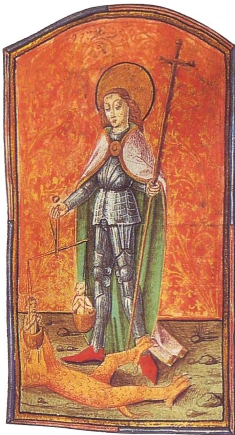
VÁŽENIE DUŠÍ ( 15. STOROČIE ) ANONYM Z FLÁMSKA