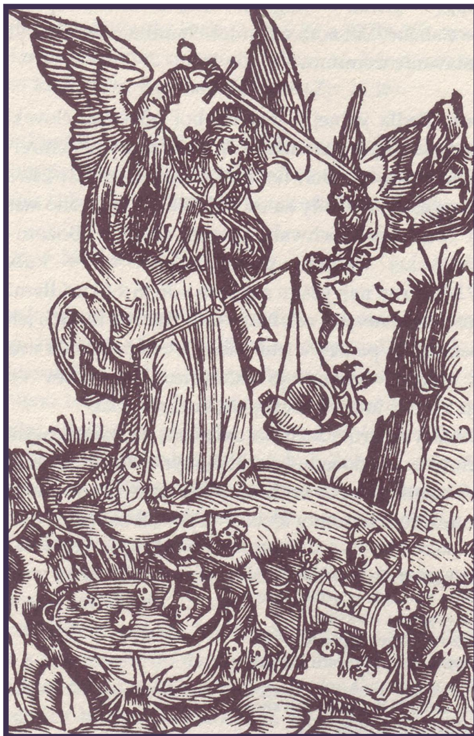
VÁŽENIE DUŠÍ (1514) JOHANNES WEISSENBURGER