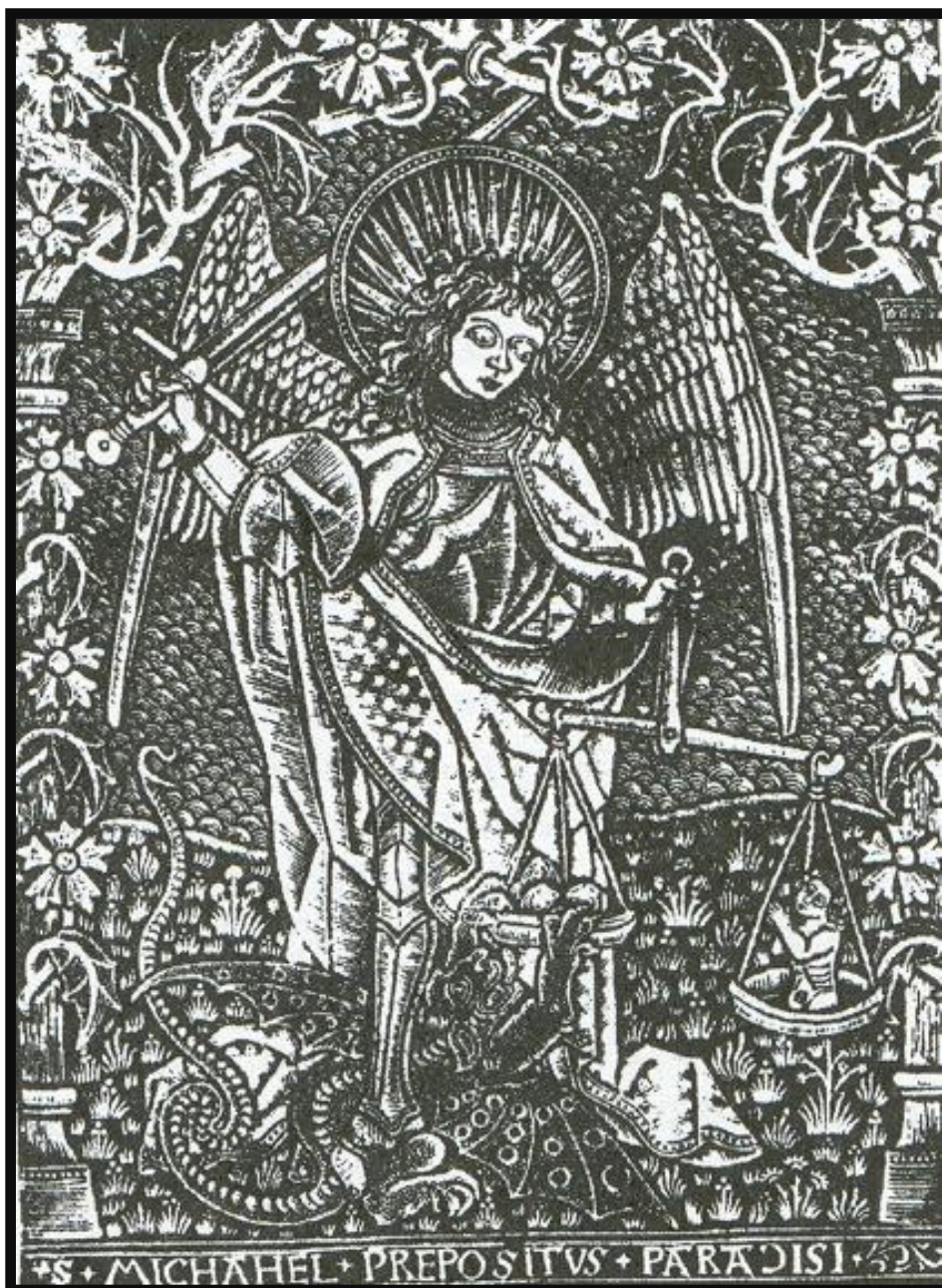
VÁŽENIE DUŠÍ ( 1490 ) ŠROTOVÁ TLAČ