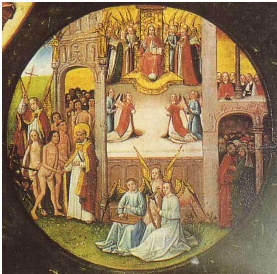
NEBESKÁ BRÁNA ( 1475 -1480 ) HIERONIMUS BOSCH