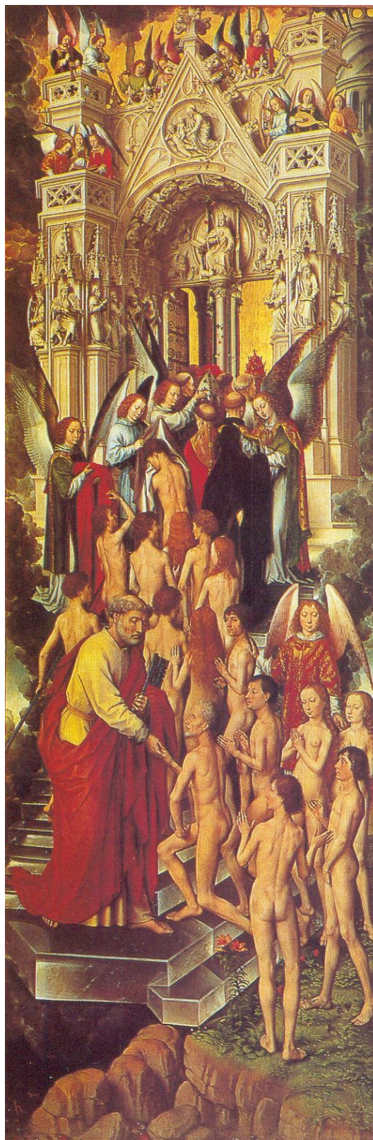
NEBESKÁ BRÁNA ( 1466 - 1473 ) HANS MEMLING

ĽAVÉ KRÍDLO GDAŇSKÉHO TRIPTYCHU POSLEDNÝ SÚD