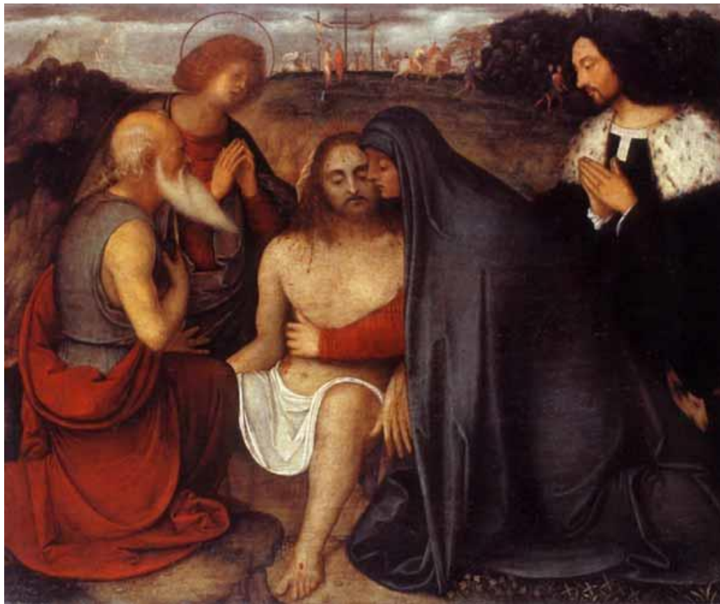
G. Agostino da Lodi: Pieta s o sv. Jánom Evanjelistom, sv. Hieronymom a donátorom (16.st.)