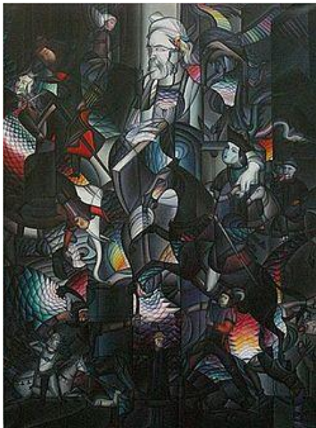
B. Alivandi: Ferdowsi a jeho mýtus (1980)

http://en.wikipedia.org/wiki/Bahram_Alivandi