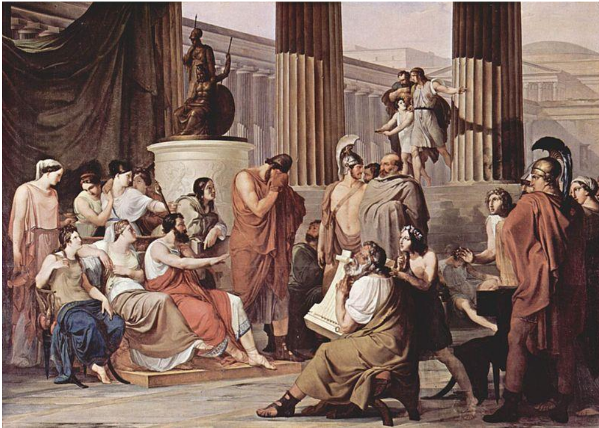
F. Hayez: Odysseus na dvore Alkinoia (1814-1815)

Alkithoé - v gréckej mytológii jedna z troch Mínyadés (pozri Arsippé , Leukippé )