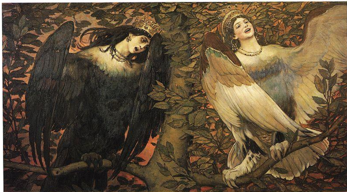
A. M. Vasnetsov: Alkonost