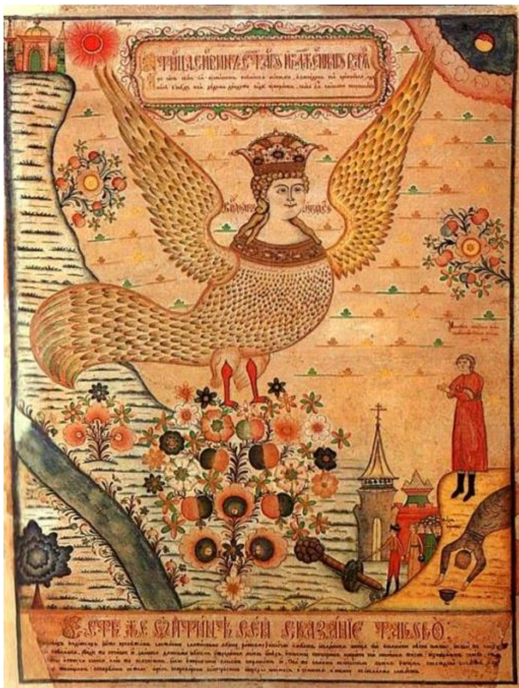
Alkonos (ruský lubok, 19.st.)