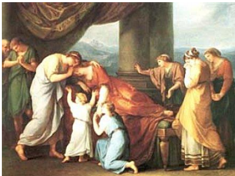
A. Kauffmanová: Smrť Alkestis