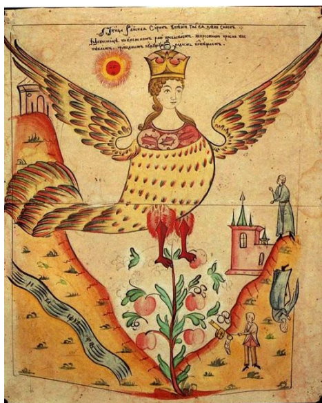
Rajský vták (ľubok, 19.st.) Rajský vták (ľubok, 19.st.)