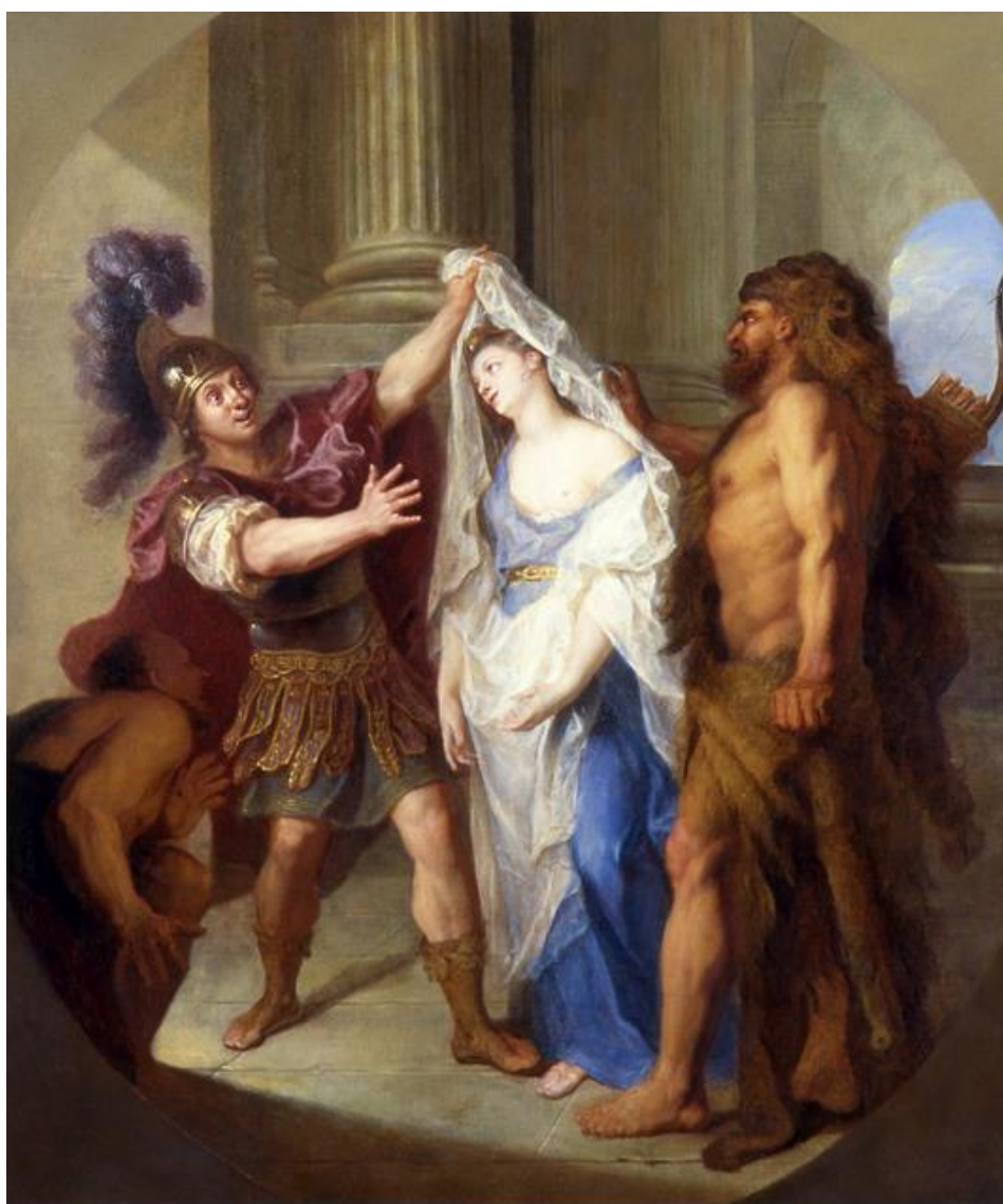
A. Coypel: Herkules privádza Alkestis z podsvetia (1700)