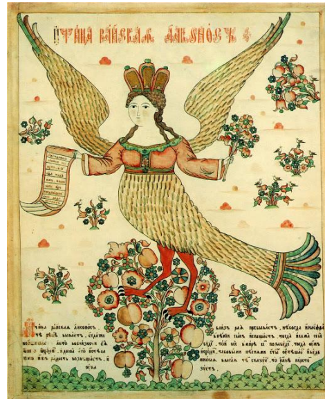
Siréna. Rajský vták (1.pol. 19.st.) Alkonost (neskoré 19.st.)

alkovna - z arab. al-kubbe – „klenba, dutina“