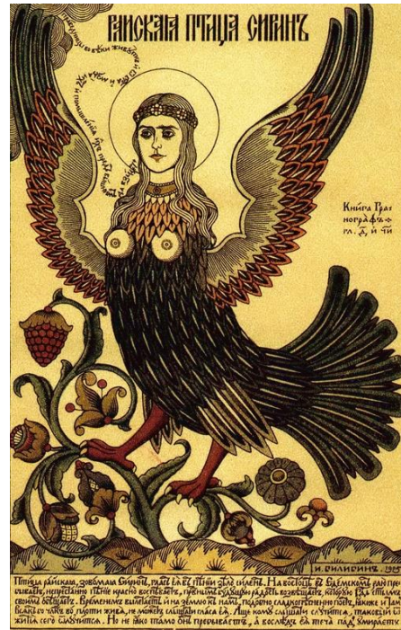
I.Bilibin: Vták Alkonost (1905) I.Bilibin: Vták Alkonost (1905)