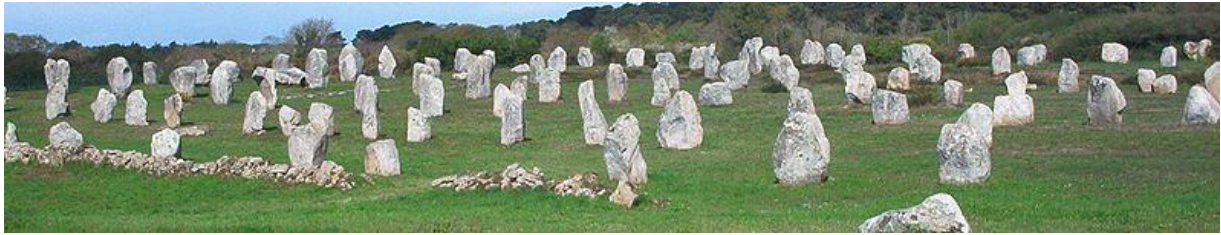
menhiry v Kerlescane v Bretónsku

alignement/aliňman - z franc. názov megalitov ( menhirov ) usporiadaných do jedného alebo viacerých radov; rozšírené najmä v západnej, zriedkavo v strednej Európe; najviac vo Francúzsku; v Kerlescane vytvorených 13 radov z menhirov; porovnaj trilit