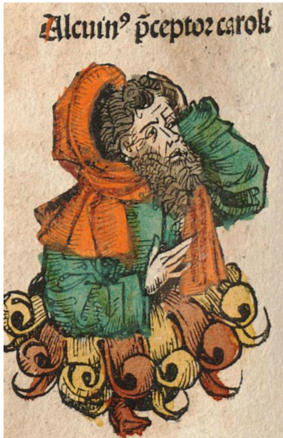
M. Wolgemut, W. Pleydenwurff, H. Schedel: Alkuin učiteľ Karla (Norimberská kronika, 1493)

alkyd - www : polyester vyrábaný pridávaním mastných kyselín a ďalších zložiek; alkydy sa používajú vo farbách a formách na liatie; pôvodné alkydy boli zlúčeniny glycerolu a kyseliny ftalovej a predávané pod názvom Glyptal; boli predávané ako náhrady za tmavšie sfarbené kopálové živice