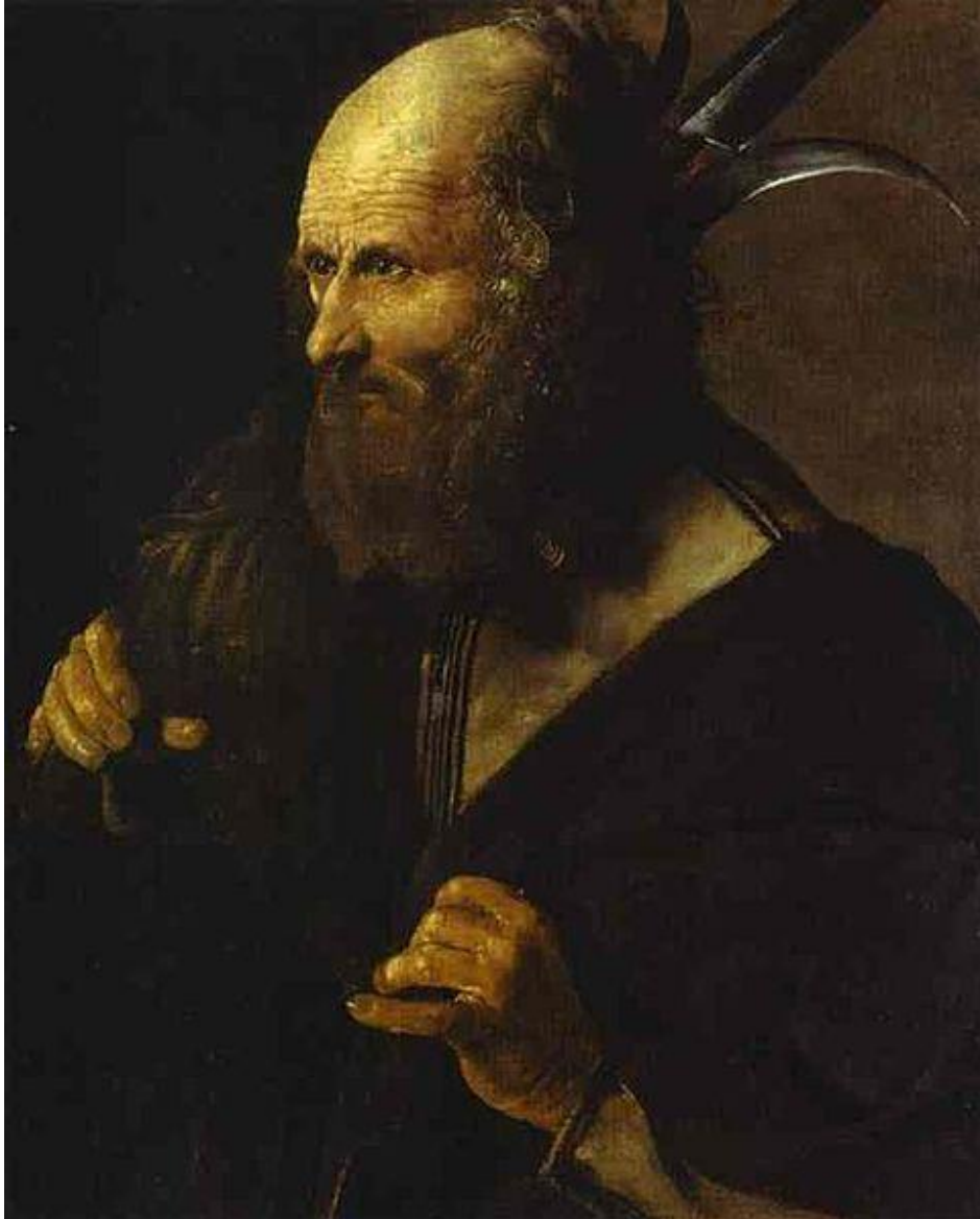
G. de La Tour: Svätý Juda Tadeáš (1615-1620)