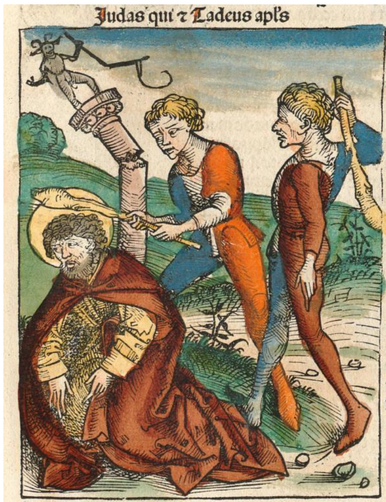
M. Wolgemut, W. Pleydenwurff, H. Schedel: Juda Tadeáš (kolorovaný drevoryt, Norimberská kronika, 1493)

-jeden z dvanástich Ježišových učeníkov, ktorý zomrel mučeníckou smrťou; zvyčajne sa stotožňuje s Tadeášom, bratom apoštola Jakuba, a autorom Júdovho evanjelia; o Tadeášovom živote po zoslaní Ducha Svätého je málo informácií; podľa západnej tradície odišiel spolu s apoštolom Šimonom do Perzie, kde obaja hlásali evanjelium a kde zomreli mučeníckou smrťou; v moderných časoch sa stal pomerne obľúbený ako patron „beznádejných prípadov“; hovorí sa, že jeho patronát vznikol preto, lebo ho dlho nikto nevzýval, lebo jeho meno sa podobalo na meno Judáša Iškariotského ; práve preto pomáha v najzúfalejších situáciách; podľa tradície ostatky Júdu Tadeáša a Šimona preniesli v 7.-8.st. do chrám Sv. Petra v Ríme; Remeš aj Toulouse rovnako tvrdia, že majú ich dôležité relikvie; v umení je Júdovým zvyčajným atribútom palica, ktorým bol ubitý na smrť; na iných vyobrazeniach drží v ruke loďku, kým Šimon rybu, pravdepodobne preto, že ako príbuzní Zebedea poslúchli to isté Ježišovo vyzvanie k apoštolátu ako apoštol Peter; pozri Abgar