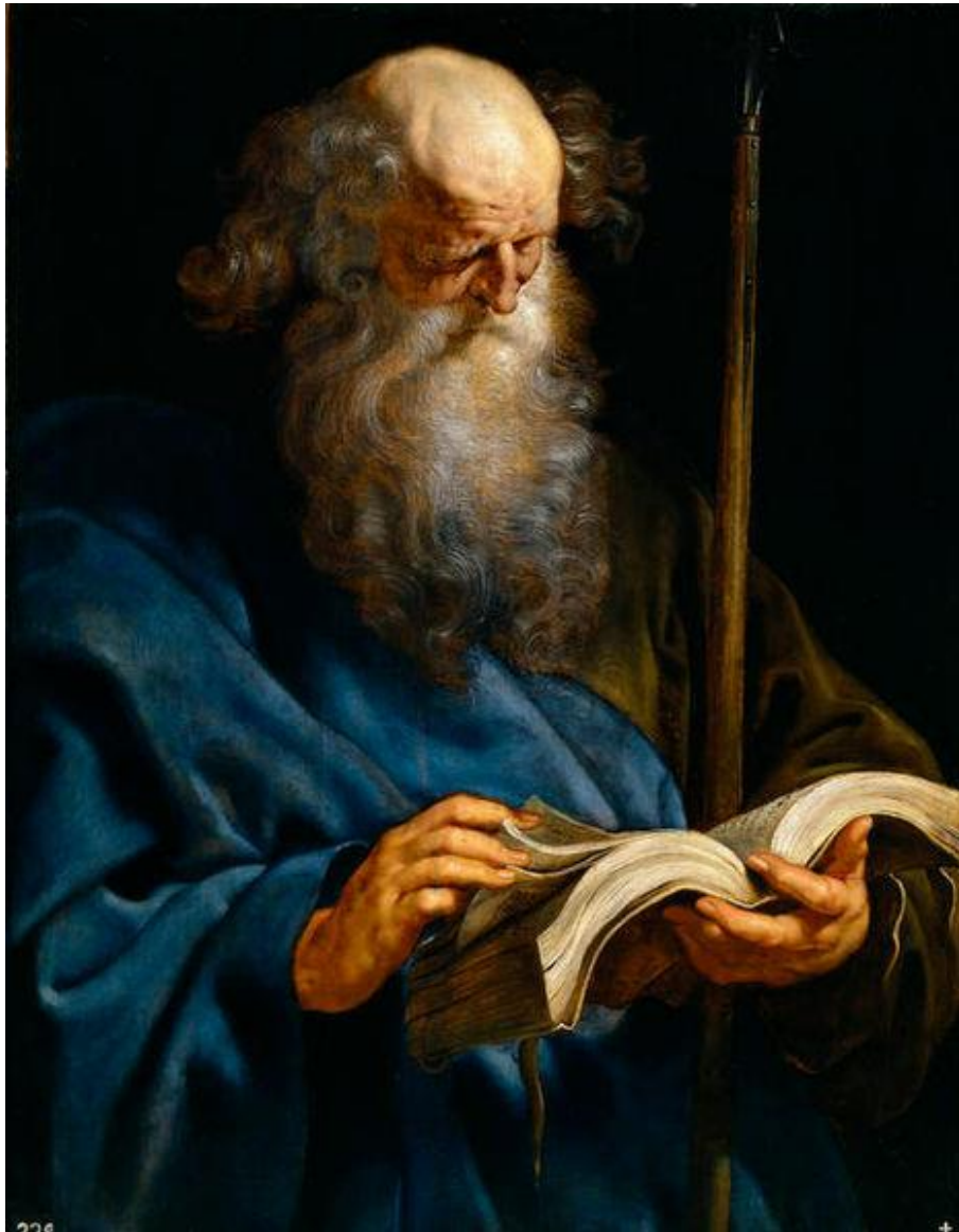
P. P. Rubens: Apoštol Juda Tadeáš (1612-1613)