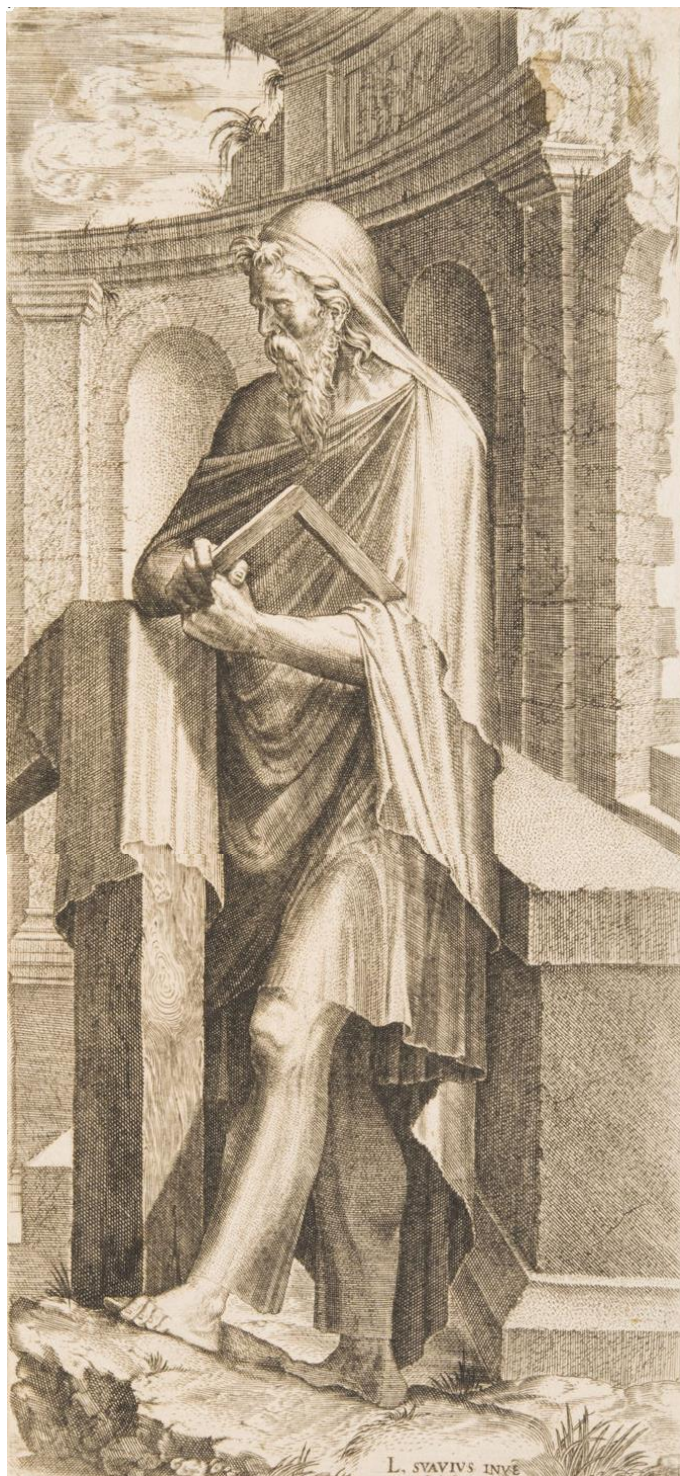
L. Suavius: Sv. Júda Tadeáš (16.st.)