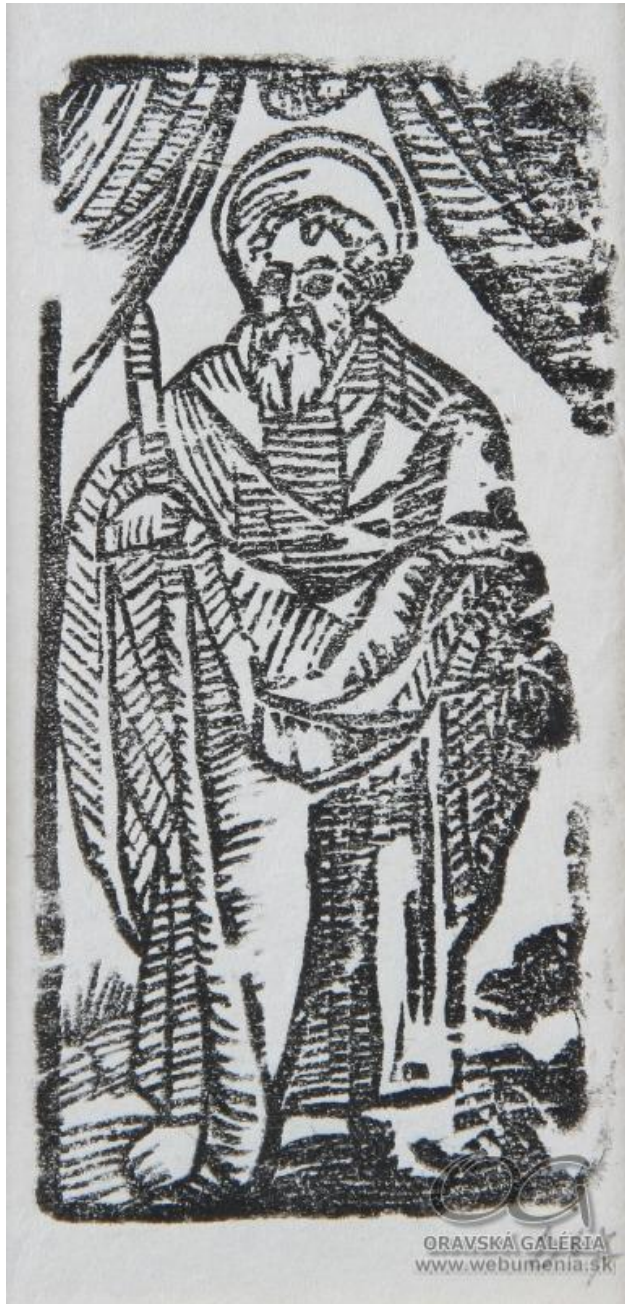
Neznámy autor: Juda Tadeáš (drevorez, 1701-1800)