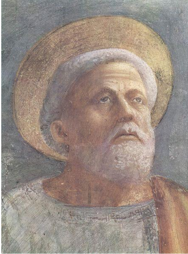
Masaccio: Juda Tadeáš (freska, 15.st.)