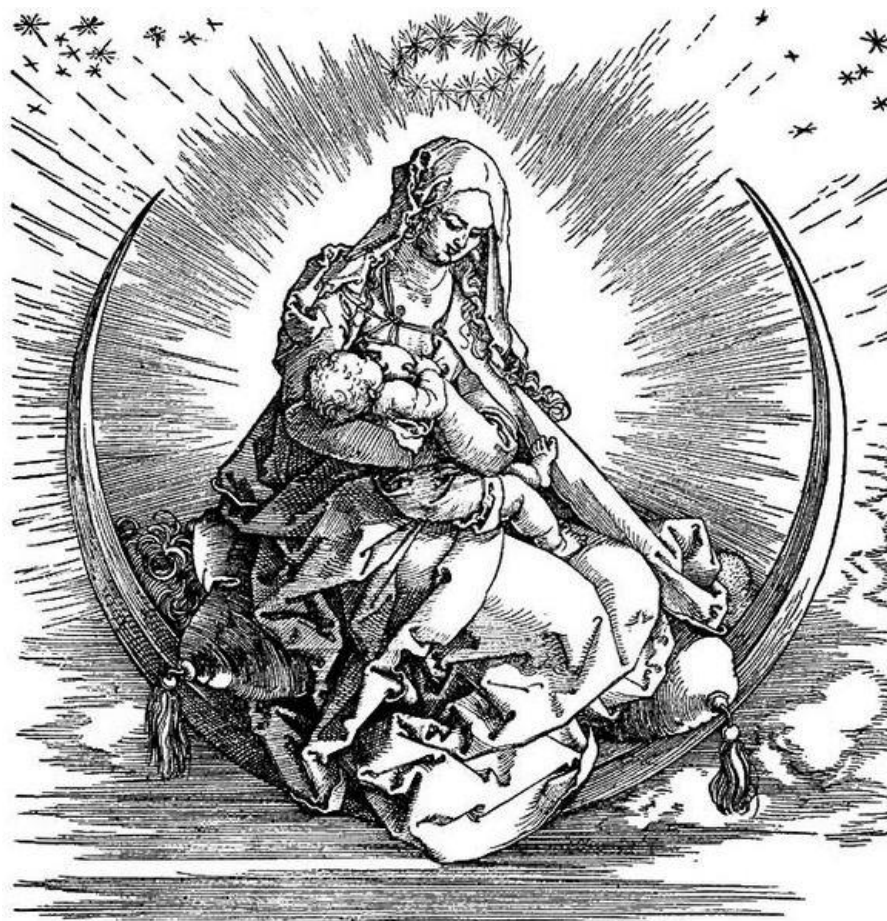
A. Dürer: Život Panny Márie (titulná strana v knižnej podobe, pred 1511)