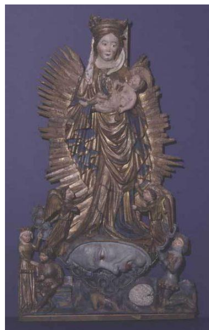
M. Hasse: Apokalyptická madona (drevený reliéf oltára v Uusikaupunki, Fínsko, 1430)