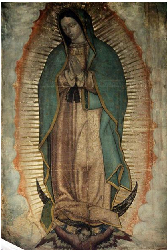
Panna Mária Guadalupská (16.st.)