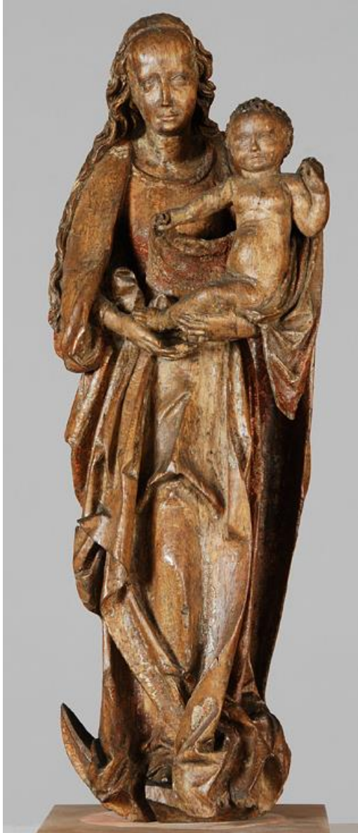
Neznámy rezbár (pôvodne Slovenský majster z konca 15.storočia): Madona z Kremnice (apokalyptická madona, pôvodne súčasť oltára z Kremnice 1490)