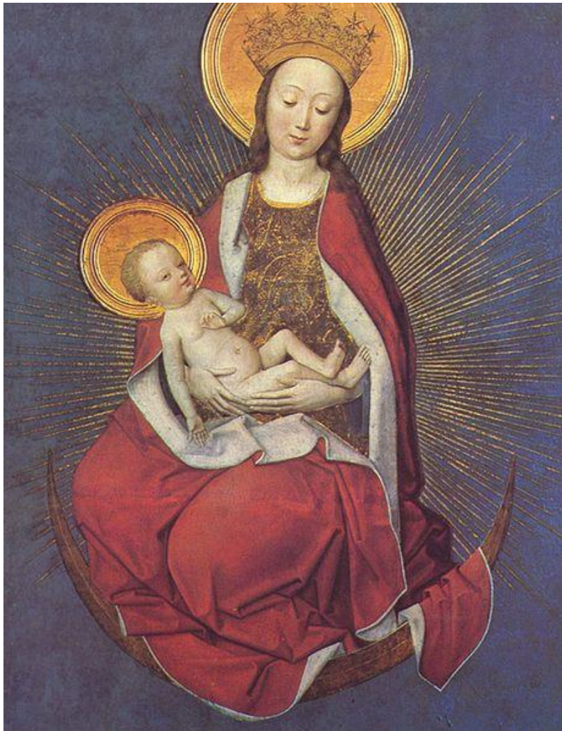
Majster života Panny Márie: Madona na kosáčiku mesiaca (apokalyptická madona, 1460-1480)

http://fi.wikipedia.org/wiki/Apokalyptinen_madonna