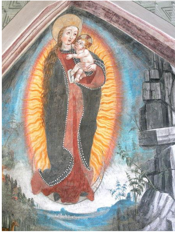
Majster Vasilij Poznanskij: Požehnané nebo (1682)