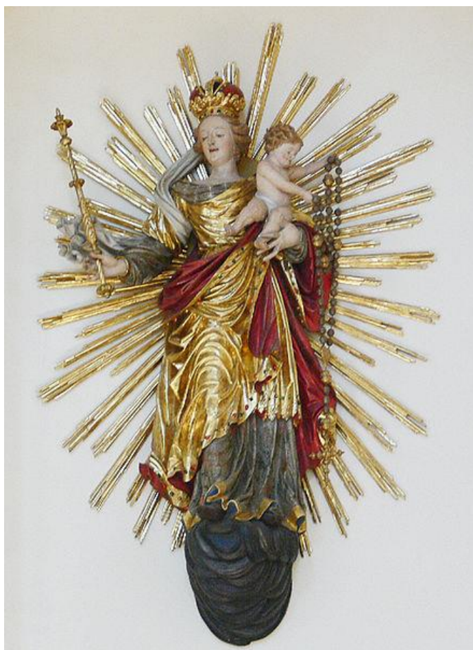
Madona v svätožiare (kostol sv. Petra, Schwarzwald, Nemecko, 1670)