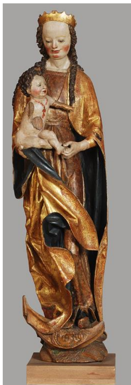
Slovenský rezbár zo začiatku 16.storočia, Majster Madony z Krížovej Vsi: Madona s Ježiškom na polmesiaci z Krížovej Vsi (apokalyptická madona, 1500-1510)