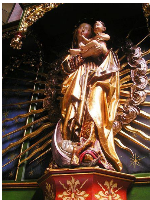
G. Erhart: Madona (Überlingenský kláštor v južnom Nemecku, 1510)