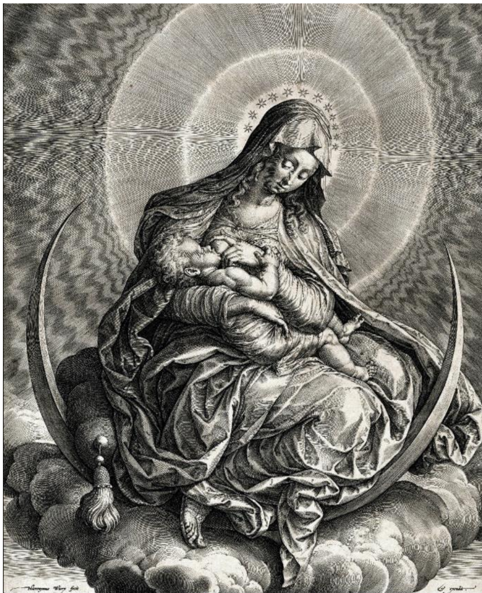
H. Wierix: Panna a dieťa na kosáčika mesiaca (apokalyptická madona, 1600)