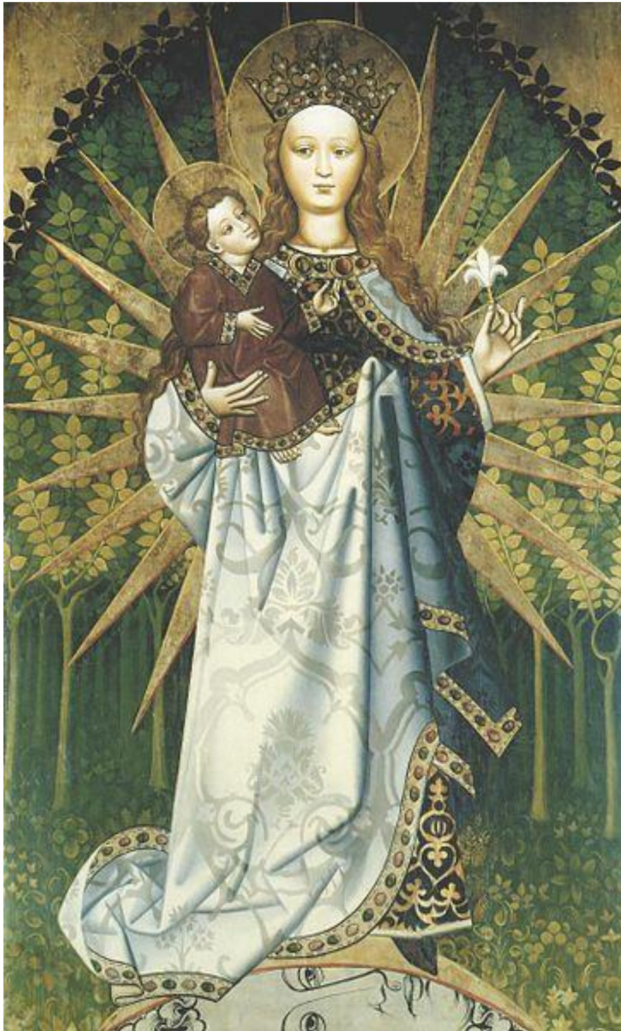
Anonym: Madona oblečená do slnečného svetla (1450-1460)