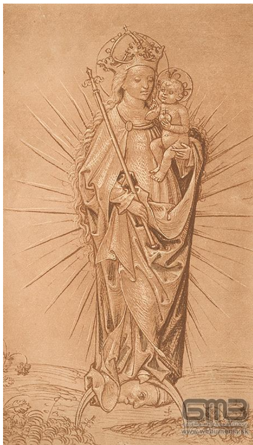
Stredoeurópsky grafik zo 16.storočia: Mária s dieťaťom (1510-1525)