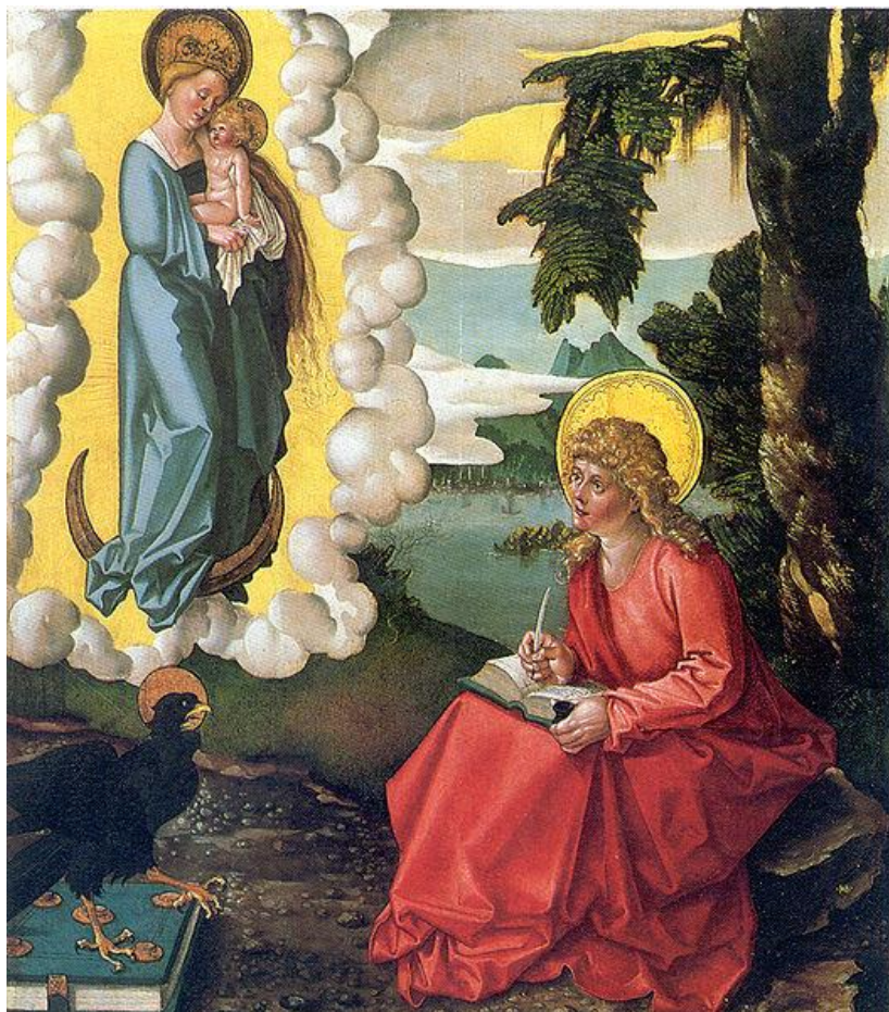
H. Baldung Grien: Videnie sv. Jána (1511)