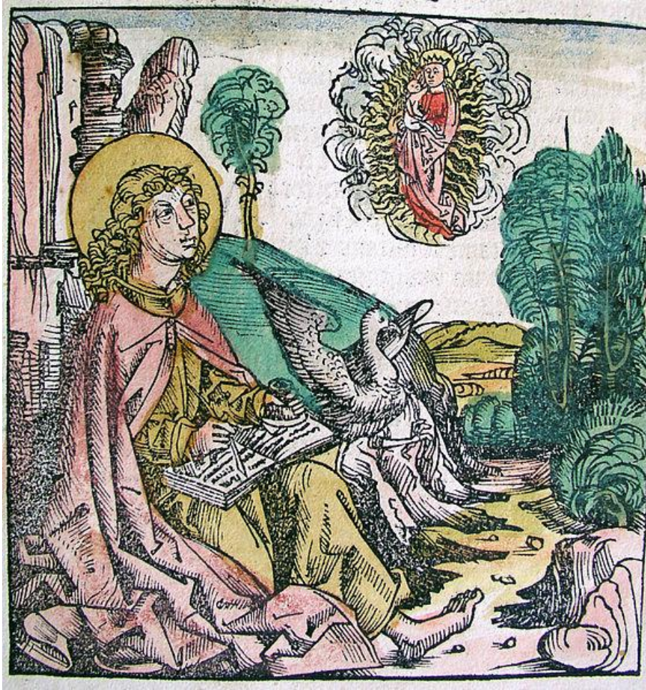
H. Schedel (tlač): Sv. Ján Evanjelista (Norimberská kronika, 1440-1514)