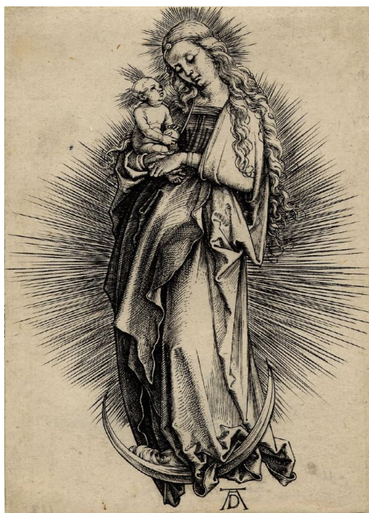
A. Dürer: Panna Mária s Ježišom stojaca na polmesiaci (medirytina, 1498-1500)