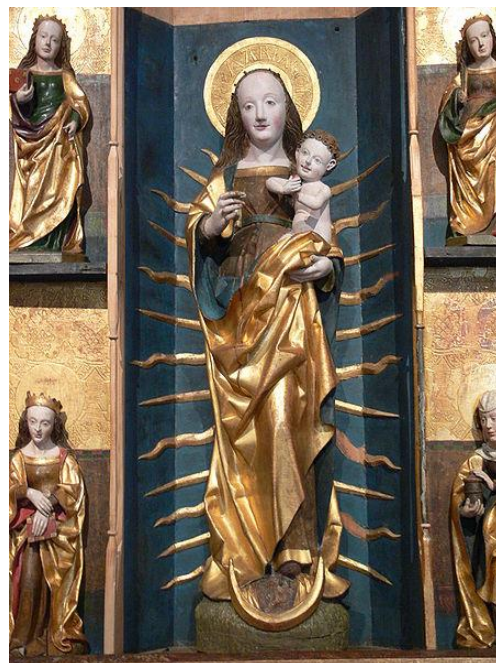
Panna Mária na kosáčiku mesiaca (kostol Saint Martin, 1400)