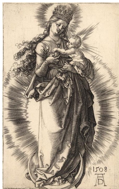
A. Dürer: Panna na kosáčiku s korunou hviezd (medirytina, 1508)