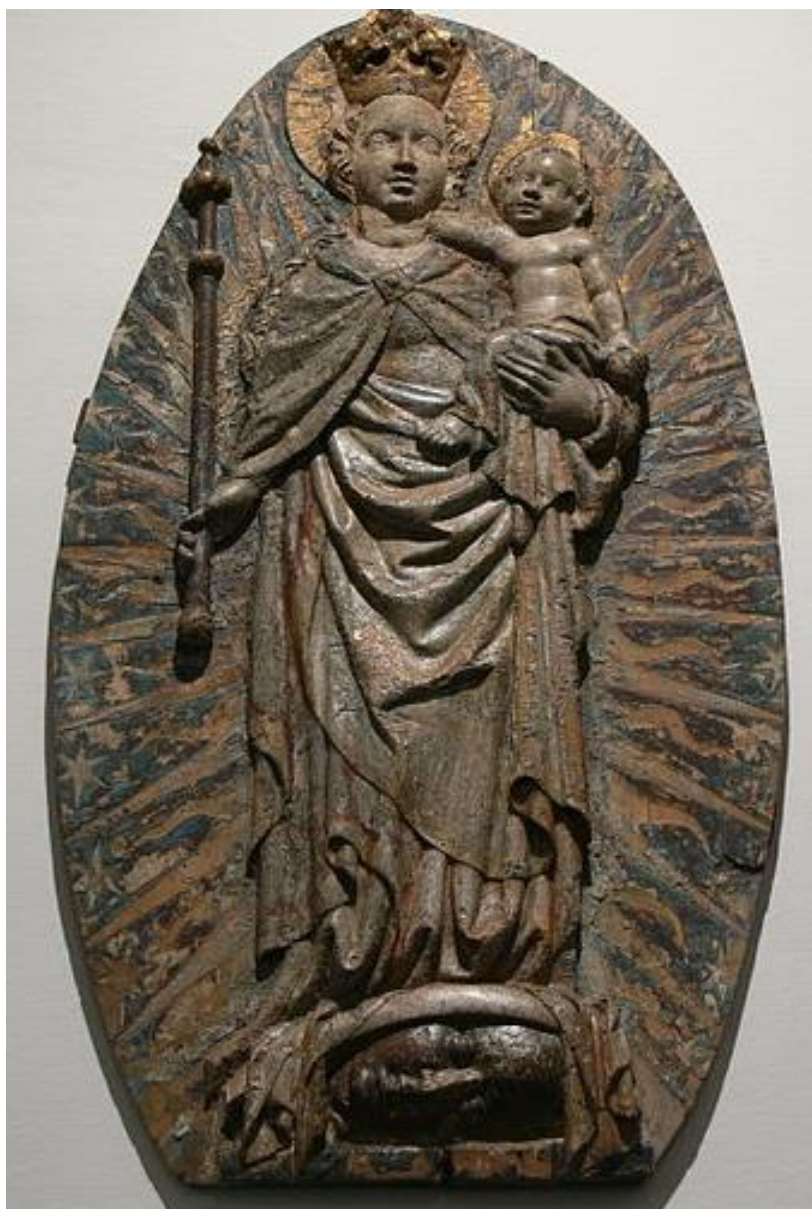
Madona na kosáčku mesiaca (apokalyptická madona, reliéf, Passau, Rakúsko, 1420)