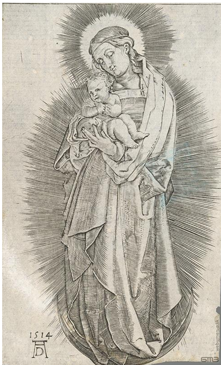
A. Dürer: Madona s Dieťaťom (1514)