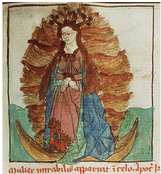
Apokalyptická žena (Hortus deliciarum, 12.st.)