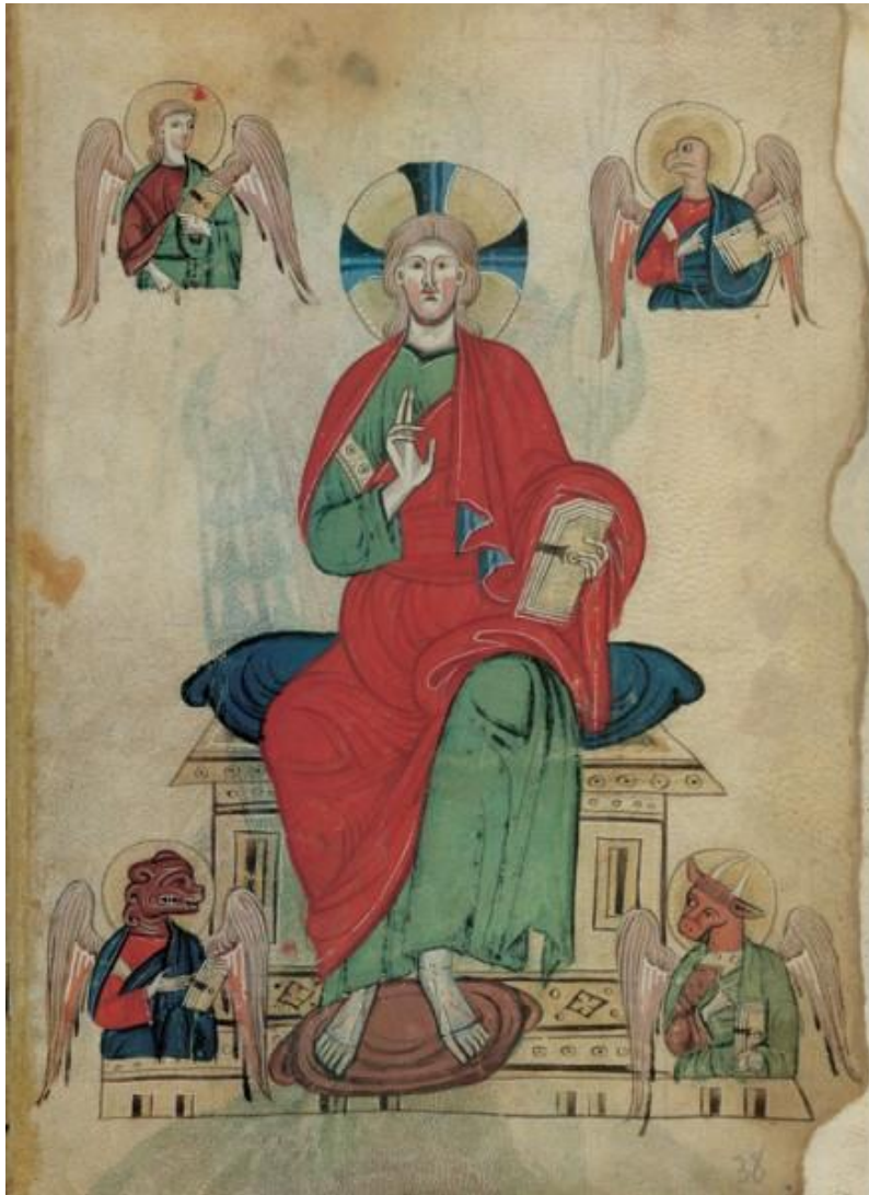
Žehnajúci Kristus s evanjelistami ako apokalyptickými bytosťami (Modlitba k Panne Márii, 2.pol. 13.t.)