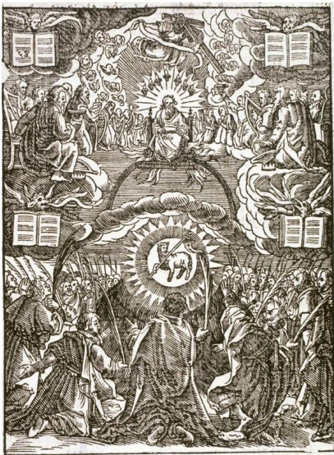
Ch. van Sichem II : Množstvo z veľkého súženia (drevoryt, 1657)

Apokalyptické bytosti (Zjavenie Jána) - alternatívny názov pre námiet Videnie apokalyptických bytostí