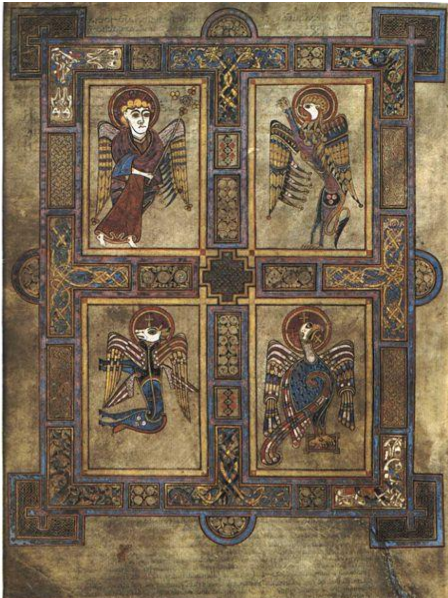
Tetramorf (Book of Kells, 8.-9.st.)

Hall v súvislosti s heslom Štyria evanjelisti : prvotná kresťanská cirkev, ktorá hojne využívala symbolické predstavy (pretrvávajúca židovská a orientálna tradícia), zobrazovala niekedy evanjelistov ako štyri okrídlené bytosti; zdrojom tohto spôsobu zobrazovania bol úryvok Ezechiela (1,5-14), kde prorok hovorí o svojom videní štyroch bytostí; Zjavenie opisuje podobné bytosti, ktoré obklopujú Boží trón; sú preto obecné známe ako apokalyptické bytosti a už skoro začali symbolizovať štyroch evanjelistov; stredovekí komentátori pre to hľadali a našli „vysvetlenie“, ukryté v samotných evanجليách: Matúša predstavuje človek (s krídlami), pretože jeho evanjelium začína Kristovým rodokmeňom ; Marek začína svoje evanjelium postavou Jána Krstiteľa , ktorý je „hlas volajúci na púšti“ ( Marek 1,3 ); komentátori v tom videli narážku na leva ; vôl/býk , ktorý symbolizuje Lukáša , je obetné zviera a obeťou kňaza Zachariáša začína Lukášove evanjelium (vôl preto, lebo býk bol zakázané obetné zviera Židov); orol bol symbolom Jána Evanjelistu , lebo tento vták vzlietne najvyššie zo všetkých vtákov k nebesiam; Evanjelium Jánovo bolo odlišné od ostatných (pozri synoptické evanjeliá ) a najprenikavejšie pochopilo Božie úmysly