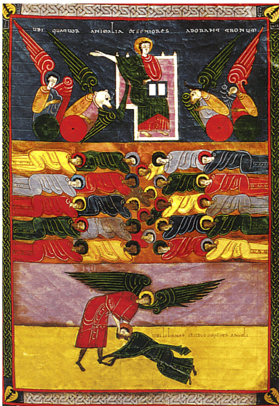
(19,1-21. Posledné veci na konci sveta). Oslava Boha na nebi (horný a stredný pás). (Beatus Facundus, 1047)