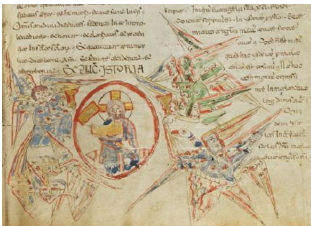
(4,2-8. Oslava Boha stvoriteľa. Videnie štyroch apokalyptických bytostí). Kristus a štyri šelmy. Majestas Domini (Beatus Ginevra, 1047)