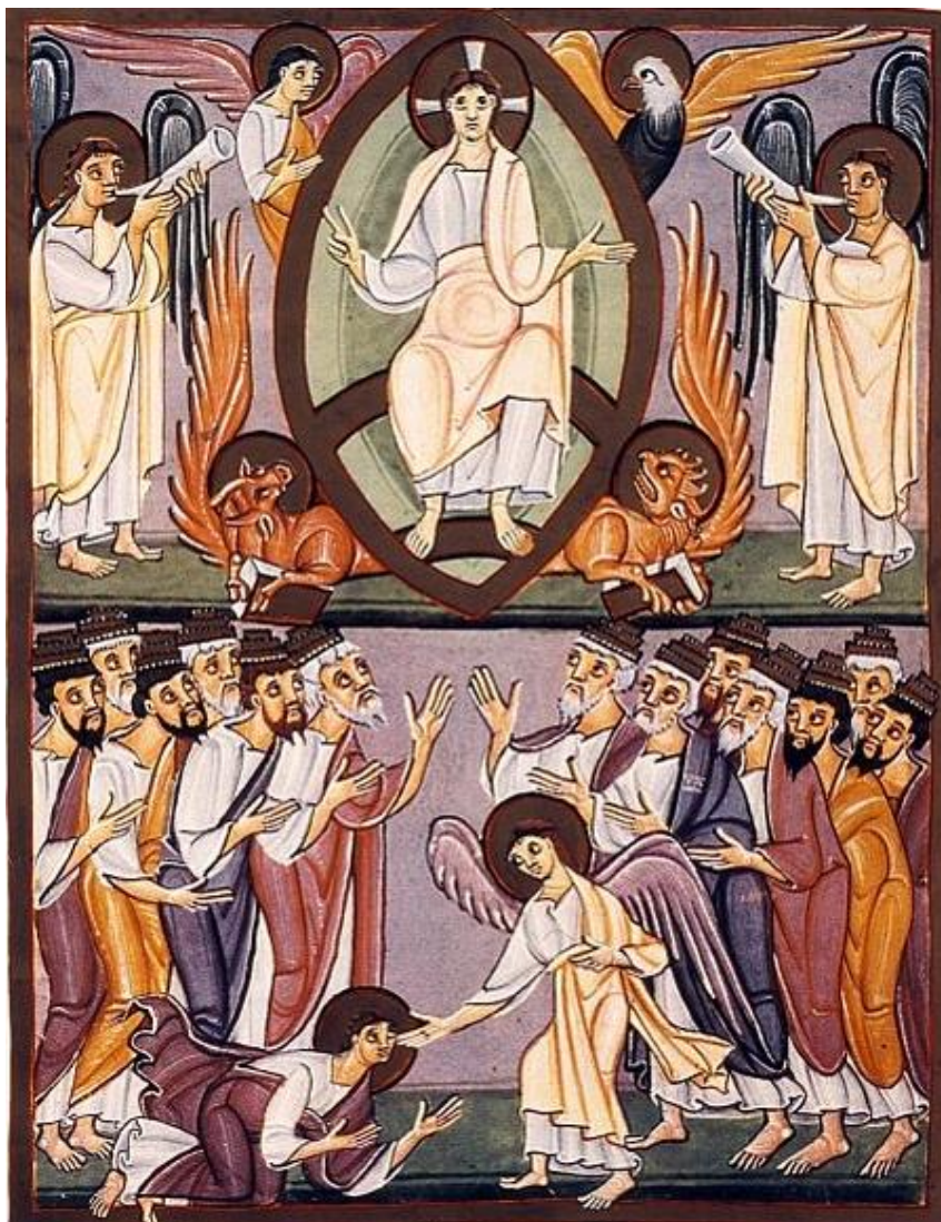
(19,1-21. Posledné veci na konci sveta). Oslava Boha na nebi (Bamberská apokalypsa, 1000-1020)