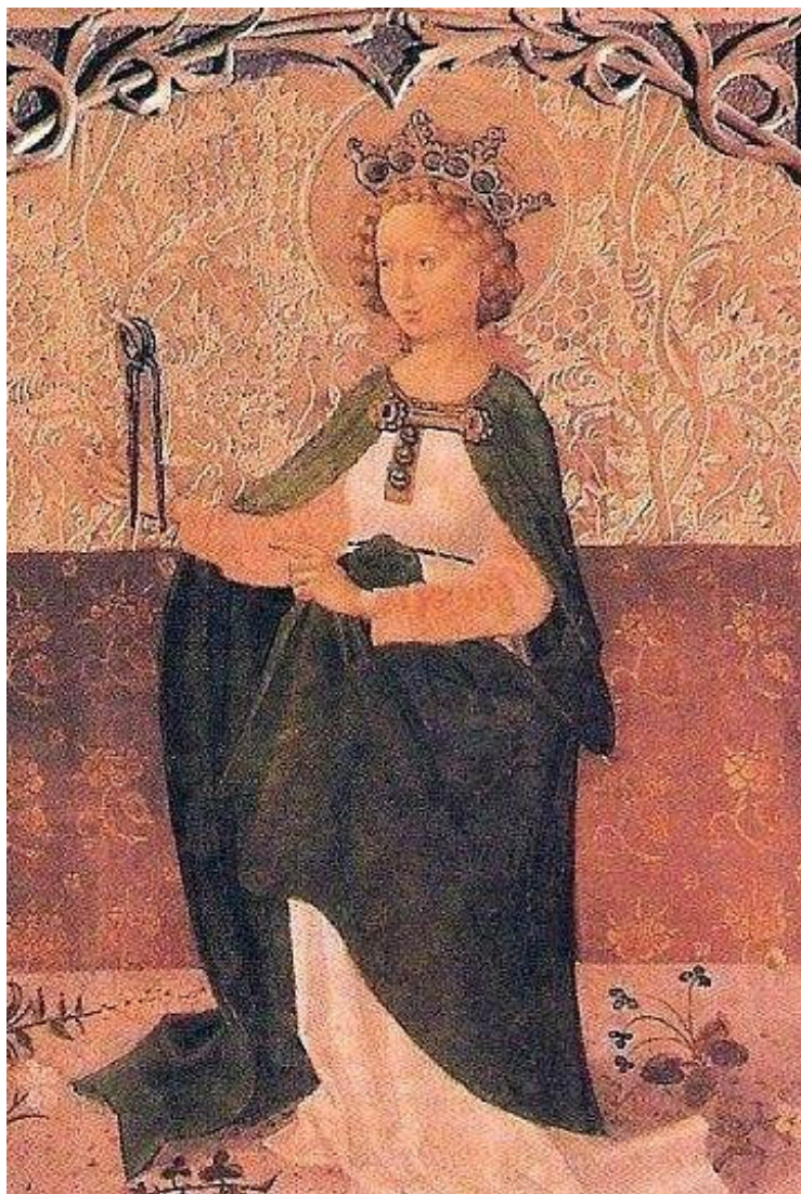
Autor neuvodený: Sv. Apolónia