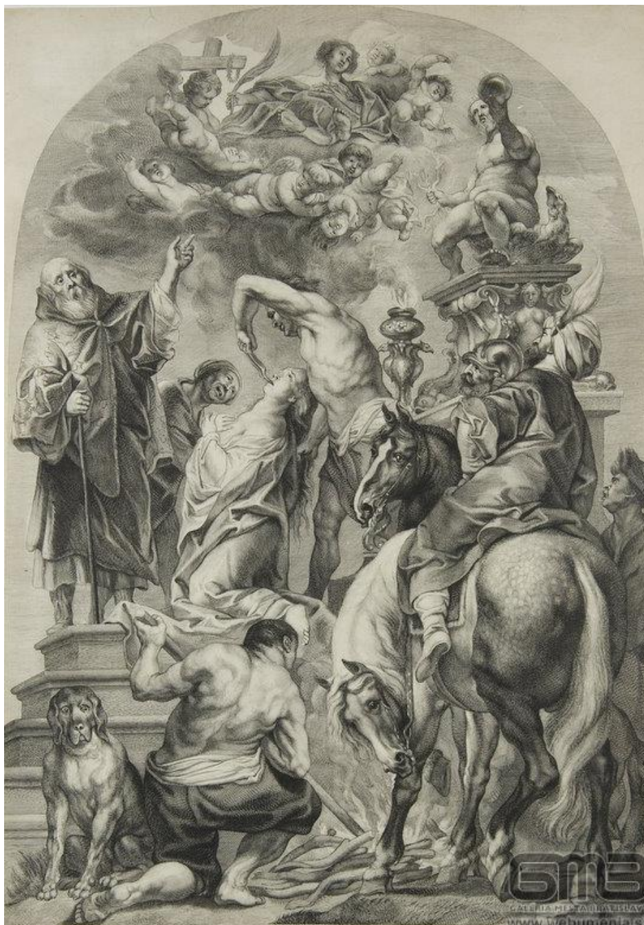
Autor nevedený: Mučenie sv. Apolónie (1628-1678)