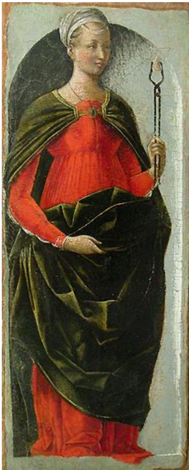
D. de' Roberti: Sv. Apolónia (1472-1473)

Apollinaire Guillaume /apolinér žijón - (†1918); francúzsky básnik a dramatik; autor názvu literárneho smeru surrealizmus ; zakladateľ modernej francúzskej poézie; pozri konkrétne poézia ; kubizmus orfický