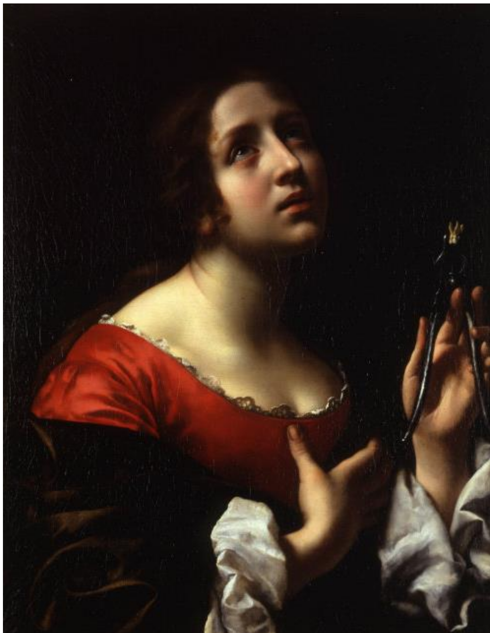
C. Dolci: Svätá Apolónia (1670)