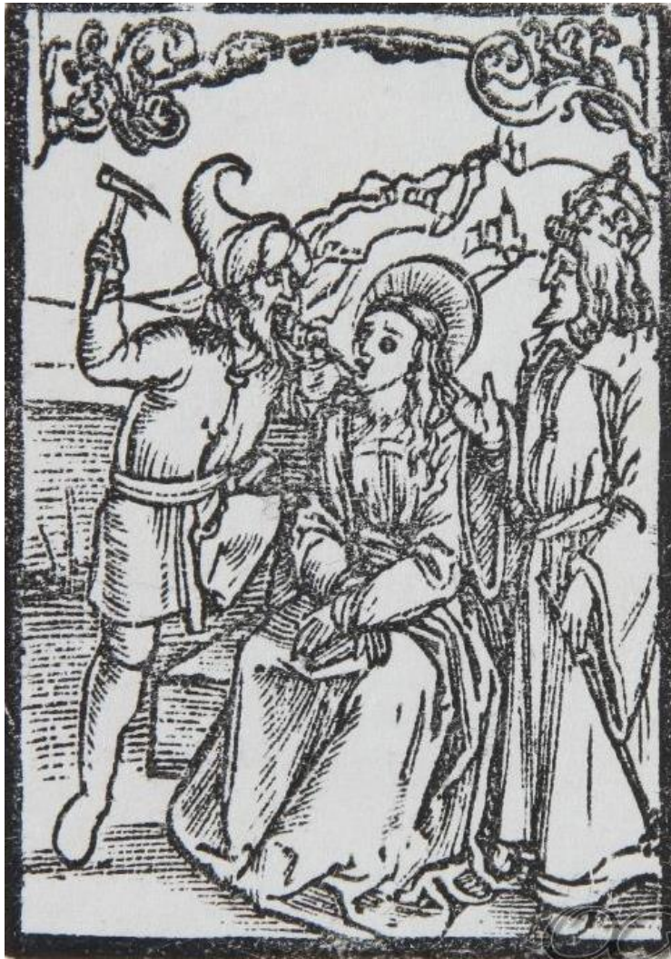
Neznámy autor: Sv. Apolónia (drevoryt, 1501-1541)