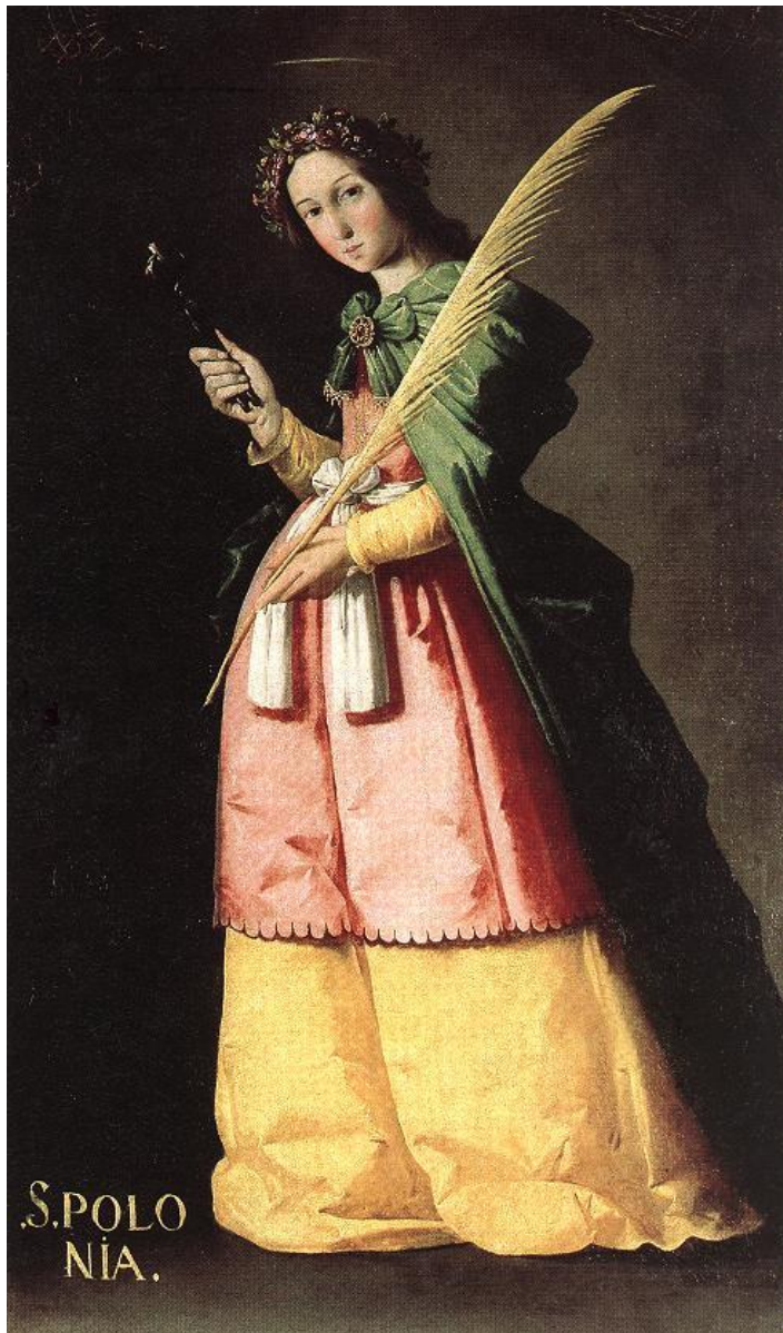
F. de Zurbarán: Sv. Apolónia (1636)