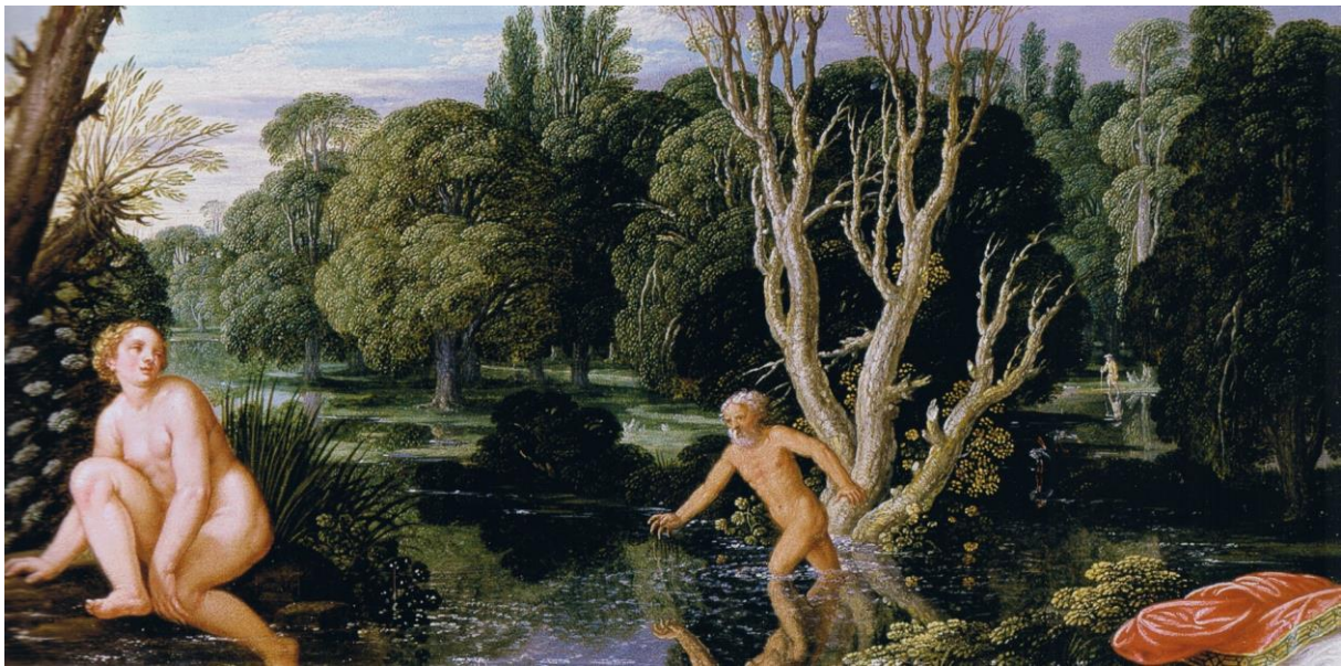
J. König: Alpheus a Aretusa (1610)

https://www.google.sk/search?q=Arethusa&espy=2&biw=1844&bih=995&tbm=isch&tbo=u&source=univ&sa=X&ved=0CEMQsARqFQoTCNL0_oLX18cCFUTpFAodsf0A8g&dpr=1