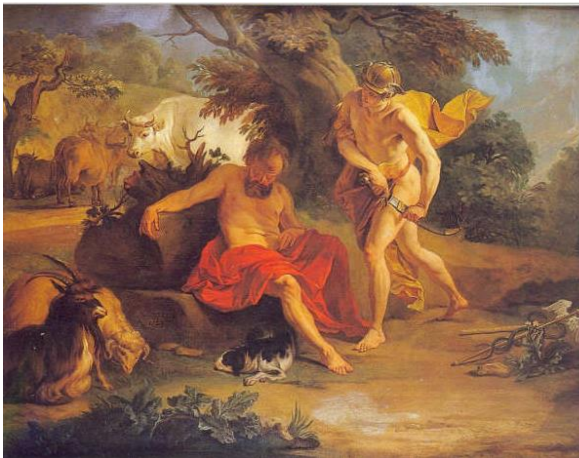
N.-N. Coypel: Merkúr a Argus (18.st.)

Argo (lodʹ) - v gréckej mytológii loď vodcu Argonautov - Iásona , na ktorej podnikol výpravu za zlatým rúnom do Kolchidy ; pod ňou opustený Iáson našiel svoju smrť; po všetkých dobrodružstvách bola vynesená medzi hviezdy ; pozri metamorfóza