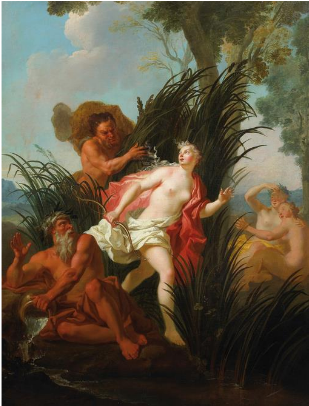
A. Coypel: Alfeios prenasleduje Aretusu (17.-18.st.)