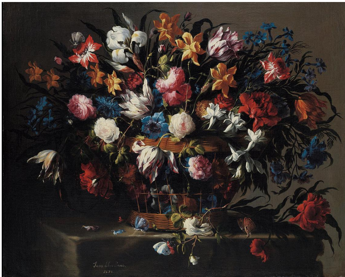
J. de Arellano: Malý košík kvetín (1671)

aréna - 1.miesto v rímskom cirku vysypané pieskom a obkolesené stupňujúcim sa hľadiskom, pre usporiadanie rôznych zápasov a pretekov; pozri gladiátor , amfiteáter , hipodró m 2.drevené letné otvorené divadlo v predmestskej záhrade