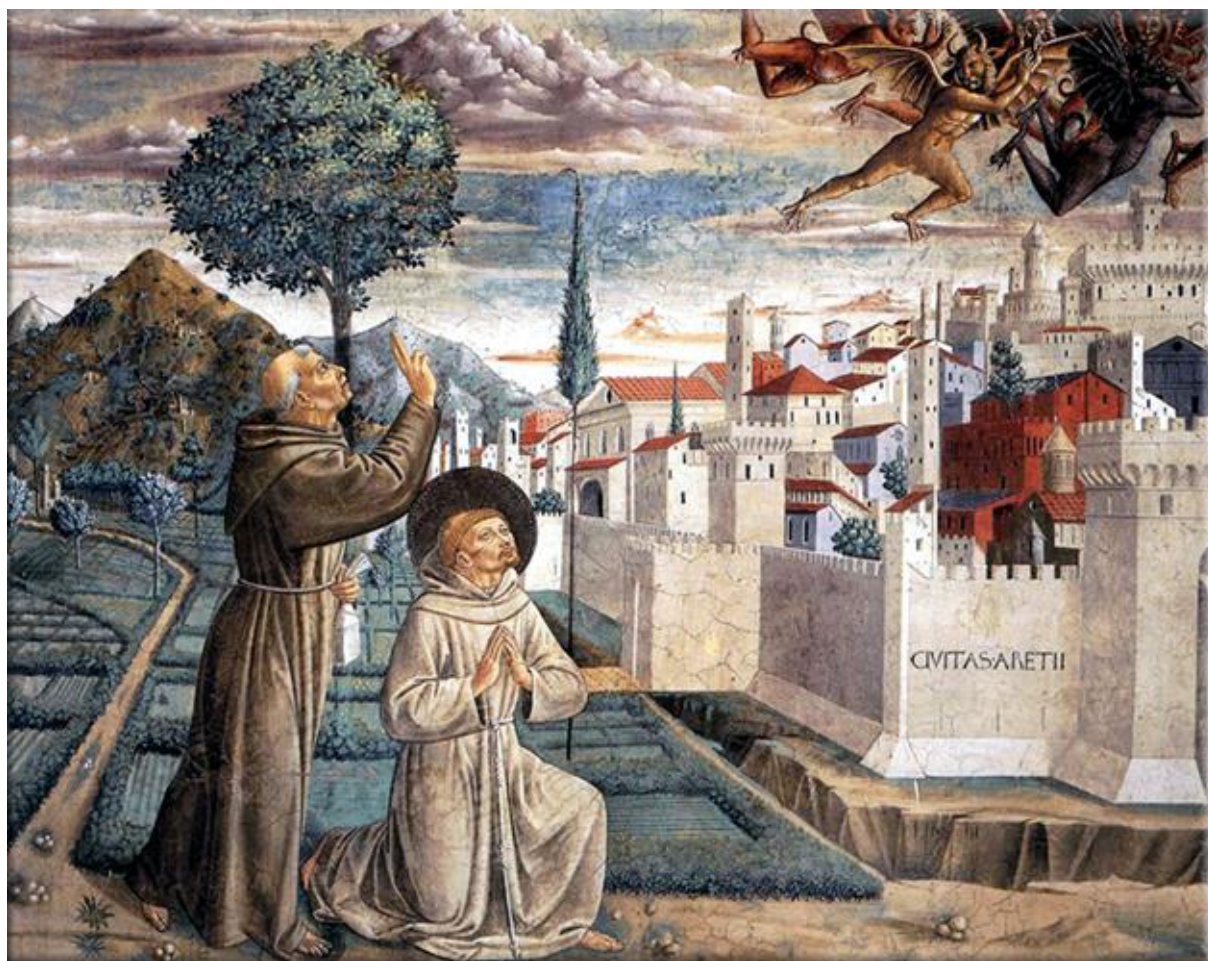
B. Gozzoli: Sv. František vyháňa démonov z Arezza (freska, 1450)

'argaman - hebr. אַרְגָּמָן / argaman; pozri farby v Biblii; agraman