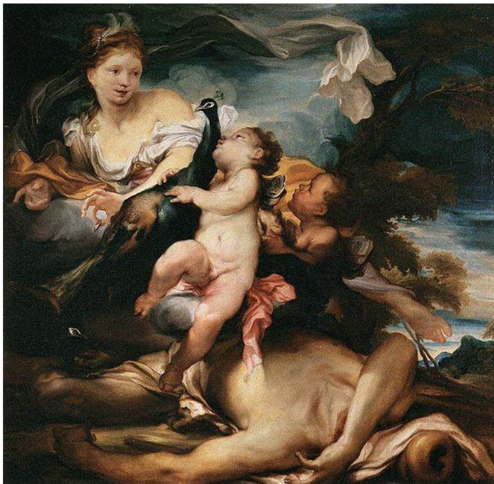
G. De Ferrari: Juno a Argus (1685-1695)