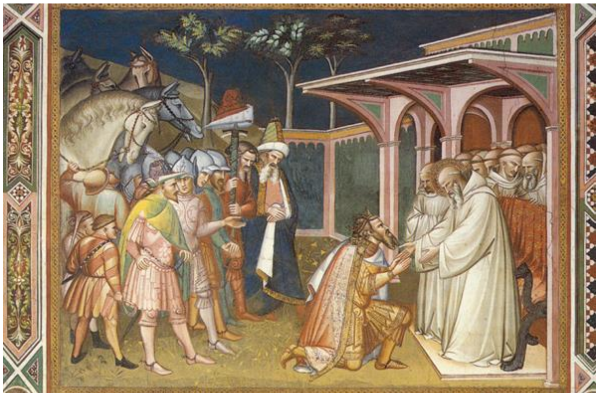
S. Aretin: Totila a sv. Benedikt (freska, S. Miniato al Monte, Florencia, 1387)