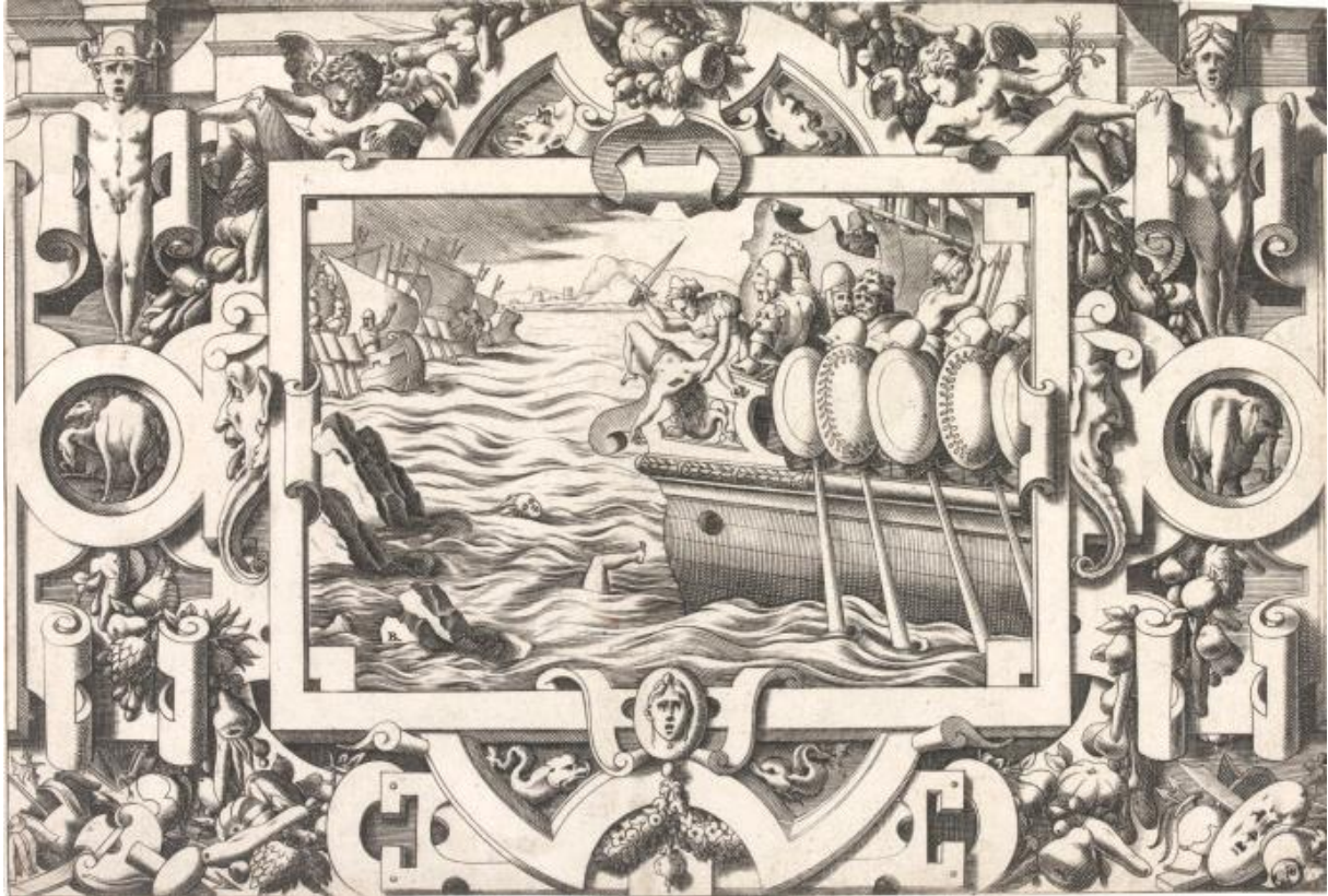
R. Boyvin podľa L. Thiry: Medea zabíja svojho brata Apsyrtu a hádže kusy jeho tela cez palubu (rytina z cyklu Príbeh Jásona a zlatého rúna , 16.st.)

Argo/Argos (pes) - gréc. Αργος/Argos; v gréckej mytológii ušľachtilý lovecký pes Odysea ; keď sa Odyseus vrátil po dvadsiatich rokoch z Trójskej vojny do Ithaky prezlečený za žobráka , spoznal ho iba Argo; počas neprítomnosti svojho pána sa však z neho stal starý, zanedbaný a zablšený chudák; ako náhle zočil Odysea, dvihol hlavu a zamával chvostom; Odyseus sa nedokázal ovládnuť a zaplakal; Argo čakal veľa rokov, aby mohol v pokoji zomrieť