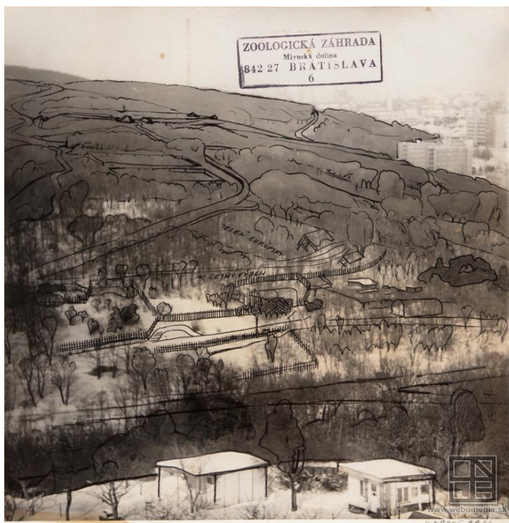
P. Bartoš: Budúci areál ZOO

areál - vymedzená časť územia; pozri architektúra, urbanizmus; architektonický priestor; biotop