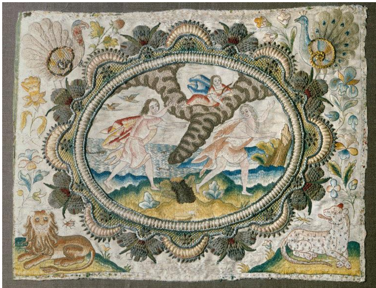
Neznámy autor: Aretusa a Alfeios (výšivka, 1630-1650)