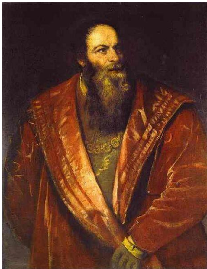
Tizian: Portrét Pietra Arentina (1545)