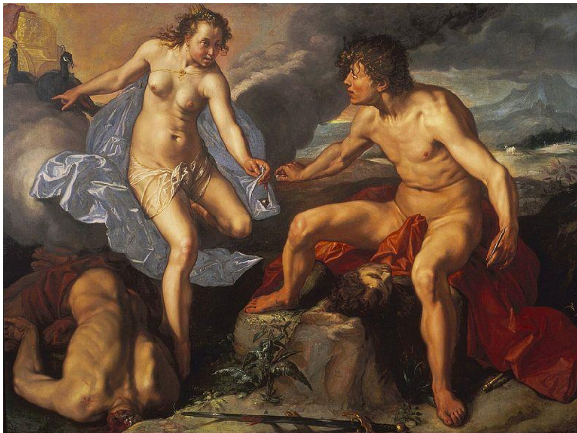
H. Goltzius: Juno obdržala oči Argusa od Merkúra (1615)