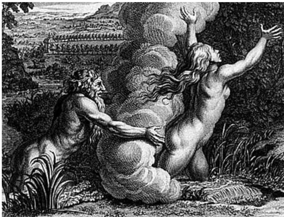
B. Picart: Alfeus s pokúša chytiť Aretusu (rytina, 17.-18.st.)