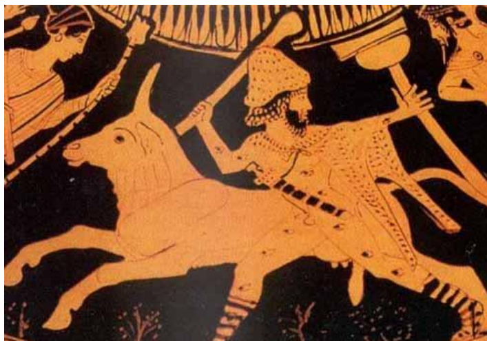
Argus stráži jalovicu (antická keramika)