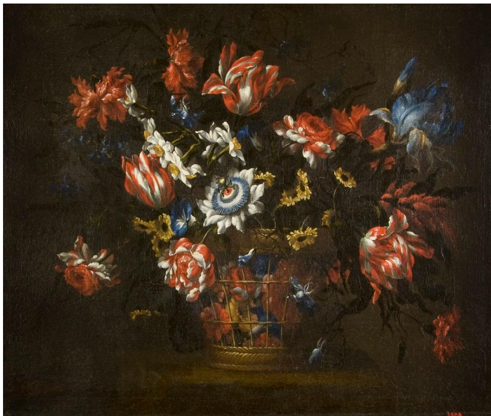
J. de Arellano: Kôš s kvetinami (1676)