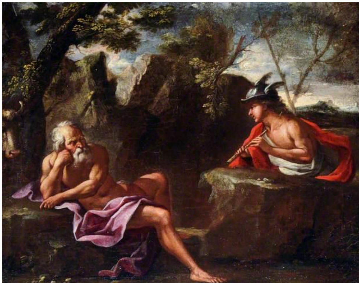
P. F. Mola: Merkúr a Argus (17.st.)