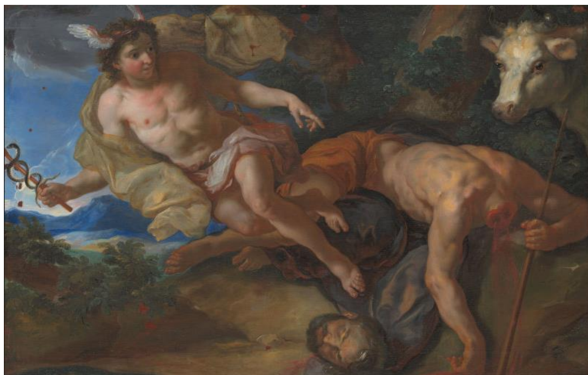
J. M. Rottmayr: Merkúr zachránil Ió s'atím Argusa (1690-1695)