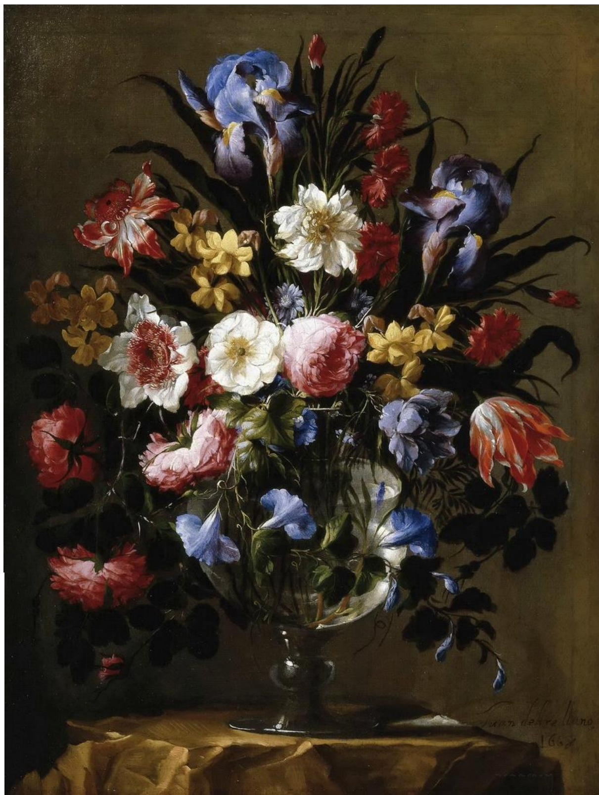
J. de Arellano: Sklená váza s kvetmi (bodegón, 1668)