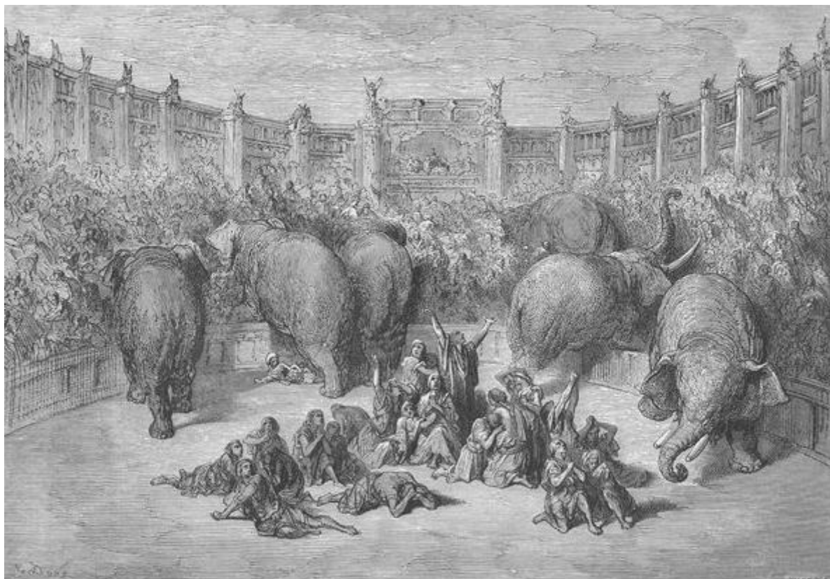
Doré: Zabíjanie Židov v aréne pri Alexandrii (drevoryt, 19.st.)

Aretin Spinello - (1410); taliansky maliar z Arezza , ktorého štýl ovplyvnil vývoj maľby neskorého 14.st. a začiatku 15.st. v Toskánsku