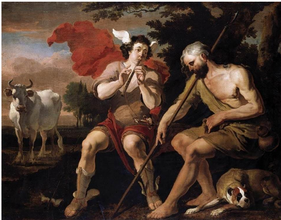
A. D. Hondius: Merkúr a Argus (1691)