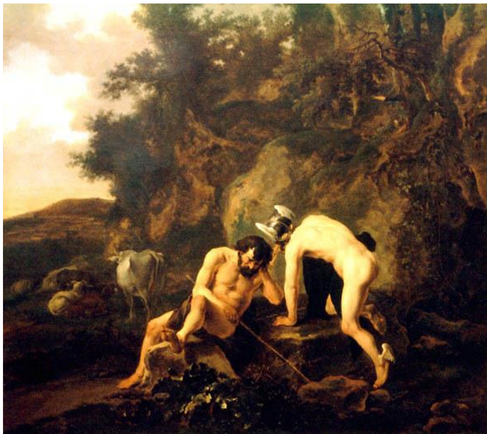
J. Both: Argus vševíduci a Hermes