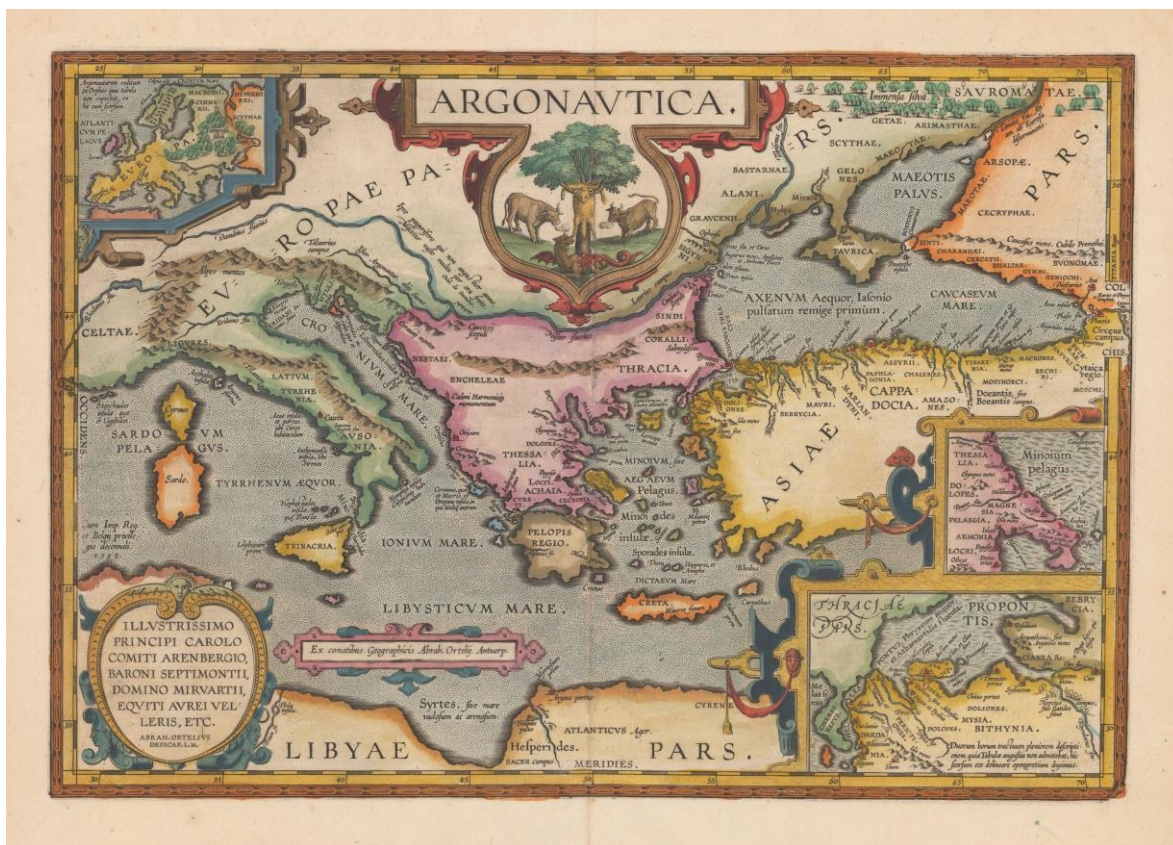
Stredoveká mapa plavby Argonautov