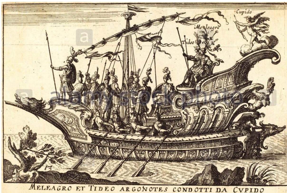
B. Moncornet podľa Remigio Cantagallina: Meleagros s Tideom sa plavia s Argonautami pod vedením Kupida (rytina, lept, 17.st.)