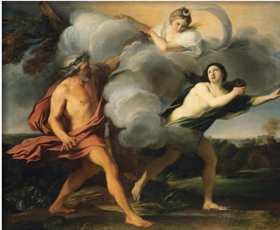
C. Maratta: Alpheus a Arethusa (1655-1657)