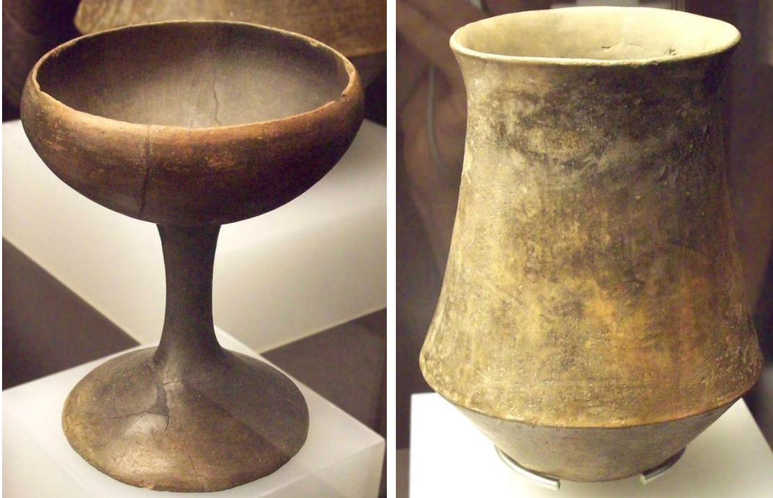
Hlinený pohár (agaritská kultúra, 2200-1500 pr.Kr.)