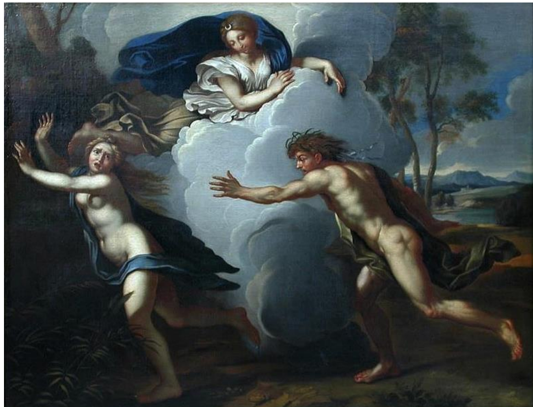
Rímska škola: Alpheus a Arethusa (1640)