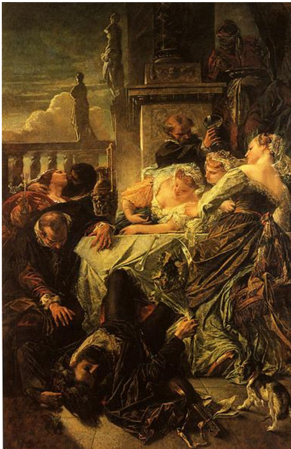
Anselm Feuerbach: Smrt' Arentina (1854)

aretínske nádoby - rímske antické nádoby z červenej hlíny s reliéfnym vzorom ( vajcovec ) vyrábané v 1.st.pred Kr. až 1.st.po Kr. v Arezzu (Toskánsko); odvodené od strieborných nádob; pozri vázové maliarstvo rímske, grécke vázové maliarstvo Arezzo - pozri Taliansko