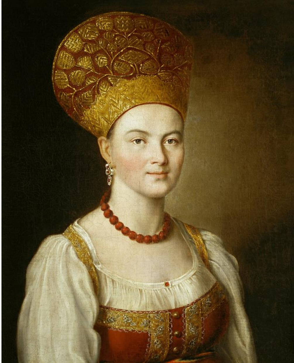
I. P. Argunov: Portrét neznámeho dievčaťa v ruskom odeve (1784)