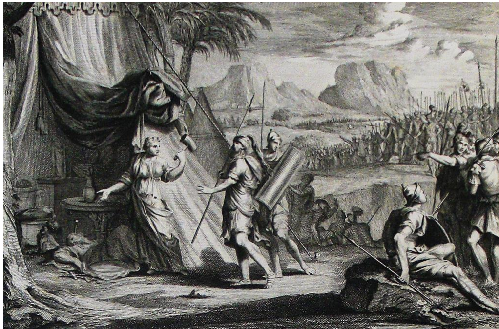
(Kniha sudcov 4,22) Barak nachádza Síseru mŕtveho (grafický list z Philips Medhurst Bible)