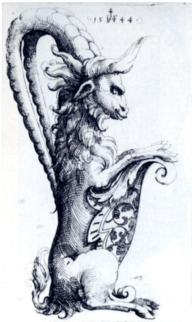
Hirschvogel: Dekoratívny džbán v tvare barana (rytina, 16.st.)

Baran/Škopec/Aries - mesačné znamenie pre marec: 20.3.-20.4.; pozri betlehemska hviezda (Keller)