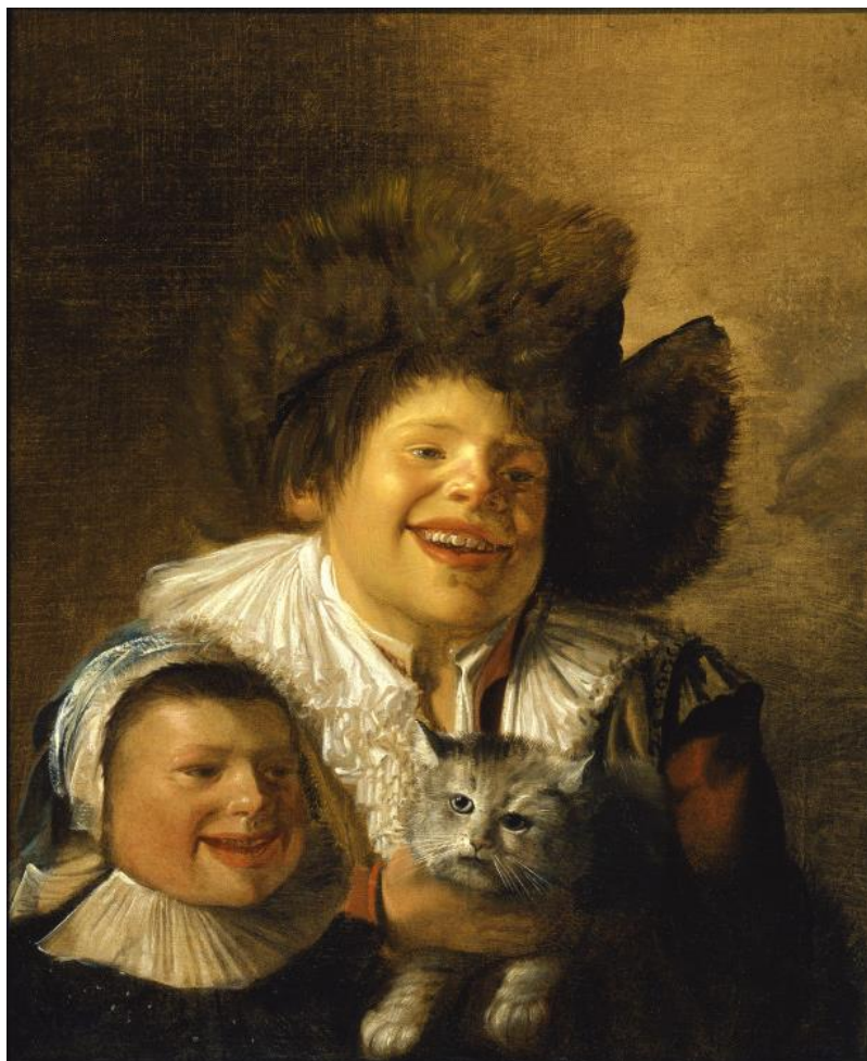
J. M. Molenær: Chlapec s dievčaťom a mačkou (17.st.)