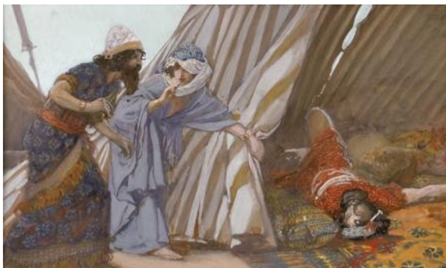
J. J. Tissot: Jael ukazuje Barakovi zabitého Síseru (1896-1902)