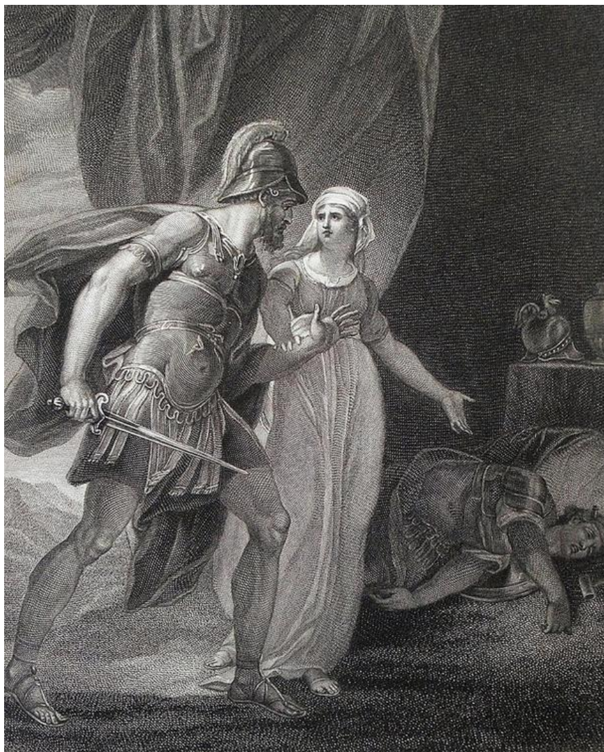
Barak nachádza Síseru mŕtveho (grafický list z Philips Medhurst Bible)