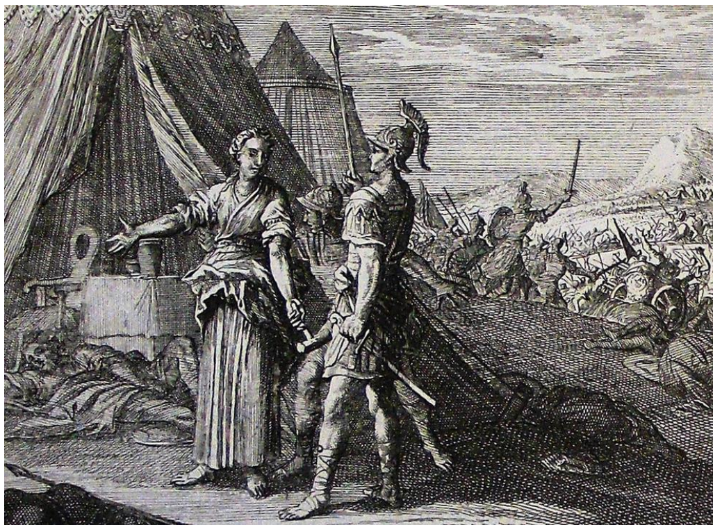
Jael ukazuje Barakovi zabitého Siseru (grafický list z Philips Medhurst Bible)