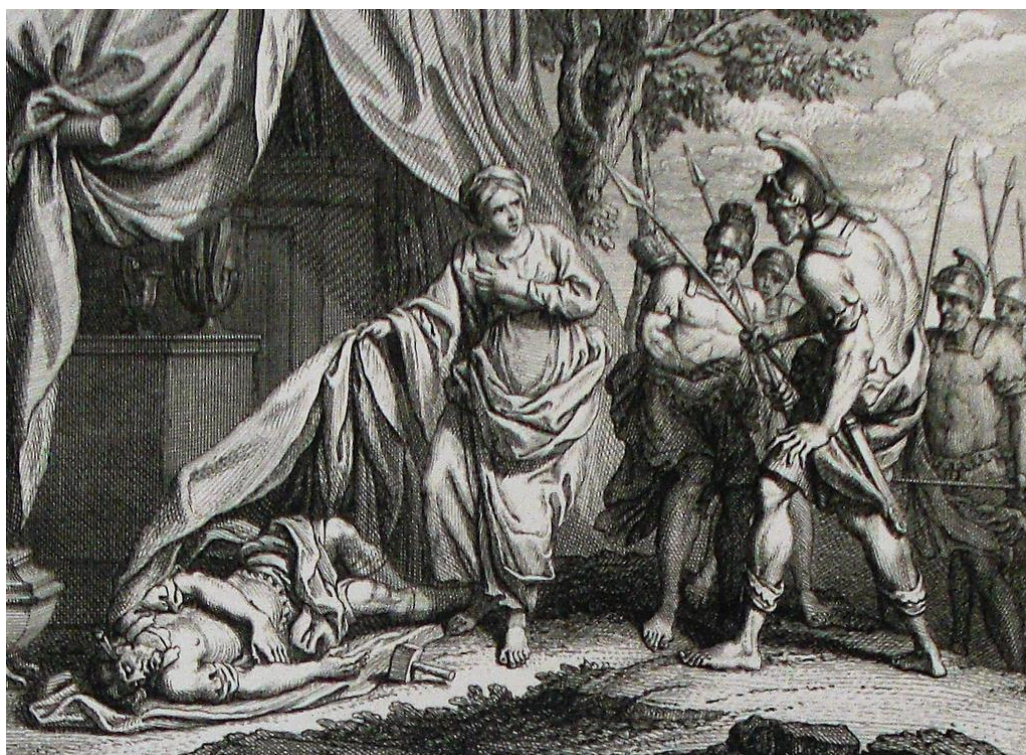
Jael ukazuje Barakovi zabitého Siseru (grafický list z Philips Medhurst Bible)