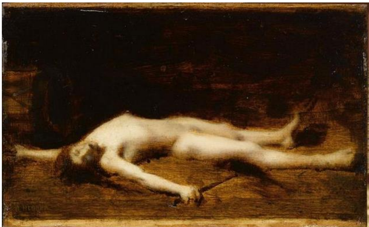
J.- J. Henner: Bara (camaieu brun, 19.st.)