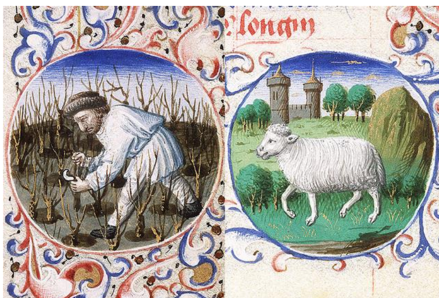
Marec a Baran (stredoveký kalendár)

Baran/Škopec/Aries - mesačné znamenie pre marec: 20.3.-20.4.; pozri betlehemska hviezda (Keller)