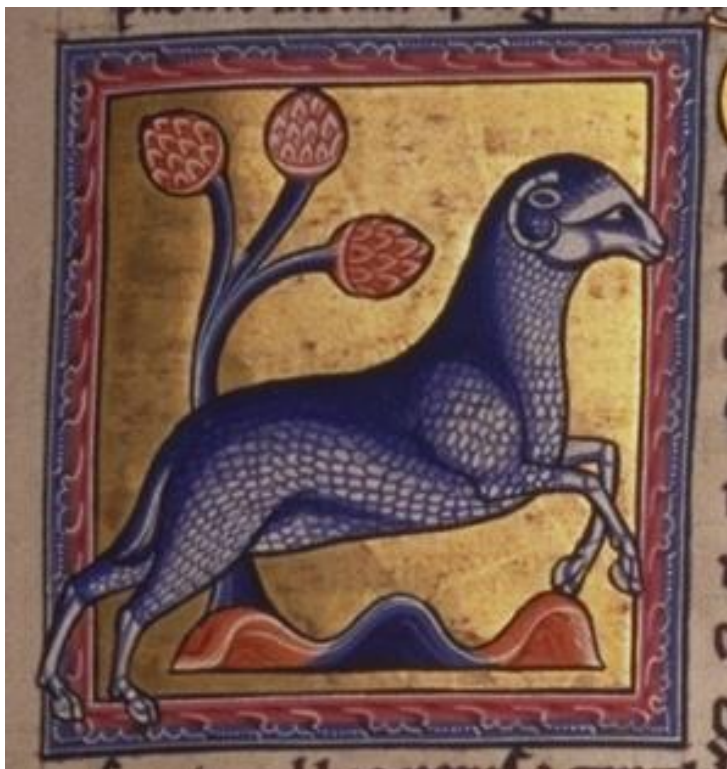
Baran (Aberdenský bestiár, 12.st.)