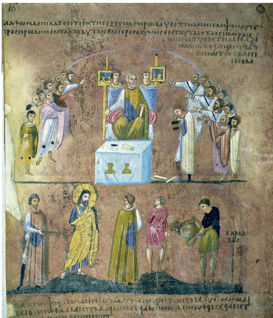
Voľba medzi Ježišom a Barabášom (Codex purpureus Rossanensis, 6.st.)

baraita - aram.; Beliana: zbierky, ktoré neboli pojaté do Mišny , ale v niektorých školách sa aj po jej uzavretí používali naďalej; apokryfná Mišna