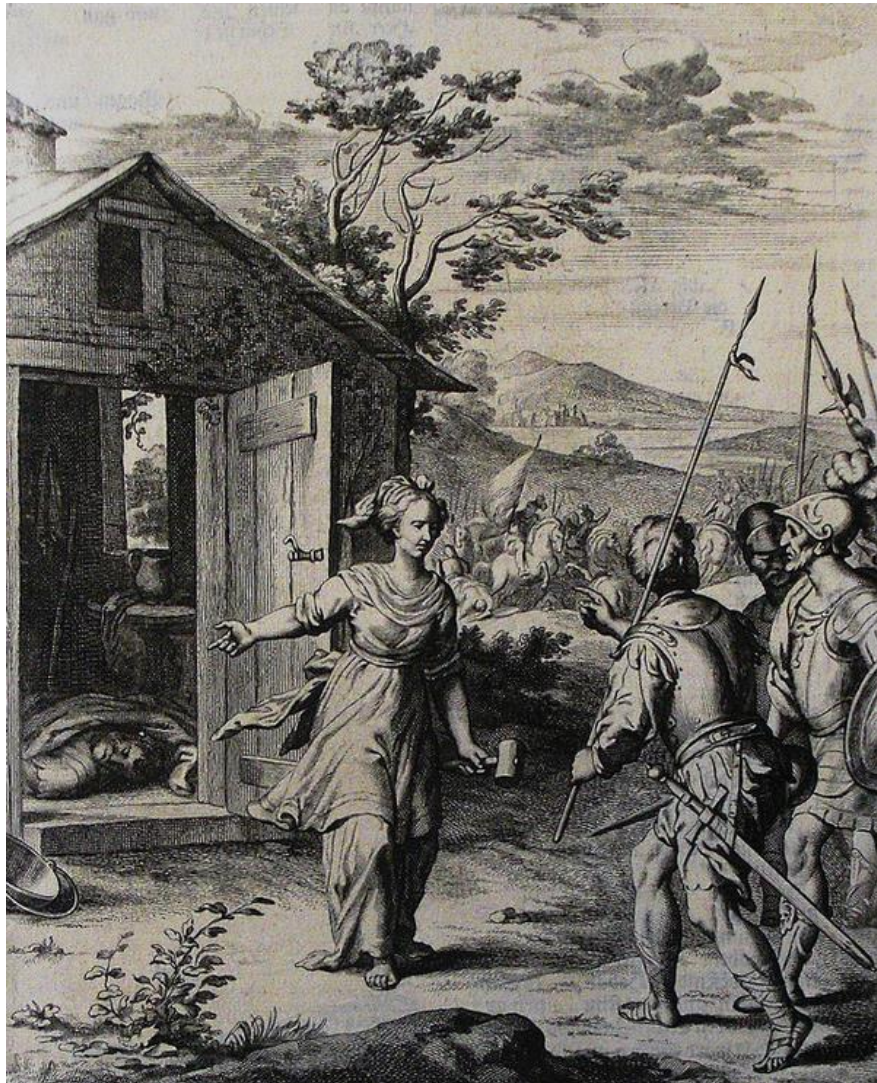
Barak nachádza Síseru mŕtveho (grafický list z Philips Medhurst Bible)