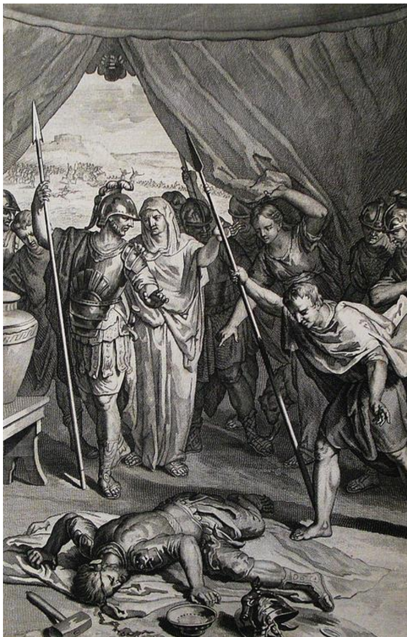
Jael ukazuje Barakovi zabitého Síseru (grafický list z Philips Medhurst Bible)