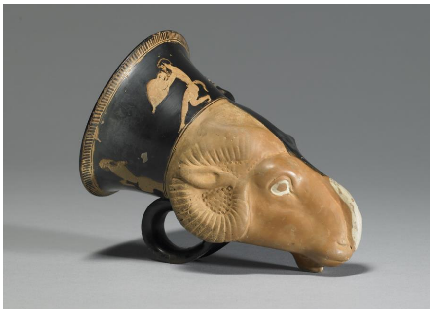
Maliar Sotades: Rython (červeno figurová keramika, 450 pr.Kr.)

-v súvislosti s heslom kalendár grécky : rok rozdelený na 50 týždňov po 7 dňoch (symbolizovaných čriedami kráv a baranov bohýň Faetus a Lampetie )