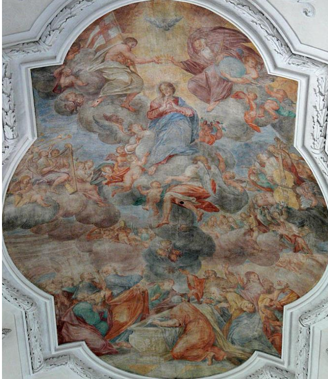
F. A. Giorgioli: Nanebovzatie Panny (freska kostola sv. Petra a Pavla a sv. Trudperta, Baden-Württemberg, Nemecko, 1710)

Giorgioli Francesco Antonio - (†1725); švajčiarsky barokový maliar; tvoril stropné a nástenné fresky a občas oltárne obrazy pre kostoly, najmä v dnešných kantónoch Ticino, Graubünden, Aargau a Lucerno; väčšina jeho diel má námety z biblie alebo života svätých; niekedy sú svätí doplnení vhodnými atribútmi ; jeho fresky sú tvorené tak, aby ladili s architektúrou príslušného kostola, a preto tvoria súčasť barokového Gesamtkunstwerku ; jedným z vrcholov jeho diela sú fresky z bývalého benediktínskeho kláštora kostoly Ragaz (kantón Sankt Gallen, 1692), Muri (Canton Aargau, 1696-1697), Rheinau (kantón Zürich, 1708-1709) a St.Trudpert v Munsteru (okres Breisgau - Čierny les, 1710 a 1716-1722); celkom pracoval na 45 miestach vo Švajčiarsku, Nemecku, Taliansku a Poľsku; pozri švajčiarski maliari barokovi