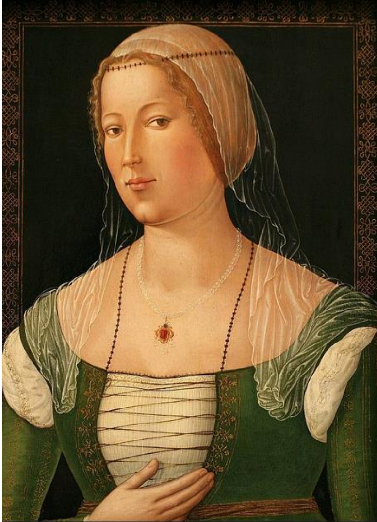
Girolamo di Benvenuto: Portrét mladej ženy (1508)