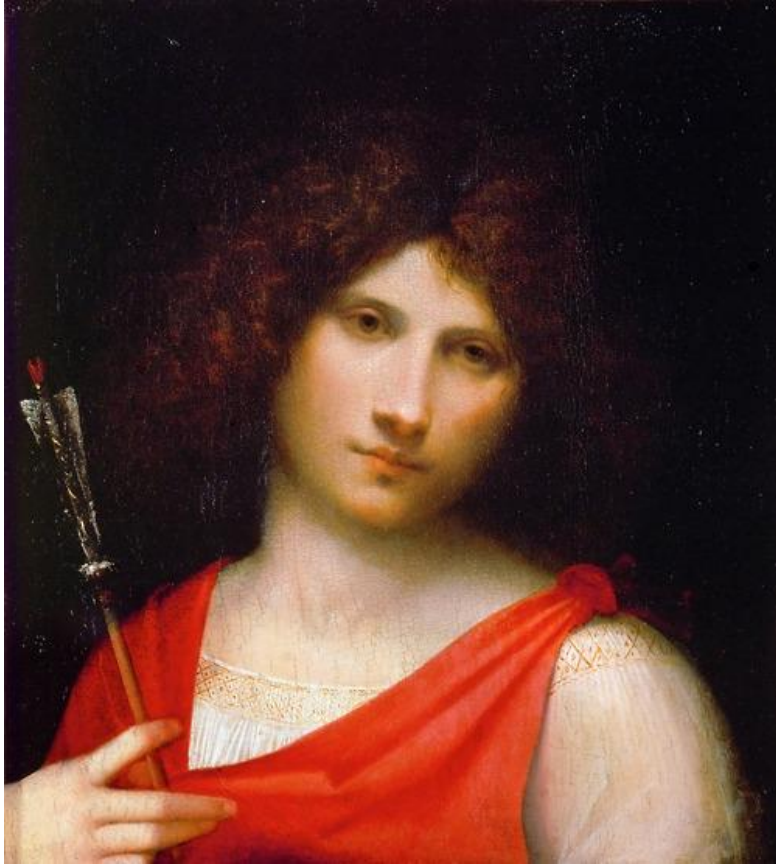
Giorgione: Chlapec so šípom

giornea - z tal. giorno – „deň“; mužský oblek talianskej renesancie ; určený na deň; krátky ku kolenám, nariasený, v páse prepásaný, niekedy s nefunkčnými rukávami vo forme nariasených pásov látky splývajúcich k okraju odevu; s malým guľatým výstrihom na prevlečenie hlavy; pozri móda ; odev