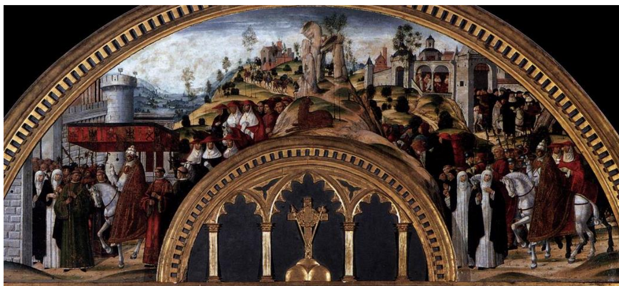
Girolamo di Benvenuto: Gregor XI sa vracia do Ríma z Avignonu (1.pol. 16.st.)