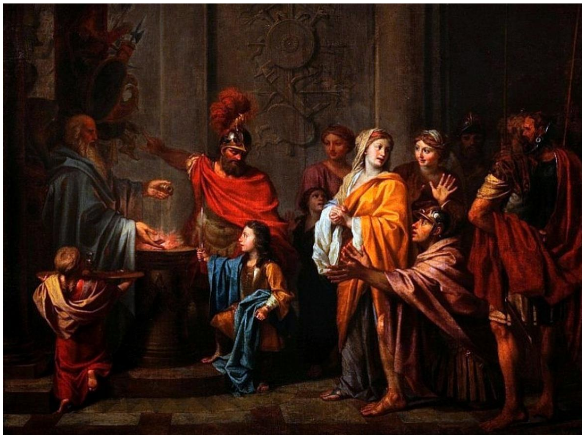
N.-N. Coppel: Prísh Hanibala (1710-1713)