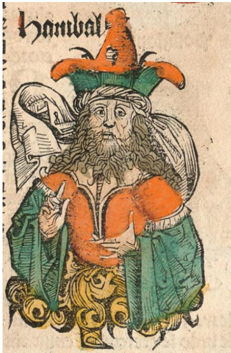
M. Wolgemut, W. Pleydenwurff, H. Schedel: Hanibal (kolorovaný drevoryt z Norimberskej kroniky, 1493)

http://cs.wikipedia.org/wiki/Bitva_u_Zamy