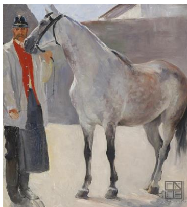
J. Hanula: Štúdia sivého koňa s pohoničom