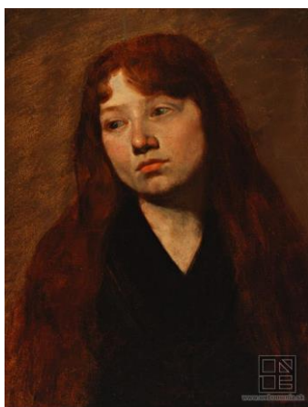
J. Hanula: Štúdia ženskej hlavy