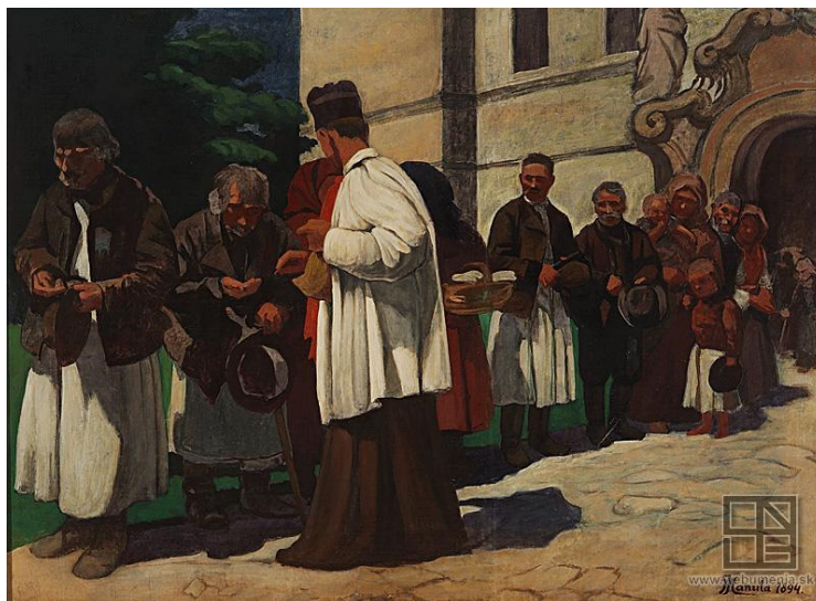
J. Hanula: Almužna (1894)