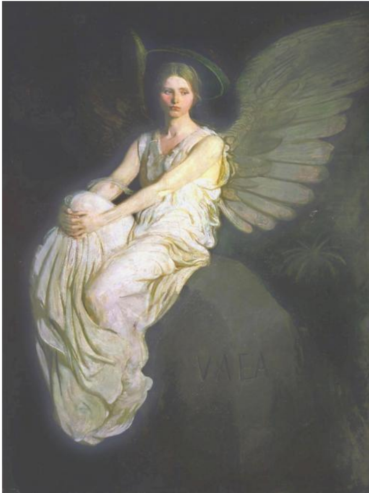
A. H. Thayer: Okridlená postava sediaca na skale

http://en.wikipedia.org/wiki/Abbott_Handerson_Thayer