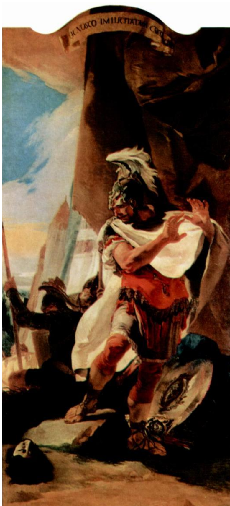
G. B. Tiepolo: Hannibal sa pozerá na čelo Hasdrubala (16.st.)