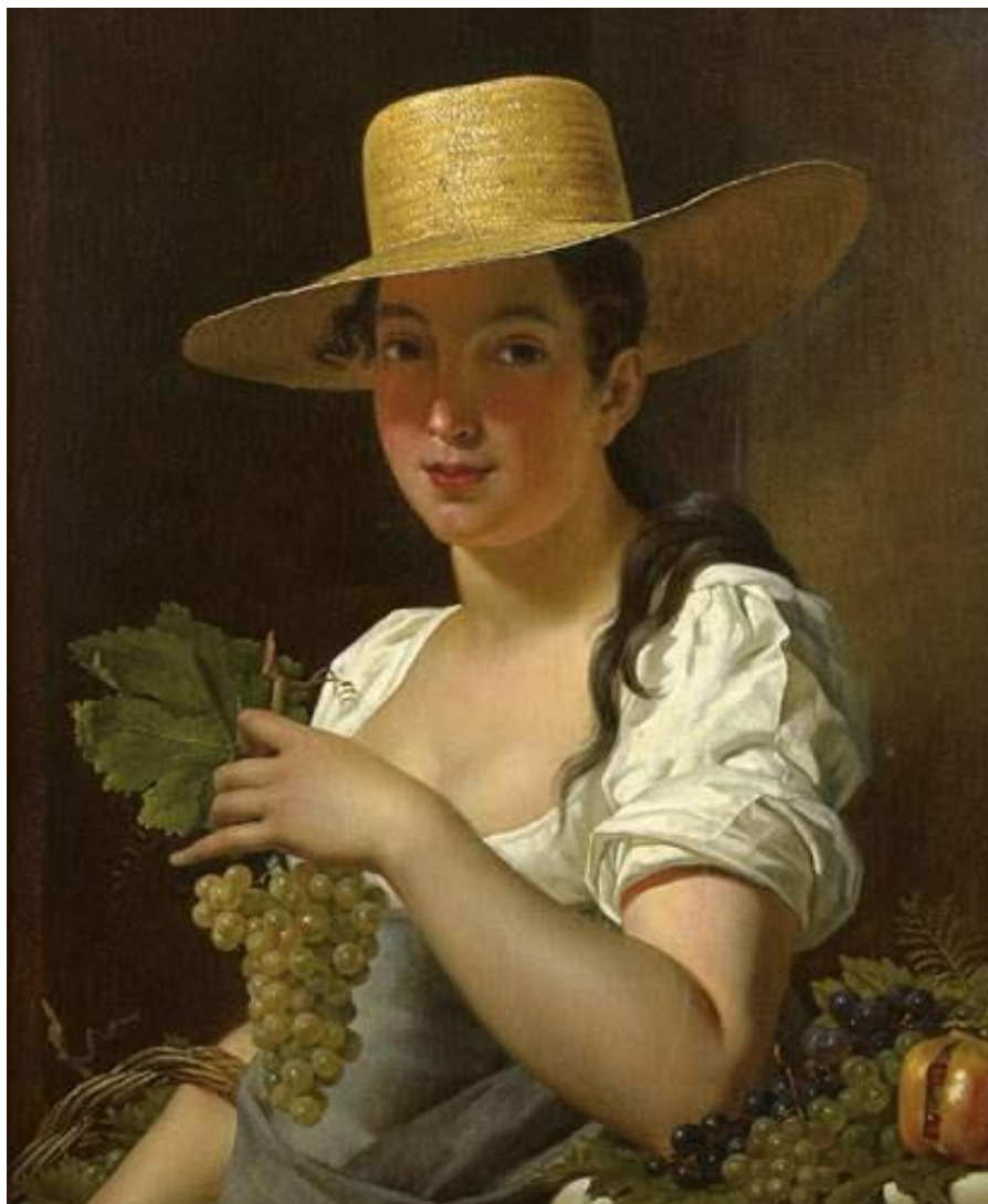
P. Van Hanselaere: Mladá žena so strapcom hrozna (1820)