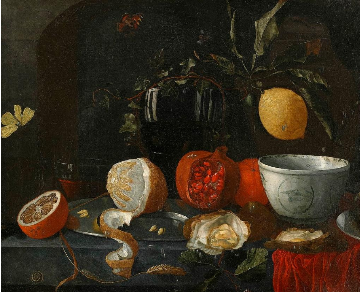
J. Hannot: Zátišie (17.st.)

hanopis - libelle , libelli famosi , paškvil ; leták z obdobia neskoršej antiky a pod týmto označením známy a užívaný až do 16.st. (vtedy aj vo forme brožúrky); dielo literárne zamerané na sociálne, politické, náboženské a vedecké aktuality; porovnaj pamflet , paskvil