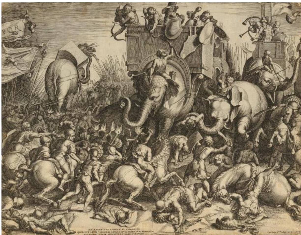
C. Cort podľa G. Romana: Bitka Scipiona a Hanibala v Zama (rytina, 1567)