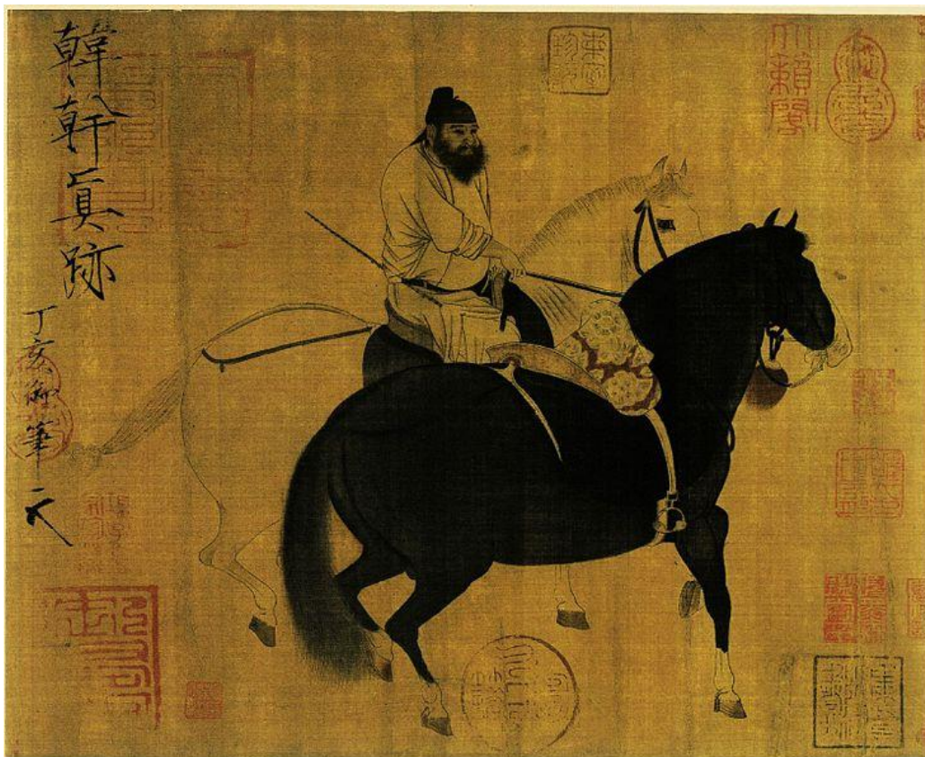
Dva kone a ženích (kópia maliara Han Gana)

hardangerská výšivka - technika vyšívania s dvojitémi prelamanými vzormi; označenie pochádza od mena regiónu Hardanger v nórskej provincii Hordaland, kde sa touto technikou začalo vyšívať podľa vzoru talianskej čipky reticella okolo roku 1790; prelamované výšivky pochádzajú pravdepodobne z Perzie z obdobia okolo 7.st.; pozri ručné práce, výšivka