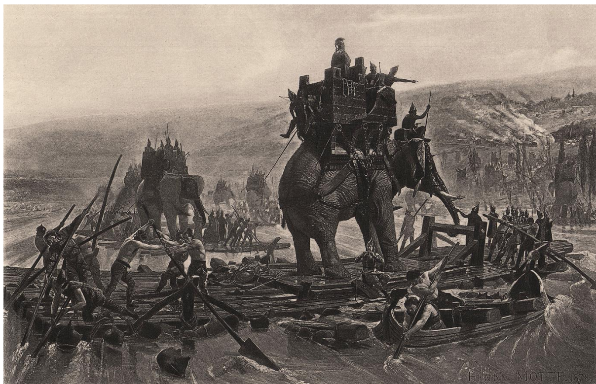
H.-P. Motte: Hannibal sa prepravuje cez Rhônu (1878)