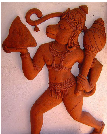
Hanuman (terakotová soška)

Hanumán - kráľ opíc , pomocník Rámu , zobrazovaný so štyrmi párami rúk