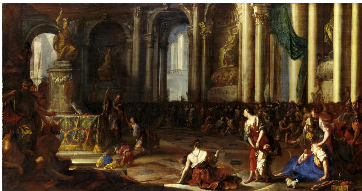
J. H. Schönfeld: Veliteľ Hanibal prisahá poraziť Rimanov (1660)