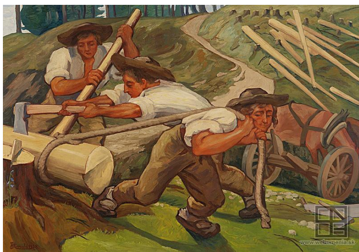
J. Hanula: Drevorubači (1938)