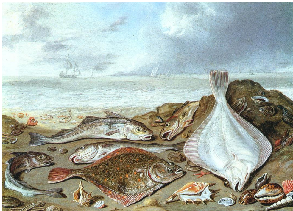
J. van Kessel I : Zátišie s rybami (17.st.)