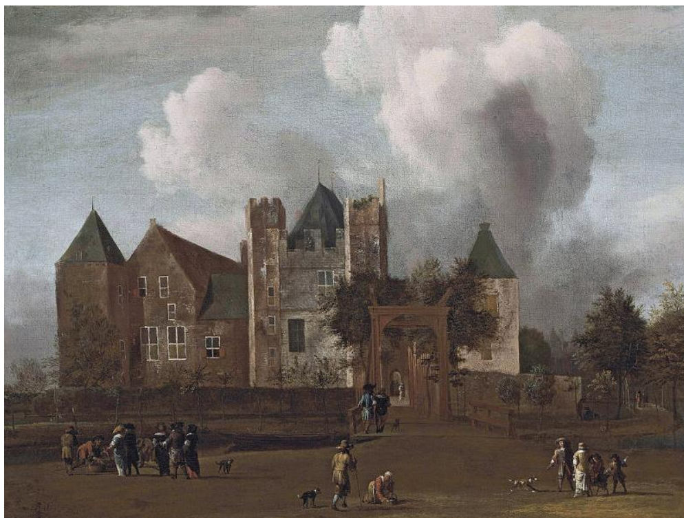
J. van Kessel z Amsterdamu: Pohľad na hrad Purmerend blízko Monnickendam, Waterland (1664)