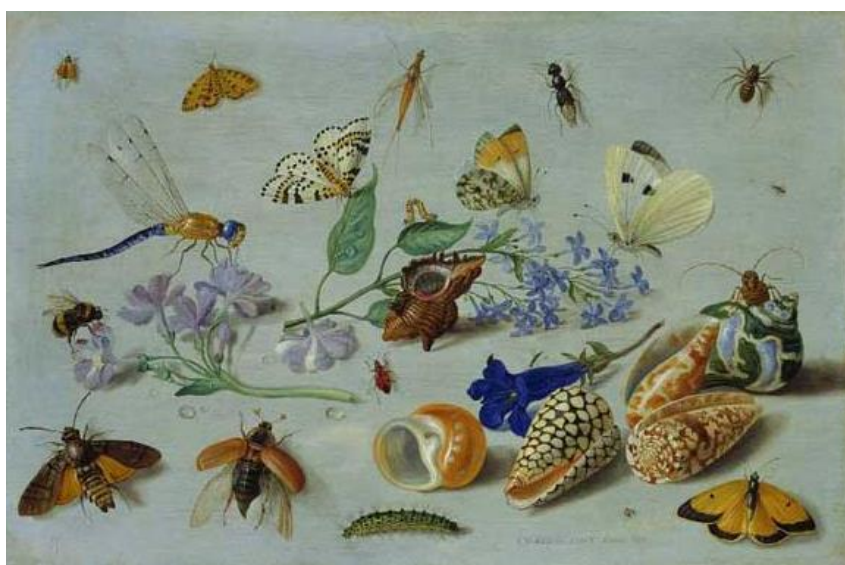
J. van Kessel I : Hmyz (17.st.)