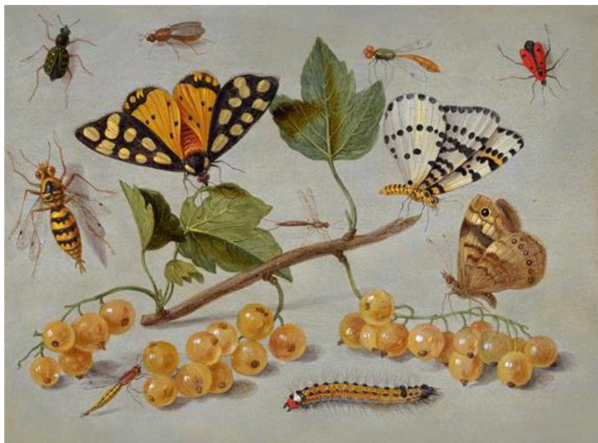
J. van Kessel I : Hmyz (17.st.)