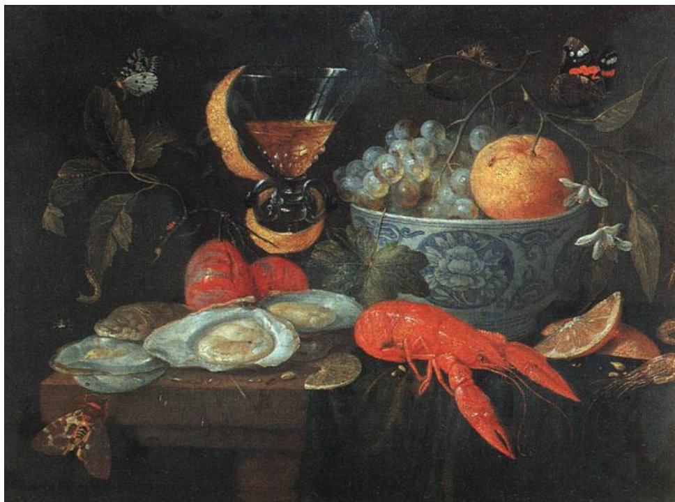
J. van Kessel I : Zátišie s ovocím a kôrovcami (1653)