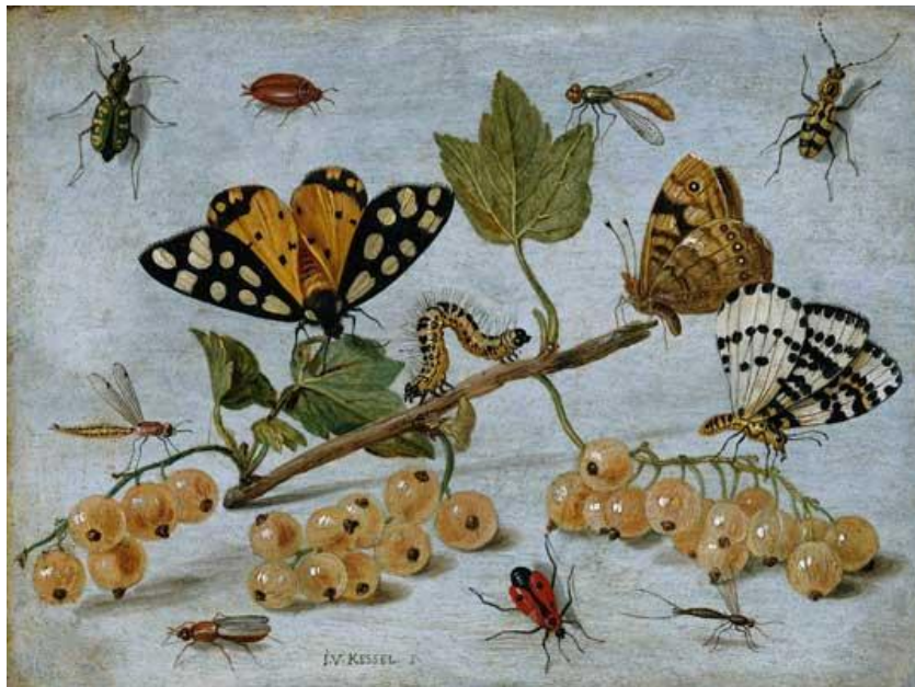
J. van Kessel I : Hmyz (17.st.)