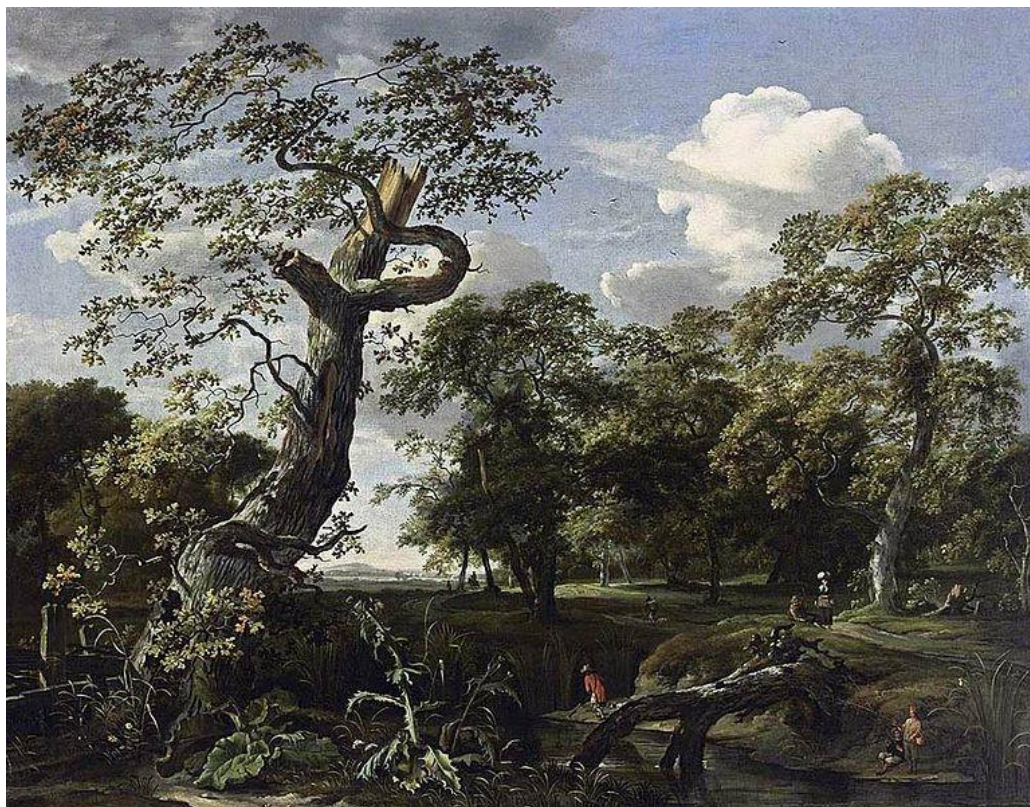
J. van Kessel z Amsterdamu: Krajina s riekou (1661)