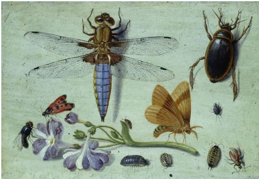
J. van Kessel I : Hmyz (17.st.)