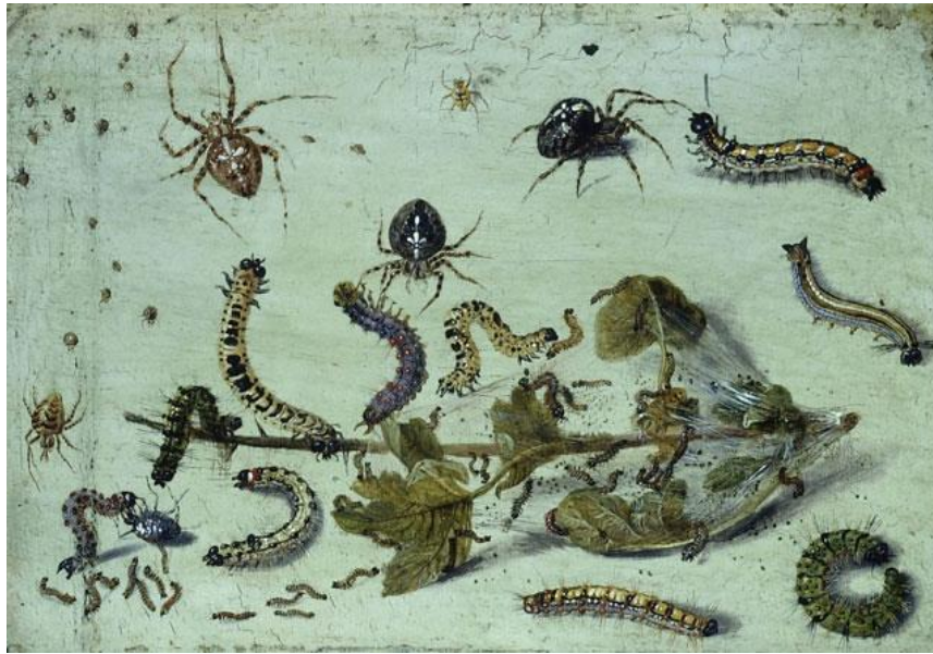
J. van Kessel St.: Hmyz (17.st.)