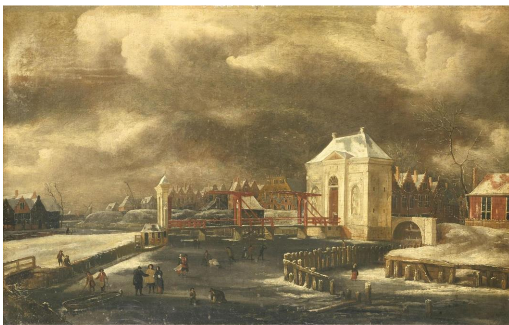
J. van Kessel z Amsterdamu: Brána Heiligeweg v amsterdamskom prístave v zime (17.st.)