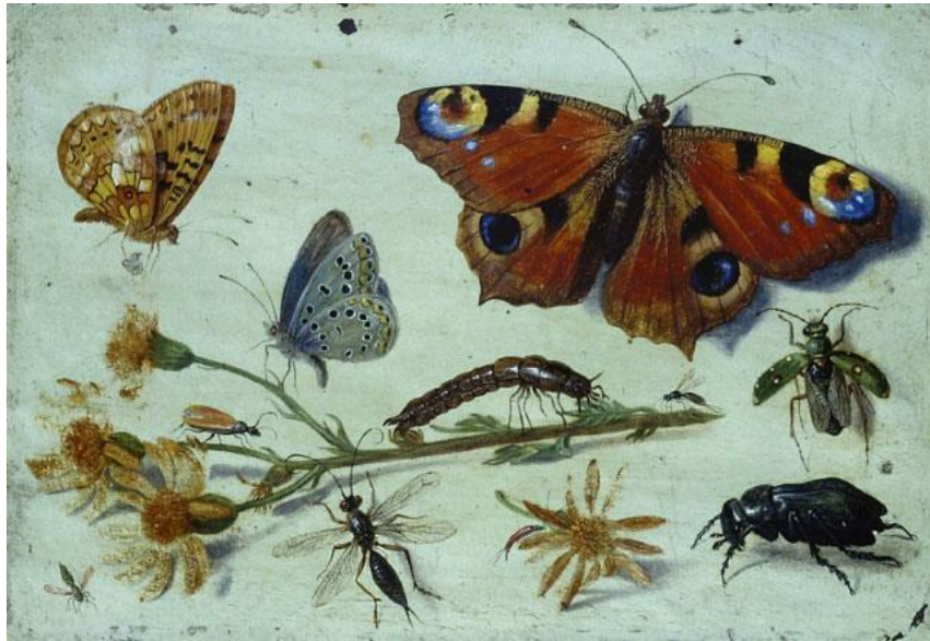
J. van Kessel St.: Hmyz (17.st.)