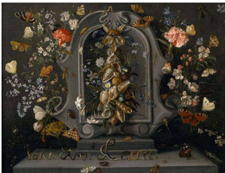
J. van Kessel St.: - (17.st.)