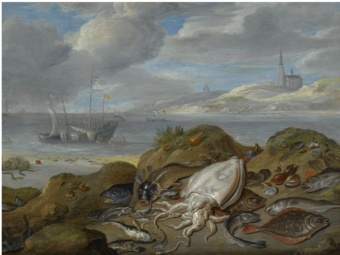
J. van Kessel I: Zátišie s rybami (17.st.)