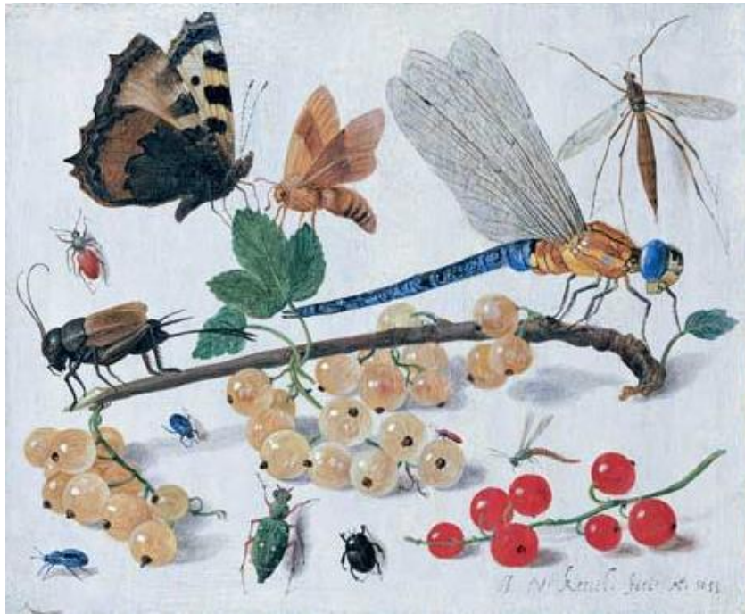
J. van Kessel I : Hmyz (17.st.)