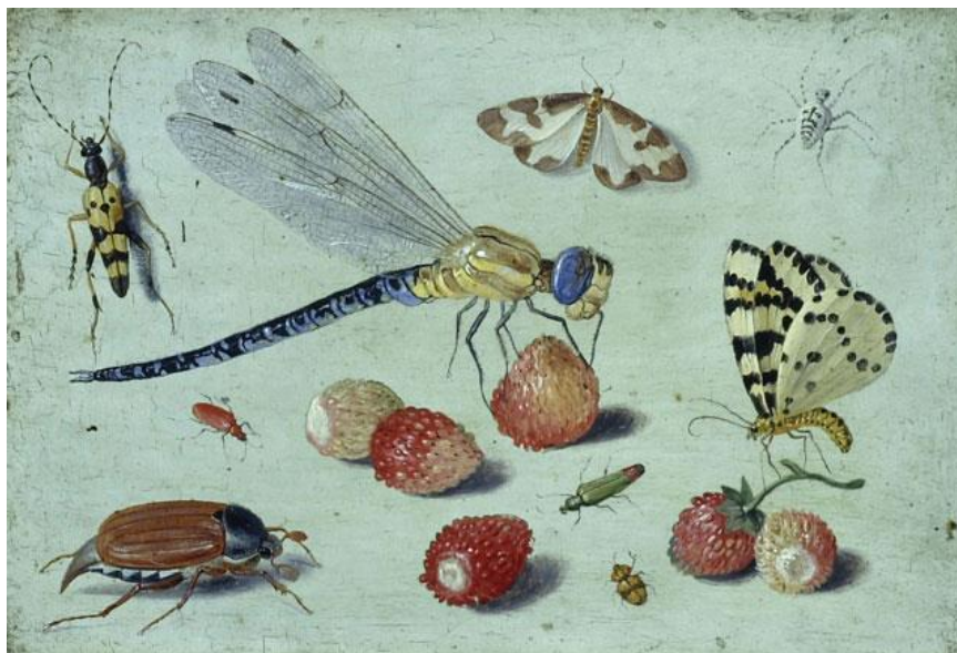
J. van Kessel I : Hmyz (17.st.)