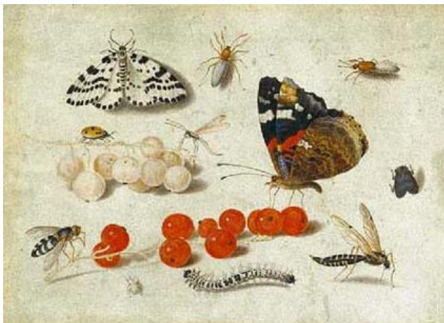
J. van Kessel I : Hmyz (17.st.)