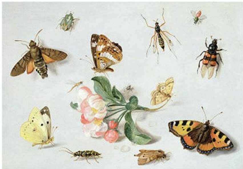
J. van Kessel St.: Hmyz (17.st.)