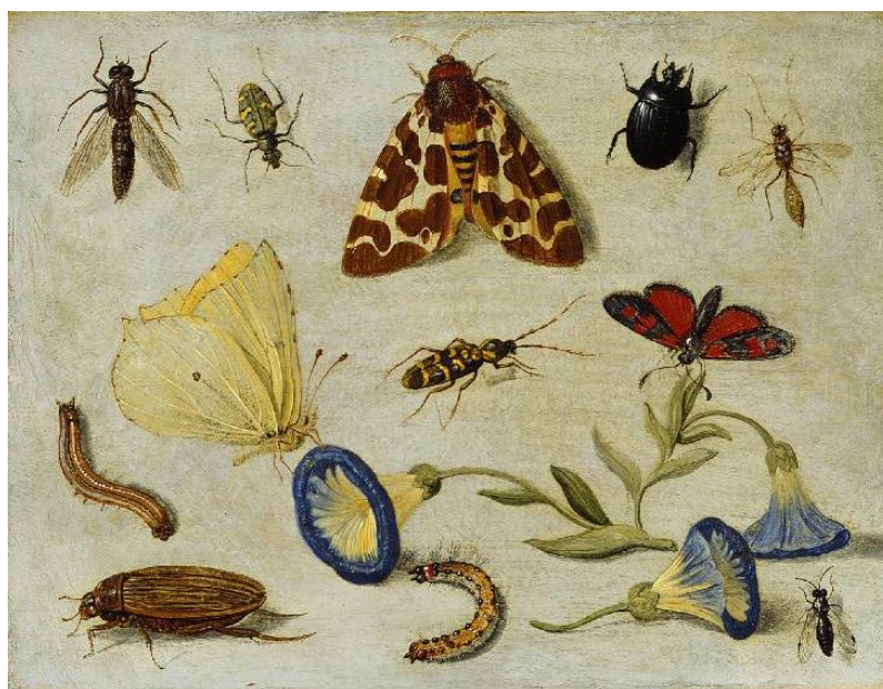
J. van Kessel I : Hmyz (17.st.)