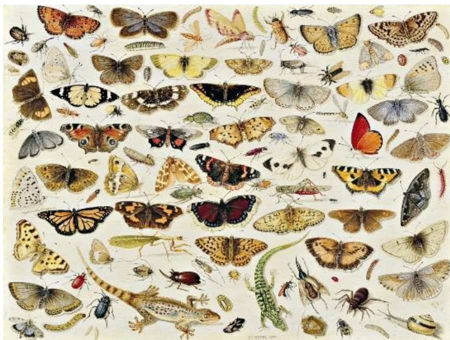
J. van Kessel I: Motýle (1671)