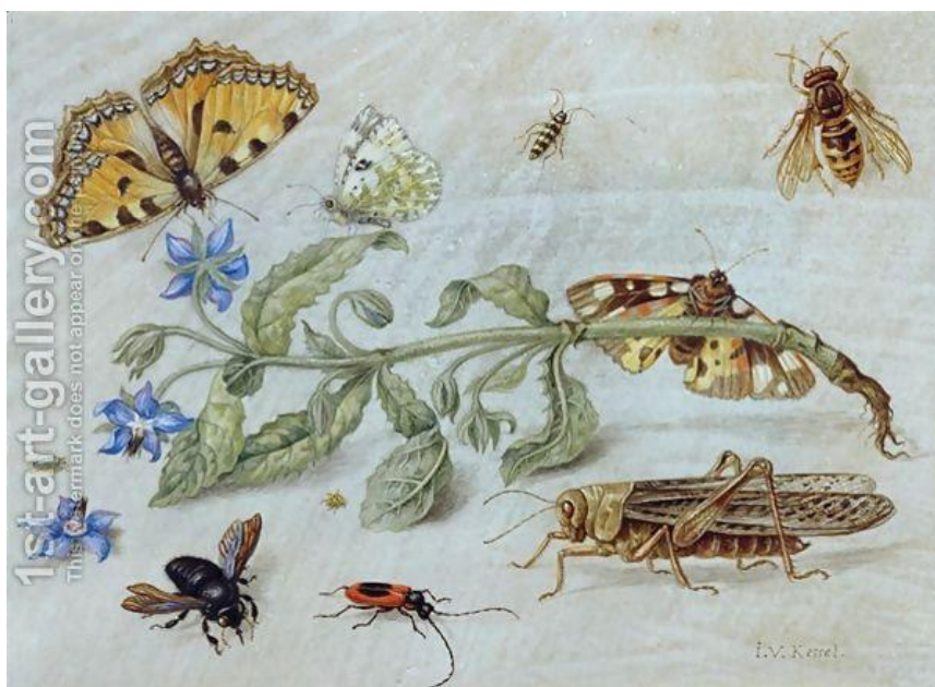
J. van Kessel St.: Hmyz (17.st.)