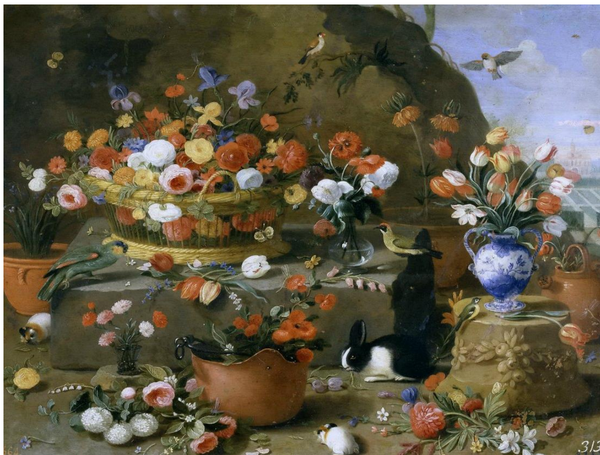
J. van Kessel z Amsterdamu: Zátišie s kvetmi (17.st.)