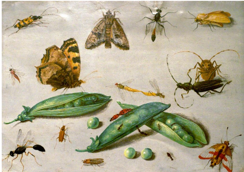
J. van Kessel I : Hmyz (17.st.)