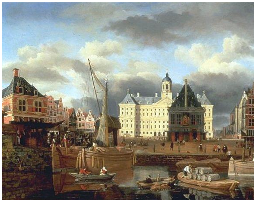
J. van Kessel z Amsterdamu: Námestie Dam s palácom a dokmi (pred 1680)

l (z Amsterdamu)&source=iu&pf=m&fir=tcqt9rw-9ZVQIM%253A%252CVWrEkm1Hzkcz-M%252C &usg=__5EjyrIUGtKeslYFHZbRZUbBmBLg%3D&ved=0CCoQyjc&ei=3X13VNSfEsLMygPZwIDQAQ#facrc=&imgdii=&imgrc=tcqt9rw-9ZVQIM%253A%3BVWrEkm1Hzkcz-M%3Bhttp%253A%252F%252Fupload.wikimedia.org%252Fwikipedia%252Fcommons%252F0%252F0f%252FA_view_of_Purmerend_Castle%252C_near_Monnickendam%252C_Waterland_by_Jan_van_Kessel_(Amsterdam_1641-1680).jpg%3Bhttp%253A%252F%252Fpl.wikipedia.org%252Fwiki%252FJan_van_Kessel_(z_Amsterdamu)%3B3200%3B2400