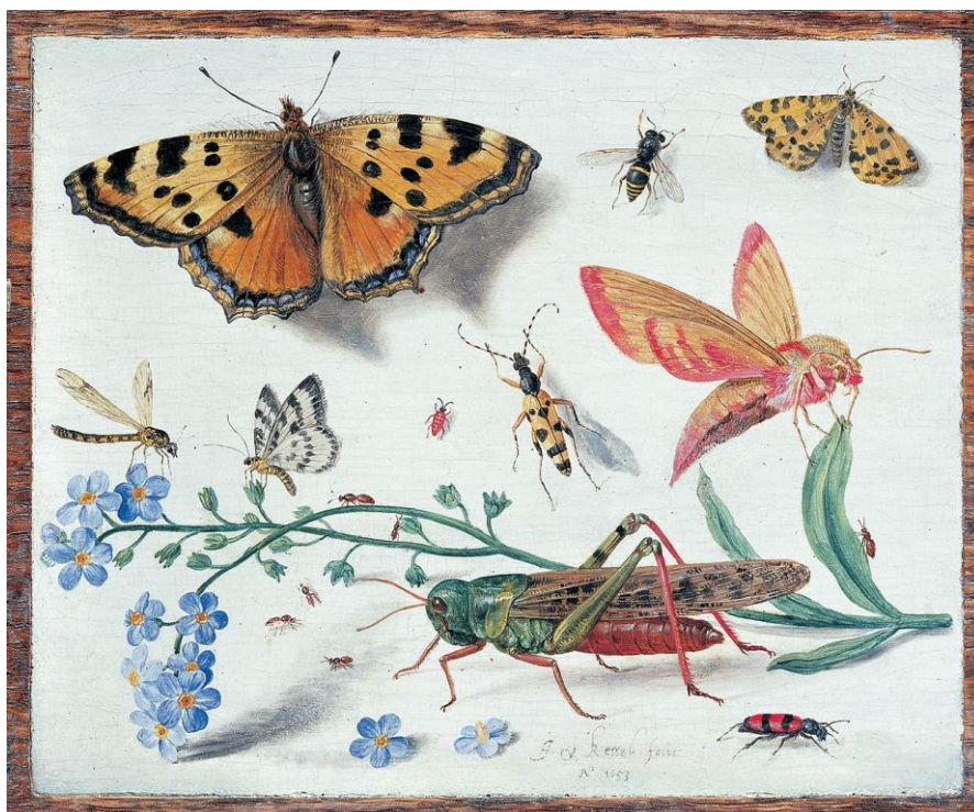
J. van Kessel I: Hmyz (17.st.)