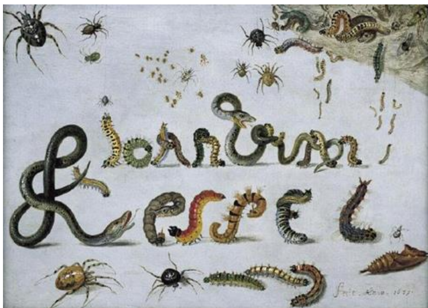
J. van Kessel St.: - (17.st.)