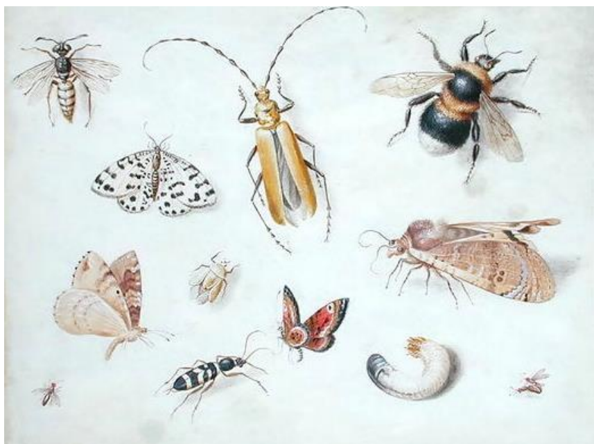
J. van Kessel St.: Hmyz (17.st.)