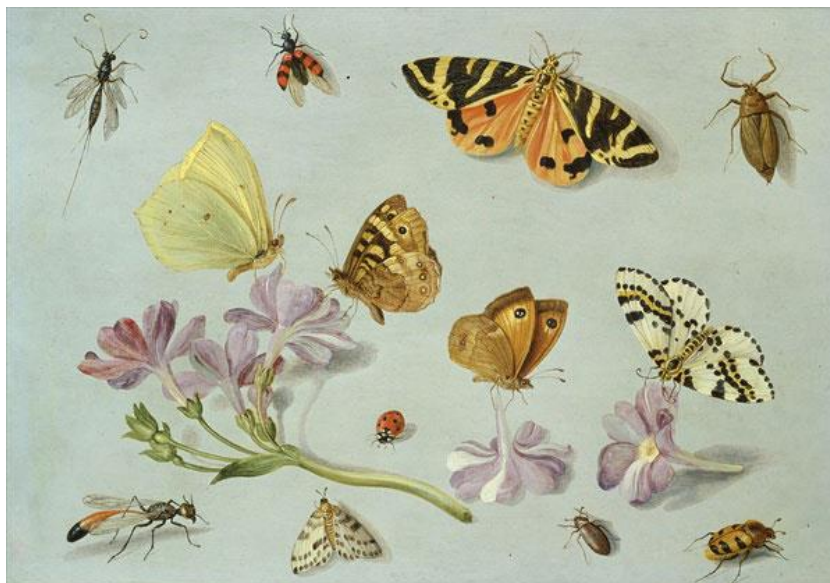
J. van Kessel I : Hmyz (17.st.)