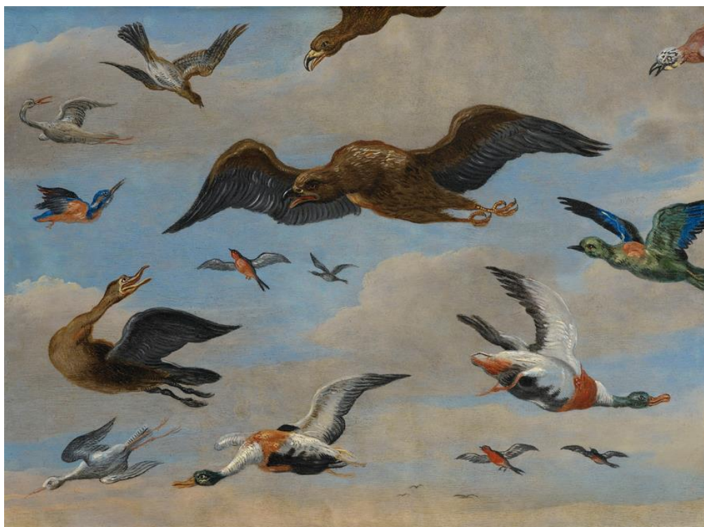
J. van Kessel I: Štúdia vtákov na pozadí oblohy (17.st.)