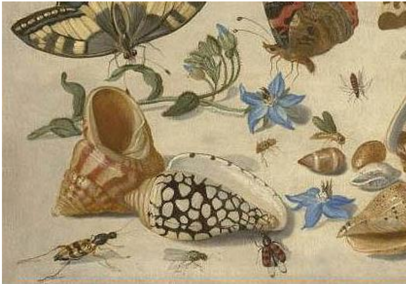
J. van Kessel I : Hmyz (17.st.)