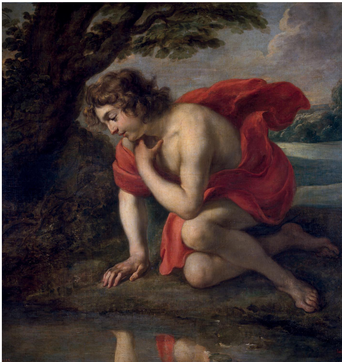
J. Cossiers: Narcis (1638)