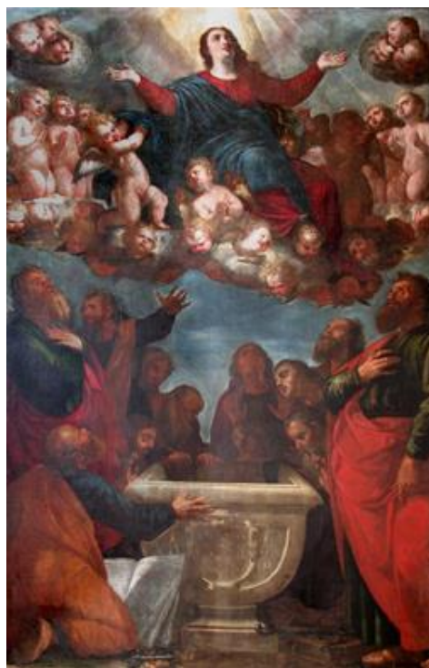
A. Nardi: Nanebovzatie Panny Márie (17.st.)