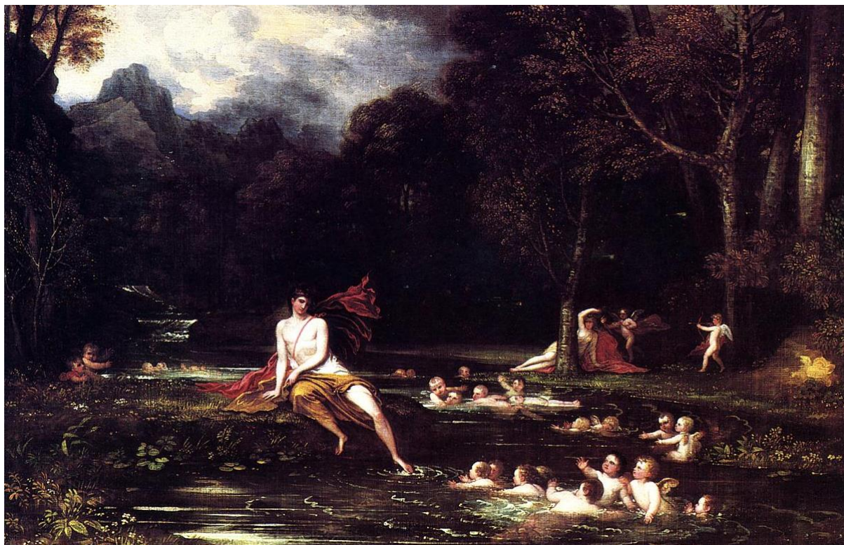
B. West: Narkissos a Echo (1805)