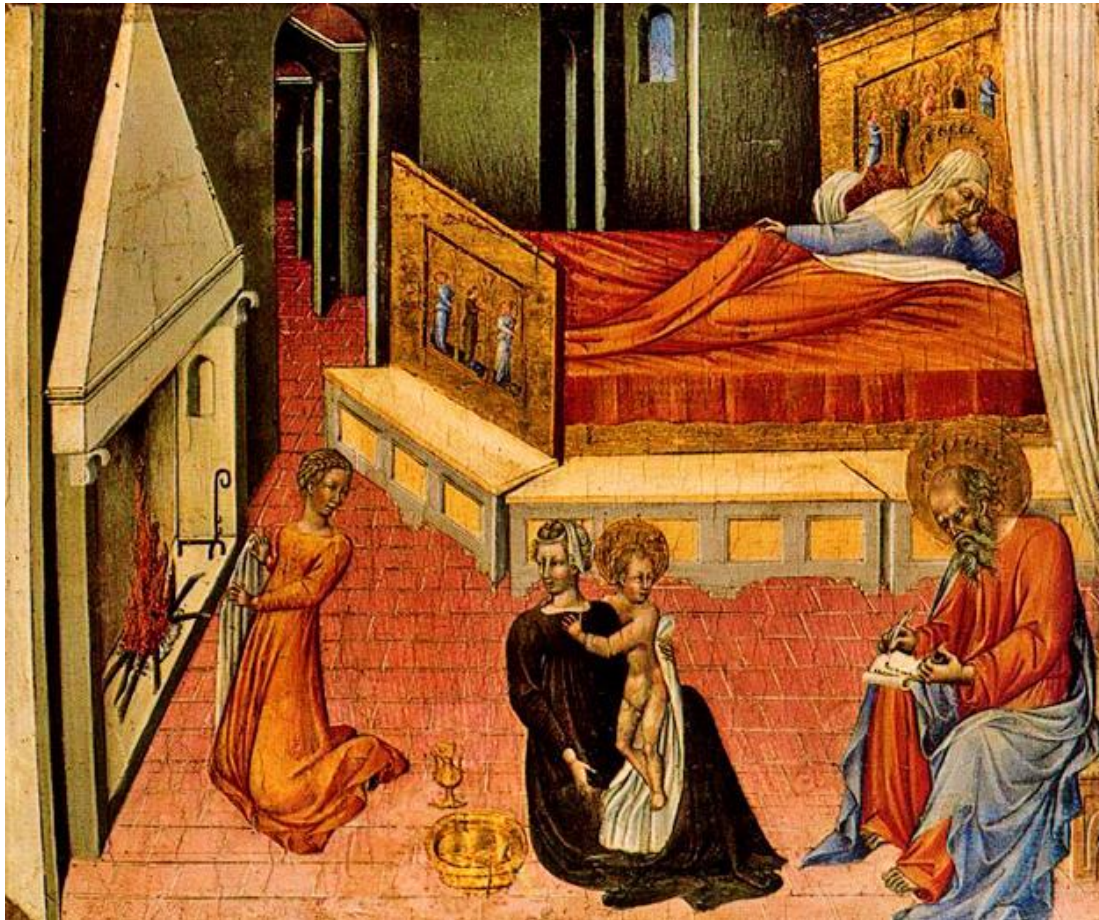
G. di Paolo: Narodenie Jána Krstiteľa (1454)