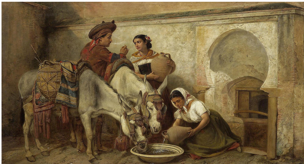
R. Ansdell: Dobre (1870)

narcis (kvet) - z gréc. narkao – uspávať, byť omámený