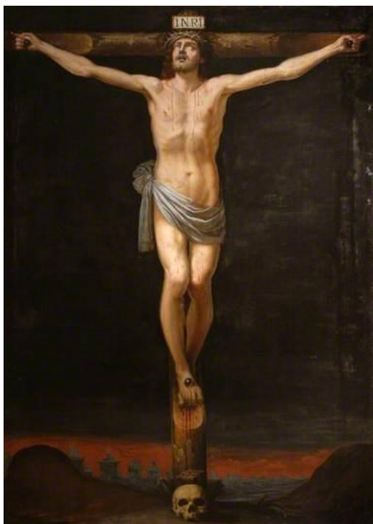
A. Nardi: Kristus na križi (17.st.)