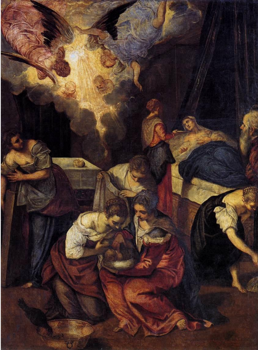
J. Tintoretto: Narodenie svätého Jána Krstiteľa (16.st.)