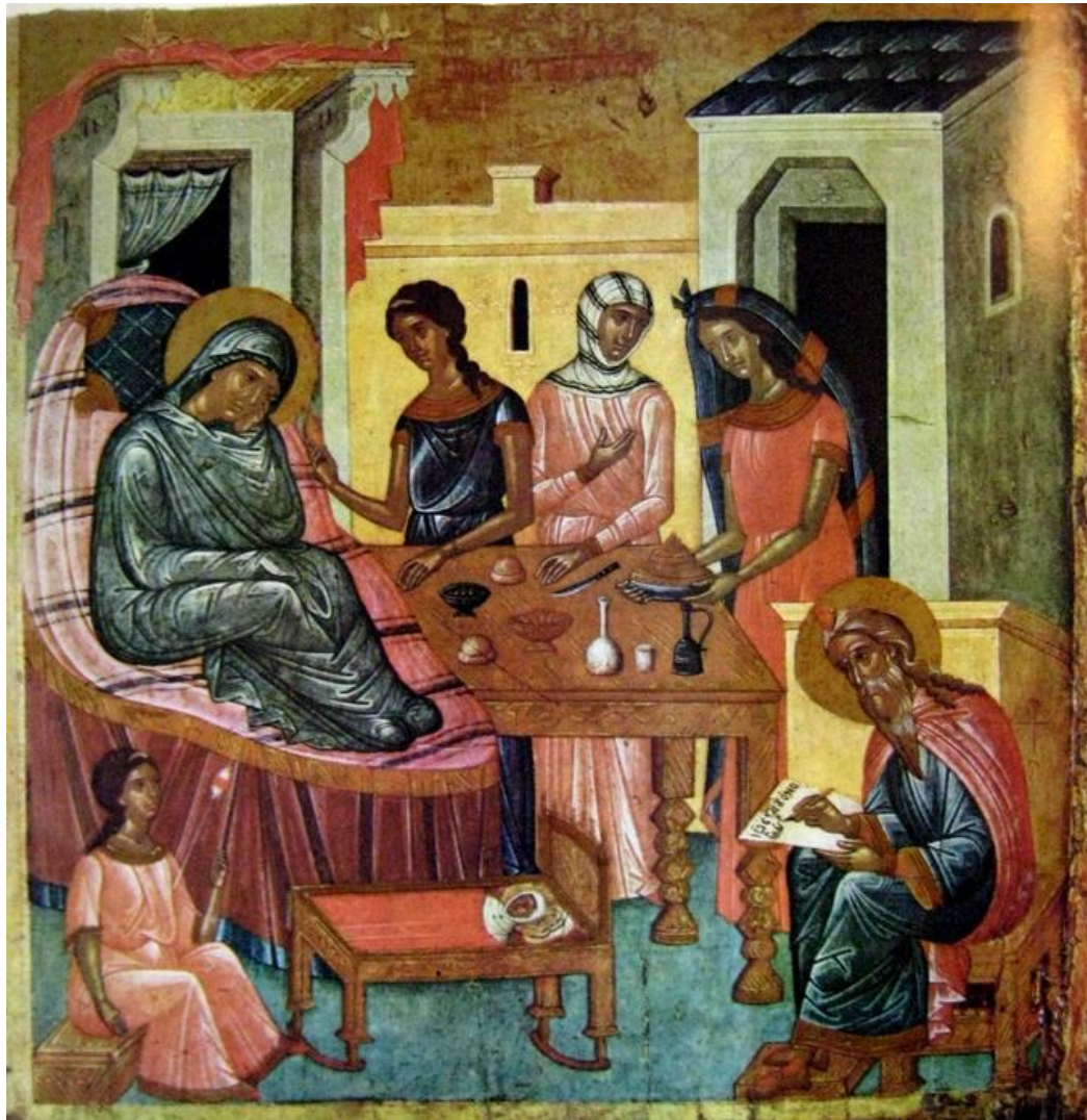
Narodenie Jána Predchodcu (ruská ikona, 15.st.)