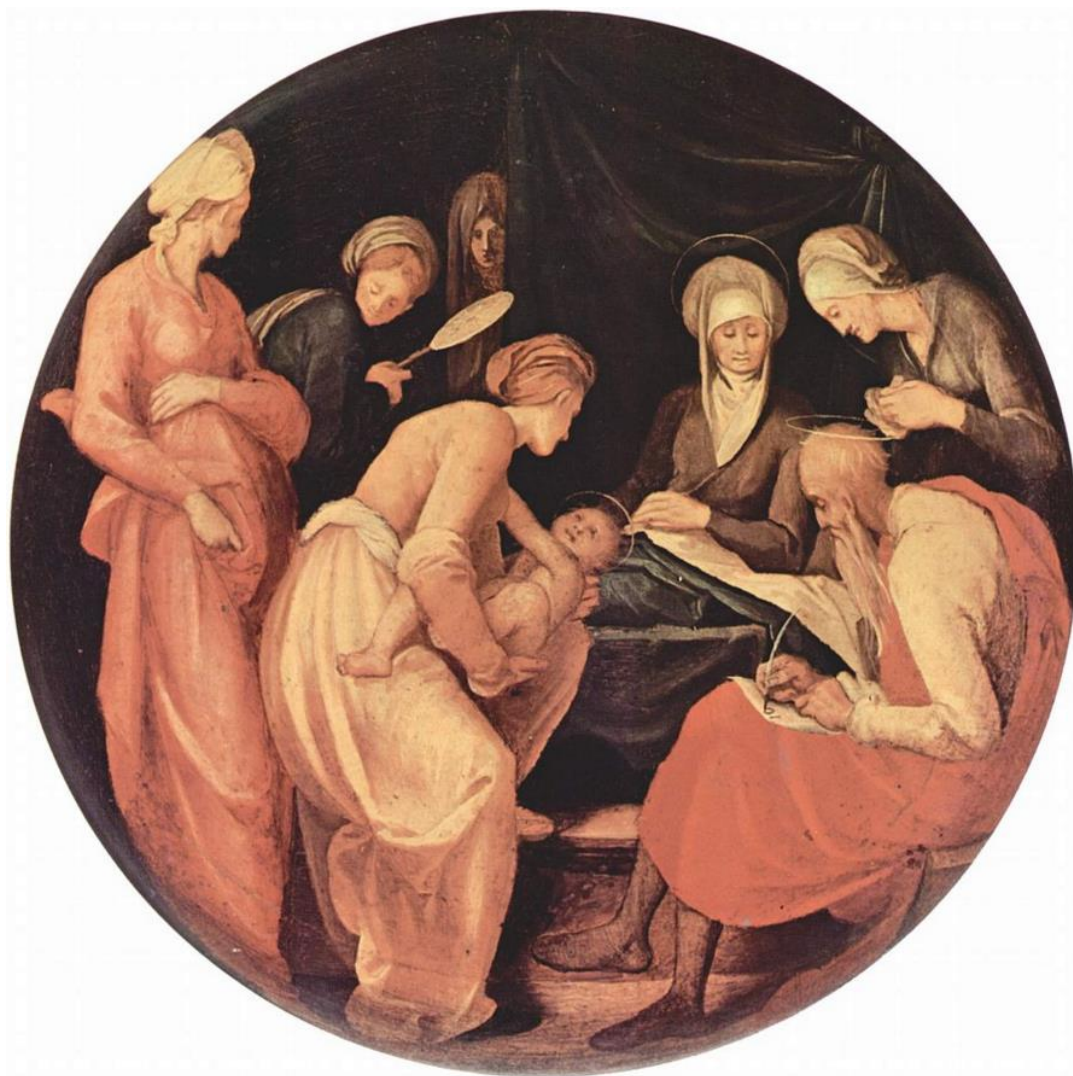
Pontormo: Narodenie Jána Krstiteľa (1526)