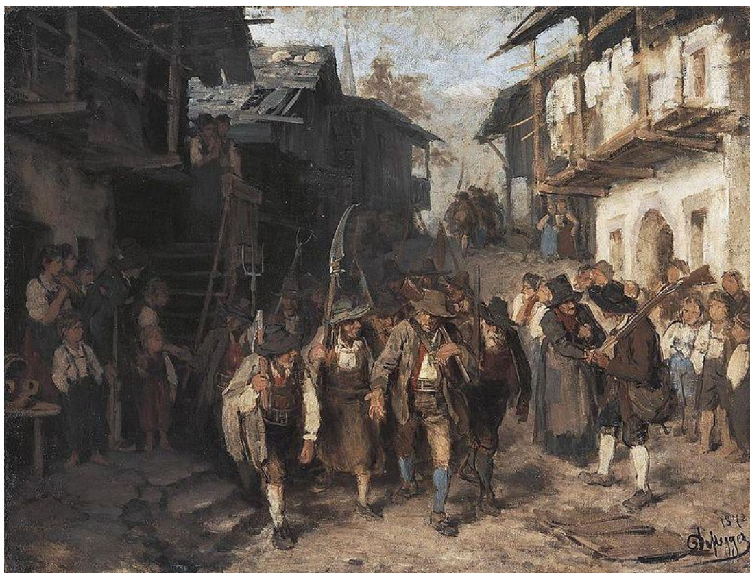
F. Defregger: Posledný kontingent (1872)