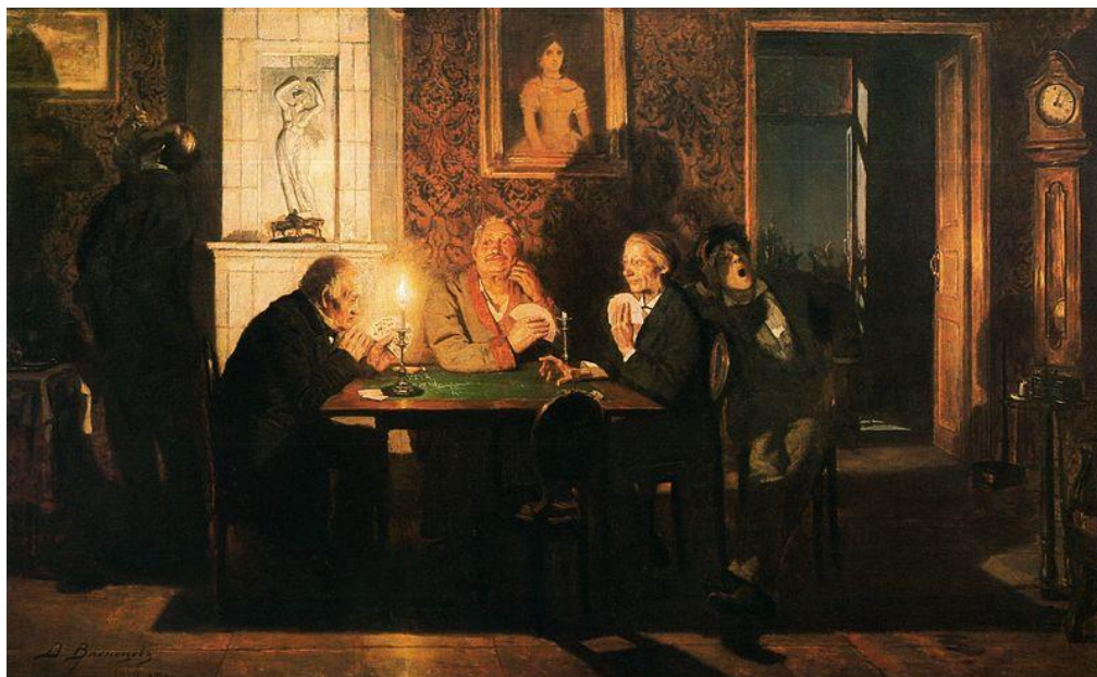
V. M. Vasněcov: Preferans (1879)

naratívnosť typická napr. pre insitné umenie ; stredoveké naratívne cykly: pozri polyptych ; pozri anekdota , moralita ; kontinuálna kompozícia ; Peredvižnici , neorealizmus ; devocionálny