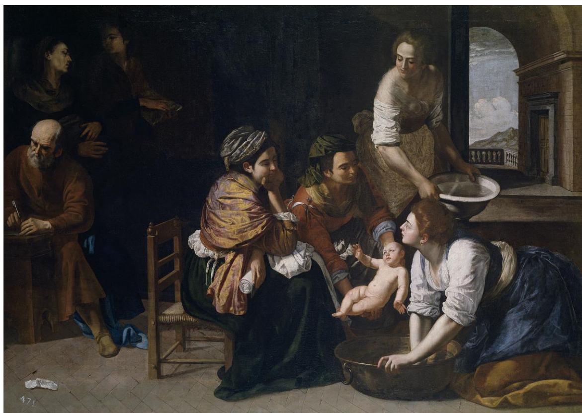
A. Gentileschi: Narodenie Jána Krstiteľa (1635)