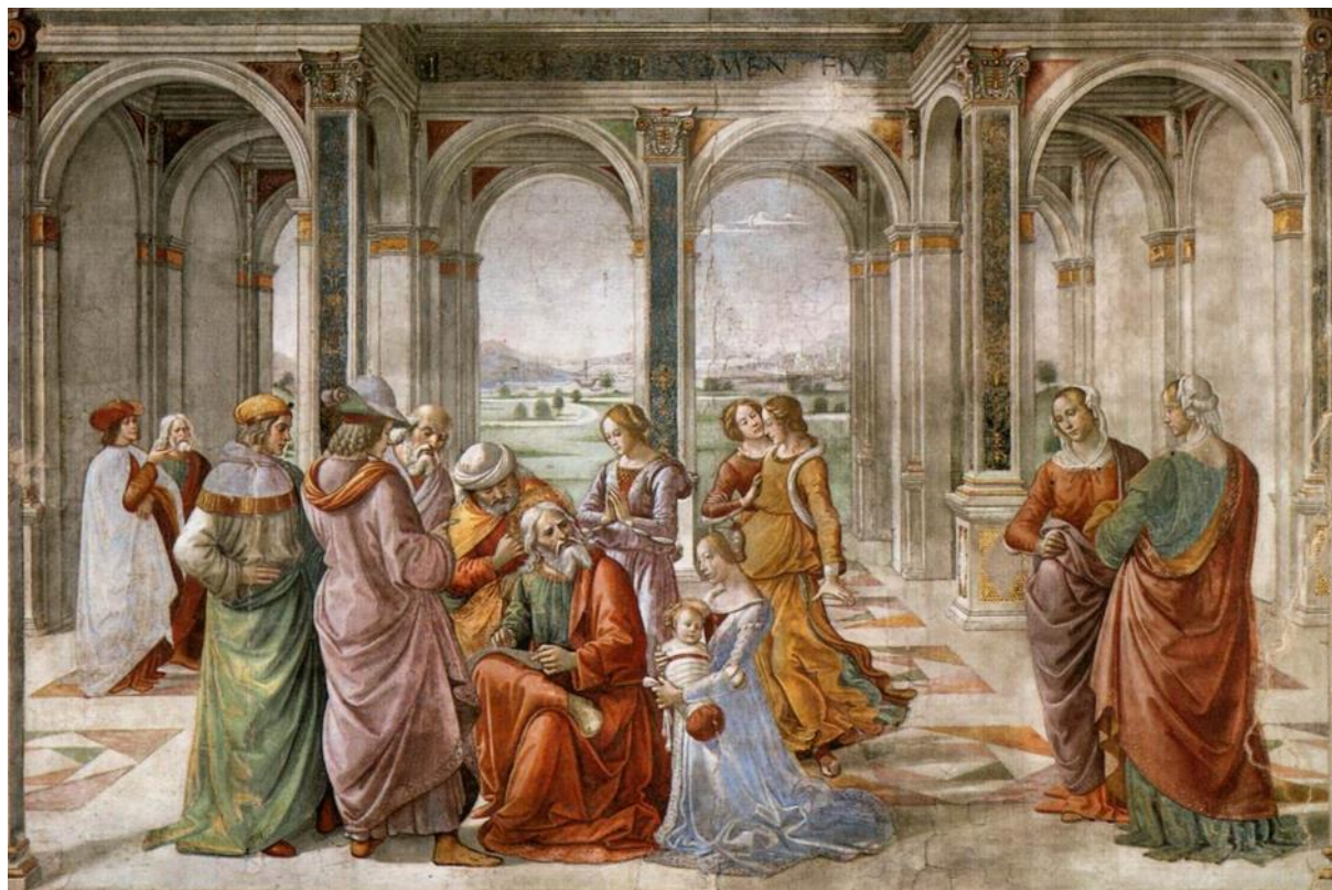
D. Ghirlandaio: Zachariáš zapisuje meno svojho syna (freska, kaplnka Tornabuoni v kostole Santa Maria Novella, Florencia, 1490)