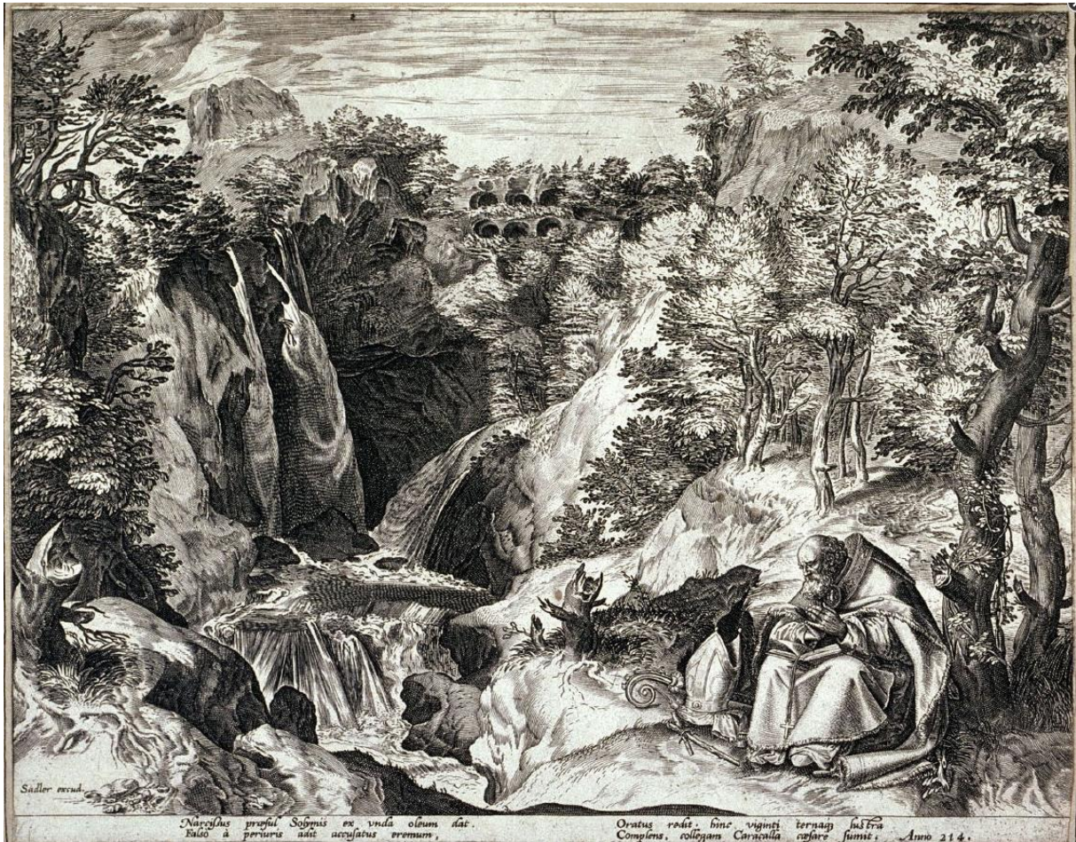
Sadeler: Sv. Narcissus, patriarcha Jeruzalema v krajine (16.-17.st.)

narcizmus - v oblasti sexuológie: sexuálna deviácia charakterizovaná erotickým záujmom o vlastné telo (pozri expresionizmus : osobnosť rakúskeho maliara Egona Schieleho ); pozri erotika/sex