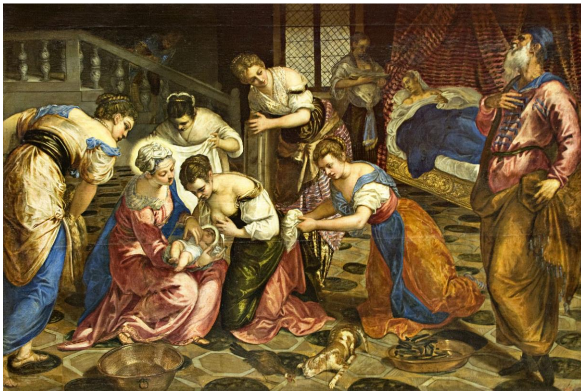
J. Tintoretto: Narodenie svätého Jána Krstiteľa (1554)