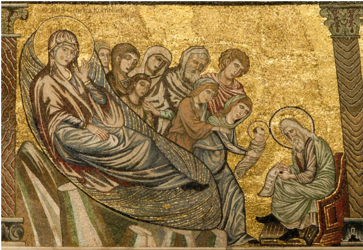
Narodenie a pomenovanie sv. Jána (Baptisterium di San Giovanni, Florencia, 1240-1310)

https://www.google.sk/search?q=Birth+of+John+the+Baptist&espv=2&biw=1852&bih=995&tbn=is&sch&tbo=u&source=univ&sa=X&ved=0ahUKEwjmrr7Kh9TLAhVFiCwKHS4BAucQsAQIGQ