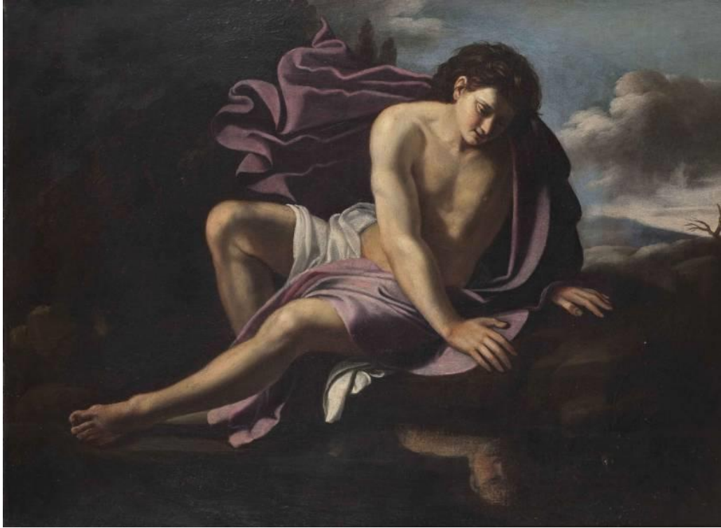
O. Gentileschi: Narcis (17.st.)