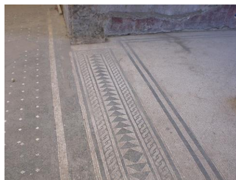
mramorová dlážková mozaika (Villa San Marco, Stabiae)