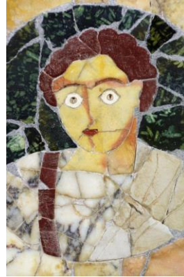
Portrét mladého muža (3.st.)

opus signium - typ dlážkovej mozaiky (pozri opus pavimentum ) nazvanej podľa mesta Signia; skladaná rôzne veľkých kamenných a keramických črepov (rozdiel od opus tessellatum ; pozri mozaika )