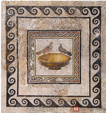
mozaika opus tessellatum

v opus tessellatum; opus vermiculatum dovoľovalo veľmi jemné detaily blízke iluzionistickej maľbe; taliansky štýl opus tessellatum mal čierne pozadie a bol lacnejší ako práce s plnou farebnosťou; tessellatum zvyčajne ukladá kocky na pozadí vodorovne alebo zvisle do usporiadaných liniek, ale nie do mriežok ako v prípade opus regulatum