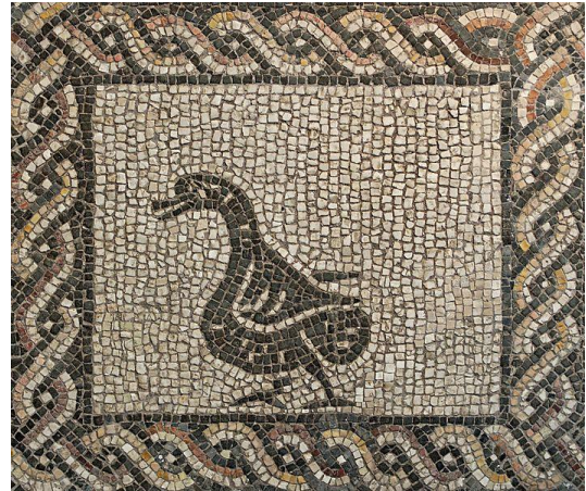
mozaika opus tessellatum (3.storočie)