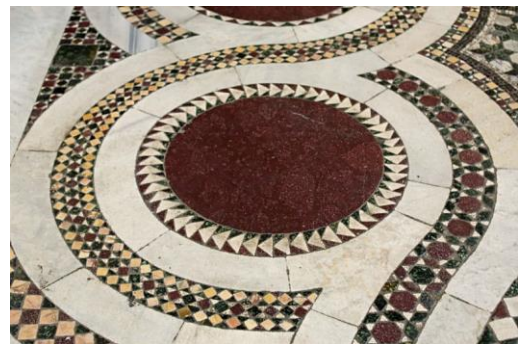
dlážková mozaika baziliky Santa Maria Maggiore v Ríme