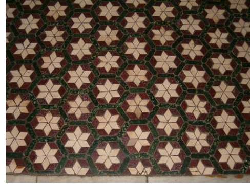
dlážková mozaika Basilica di Santa Maria San Paolo fuori le Mura v Ríme