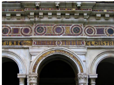
opus alexandrinum vo fasáde