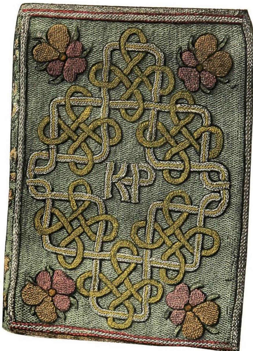
Dar Catherine Paarovej princeznej Elizabeth, neskoršej kráľovnej Anglicka (opus anglicum, vyšívaná knižná väzba rukopisu z The Miroir or Glasse of the Synneful , 1544)