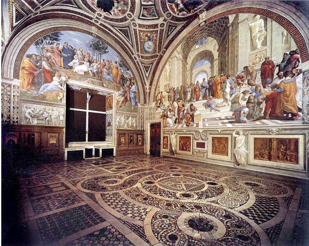
dlážková mozaika v Stanza della Segnatura vo Vatikáne

opus anglicum - lat. – anglická práca“; druh anglickej gotickej výšivky; pozri gotické umenie , výšivka