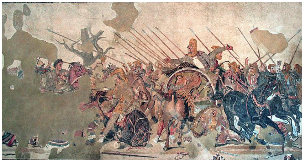
Bitka Alexandra Macedónskeho s Dareiom (Dom faunov v Pompejach)