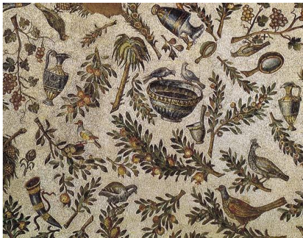
St.. Constanza v Ríme

opus testaceum - murivo zmiešané z tehiel (debnenie) a výplňového muriva (kameň)