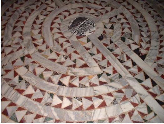
Basilica di San Vitale, Ravenna (labyrint priemer 3,4 m; opus sectile)