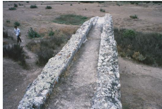
opus signium ako stavebný materiál (akvadukt blízko Sevily)

opus spicatum - murivo klasové, klasová väzba