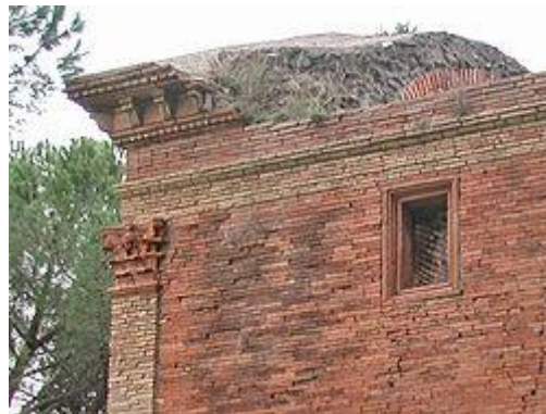
opus latericum na hrobke pri Via Appia

opus mixtum - murivo zmiešané z dvoch alebo viacerých rôznych stavebných hmôt