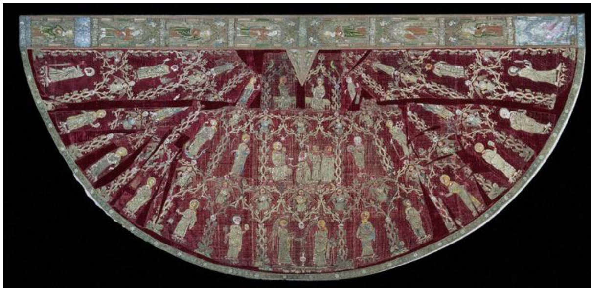
Butler-Bowden Cope. Scény zo života Panny Márie s apoštolmi a svätými (opus anglicum, 1330-1350)