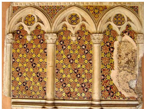
opus alexandrinum v murive (Basilica di San Giovanni v Lateráne)