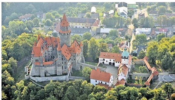
Hrad rádu nemeckých rytierov (Bouzov, Morava)