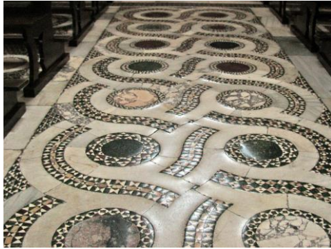
dlážková mozaika katedrály v Terracine

opus alexandrinum - typ dlážkovej mozaiky (pozri opus pavimentum ) z kamenných kociek od čias rímskeho cisárstva; používaná aj v murive , v nábytkárstve a šperkárstve (pozri rímska mozaika ); pozri mozaika