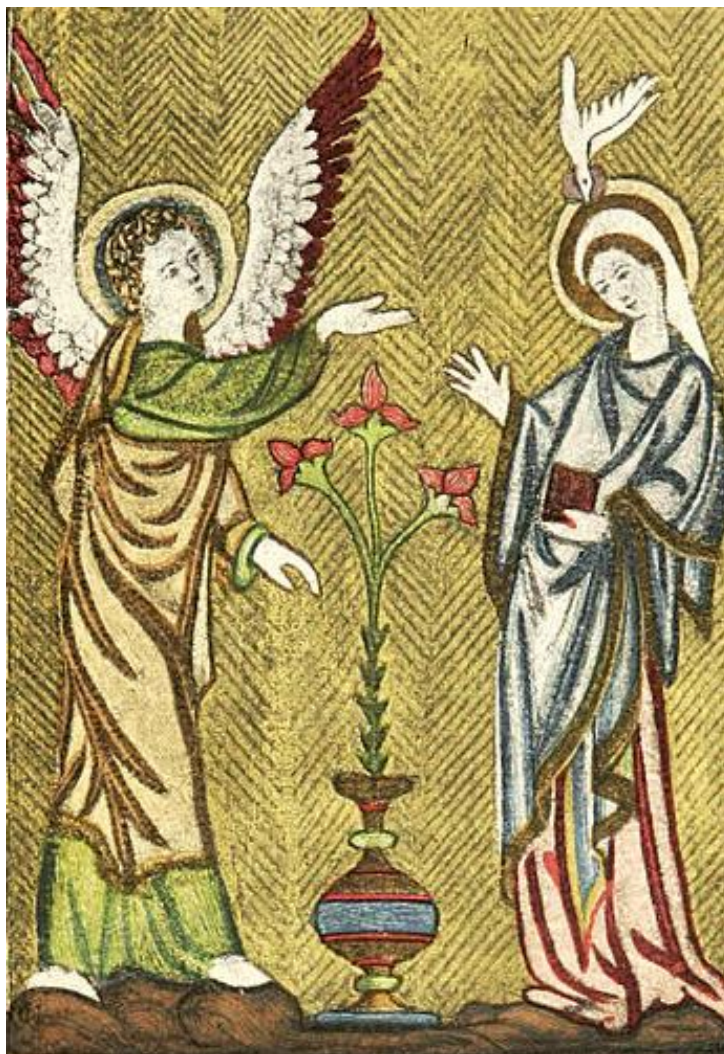
Zvestovanie Panne Márii (dosky Felbrigge žaltára; opus anglicum, 13.st.)