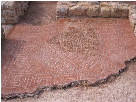
opus signium ako dlážková mozaika

www: opus signinum je stavebný materiál používaný v antickom Ríme; je vyrobený z dlaždíc rozdelených na veľmi malé kúsky, zmiešanými s maltou, a potom ubitý tyčami; Plinius St. vo svojom Physiologu popisuje jeho svoju výrobu: "Aj rozbité keramiky boli využité, pričom narazil aj na prášok; temperovaním vápnom vzniká hmota pevnejšie a odolnejšie ako ostatné látky podobné povahy, tvoriace cement známy ako "signin"; hmota používaná aj na výrobu chodníkov domov; technika vznikla v severnej Afrike nejakú dobu pred 256 pr.Kr. a šírila sa na sever, odtiaľ na Sicíliu a nakoniec na taliansky polostrov; dlažky z opus signinum sa nachádzajú často v púnskych mestách severnej Afriky a v helenistických domoch na Sicílii; zatiaľ čo niektoré opus signium bolo nájdené v Ríme, technika nie tu nie je bežná; Vitruvius opisuje proces, ktorým sa šírila opus signinum ako dlažka aj mozaika; trend začal v 1.st.pr.Kr. v súkromných domoch, rovnako ako verejných budovách; do 2.storočia sa na chodníkoch používalo veľa vzorovaných štýlov