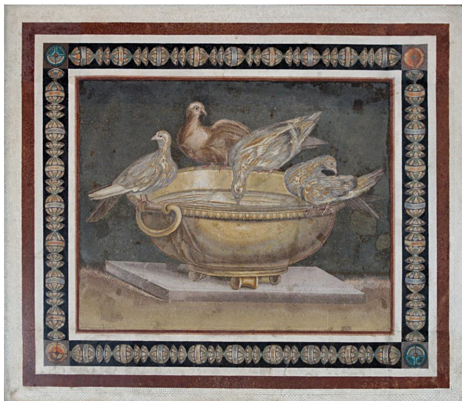
mozaika opus vermiculatum