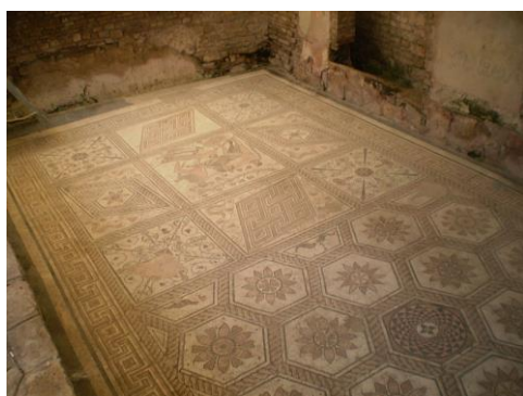
dlážková mozaika (Pompeje)