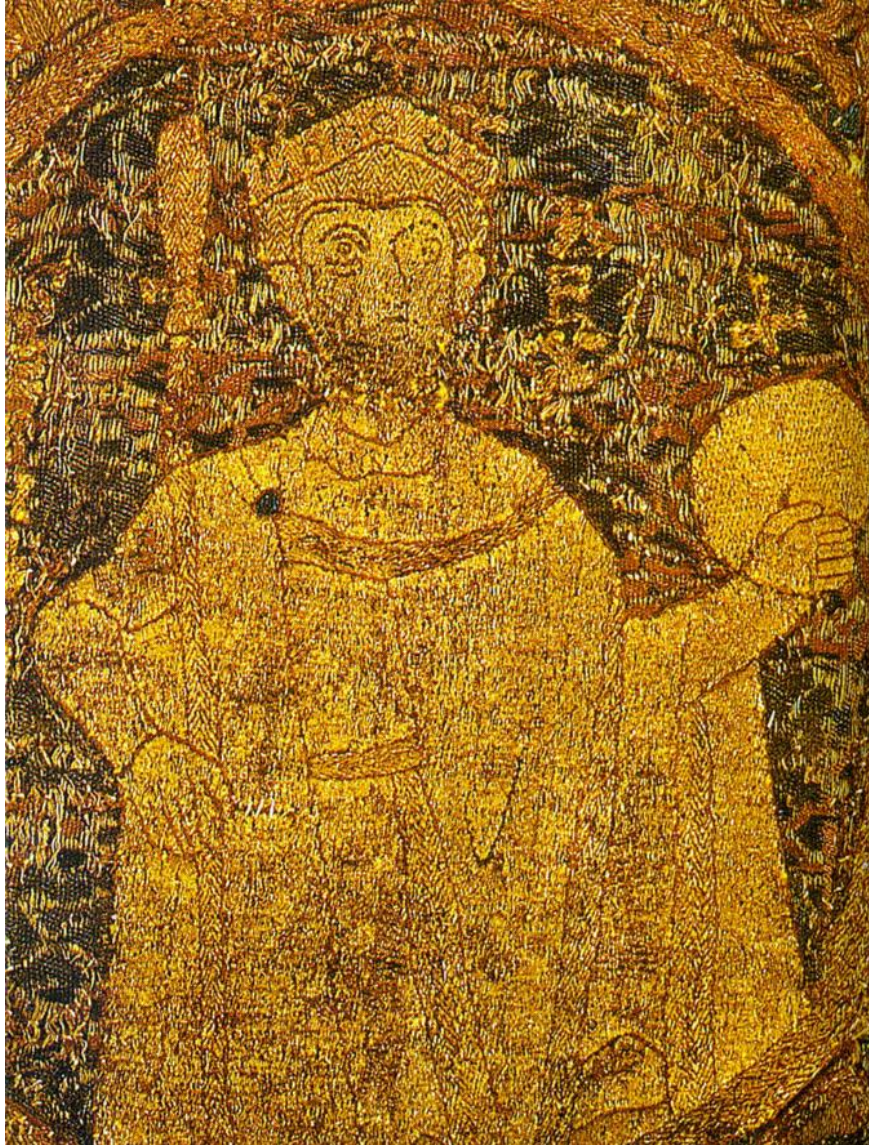
Sv. Štefan (opus anglicum, 1031)

opus antiquum - murivo z lomového kameňa