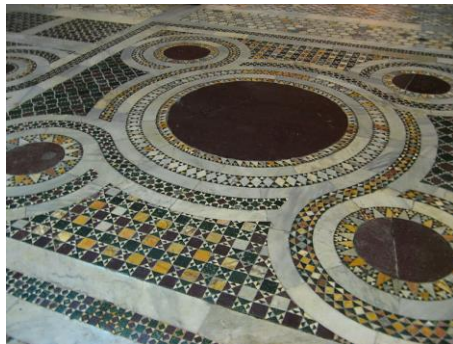
dlážková mozaika Baziliky „Svätého Kríža v Jeruzaleme“ v Ríme