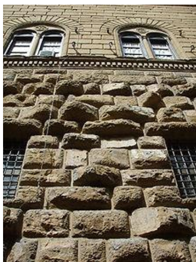
Palazzo Medici-Riccardi, Florencia

www: od rus – „pole“; opus rusticum, vidiecke, sedliacke murivo, znamená murivo z veľkých a na vonkajšej strane neopracovaných alebo nahrubo opracovaných (bosovaných) kvádrov; rustiko zdôrazňuje škáry medzi kameňmi, takže murivo pôsobí mohutným plastickým dojmom; užívalo sa v starovekom rímskom stavitelstve a v stredoveku, najmä u pevnostných stavieb, v renesancii, v baroku, aj 19. storočia hlavne pre prízemí palácov a reprezentačných budov; slovo rustika, rustiko sa používa často synonymne sa slovom bosáž