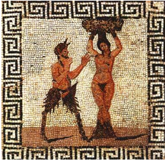
Pan a Hamadryada (grécka mozaika, Pompeje)

opus caementicium - murivo liate/ opus emplectum zo zmesi podobnej betónu , z kamenných úlomkov a malty ďalej pozri emplekton ; pozri Koloseum