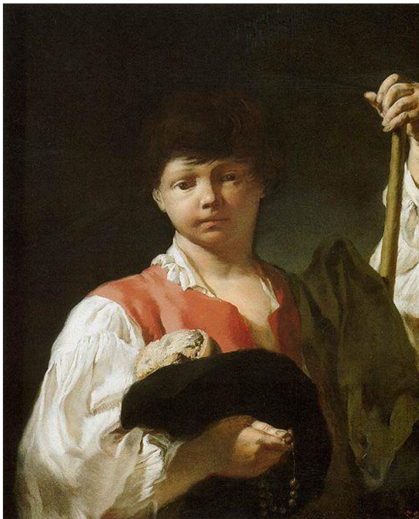
G. B. Piazzetta: Žobravý chlapec (1725-1730)