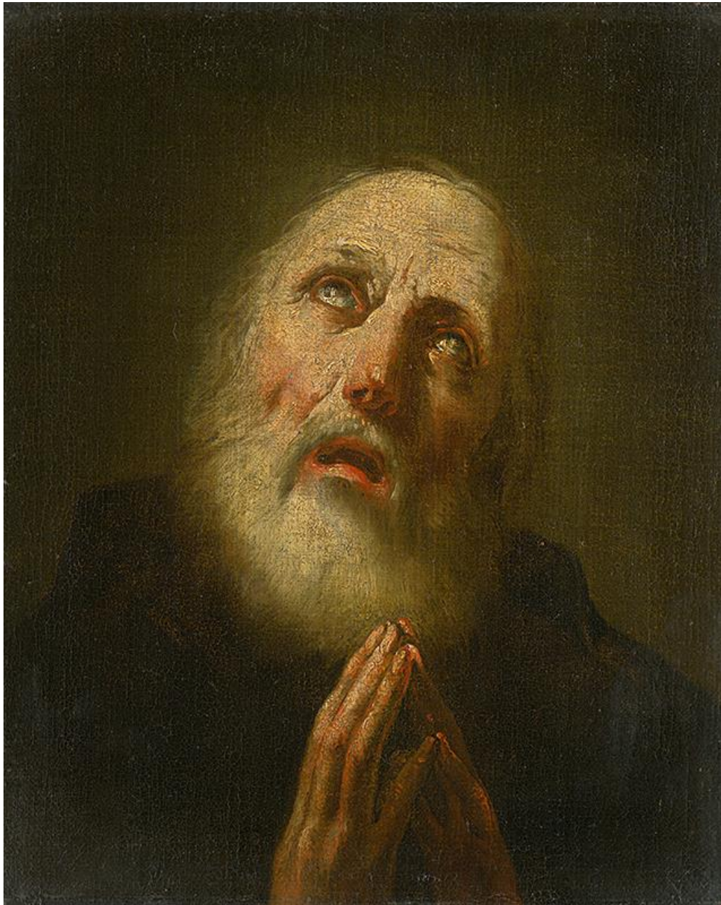
G. B. Piazzetta (autor predlohy): Svätý František z Pauly (1700-1750)