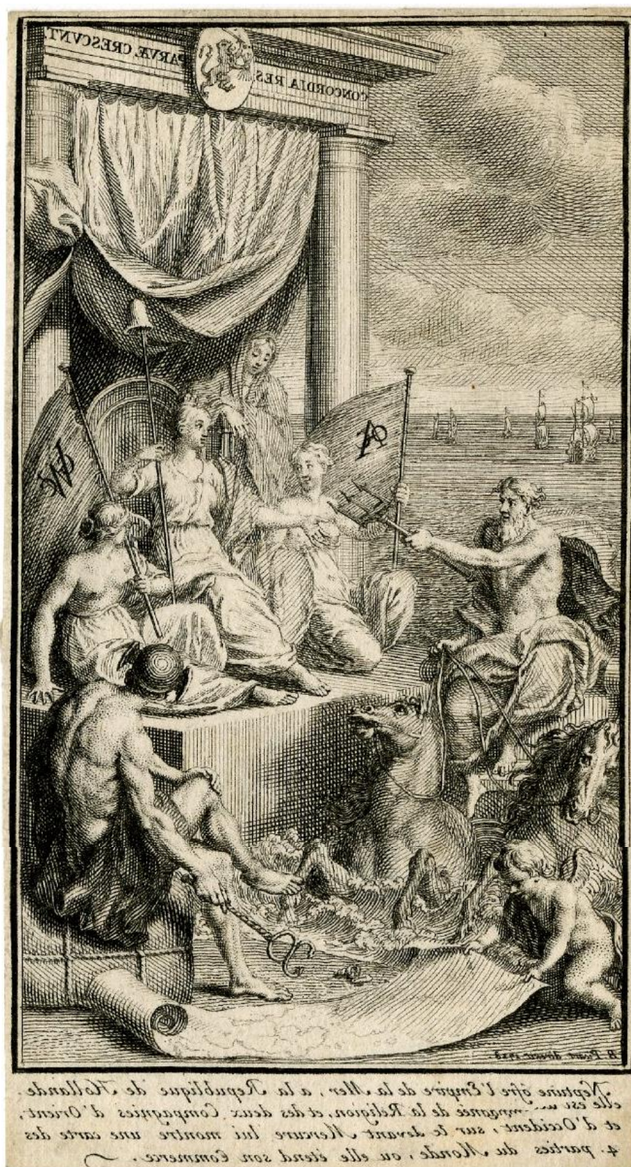
B. Picart: Neptún skladá hold Holandsku. Alegória holandskej námornej nadržadenosti (1728)