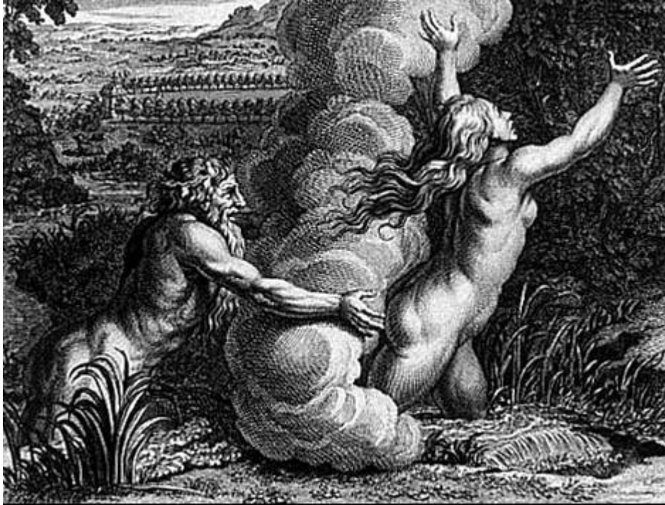
B. Picart: Alfeus s pokúša chytiť Aretuzu (rytina, 17.-18.st.)

Picardia/Pikardia - oblasť v severnom Francúzsku ; v staroveku osídlená belgickými Keltmi ; od 1.st. súčasť rímskej Gallie ; v 5.st. ovládnutá Frankami ; v rámci Franskej ríše súčasť Neustrie; v 9.st. útoky Normanov , v 10.st. pod vplyvom grófstva Flámska a Vermandois ; za francúzskeho kráľa Filipa II. Augusta pod kráľovskou správou; počas storočnej vojny dobytá Angličanmi, 1434-77 čiastočne ovládaná vojvodami burgundskými; pozri Eligius