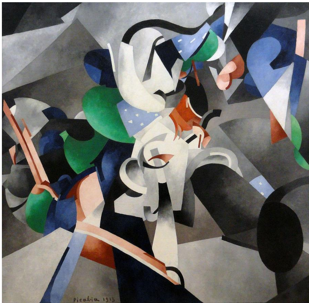
F. Picabia: Udnie. Mladá americká tanečnica (1913)