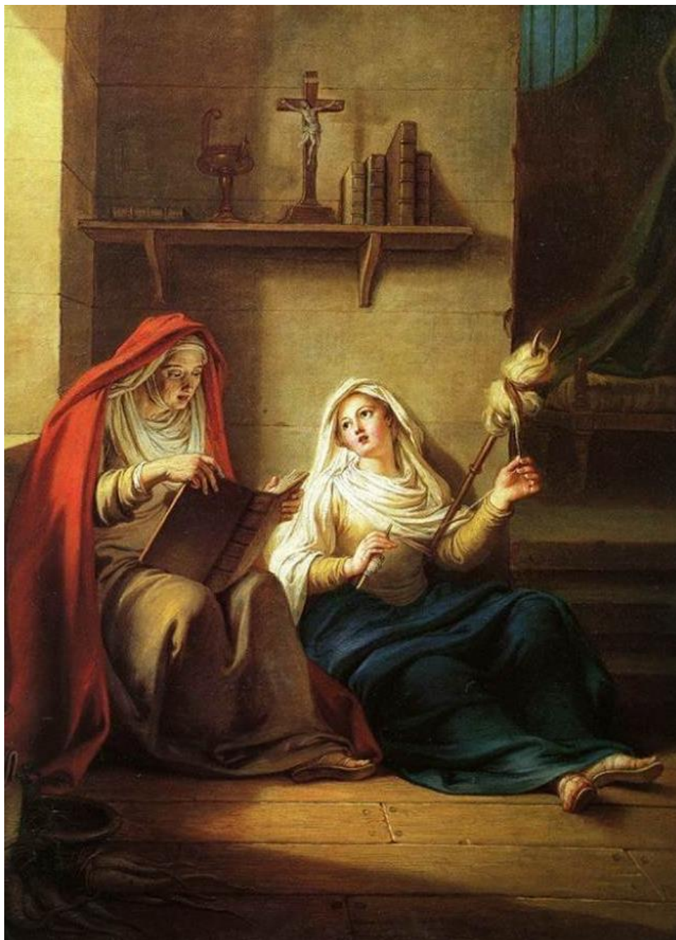
Ch.-A. Coypel: Sv. Piamun a jej matka v egyptskej dedine (1747)

piano nobile - tiež vznešené poschodie/krásne poschodie/beletáž ; hlavné podlažie (zvyčajne prvé poschodie) barokového zámku , talianskych palácov , s ústrednou reprezentačnou sálou vyššou ako ostatné, niekedy do výšky dvoch poschodí s dvoma radmi okien nad sebou, často oválneho pôdorysu s kupolou ; piano nobile niekedy vystupuje plochým alebo valcovým rizalitom z priečelia; porovnaj arkádový dvor