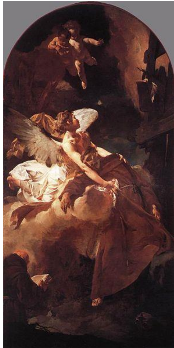
G. B. Piazzetta: Nanebovzatie Panny Márie (1735) G. B. Piazzetta: Extáza sv. Františka (1729)