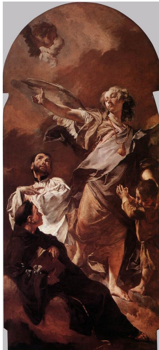
G. B. Piazzetta: Traja dominikánski svätci (1738)