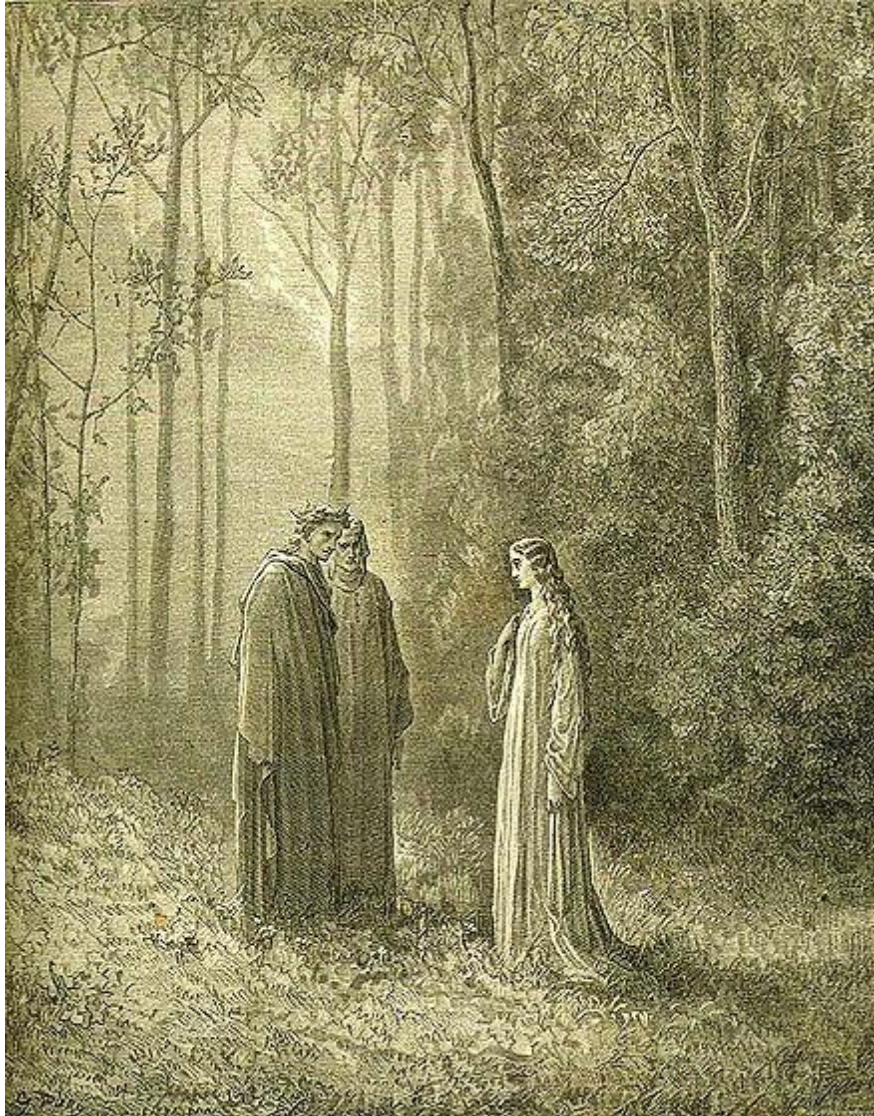
G. Doré: Pia de Tolomeo (Božská komédia, Purgatorio, 19.st.)