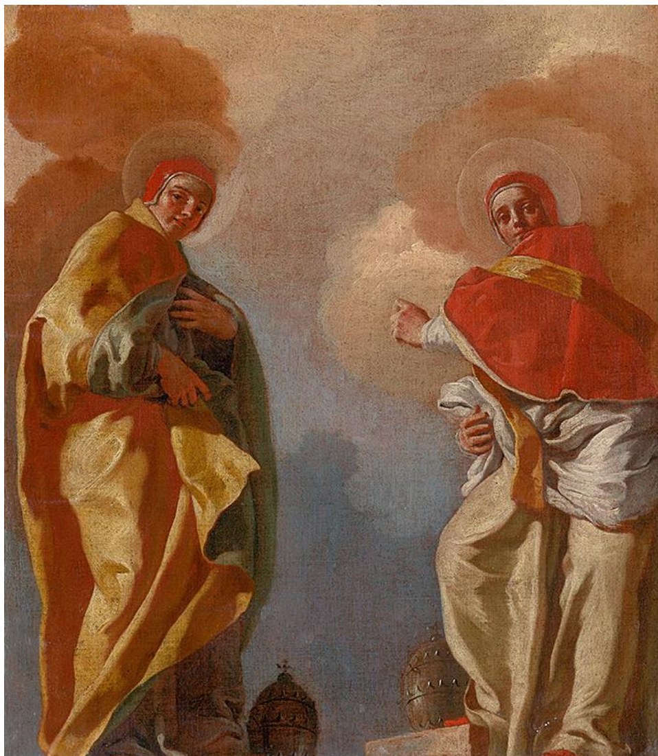
G. B. Piazzetta (pôvodne Severotaliansky maliar z 2. polovice 18.storočia): Figurálny výjav - Dvaja pápeži (1750-1800)

Picabia Francis - pozri kubizmus, abstraktné umenie