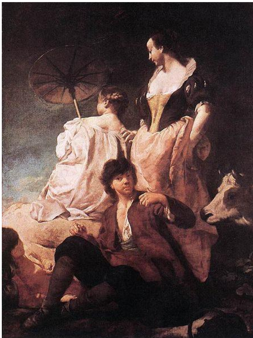
G. B. Piazzetta: Idyla na pobreží (1741)