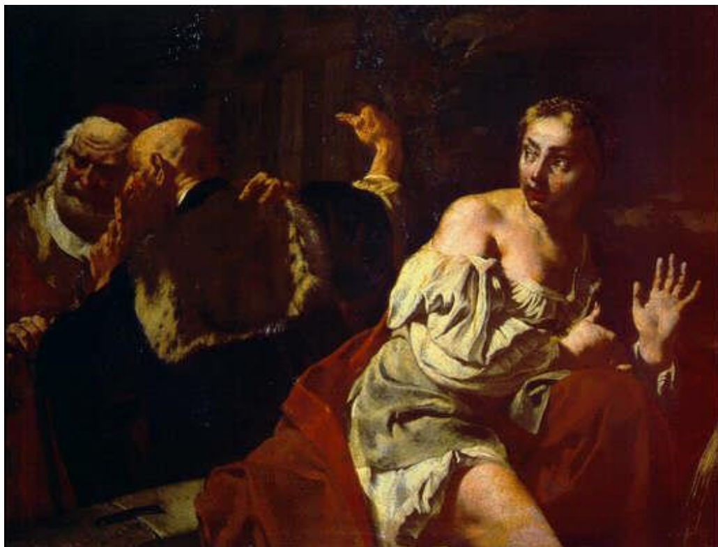
G. B. Piazzetta: Zuzana a starci (18.st.)