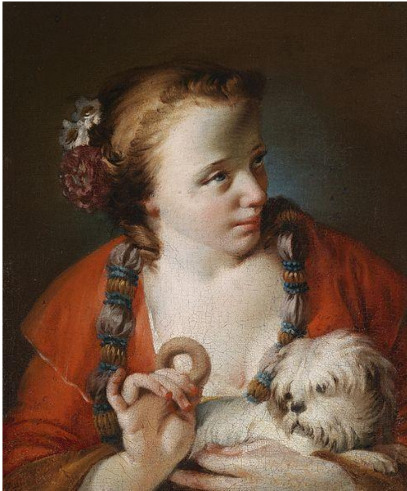
G. B. Piazzetta: Mladá žena so psom (18.st.)