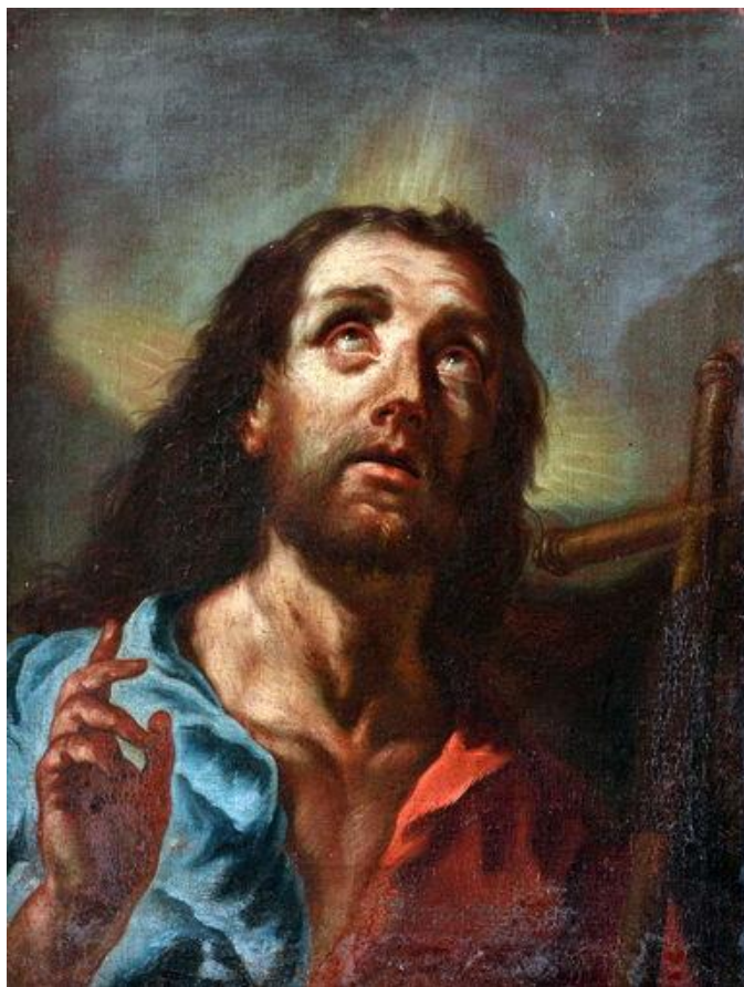
G. B. Piazzetta: Triumfujúci Kristus (1752)