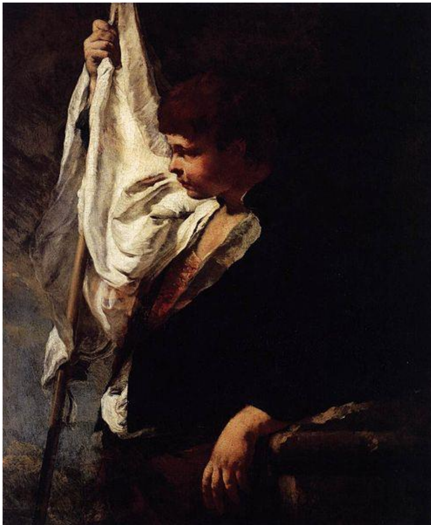
G. B. Piazzetta: Mladý zástavník (1742)