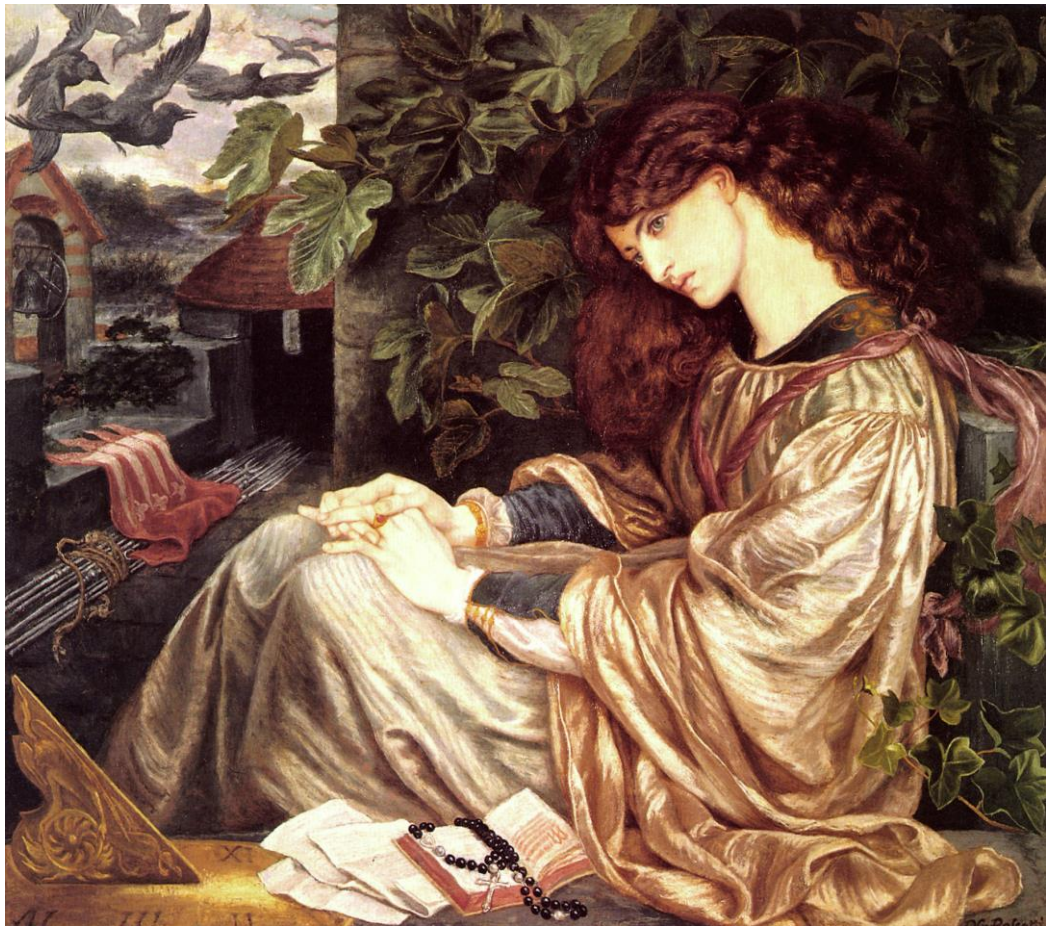
D. G. Rossetti: La Pia de Tolomei (1868-1880)

https://www.google.sk/search?q=Dante:+Pia&espv=2&biw=1858&bih=995&tbm=isch&imgil=fZhC0yYvhD6cWM%253A%253B3AT6I_r3HfbAJM%253Bhttp%25253A%25252F%25252Fartmi ght.com%25252Fartists%25252FRossetti-Dante-Gabriel%25252FDante-Gabriel-Rossetti-La-Pia-De-247540p.html&source=iu&pf=m&fir=fZhC0yYvhD6cWM%253A%252C3AT6I_r3HfbAJM%252C_&usg=-i8hEwqCj8sldXSSa6Xh45pP0q8%3D&ved=0CEsOyjc&ei=OAqIVJKpGMAyWOOyIGoCw#facrc=&imgdii=&imgrc=fZhC0yYvhD6cWM%253A%253B3AT6I_r3HfbAJM%253Bhttp%253A%252F%252Fartmight.com%252Falbums%252F2011-02-07%252Fart-upload-2%252Ffr%252FRossetti-Dante-Gabriel%252FDante-Gabriel-Rossetti-La-Pia%252C-De.jpg%253Bhttp%253A%252F%252Fartmight.com%252Fartists%252FRossetti-Dante-Gabriel%252FDante-Gabriel-Rossetti-La-Pia-De-247540p.html%253B1008%253B676