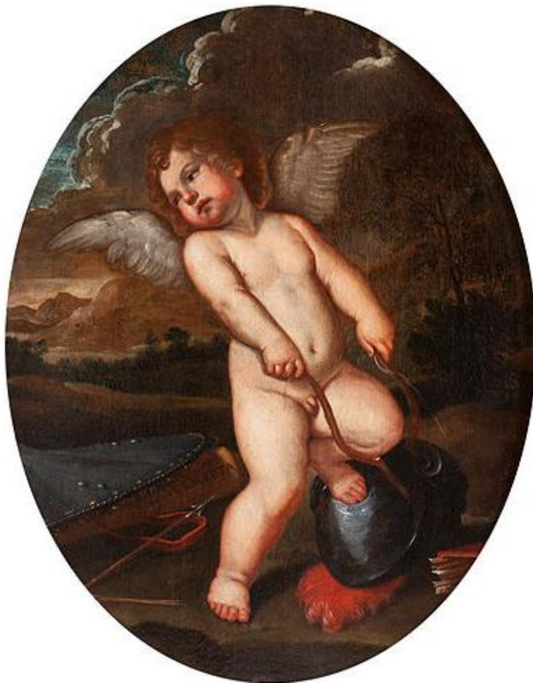
F. Albani: Putti rozbíja nástroje Minervy (17.st.)