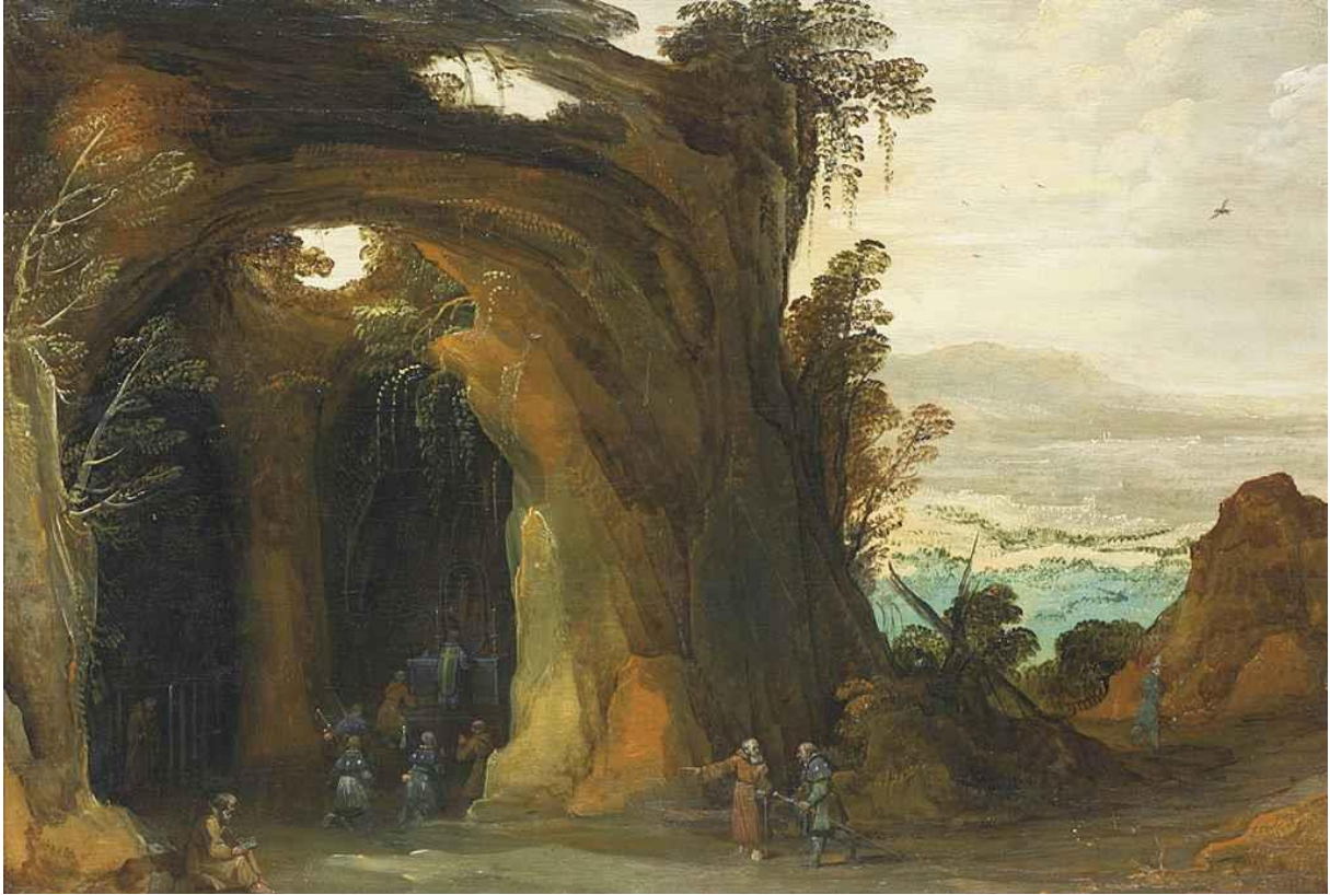
J. de Momper II : Krajina s pútnikmi (17.st.)