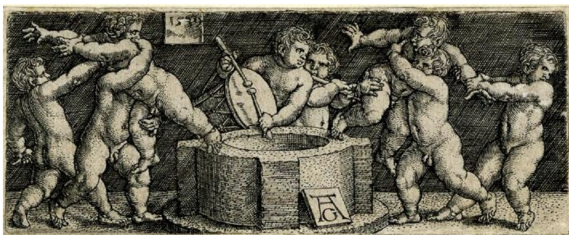
H. Aldegrever: Osem putti hrajúcich a bojujúcich okolo studne (1539)