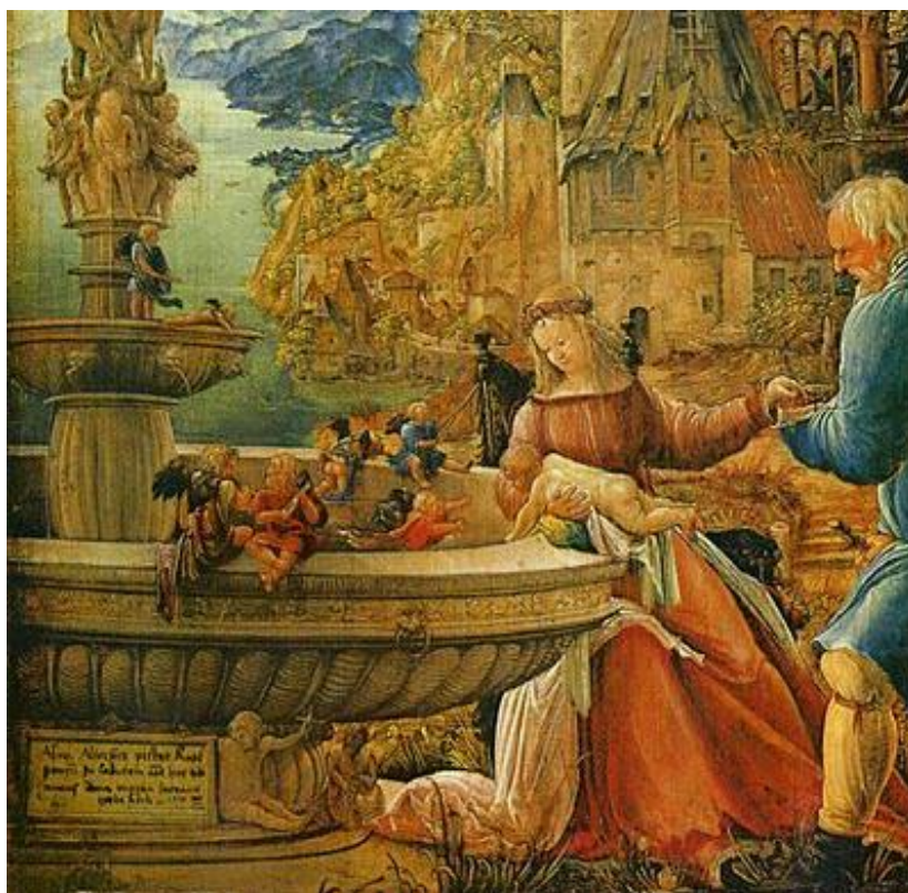
A. Altdorfer: Odpočinok na úteku do Egypta (1510)