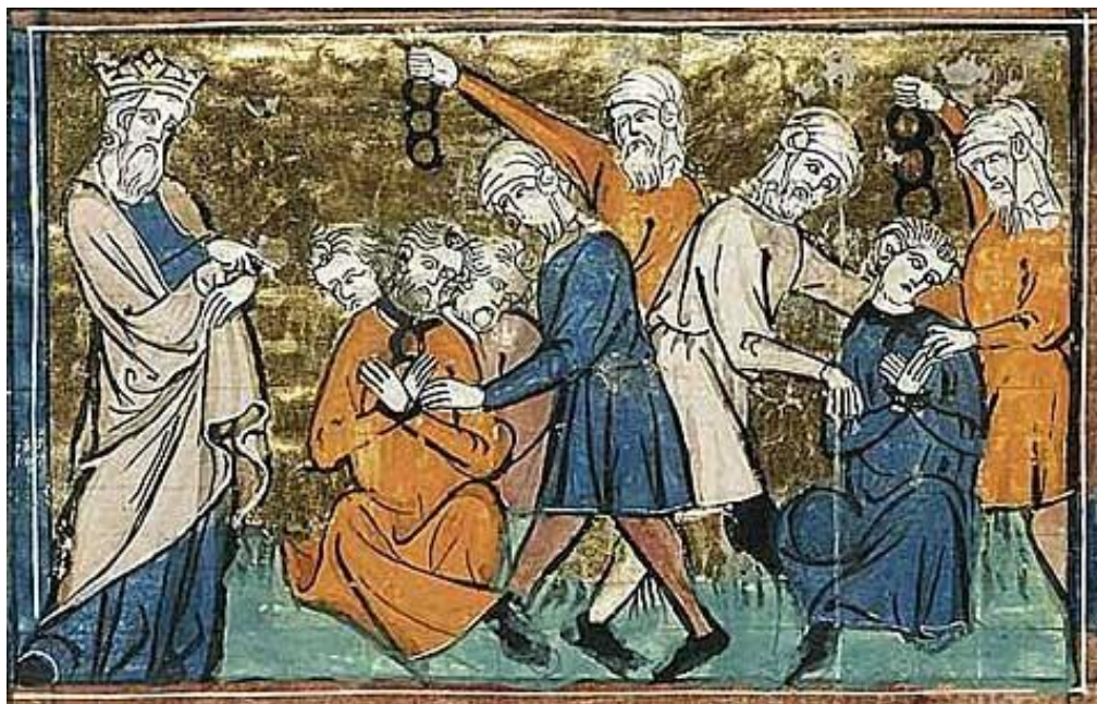
Anonym: Saladin a kresťanskí väzni. Emir Saladin nariadil popravu zajatcov po víťazstve pri Hattínu v roku r. 1187 (iluminácia z „Roman de la Rose“, 1337)