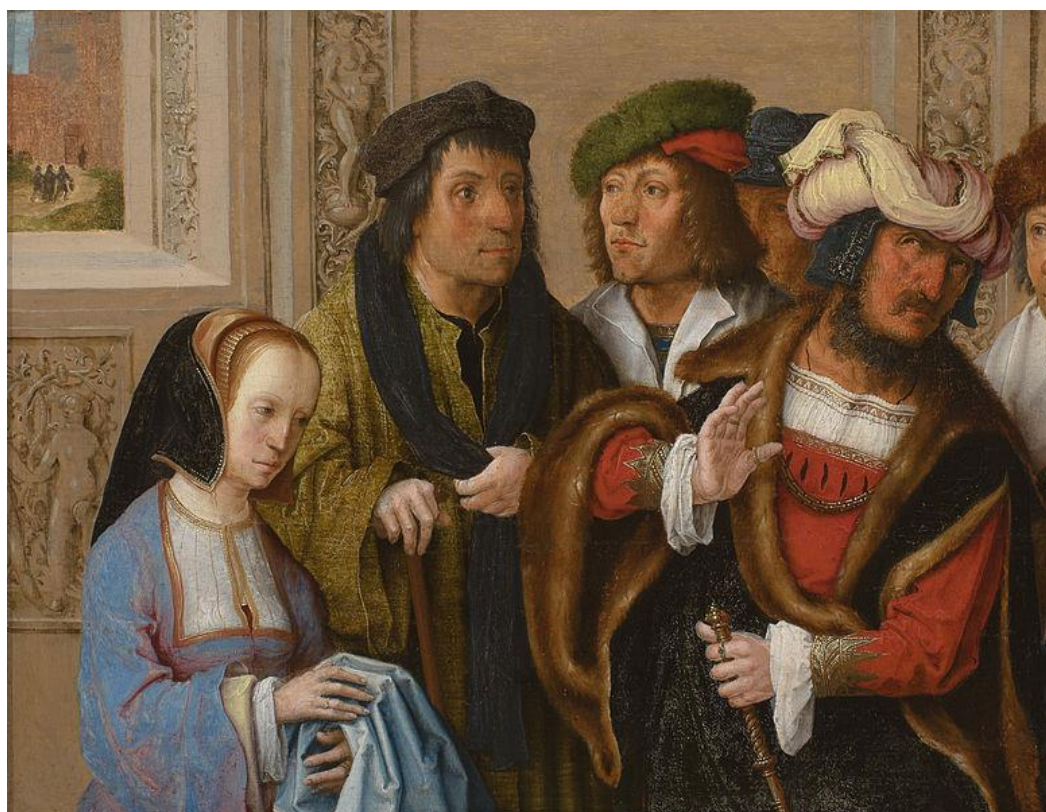
L. van den Leyden: Putifarova žena ukazuje Jozefov plášť (1512)

Putifar/Pótifar - - egyptský hodnostár, ktorému synovia praotca Jákoba predali svojho brata Jozefa ; keď Jozef odolal zvädzaniu Putifarovej ženy, tá ho ohovorila u svojho manžela: ako dôkaz priniesla Jozefov plášť; porovnaj príbeh Anteie/Sthenoboie , manželky kráľa Proita alebo Hippolyty a Pelea ; pozri biblia; Jozef Egyptský