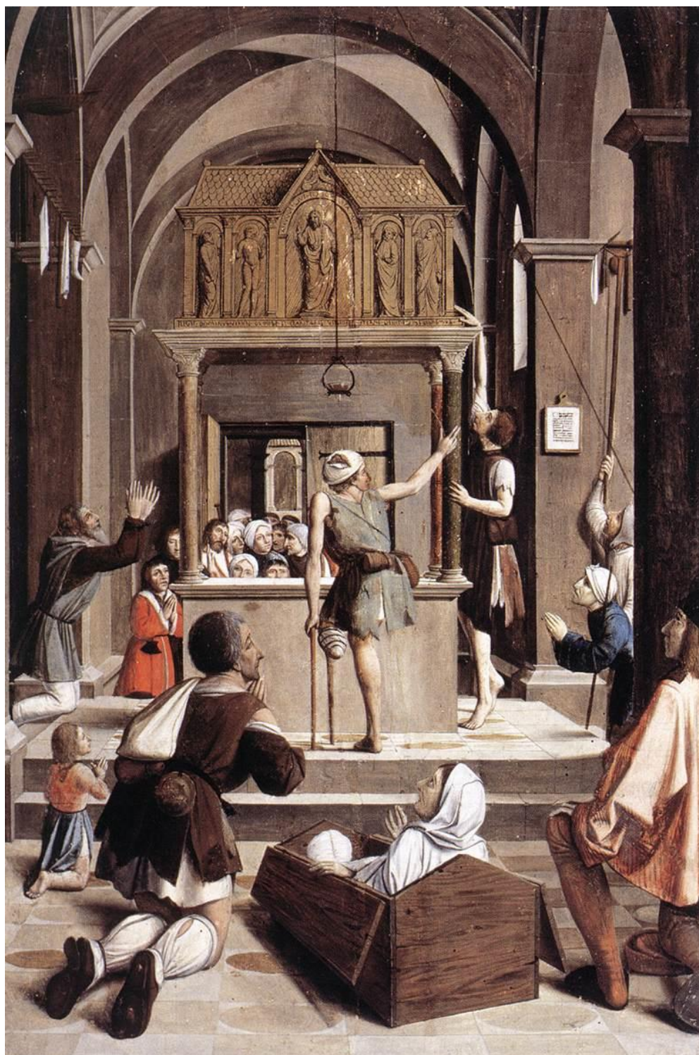
J. Lieferinxe: Pútnici pri truhle sv. Šebastiána (15.st.)