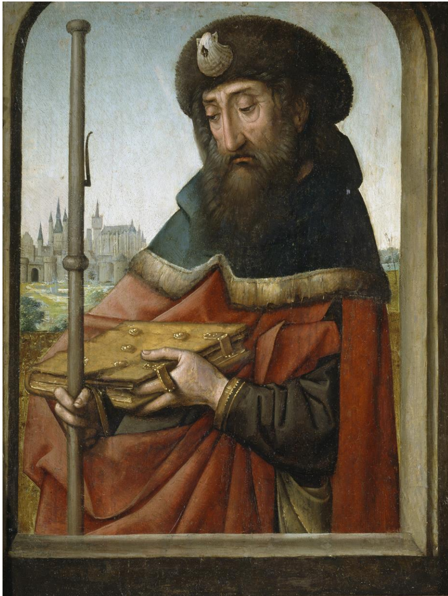
J. de Flanders: Santiago Peregrino (1507)