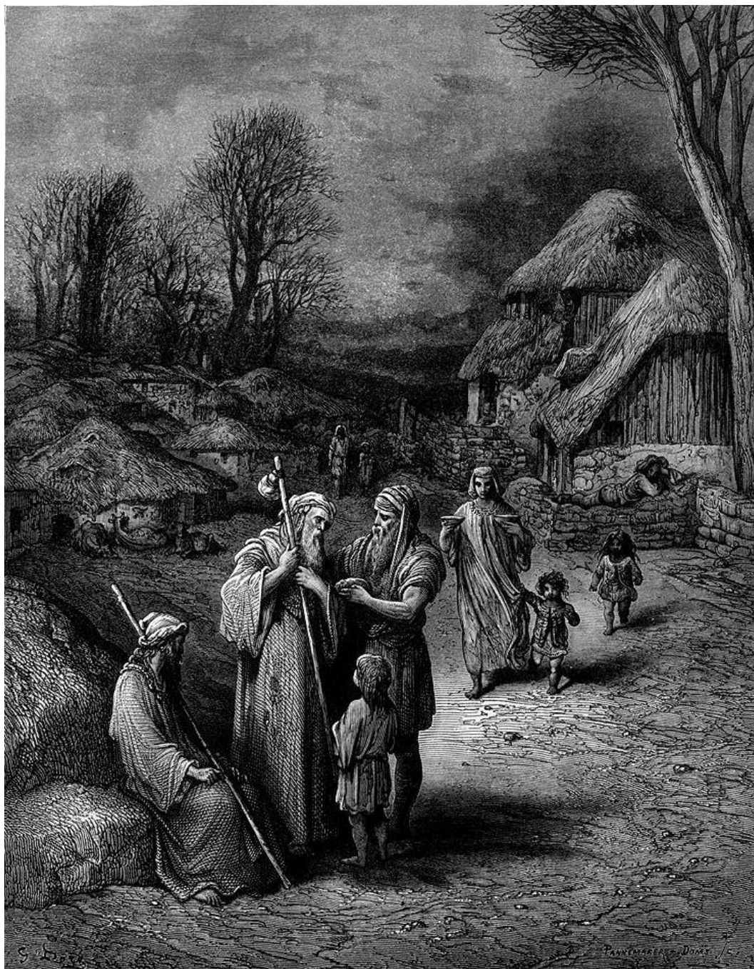
G. Doré: Pohostinnosť barbarov k pútnikom do svätej zeme (19.st.)