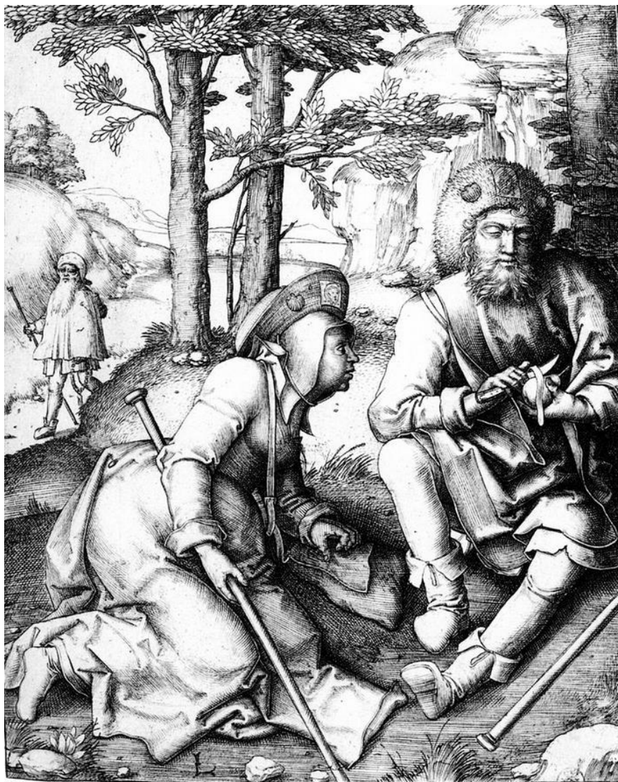
L. van Leyden: Odpočívajúci pútnici (16.st.)