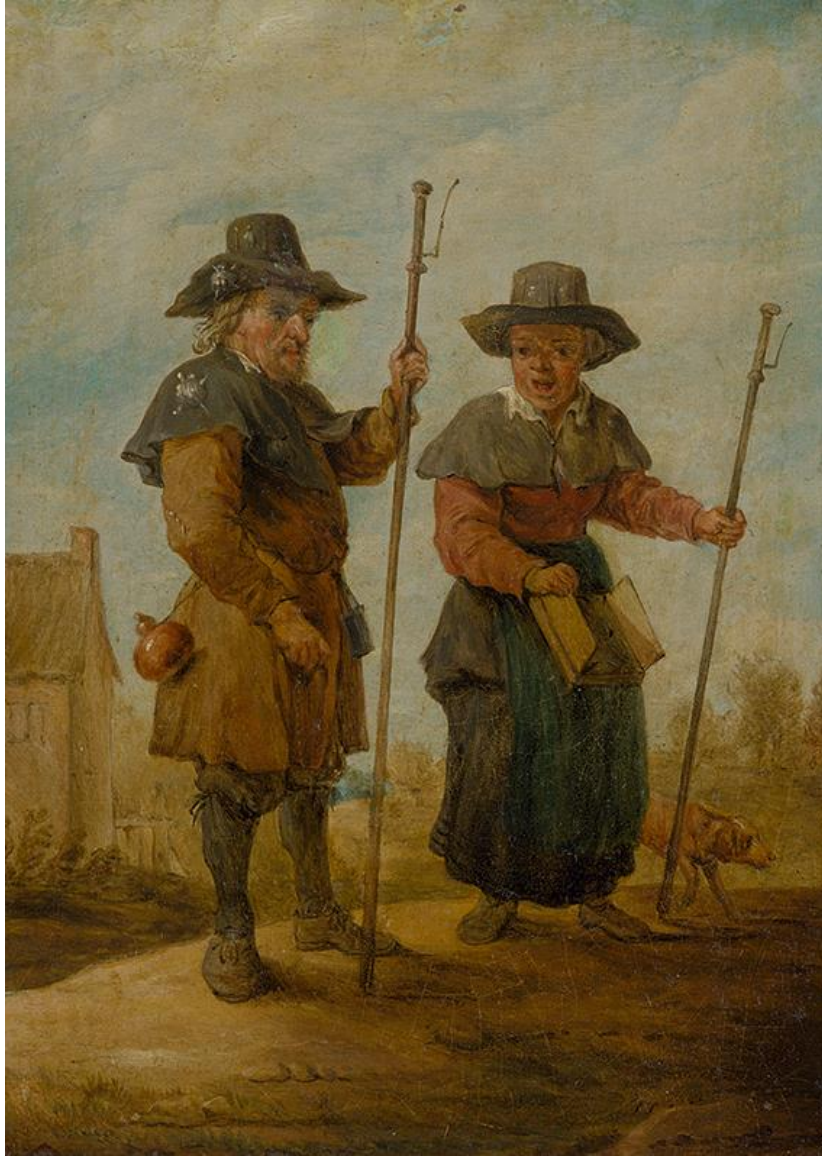
Nemecký maliar z 18.storočia, Holandský maliar z 18.storočia podľa D. Teniers ml.: Pútnici (18.st.)