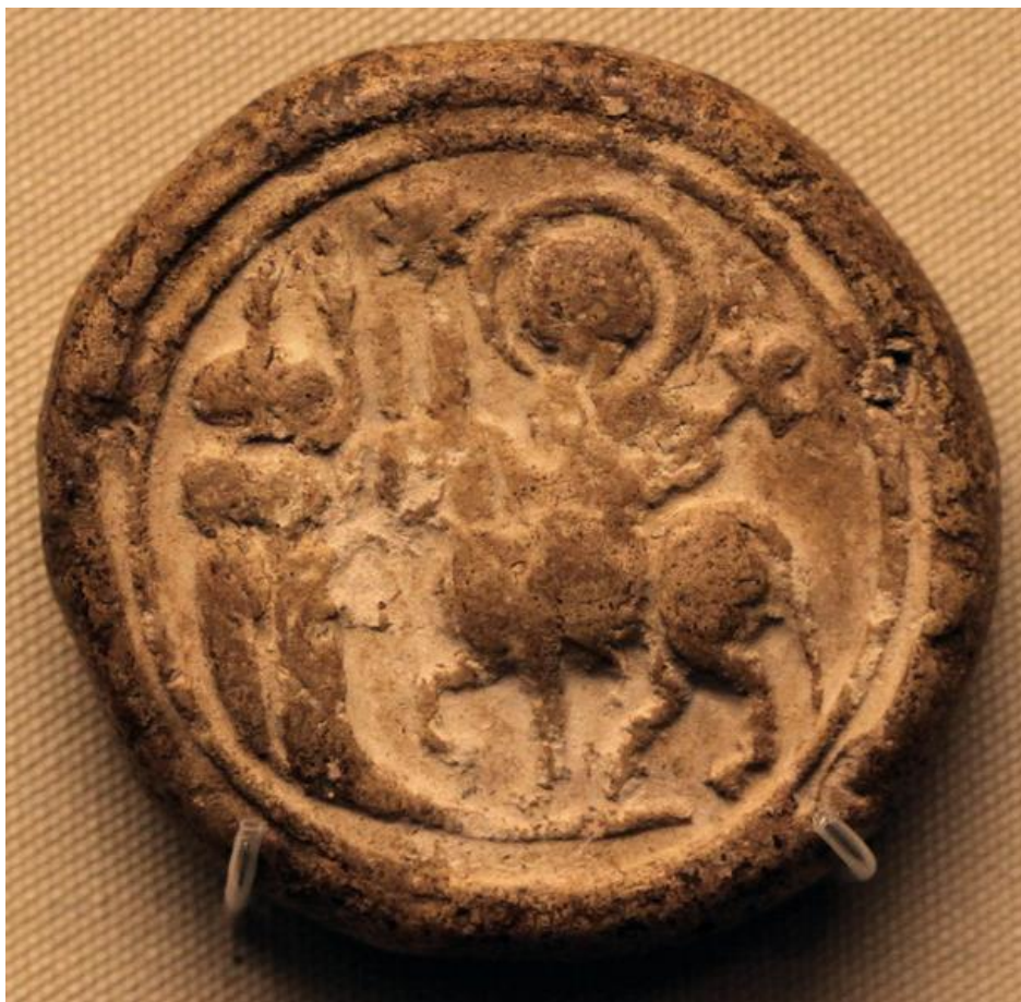
Vstup do Jeruzalemu (terakotové pútnické znamenie zo Svätej zeme, 6.st.)