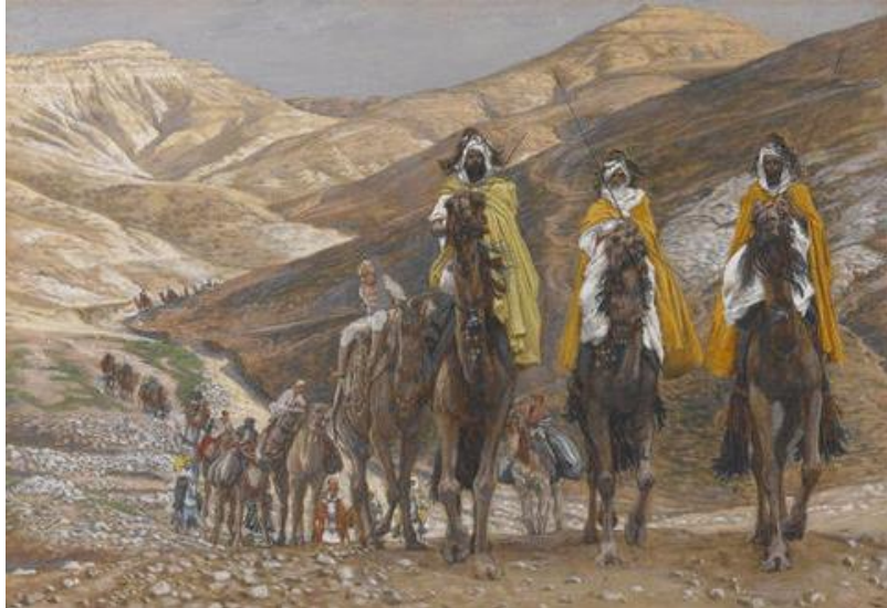
J. Tissot: Putovanie mágov

Putovanie Židov v púšti - pozri manna , Židia