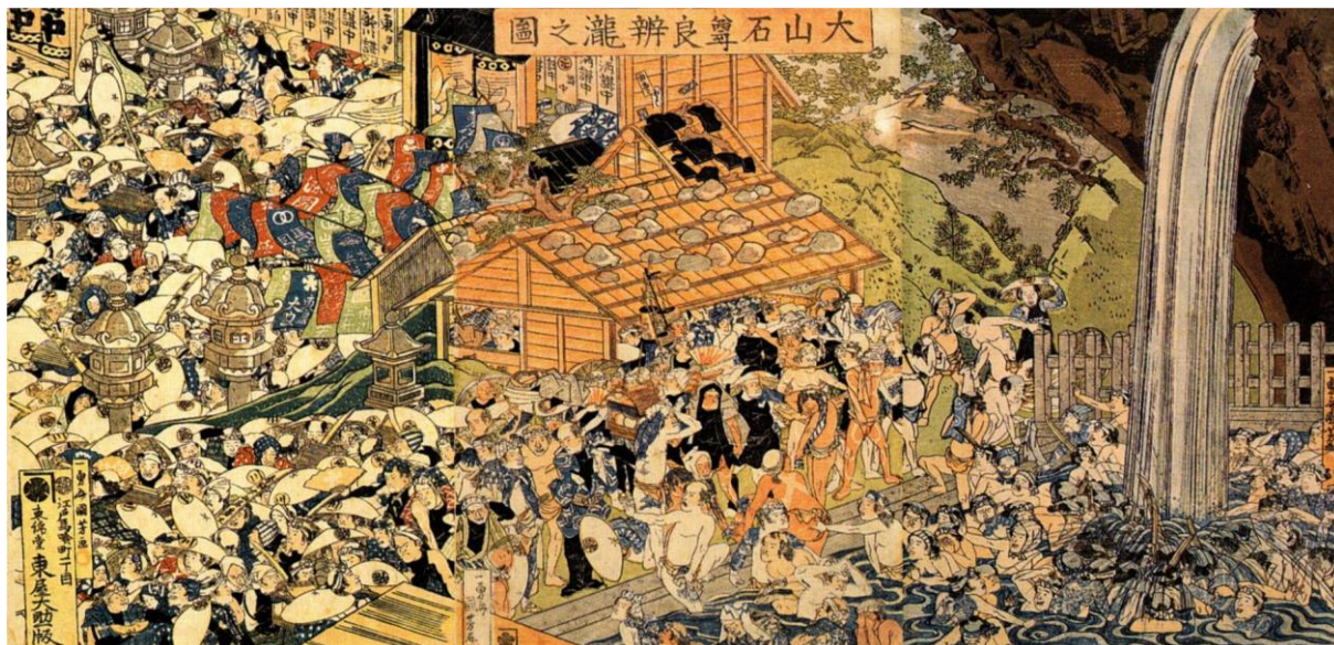
Utagawa Kuniyoshi: Pútnici pri vodopáde Oyama (19.st.)