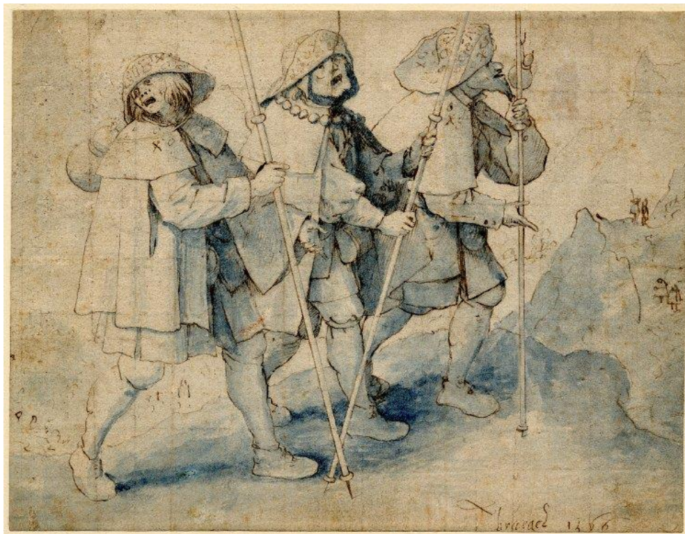
P. Bruegel st.: Traja slepí pútnici (16.st.)