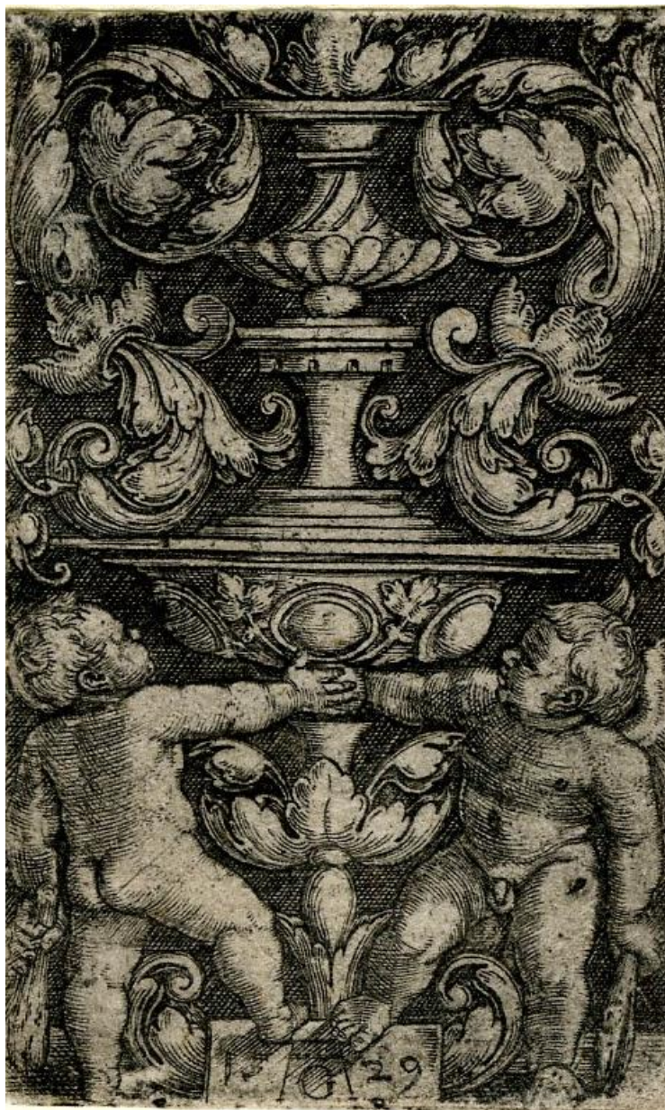
H. Aldegrever: Dvaja putti držiaci svietnik (1529)