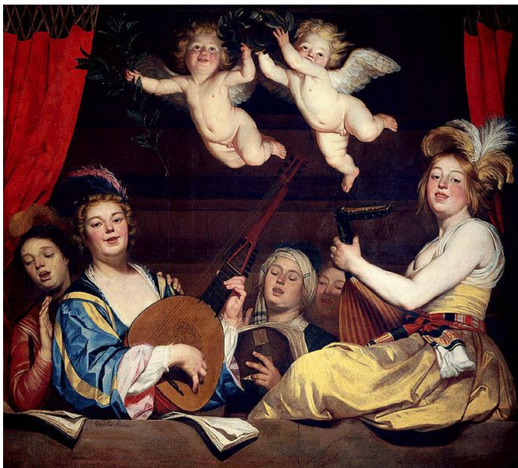
G. van Honthorst: Koncert (1624)