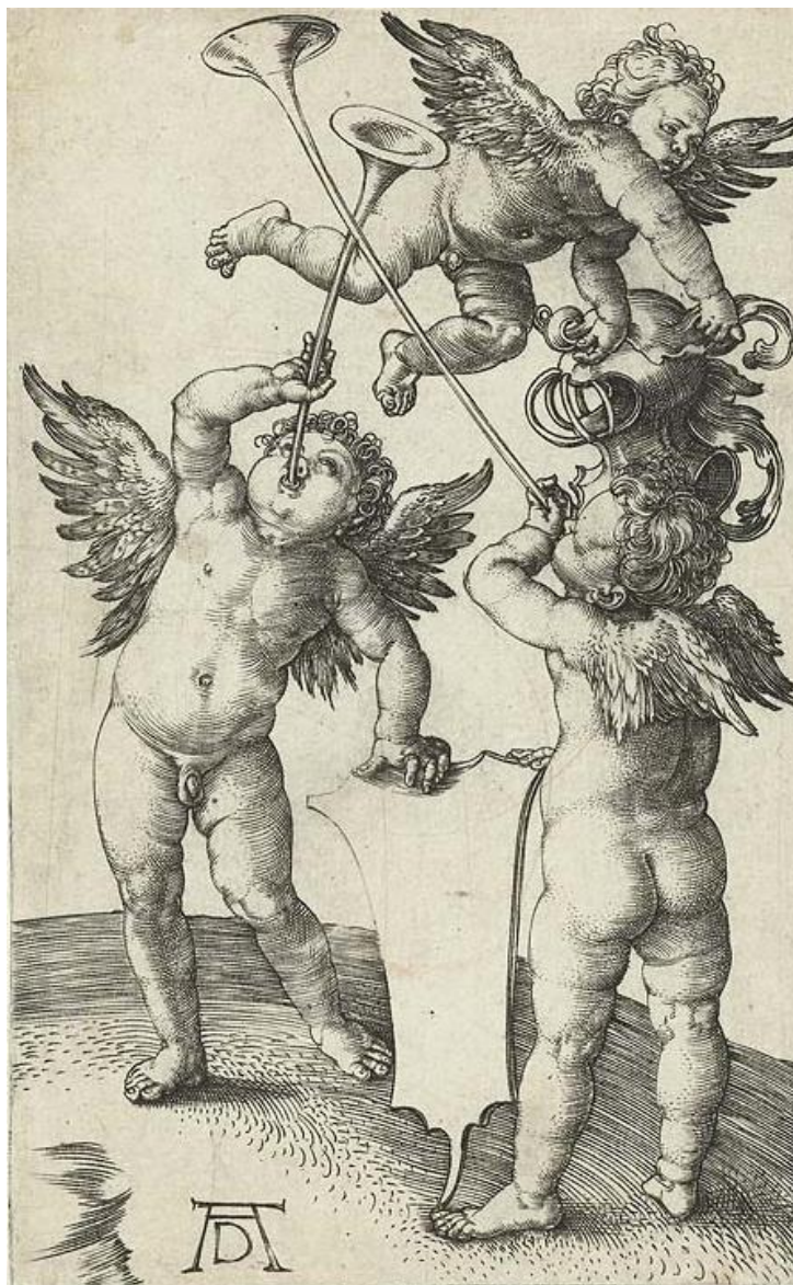
A. Dürer: Traja putti, štít a helma (medirytina, 1498-1502)