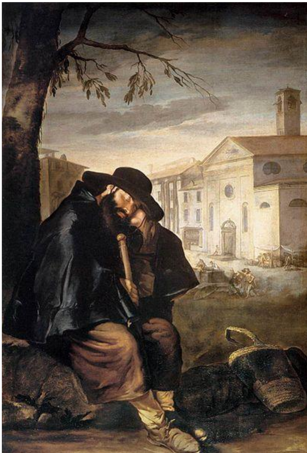
G. Ceruti: Spiaci pútnik (1740-1745)