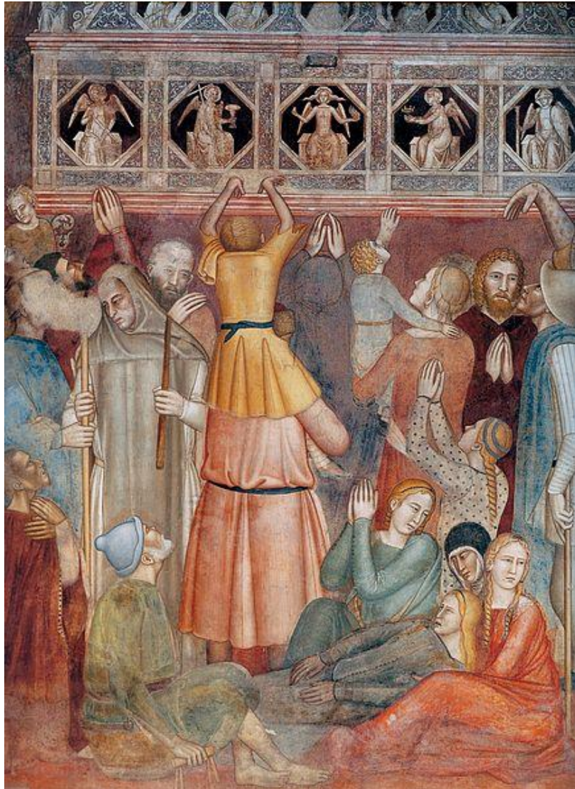
A. Bonaiuto: Výjavy zo života sv. Petra Mučeníka (freska z kostola Santa Maria Novella, 1366-7)

http://fr.wikipedia.org/wiki/P%C3%A8lerinage_de_Saint-Jacques-de-Compostelle