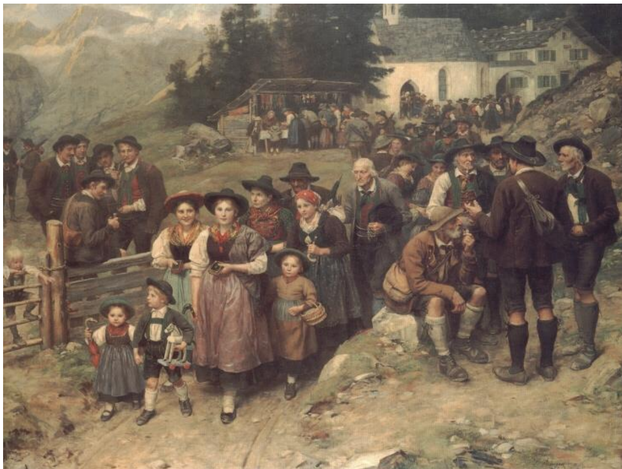
F. Defregger: Tirolskí pútnici (1921)