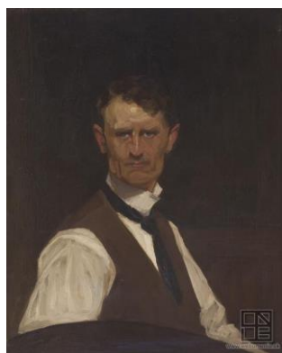
E. Putra: Žena pri okne