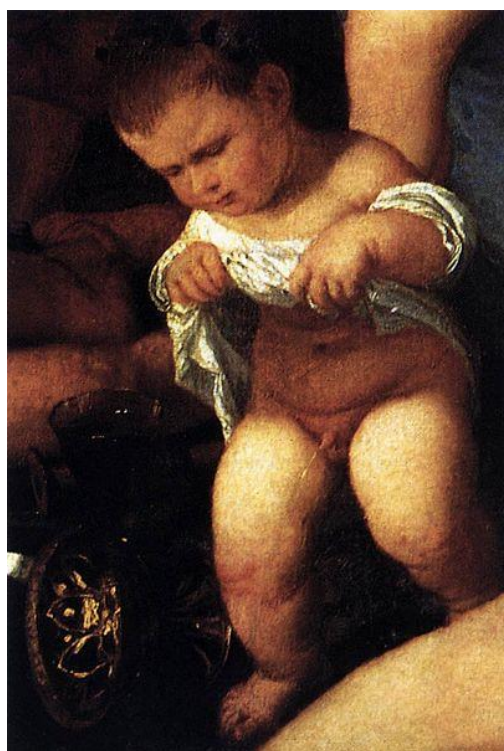
Tizian: Putto (detail z obrazu „Bakchanalie Ariadny“, 16.st.)