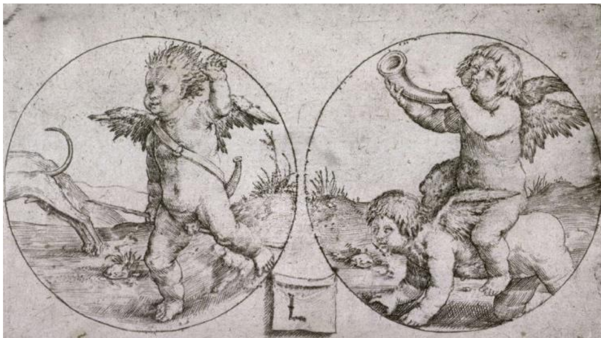
L. van Leyden: Lov detí (rytina, 16.st.)