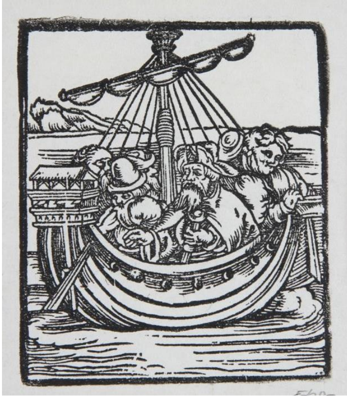
Neznámy autor: Púť do sv. zeme (1501-1600)