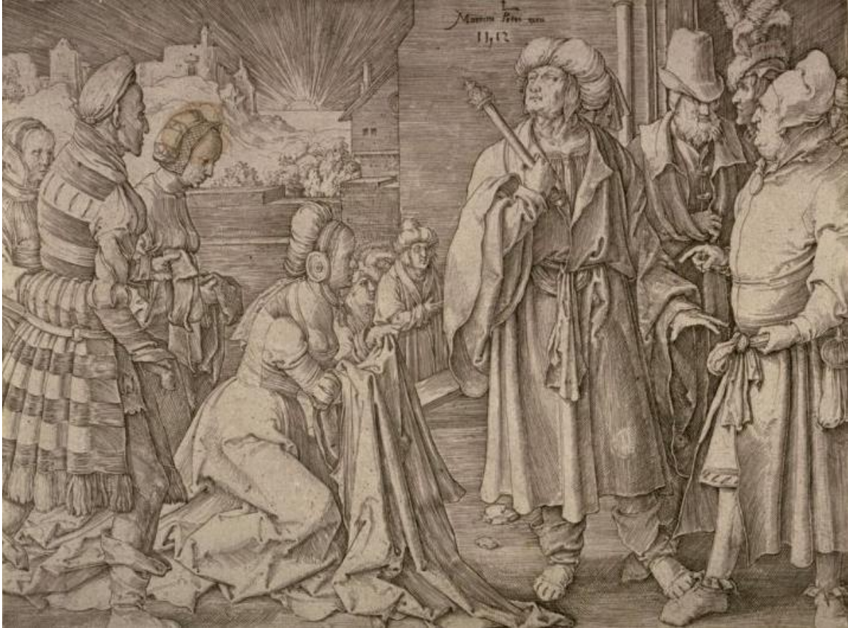
L. van Leyden: Putifarova manželka obviňuje Jozefa (rytina, 1512)