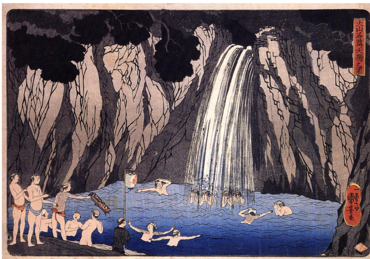
Utagawa Kuniyoshi: Pútnici pri vodopáde (19.st.)