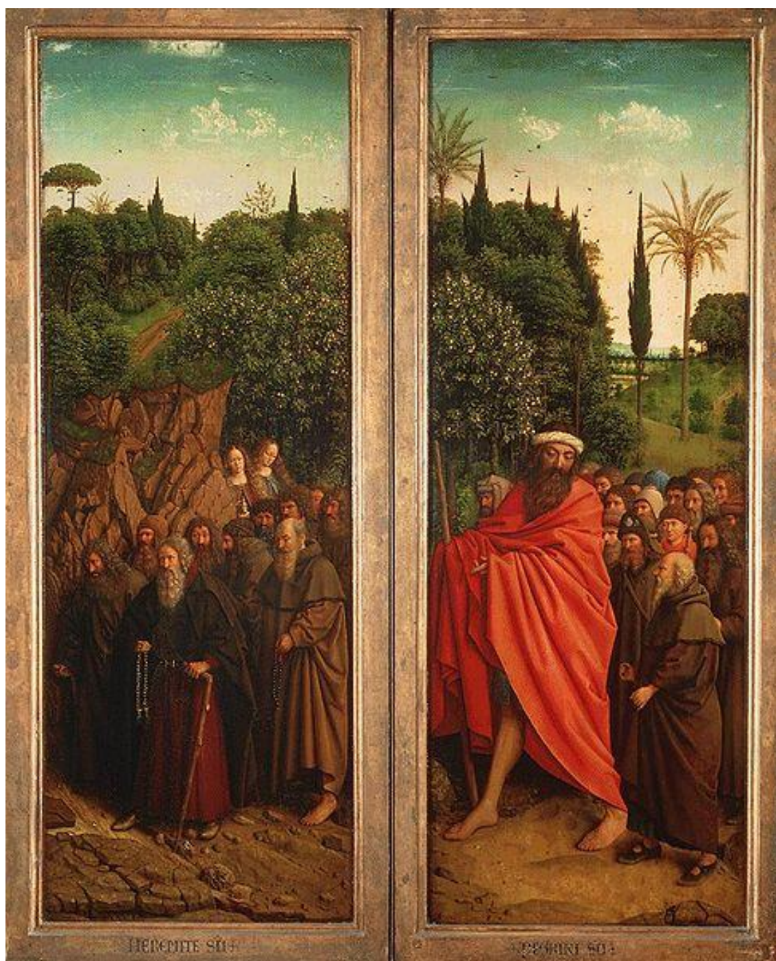
Ján van Eyck: Pútníci a pustovníci (Gentský oltár, ľavé krídlo, 1432)