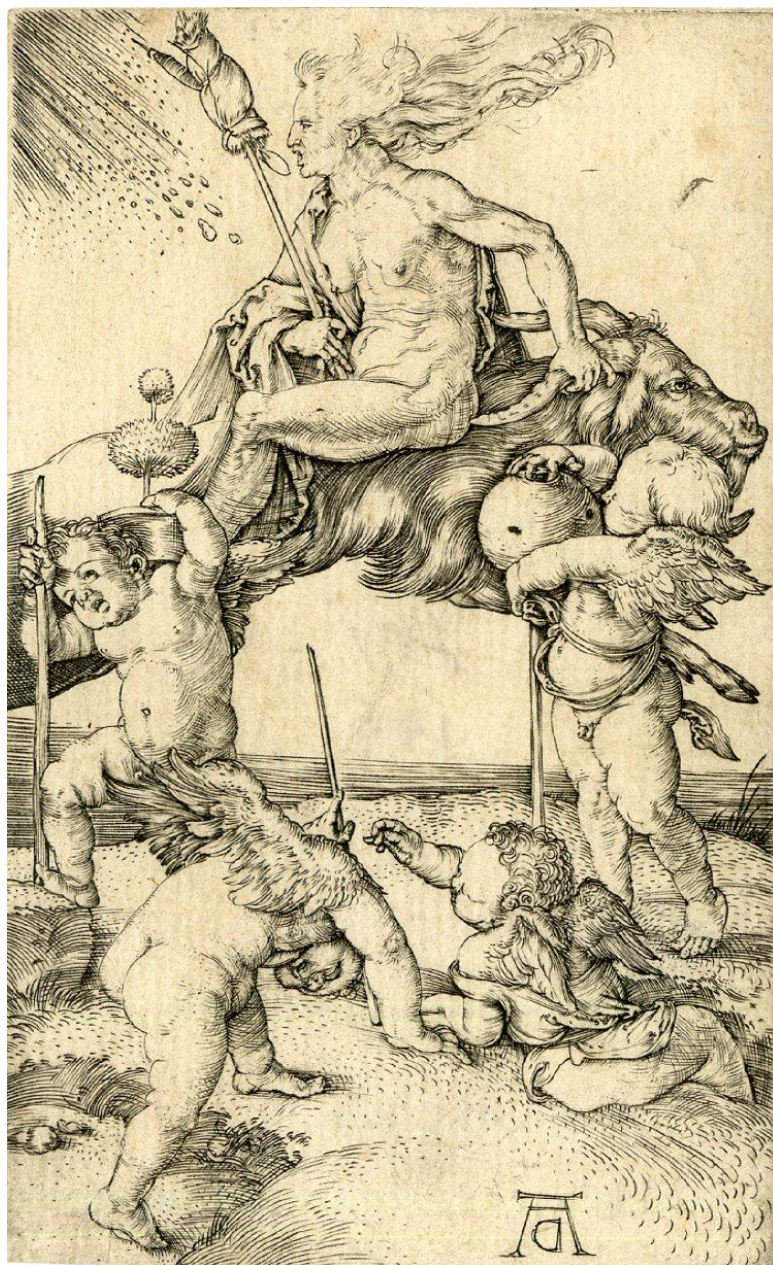
A. Dürer: Čarodejnica (1500)