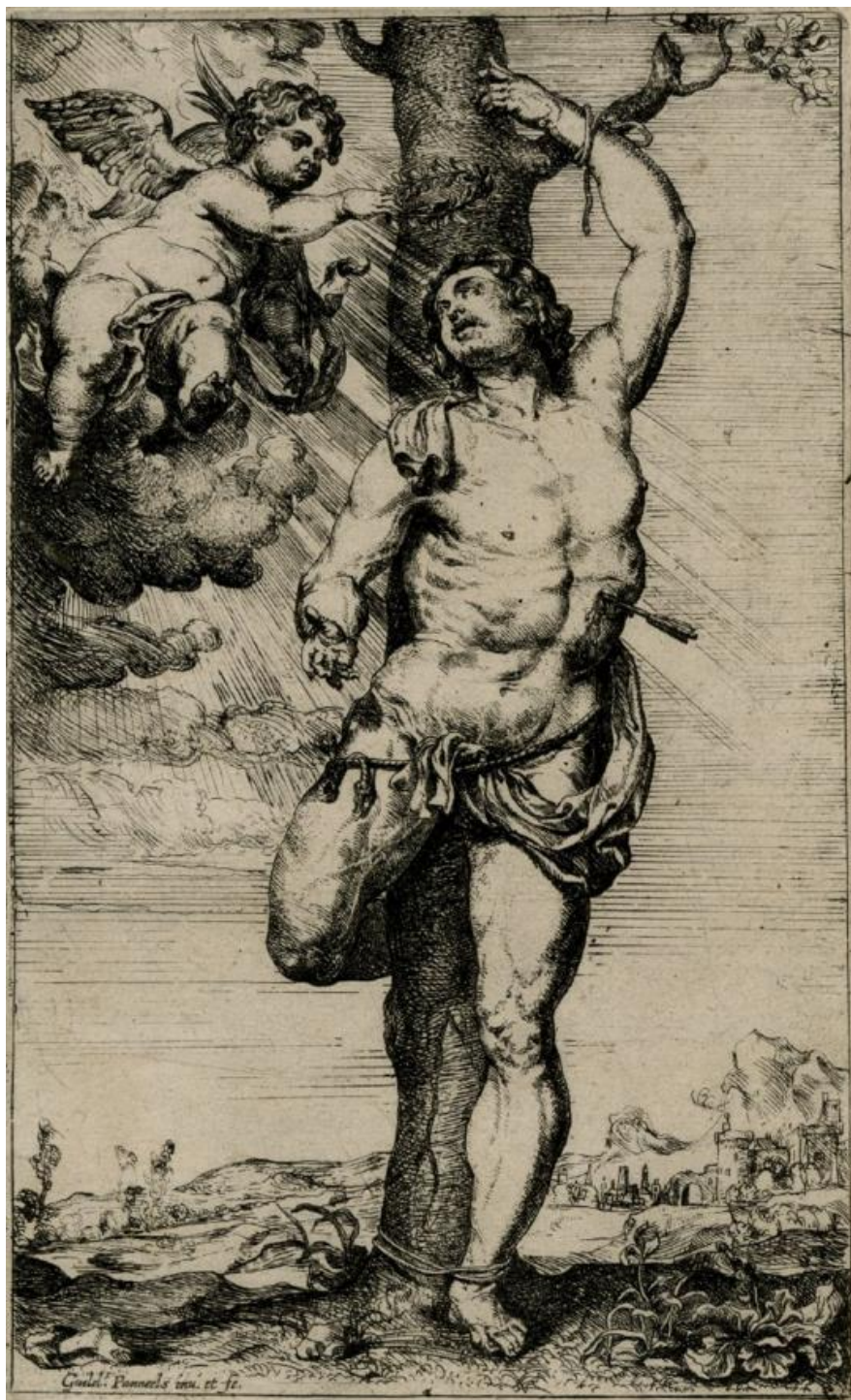
W. Panneels podľa P. P. Rubensa: Sv. Šebastián priviazaný ku stromu a korunovaný putti (lept, 1631)