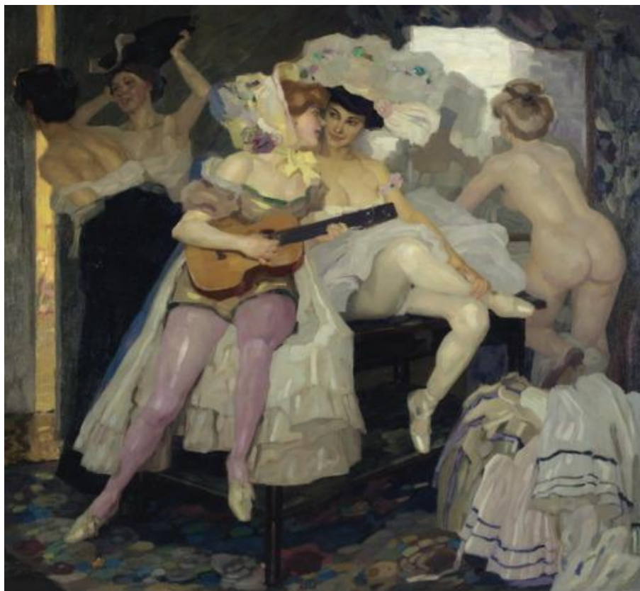
L. Putz: V zákulisí