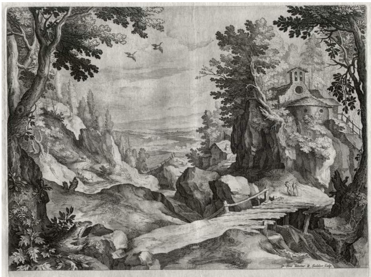
A. Sadeler II podľa P. Brilla: Hornatá krajina s dreveným mostom (17.st.)