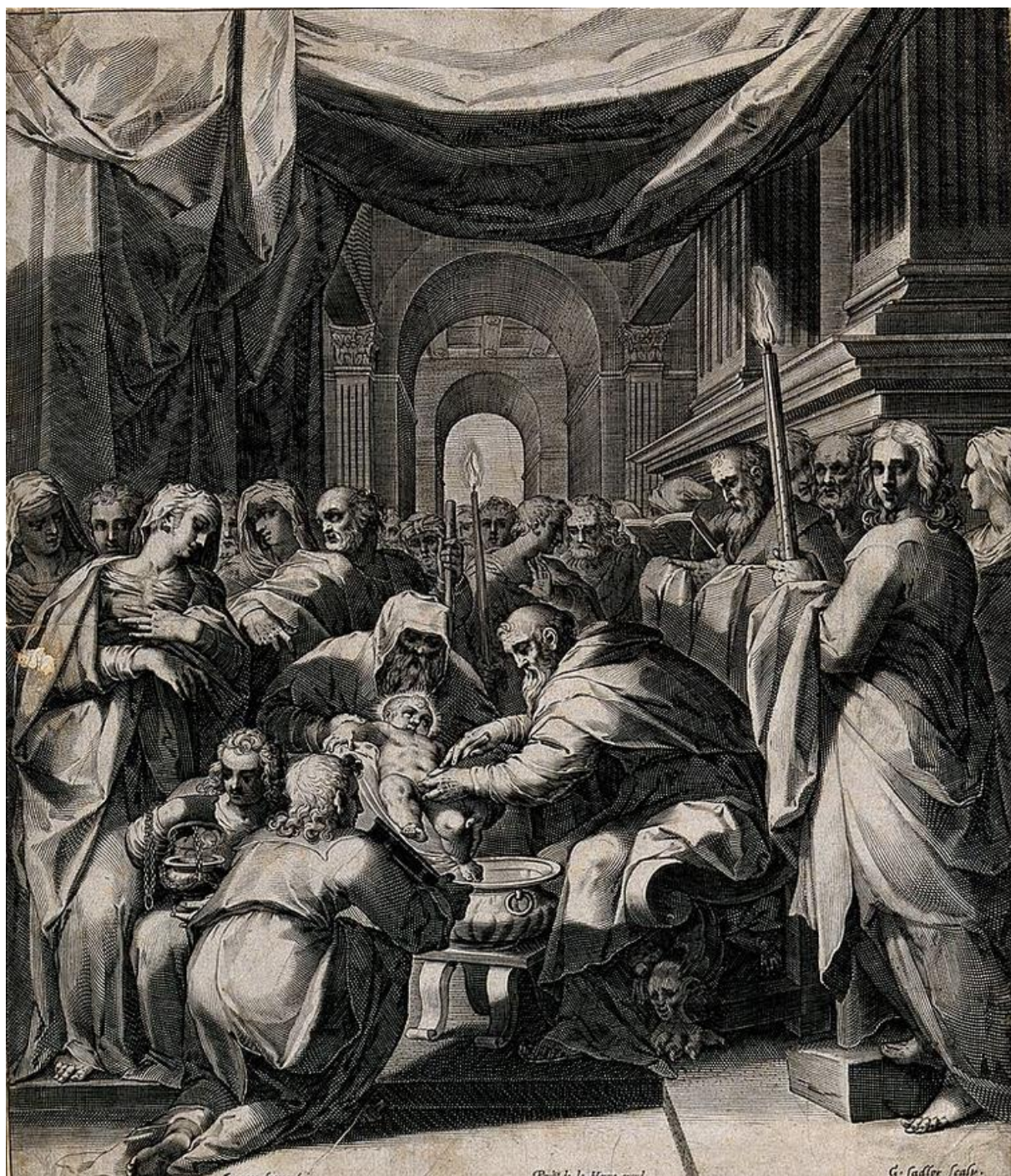
A. Sadeler II podľa J. Speeckaerta: Kristus obrezaný v chráme (rytina, 17.st.)