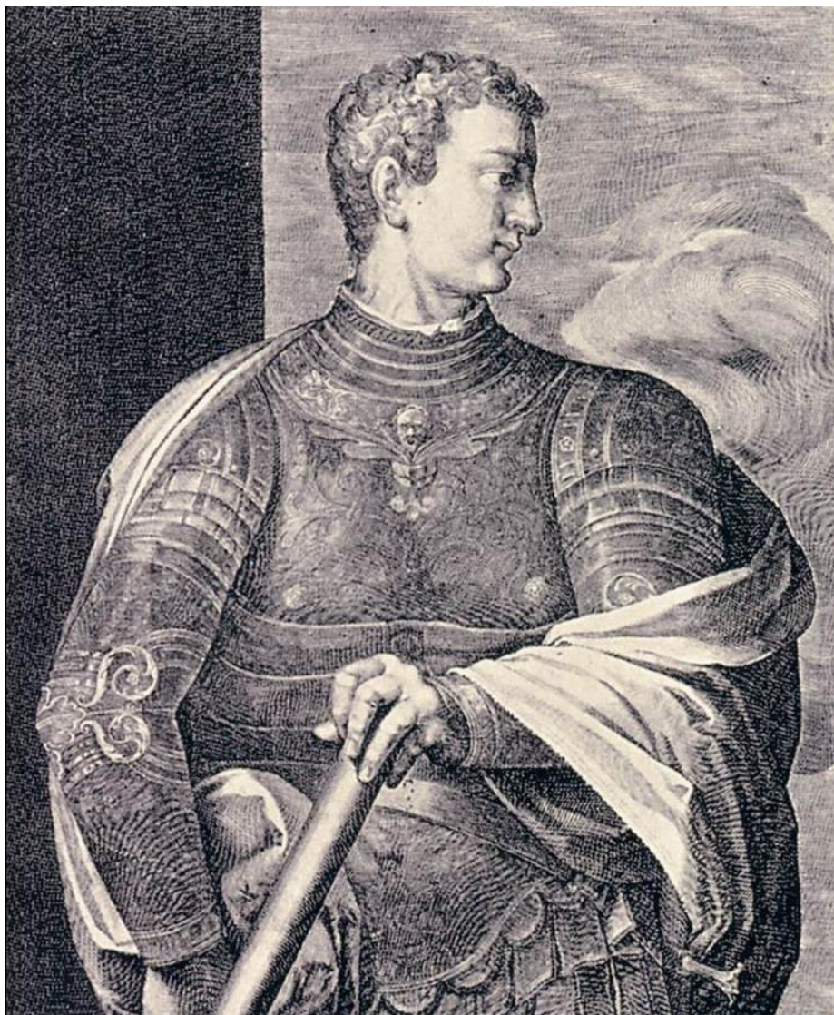
A. Sadeler II: Caligula (1.pol. 17.st.)