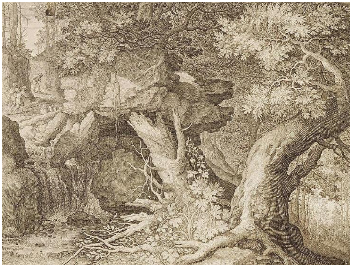
A. Sadeler II podľa R. Saveryho: Lesný chodník s vodopádom (1610-1613)