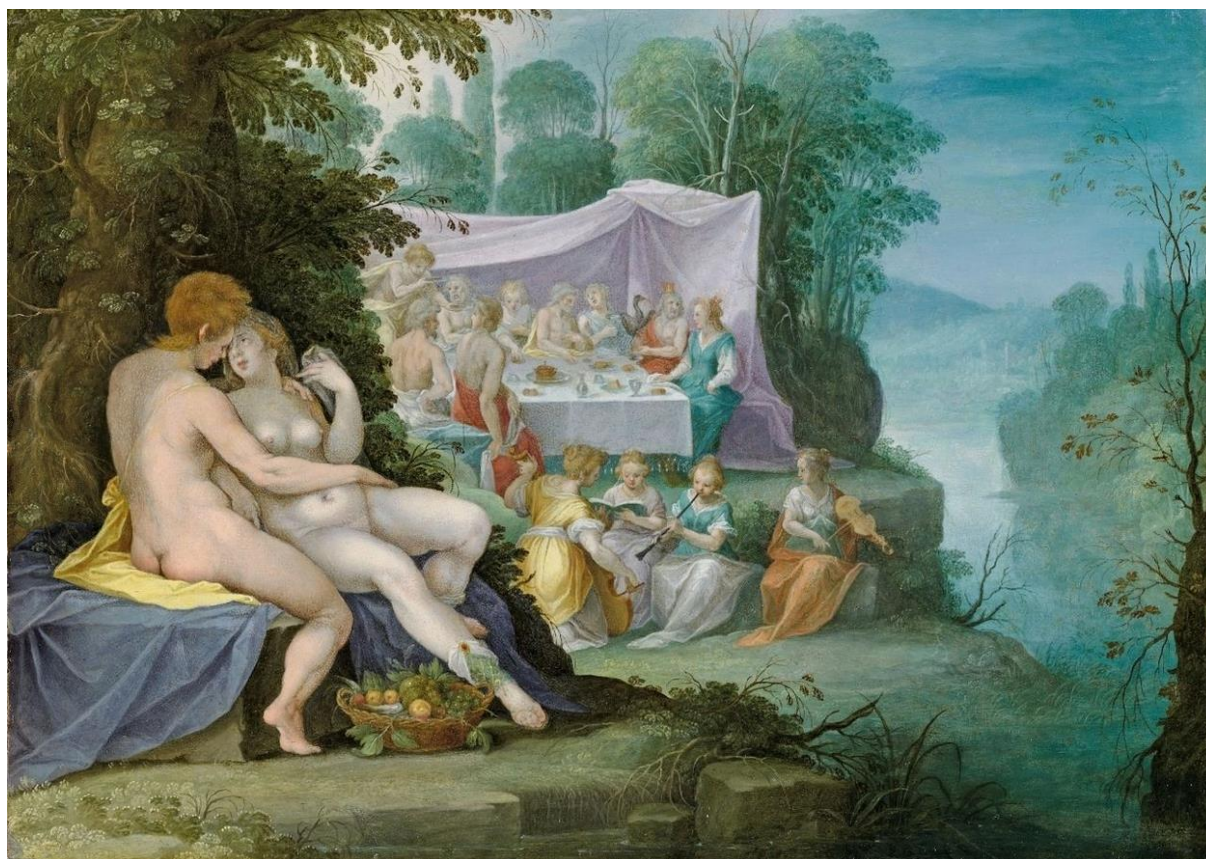
A. Sadeler II: Svadba Pelea A Thetis (1580-1600)