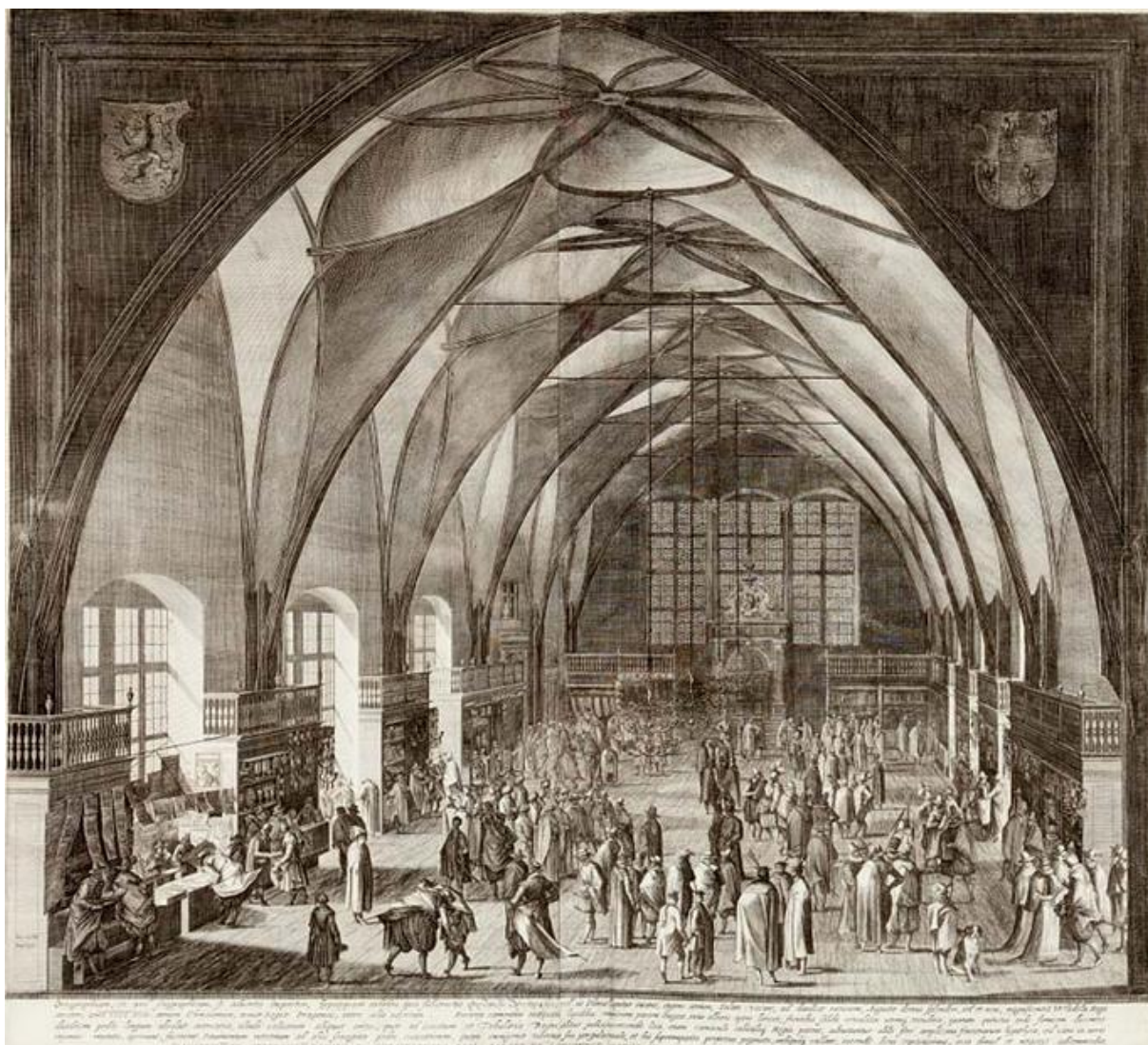
A. Sadeler II: Veľká sála hradu v Prahe počas veľtrhu (rytina, 1607)