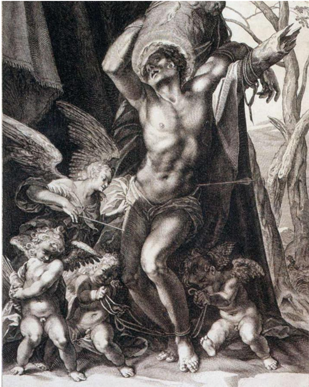
A. Sadeler II: Mučeníctvo sv. Sebestiána (lept a rytina, 1595)