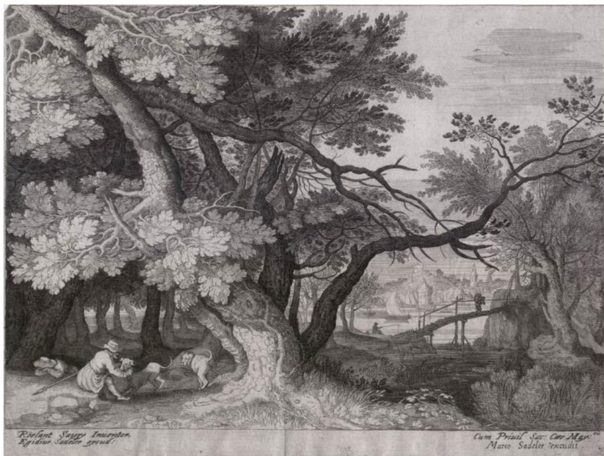
A. Sadeler II podľa R. Saveryho: Lesná scéna v Tirolsku (17.st.)