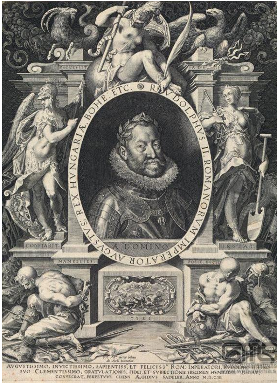
A. Sadeler I: Portrét Rudolfa II. (1603)

Sadeler II Aegidius - (†1629); niekedy písaný Egidius, alebo Gilles; syn Emmanuela de Sayeleerr (podľa iných zdrojov A. Sadelera I, †1609) a pravdepodobne synovec Jana Sadelera I (†1600), Rafaela Sadelera I (†1628/1632) a otec Tobias Sadelera ; pravdepodobne bol žiakom svojho strýka Jana Sadelera I; Aegidius II bol popredným severným manieristickým rytcom a tiež maliarom; bol najlepším z dynastie Sadlerovcov; v detstve (1579) sa presťahoval do Kolína nad Rýnom, potom do Mníchova (1588), vyučil v Antverpách a odišiel do Talianska; pracoval v Ríme (1593), potom sa vrátil do Mníchova so svojimi strýkami Jánom a Rafaelom roku 1594; cestoval s nimi do Verony a pravdepodobne do Benátok (1595-1597); zrejme už sám cestoval do Neapola a potom sa presťahoval do Prahy v roku 1597, kde strávil zvyšok svojho života v službách Rudolfa II (pozri rudolfínske zbierky ); žil nejakú dobu v dome Bartholomea Sprangera , z ktorého diel robil rytiny