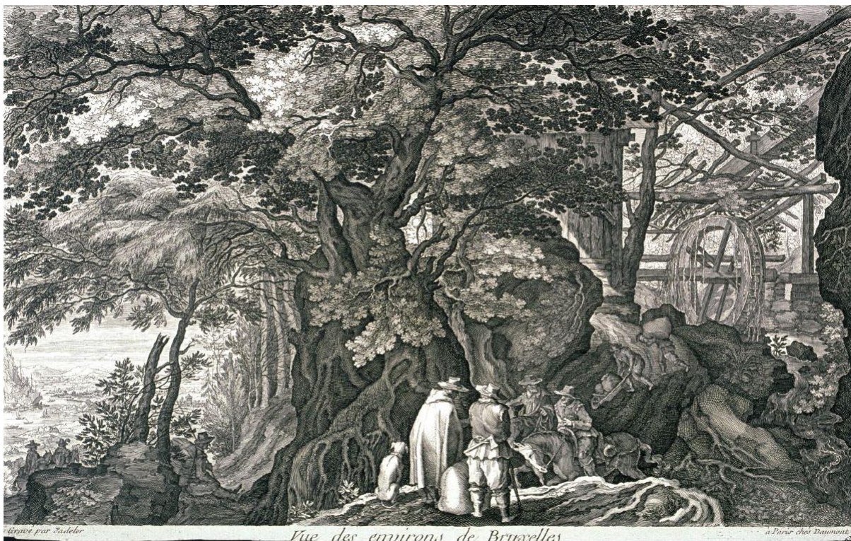
A. Sadeler II podľa P. Stevensa: Vodný mlyn (1610–1615)