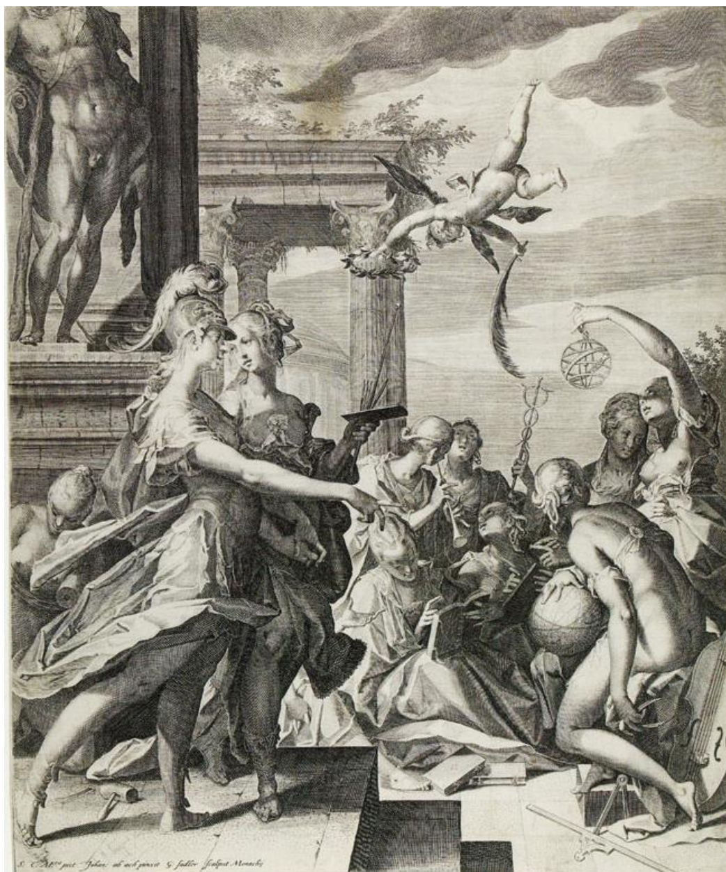
A. Sadeler II: Minerva predstavuje Mal'be slobodné umenia (rytina, 17.st.)