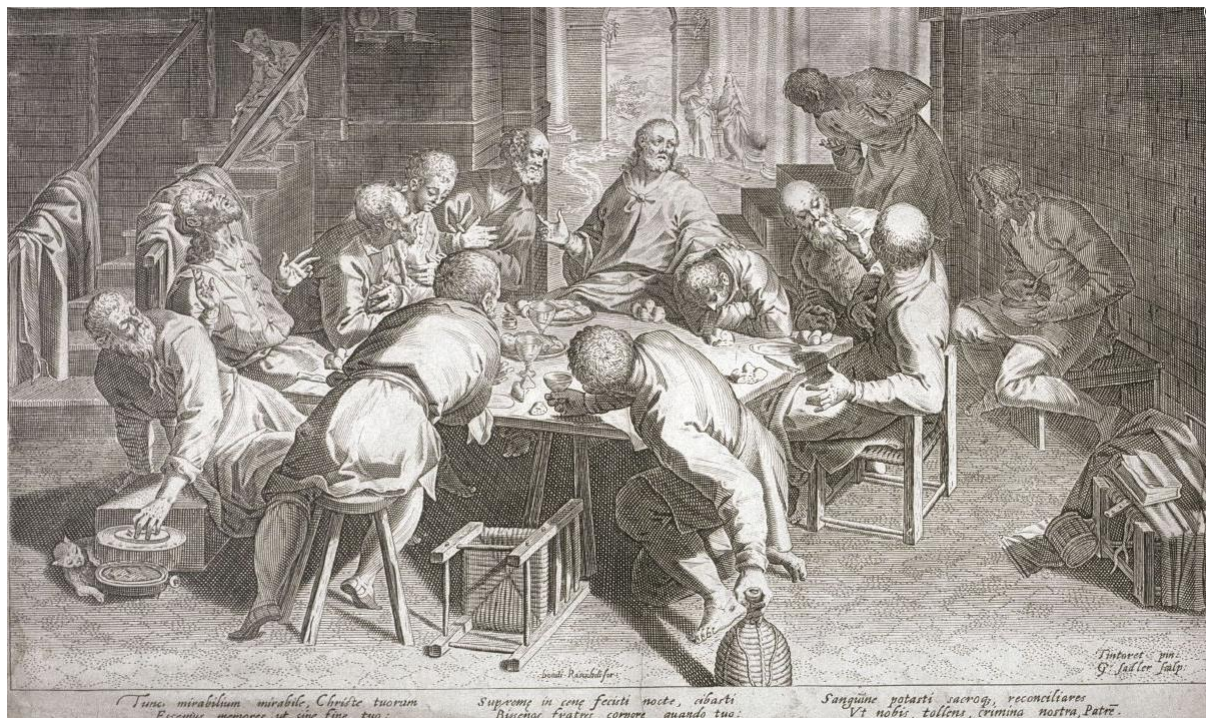
A. Sadeler II podľa Tintoretta: Posledná večera (16.-17.st.)

http://www.artcyclopedia.com/artists/sadeler_ii_aegidius.html https://commons.wikimedia.org/wiki/Category:Aegidius_Sadeler http://www.artcyclopedia.com/nationalities/Flemish.html