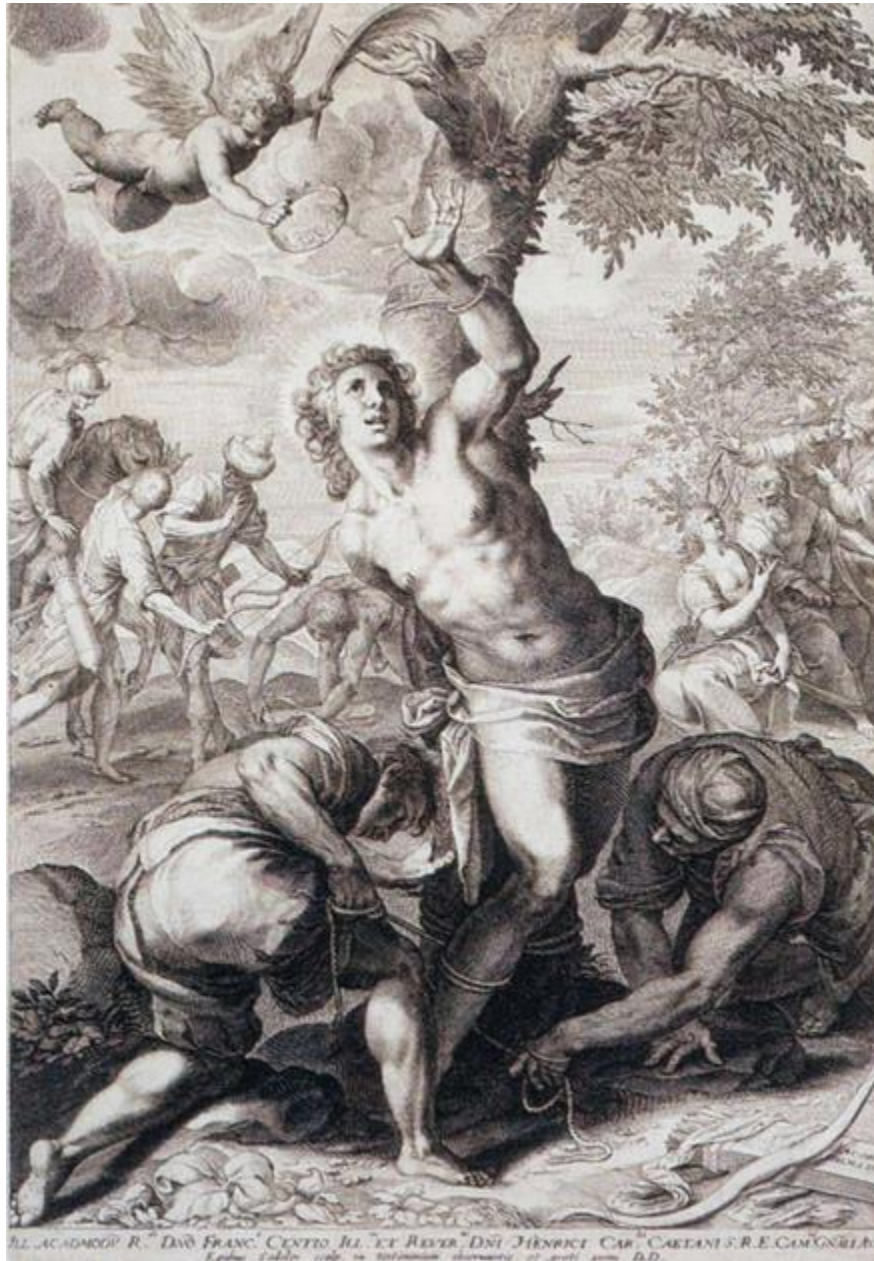
A. Sadeler II podľa G. Palma: Mučenie sv. Šebastiána (lept a rytina, 1595)