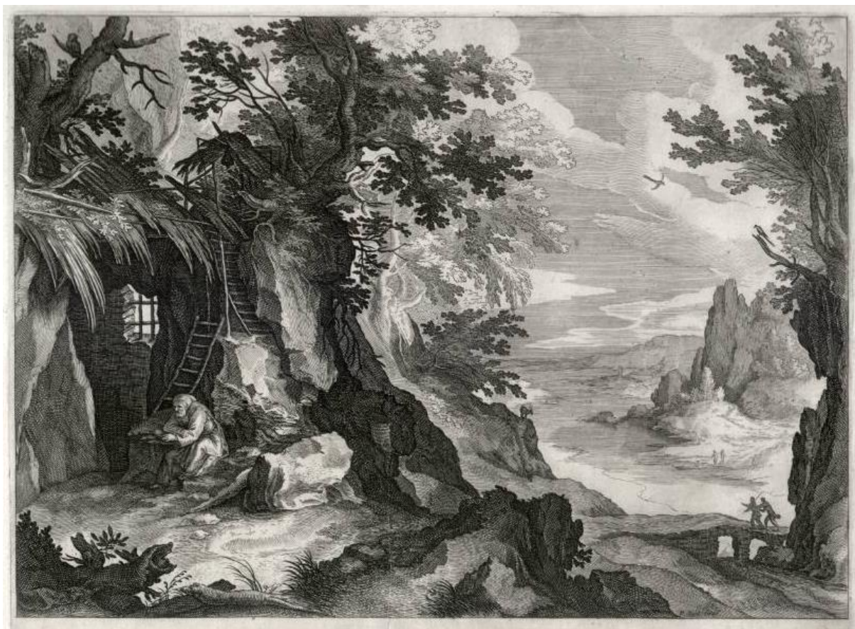
A. Sadeler II podľa P. Brilla: Krajina s pustovníkom (17.st.)