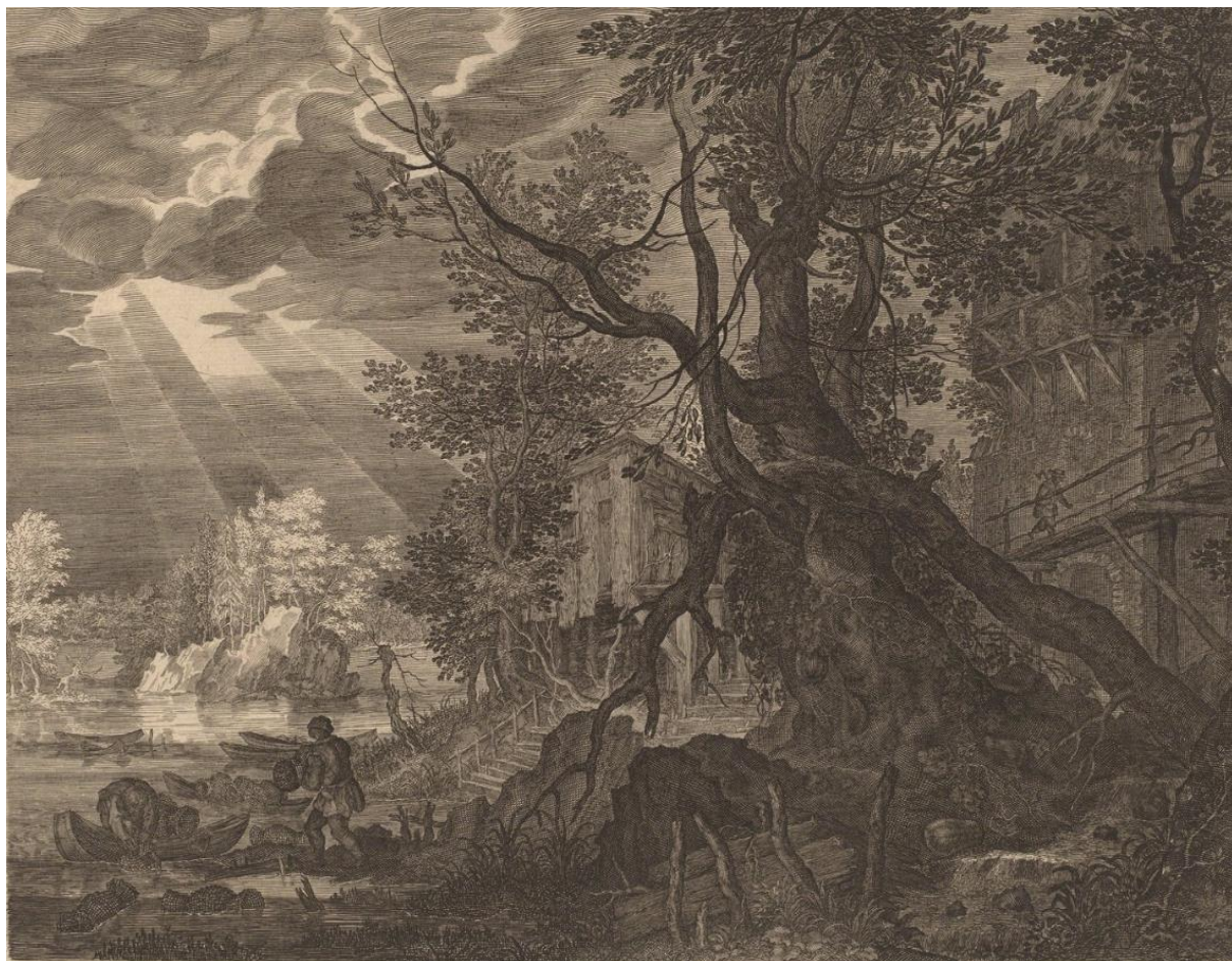
A. Sadeler II podľa R. Saveryho: Krajina s mužom rybárom pri mesačnom svetle (17.st.)