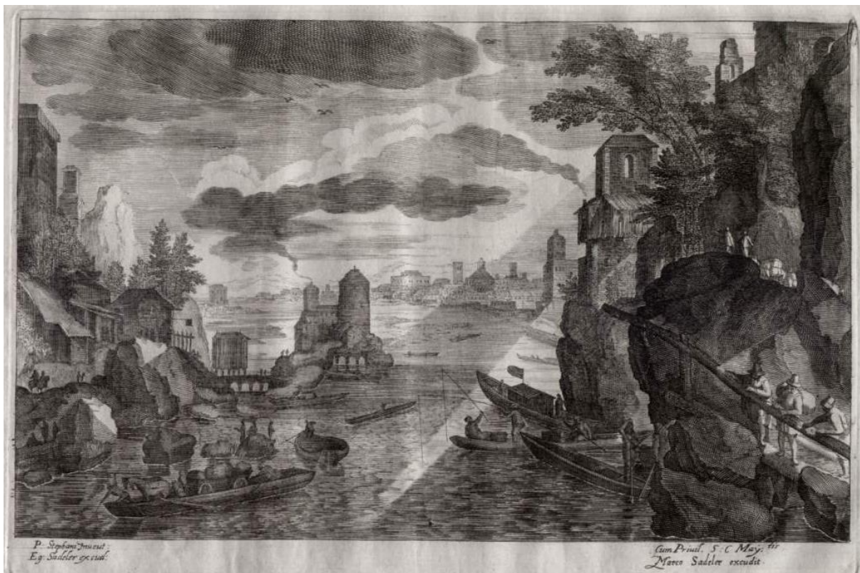
A. Sadeler II : Riečna krajina s vežou (17.st.)