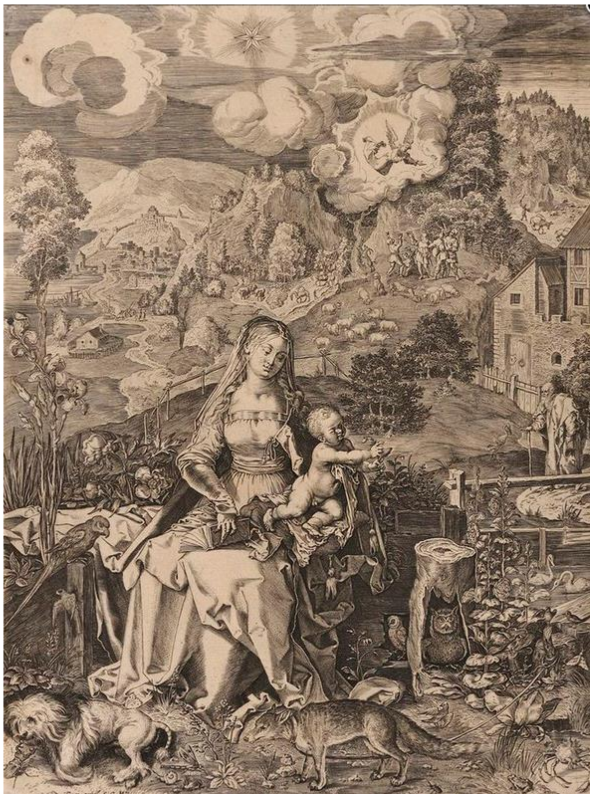
A. Sadeler II podľa A. Dürera: Madona obklopená zvieratami (medirytina, 1598)