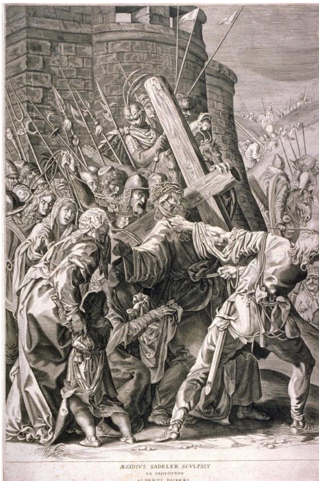
A. Sadeler II podľa A. Dürera: Kristus nesúci kríž (16.-17.st.)