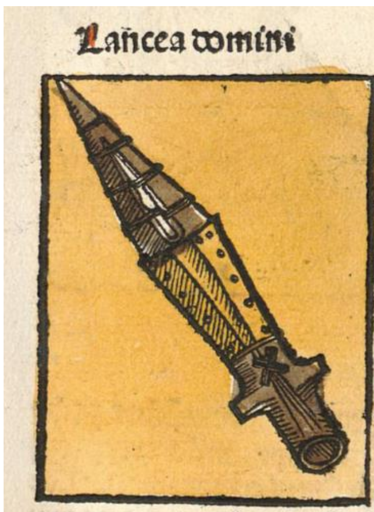
M. Wolgemut, W. Pleydenwurff, H. Schedel: Kopia Pána (kolorovaný drevoryt, Norimberská kronika, 1493)