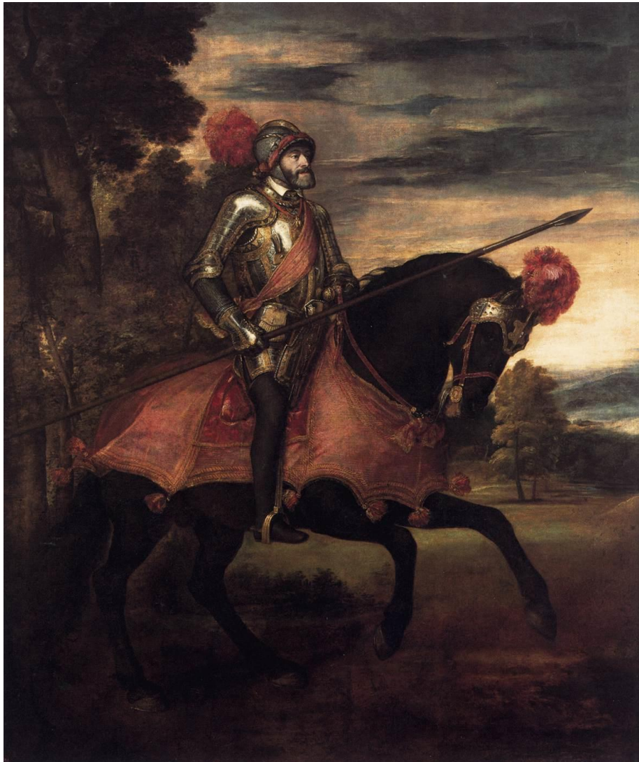
Tizian: Portrét Karola V. v Mühlbergu (16.st.)