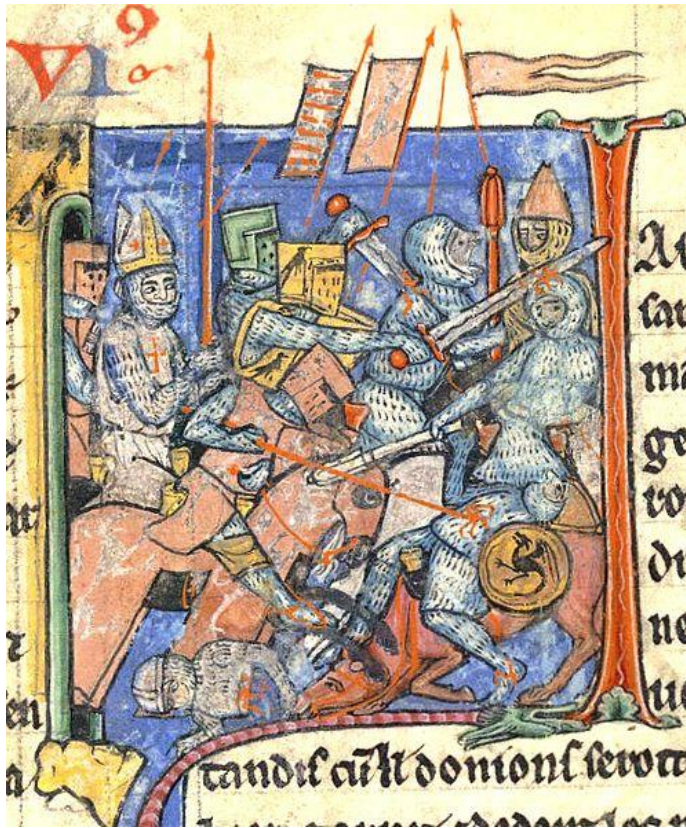
Svätá kopija v držbe Adhemara du Puy pred Antiochiou (iluminácia rukopisu z 13.st.)

http://oursenseofplace.squarespace.com/carefully-constructed-reading-the-nuremberg-cityscape-in-the-nuremberg-chronicle/