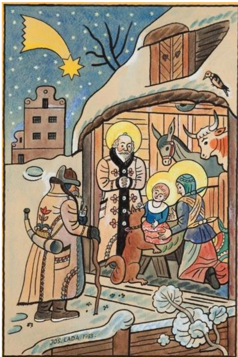
J. Lada: Svätá noc (1933)

Svätá ríša rímska - pozri rímsko-nemecká ríša , Bundschuh