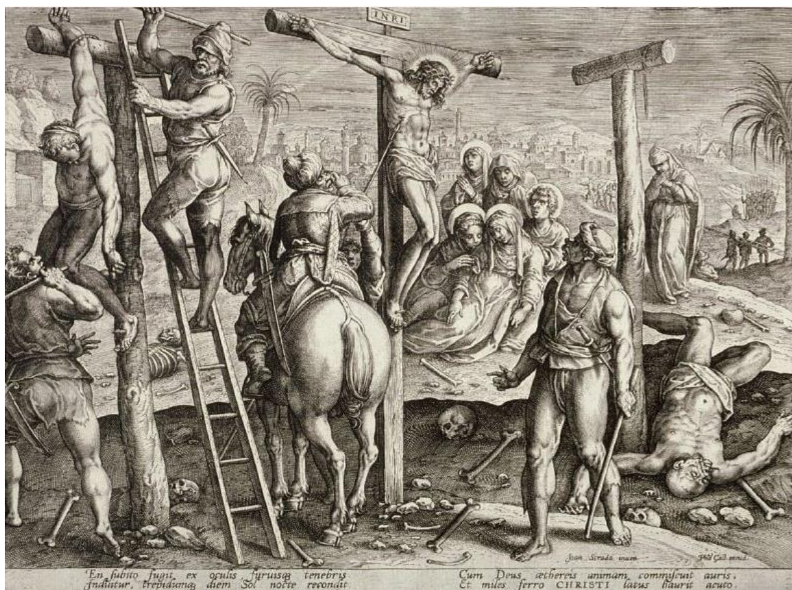
P. Galle podľa J. Van der Straet (Stradanus): Kristus prebodnutý kopijou (z cyklu Utrpenie, smrť a zmŕtvychvstanie nášho Pána Ježiša Krista, 16.-17.st.)