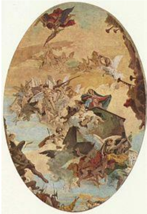
G. B. Tiepolo: Prenesenie Svätej chyže do Loreta (freska v Galérii Accademia v Benátkach, 18.st.)

svätá chyža - pozri Loreto, loreta, sancta casa