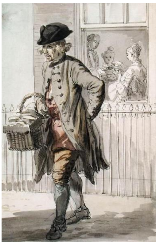
P. Sandby: Predavač muffin (zo série „Twelve London Cries of London done from the Life“, 1759)