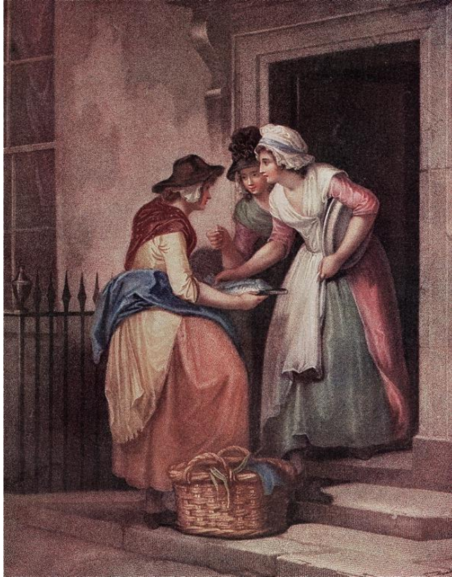
L. Schiavonetti (rytec) podľa Francis Wheatley: Čerstvé makrely! Čerstvé makrely! (ručne kolorovaná tlač zo série Výkriky Londýna, 18.st.)