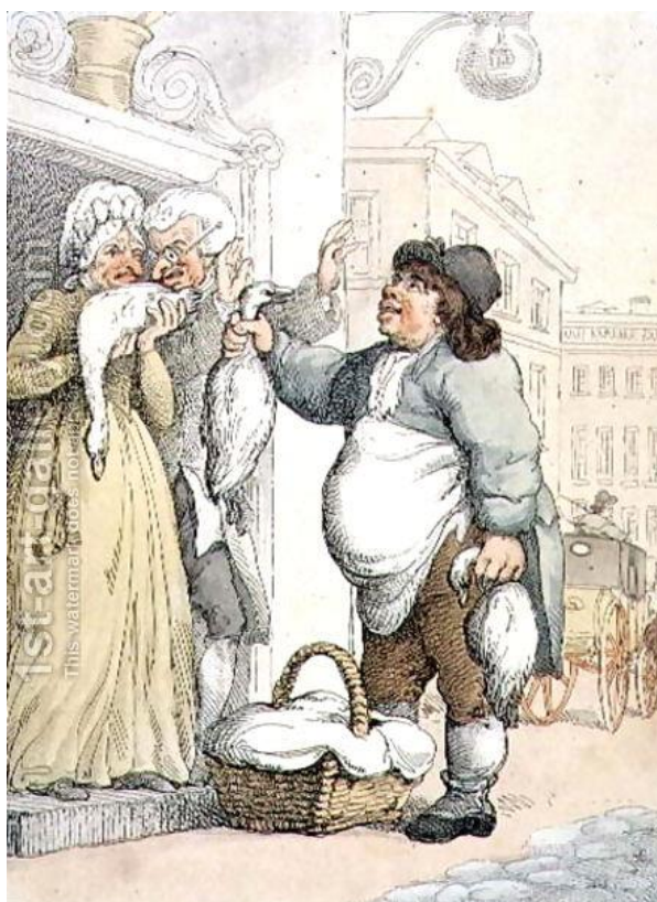
Thomas Rolandson: Kúpte si hus, moju tučnú hus (zo série Výkriky Londýna, 18.-19.st.)