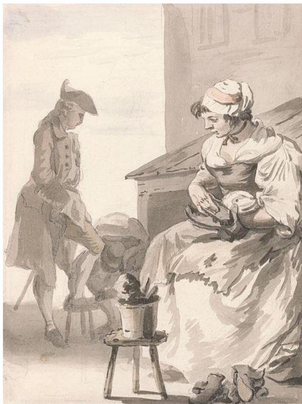
P. Sandby: Čistič topánok (zo série „Twelve London Cries of London done from the Life“, 1759)