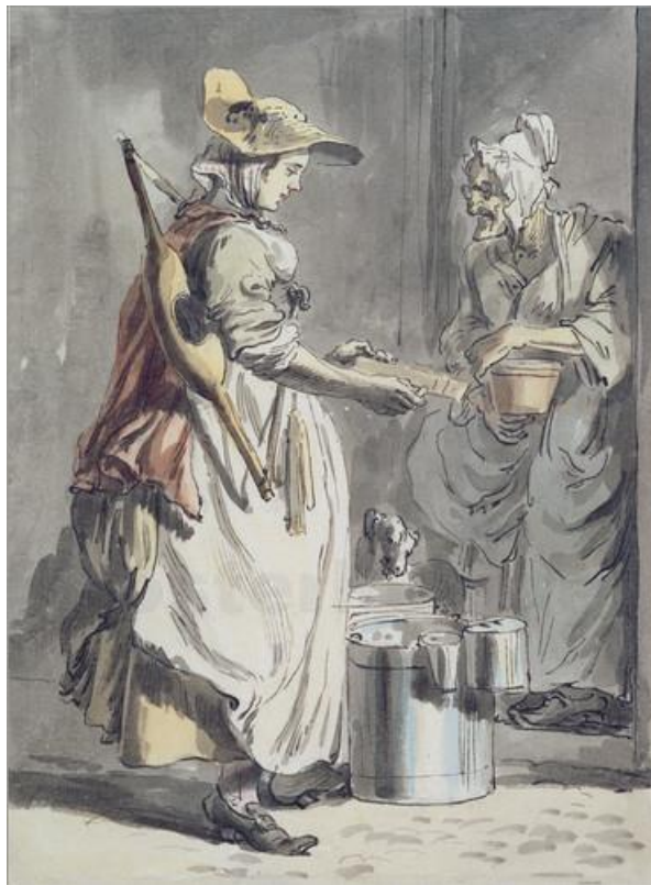
P. Sandby: Predavačka mlieka (zo série „Twelve London Cries of London done from the Life“, 18.st.)