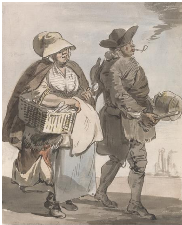
P. Sandby: Prajete si nejaké lyžice? (zo série „Twelve London Cries of London done from the Life“, 1759)