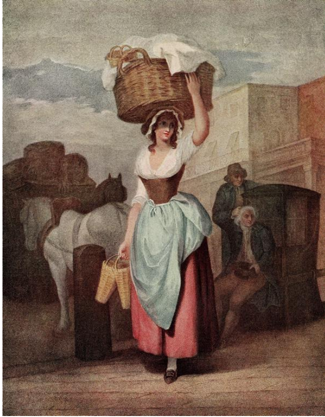
L. Schiavonetti (rytec) podľa Francis Wheatley: Jahody, jahody, červené jahody! (ručne kolorovaná tlač zo série Výkriky Londýna, 18.st.)