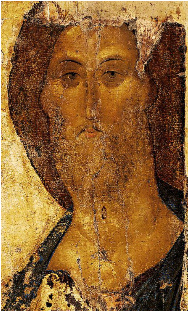
A. Rublev: Kristus Vykupiteľ (1410)

https://en.wikipedia.org/wiki/Redeemer_(Christianity)