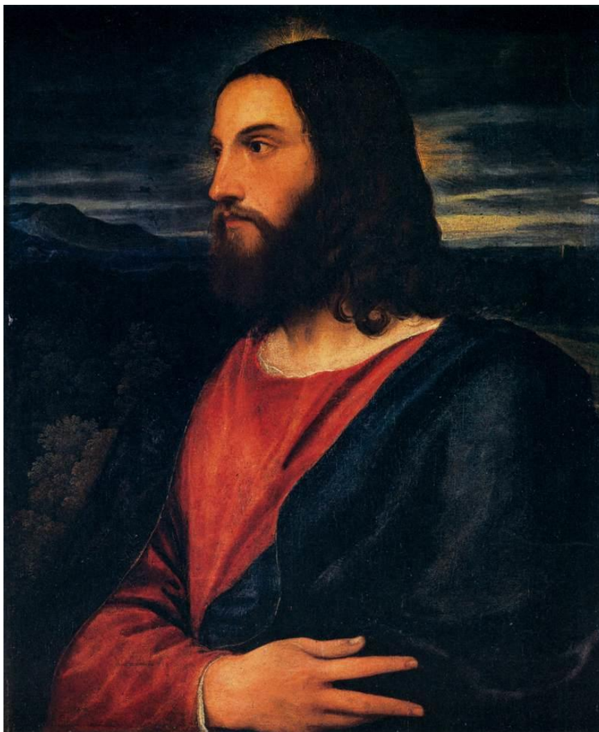
Tizian: Kristus Vykupiteľ (16.st.)