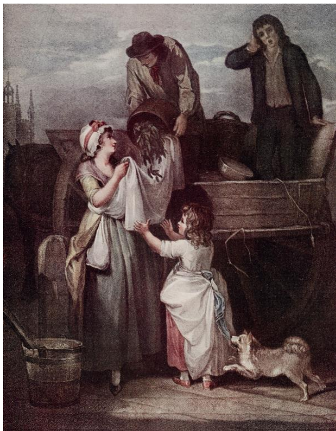
L. Schiavonetti (rytec) podľa Francis Wheatley: Čerstvo natrhany hrášok, čerstvý hrášok, z Hastingsu! (ručne kolorovaná tlač zo série Výkriky Londýna, 18.st.)