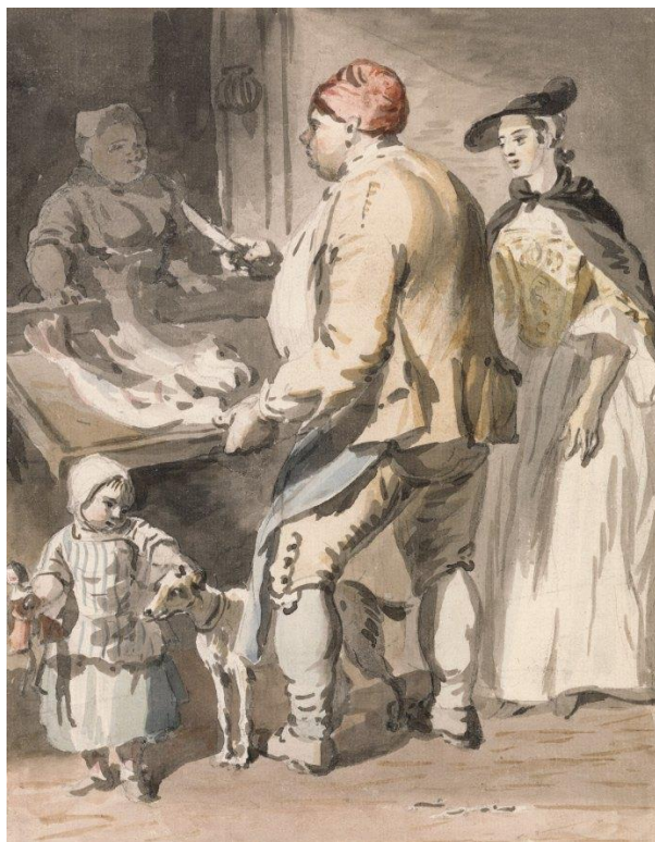
P. Sandby: Predavačka rýb (zo série „Twelve London Cries of London done from the Life“, 1759)