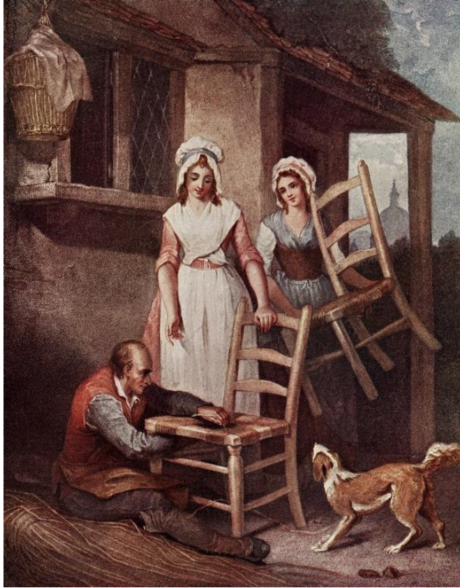
L. Schiavonetti (rytec) podľa Francis Wheatley: Staré stoličky opraviť! (ručne kolorovaná tlač zo série Výkriky Londýna, 18.st.)