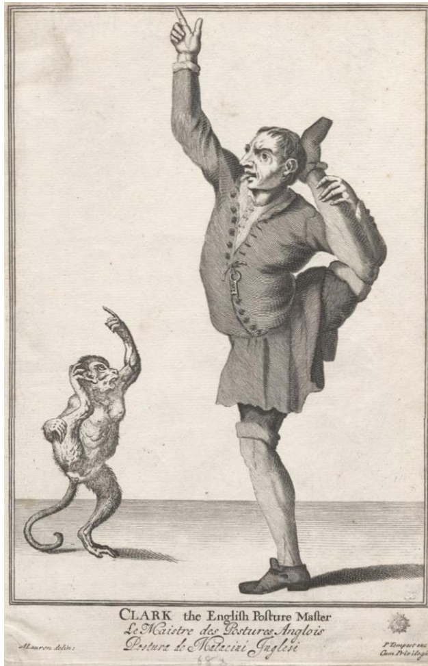
M. Laroon I, P. Tempest: Clark, majster anglického držania tela (z cyklu Výkriky Londýna, 1733)