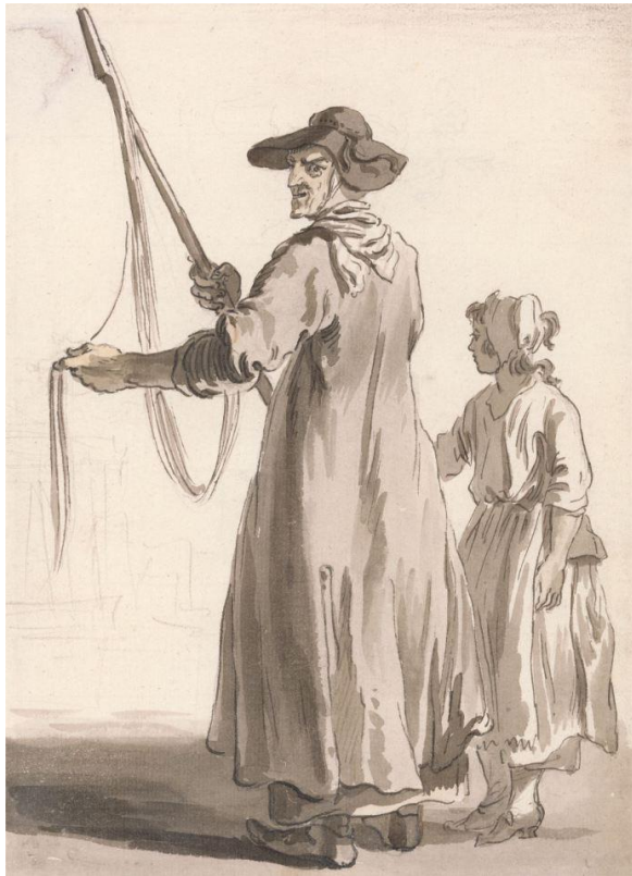
P. Sandby: Predavačka čipky (zo série „Twelve London Cries of London done from the Life“, 1759)