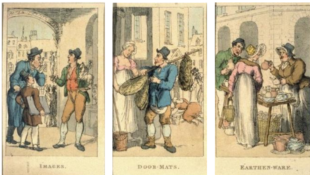
Thomas Rolandson: Sošky. Rohožky pred dvere. Hlinené hrnce (zo série Výkriky Londýna, 18.-19.st.)