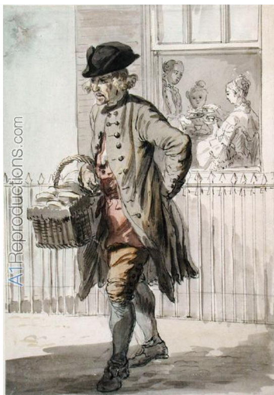
P. Sandby: Predavač muffín (zo série „Twelve London Cries of London done from the Life“, 1759)