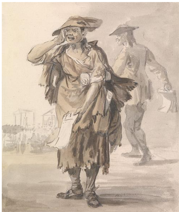
P. Sandby: Posledná reč umierajúceho a spoved' (zo série „Twelve London Cries of London done from the Life“, 1759)