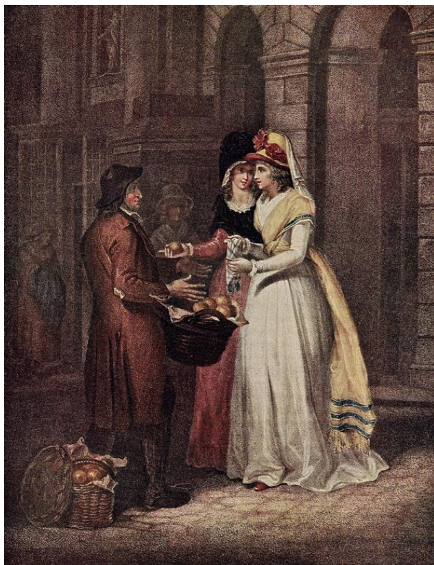
L. Schiavonetti (rytec) podľa Francis Wheatley: Sladké čínske pomaranče! (ručne kolorovaná tlač zo série Výkriky Londýna, 18.st.)