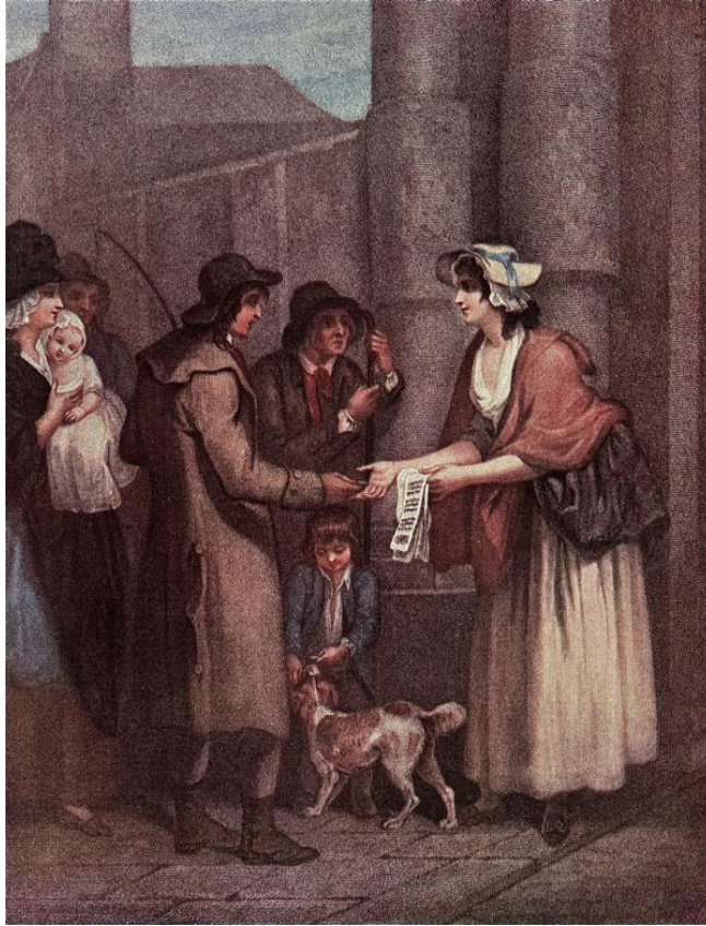
L. Schiavonetti (rytec) podľa Francis Wheatley: Nová pesnička, len pol penny za kus! (ručne kolorovaná tlač zo série Výkriky Londýna, 18.st.)