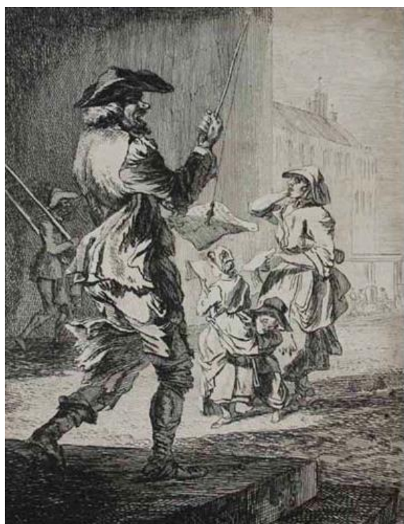
P. Sandby: Spevák balád (zo série „Twelve London Cries of London done from the Life“, 1760)