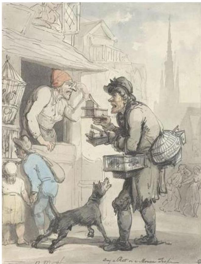
Thomas Rolandson: Kúpte si pascu, potkania pasca, kúpte pascu (zo série Výkriky Londýna, 18.-19.st.)