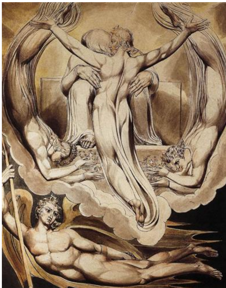
W. Blake: Kristus ako vykupiteľ človeka (1808)