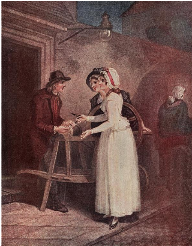
L. Schiavonetti (rytec) podľa Francis Wheatley: Nože, nožnice, britvy nabrúsiť! (ručne kolorovaná tlač zo série Výkriky Londýna, 18.st.)