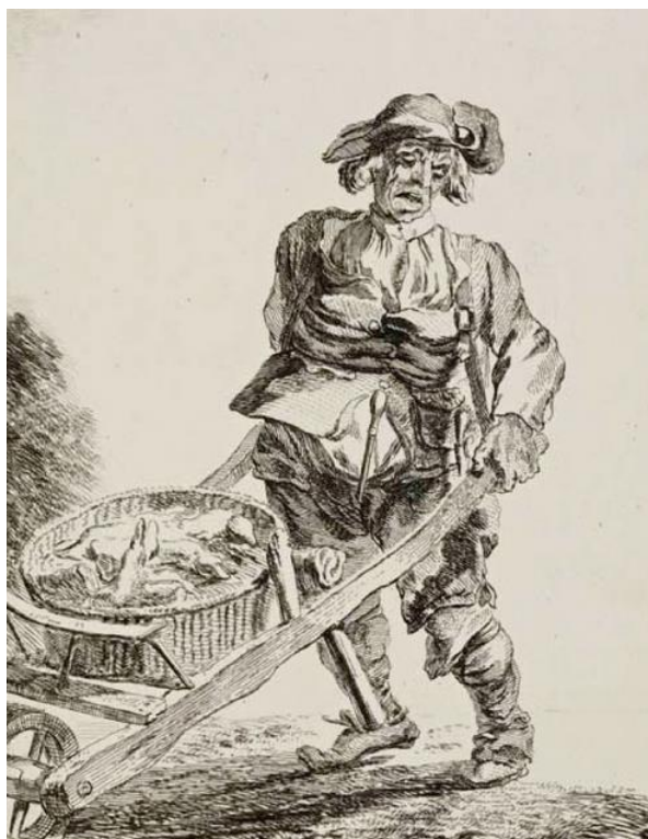
P. Sandby: Akékoľvek držky alebo nohy alebo teľacie nohy (zo série „Twelve London Cries of London done from the Life“, 1760)