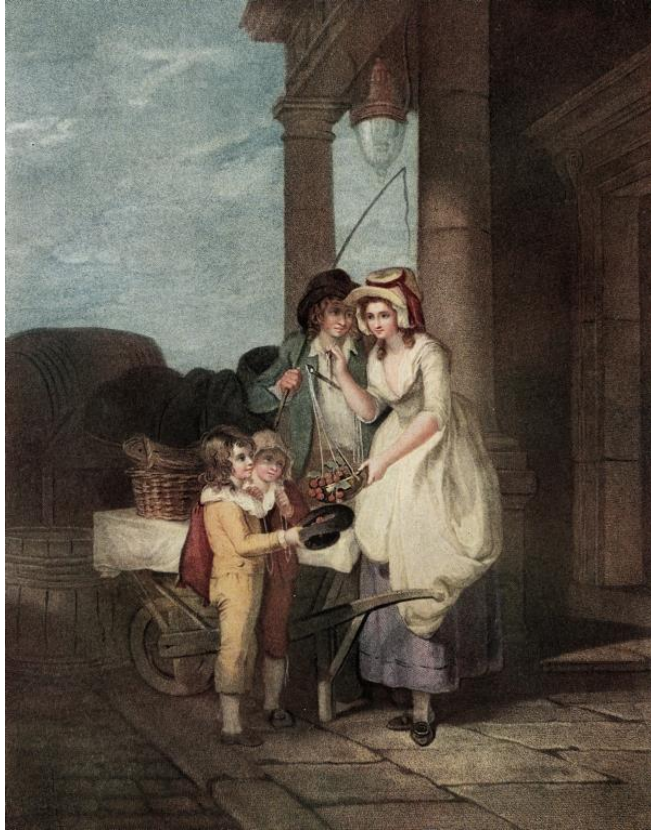
L. Schiavonetti (rytec) podľa Francis Wheatley: Čerešne a višne. Päť pencí za libru. Duke čerešne! (ručne kolorovaná tlač zo série Výkriky Londýna, 18.st.)