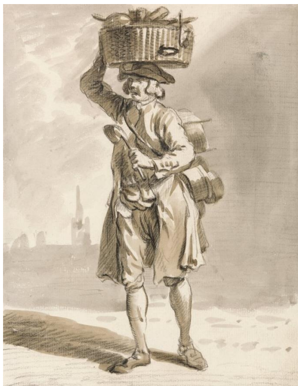
P. Sandby: Pouličný predajca hrncov a panvíc (zo série „Twelve London Cries of London done from the Life“, 18.st.)