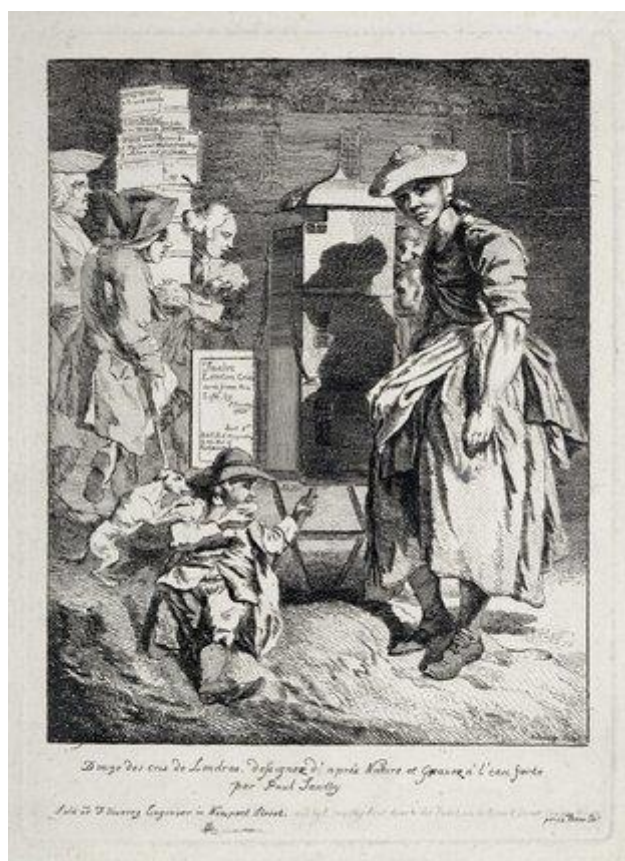
P. Sandby: Mladá žena ponúka pouličnú zábavu v podobe peep show (titulná stránka z tlačového seriálu „Twelve London Cries of London done from the Life“, 18.st.)