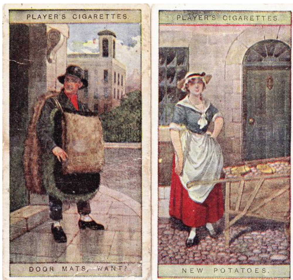
Predavači zo série Výkriky Londýna na škatulke kravičky s tabakom a cigarami značky John Player & Sons (19.st.)