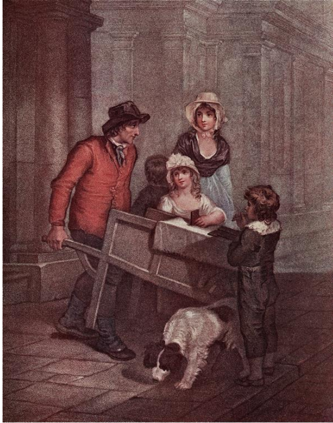
L. Schiavonetti (rytec) podľa Francis Wheatley: Horúci, pikantný perník, sladký! (ručne kolorovaná tlač zo série Výkriky Londýna, 18.st.)