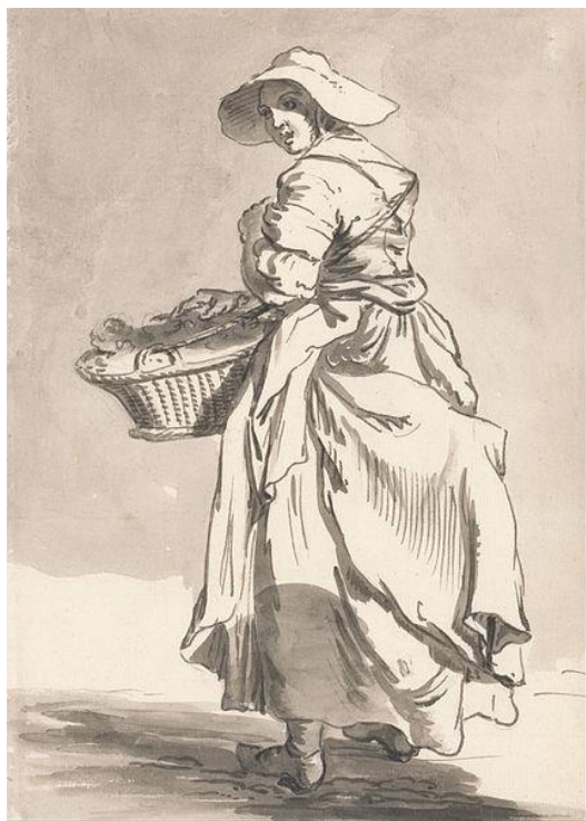
P. Sandby: Predavačka kvetín (zo série „Twelve London Cries of London done from the Life“, 18.st.)