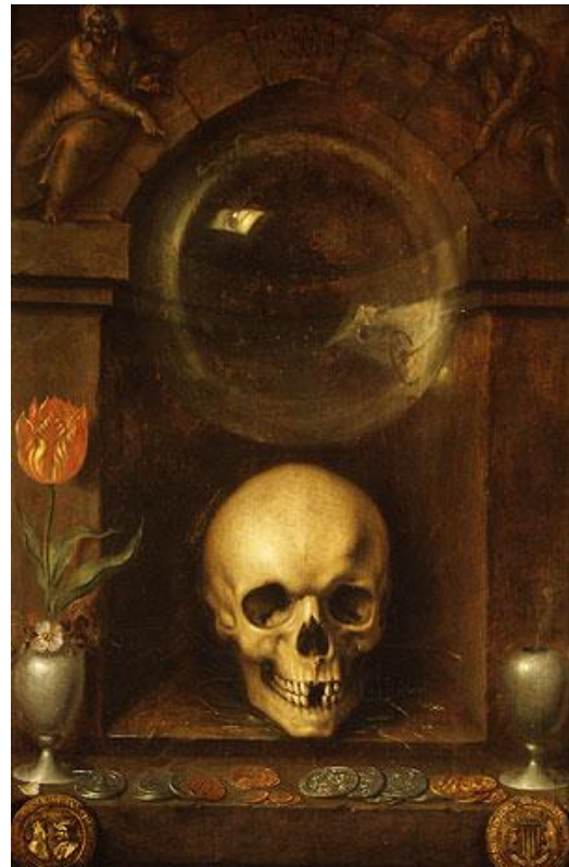
B. Bruyn st.: Lebka vo výklenku (vanitas, 1530-1545)