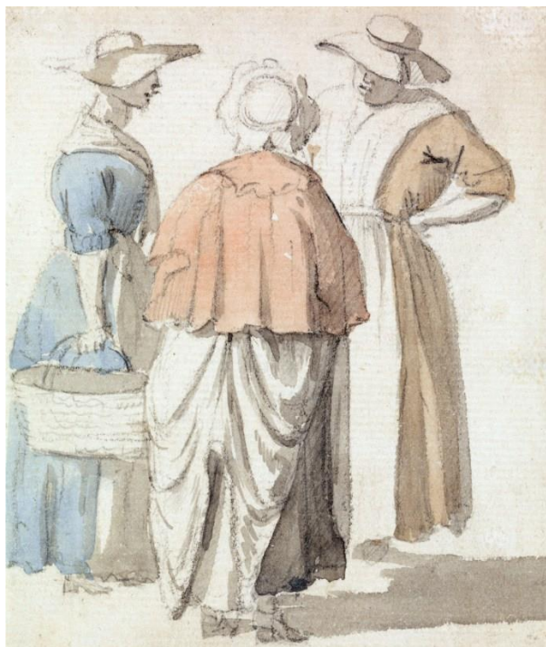
P. Sandby: Rozhovor (zo série „Twelve London Cries of London done from the Life“, pred 1772)