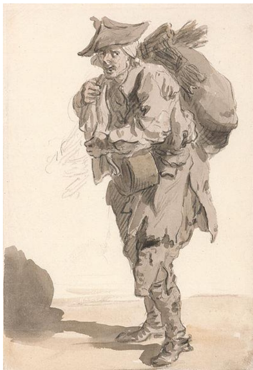
P. Sandby: Pouličný predajca uhlia a kôf (zo série „Twelve London Cries of London done from the Life“, 1759)