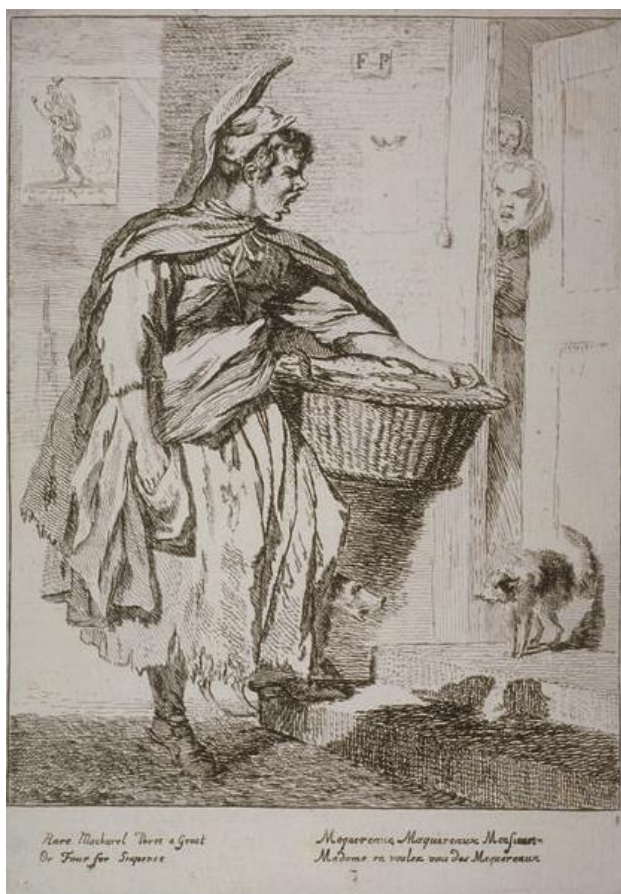
P. Sandby: Predavačka makrel (zo série „Twelve London Cries of London done from the Life“, 1760)