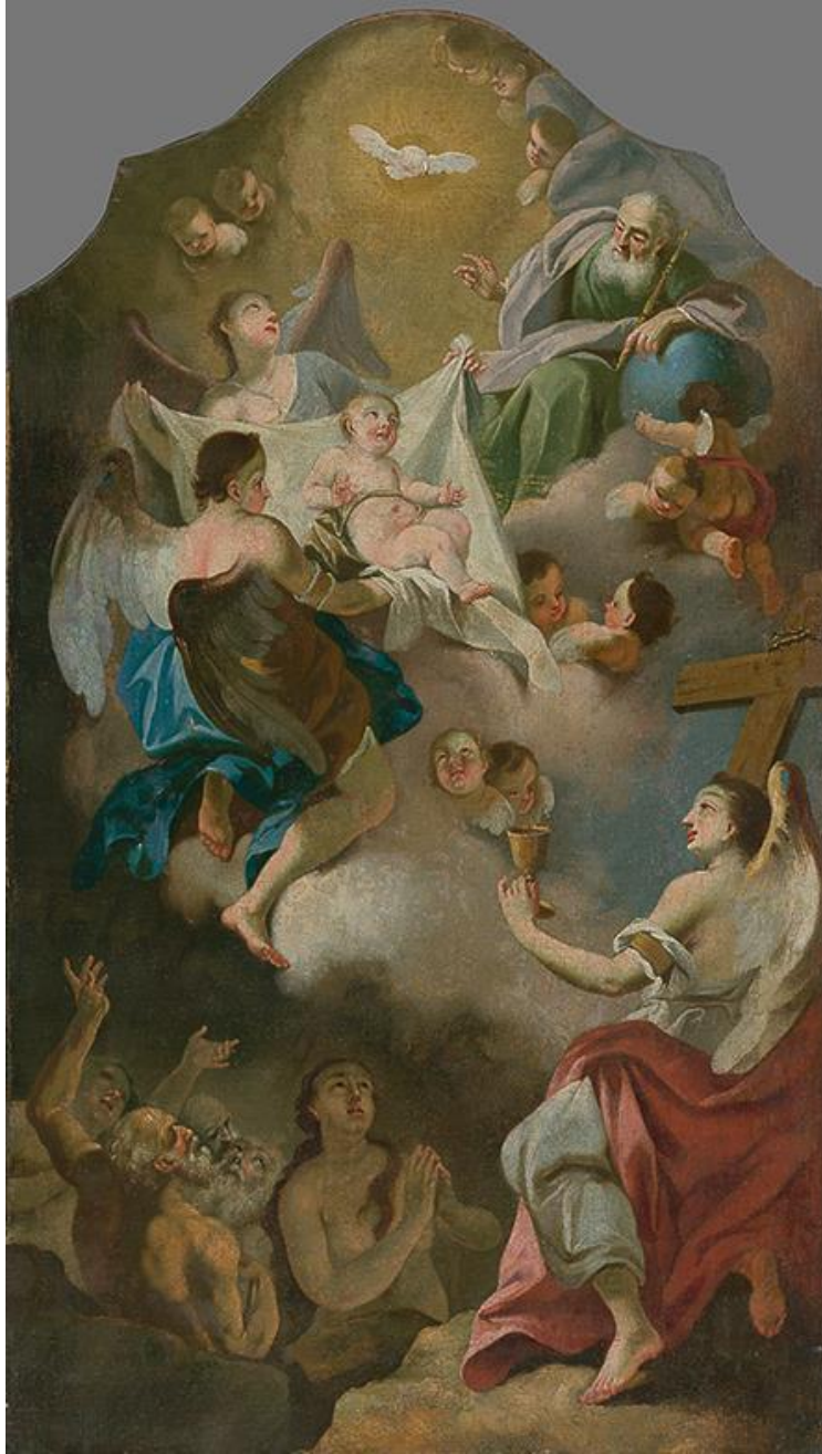
StredoEurópsky maliar z 1. polovice 18.storočia: Alegória Ježiša dieťaťa ako budúceho Vykupiteľa (1700-1750)