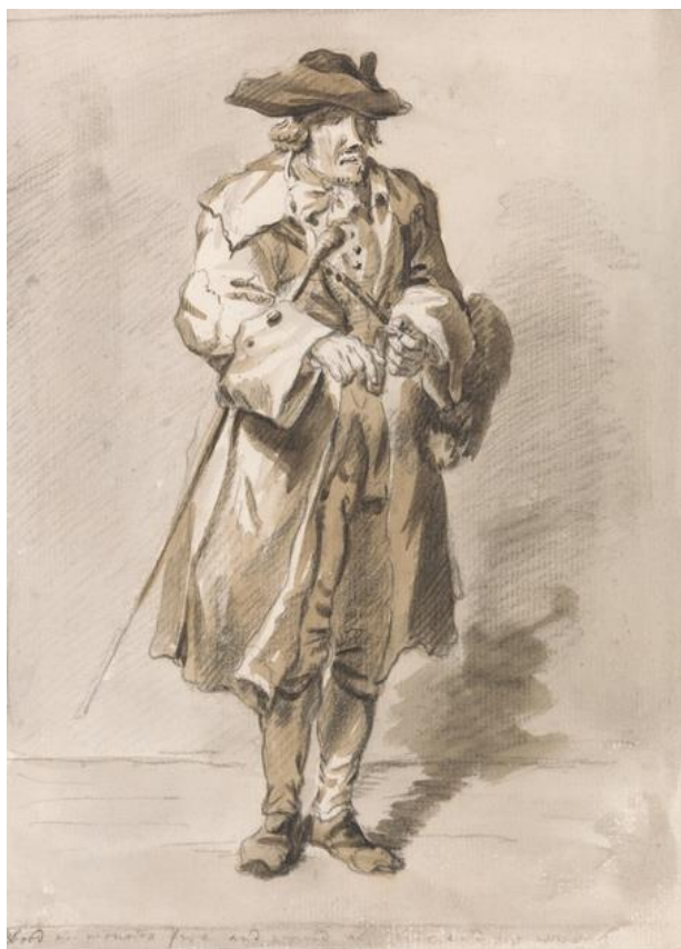
P. Sandby: Iba oheň a žiadny dym (zo série „Twelve London Cries of London done from the Life“, 1759)