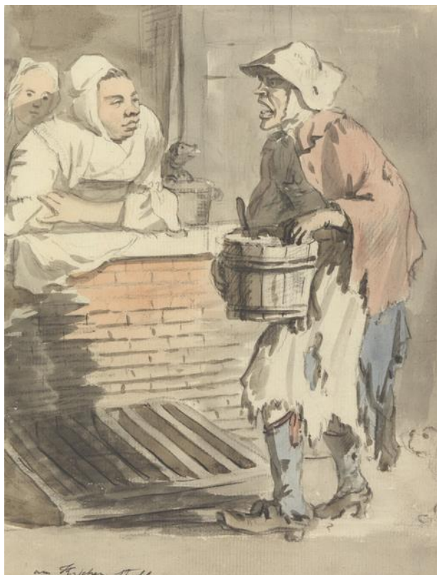
P. Sandby: Akákoľvek vec do kuchyne (zo série „Twelve London Cries of London done from the Life“, 18.st.)