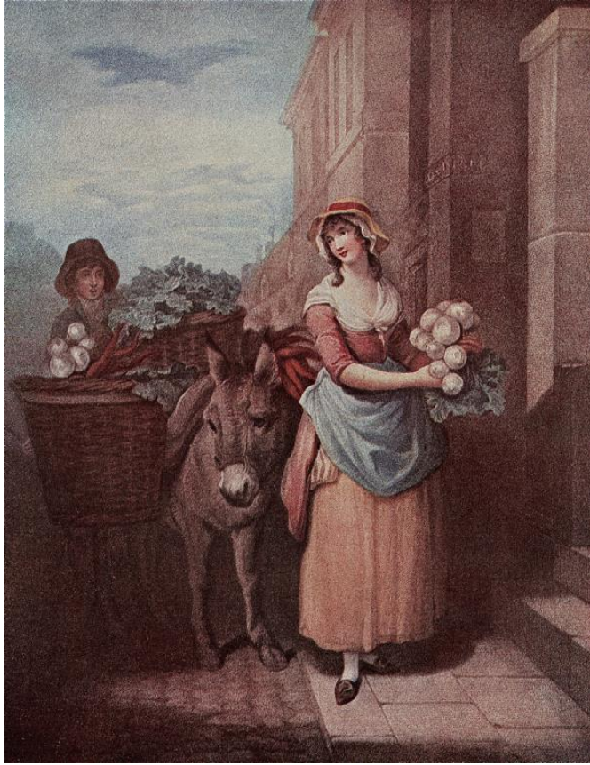
L. Schiavonetti (rytec) podľa Francis Wheatley: Red'kev a karotku, tu! (ručne kolorovaná tlač zo série Výkriky Londýna, 18.st.)