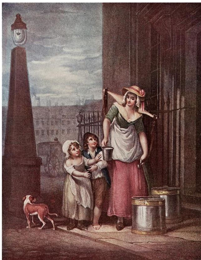
L. Schiavonetti (rytec) podľa Francis Wheatley: Mlieko! (ručne kolorovaná tlač zo série Výkriky Londýna, 18.st.)