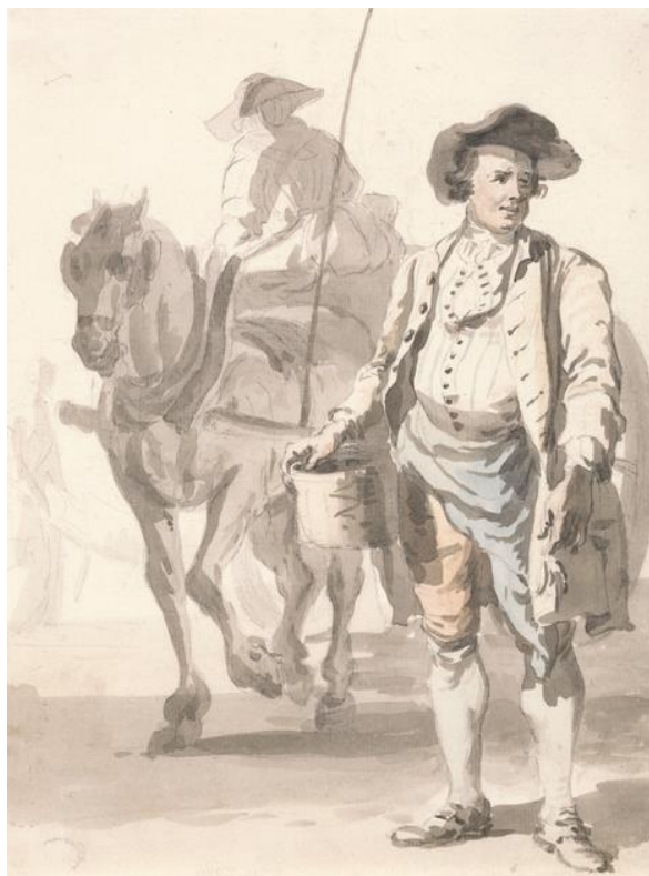
P. Sandby: Drotár a jeho žena (zo série „Twelve London Cries of London done from the Life“, 1759)