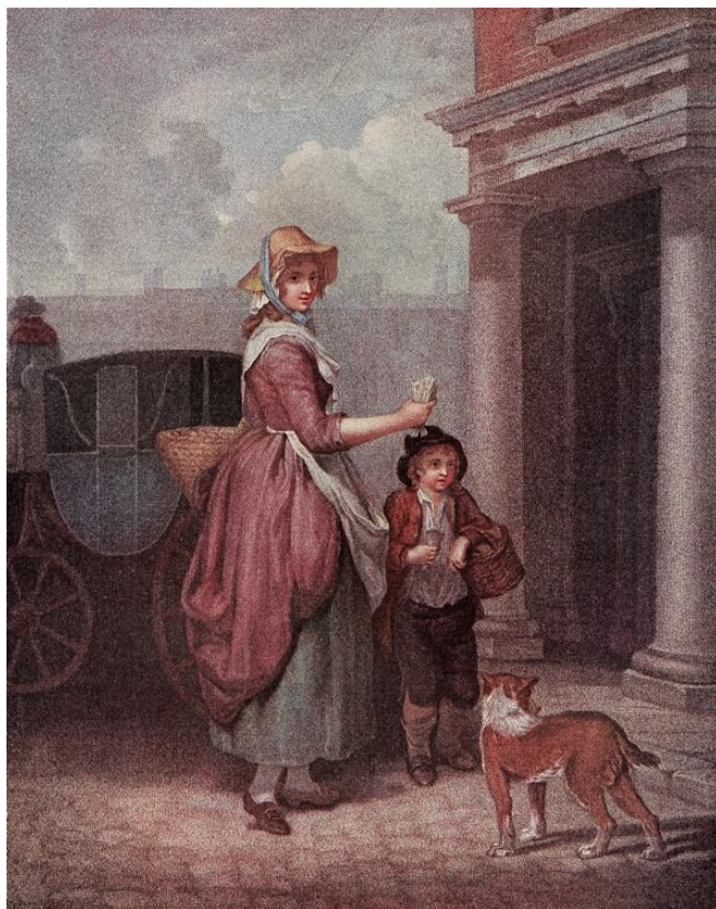
L. Schiavonetti (rytec) podľa Francis Wheatley: Chcete nejaké zápalky? (ručne kolorovaná tlač zo série Výkriky Londýna, 18.st.)