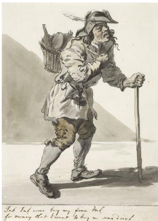
P. Sandby: Mestský predavač (zo série „Twelve London Cries of London done from the Life“, 1764)