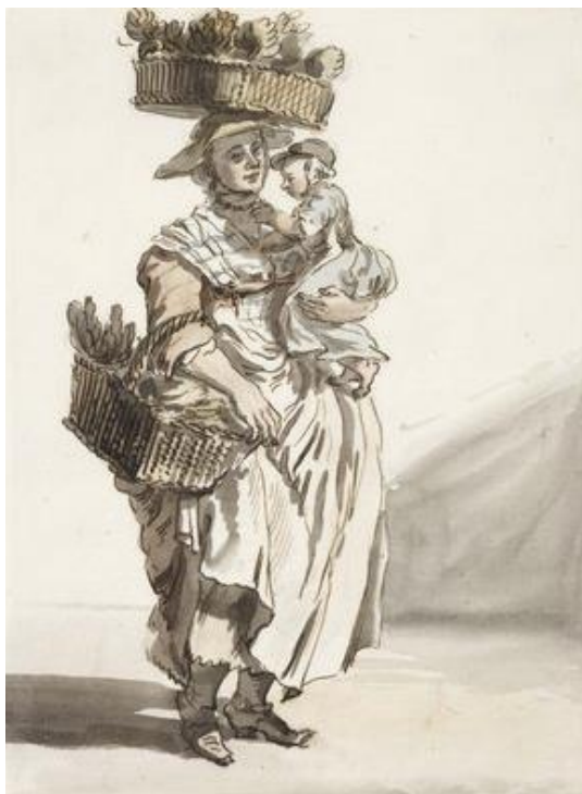
P. Sandby: Predavačka zeleniny (zo série „Twelve London Cries of London done from the Life“, 1759)