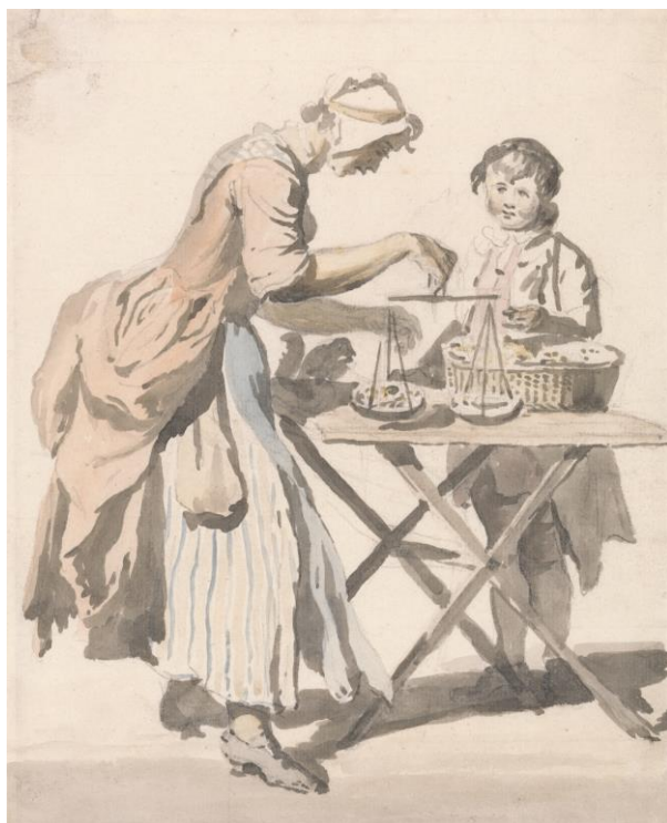
P. Sandby: Čerešne čierne srdcovky (zo série „Twelve London Cries of London done from the Life“, 1759)