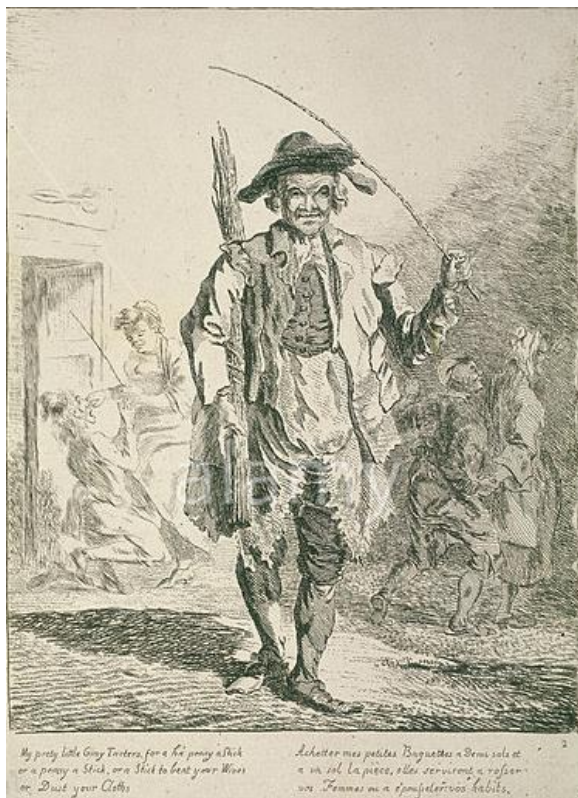
P. Sandby: Predavač palíc (zo série „Twelve London Cries of London done from the Life“, 1760)