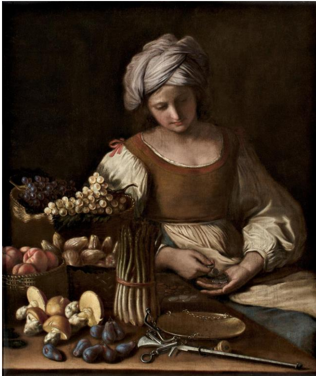
Guercino: - (17.st.)

špekulácia - abstraktné uvažovanie, rozmýšľanie, hľbanie; vo filozofii druh teórie poznania opierajúcej sa nie o skúsenosť ale o reflexiu; špekulatívne rysy mal vo výtvarnom umení napr. symbolizmus