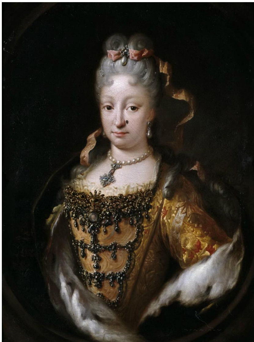
M. J. Melendez: Elisavet Farnese, kráľovná Španielska (1718-1722)