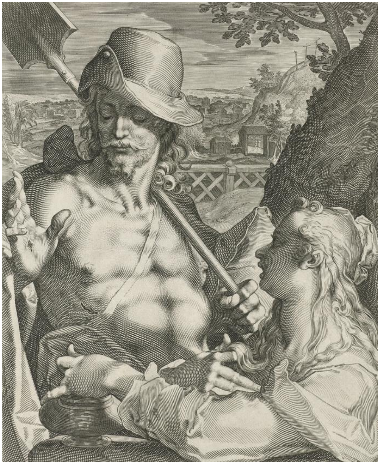
A. Sadeler II : Kristus záhradník (1570)