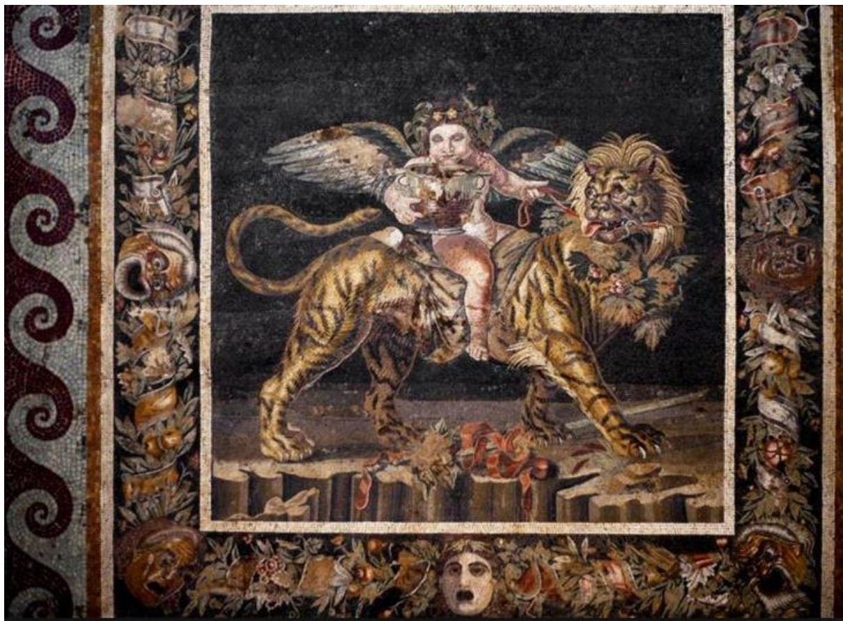
Dieťa Dionýzus Zagreus na tigrovi (mozaika, Dom faunov, Pompeje, 2.st.pr.Kr.)