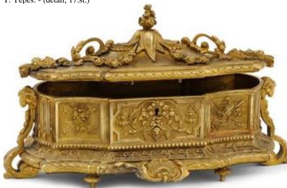
Mosadzná rokoková šperkavnica (západná Európa, okolo 1890)