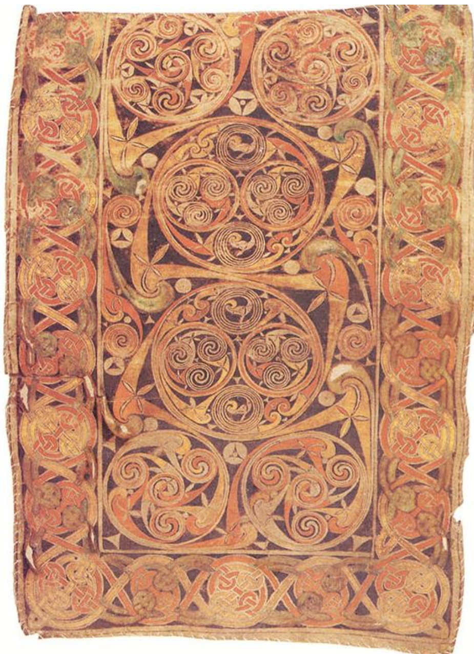
Kobercová strana (špirálový ornament a keltské pletence, Book of Durrow, 2.pol.7.st.)

špirálová kompozícia - pozri figura serpentinata