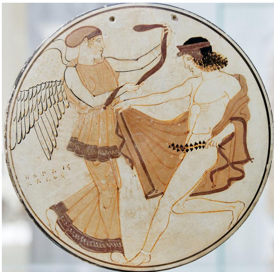
Penthesilea maliar: Nike ponúka veniec víťaznému atlétovi (technika na bielom pozadí, 460-450 pr.Kr.)