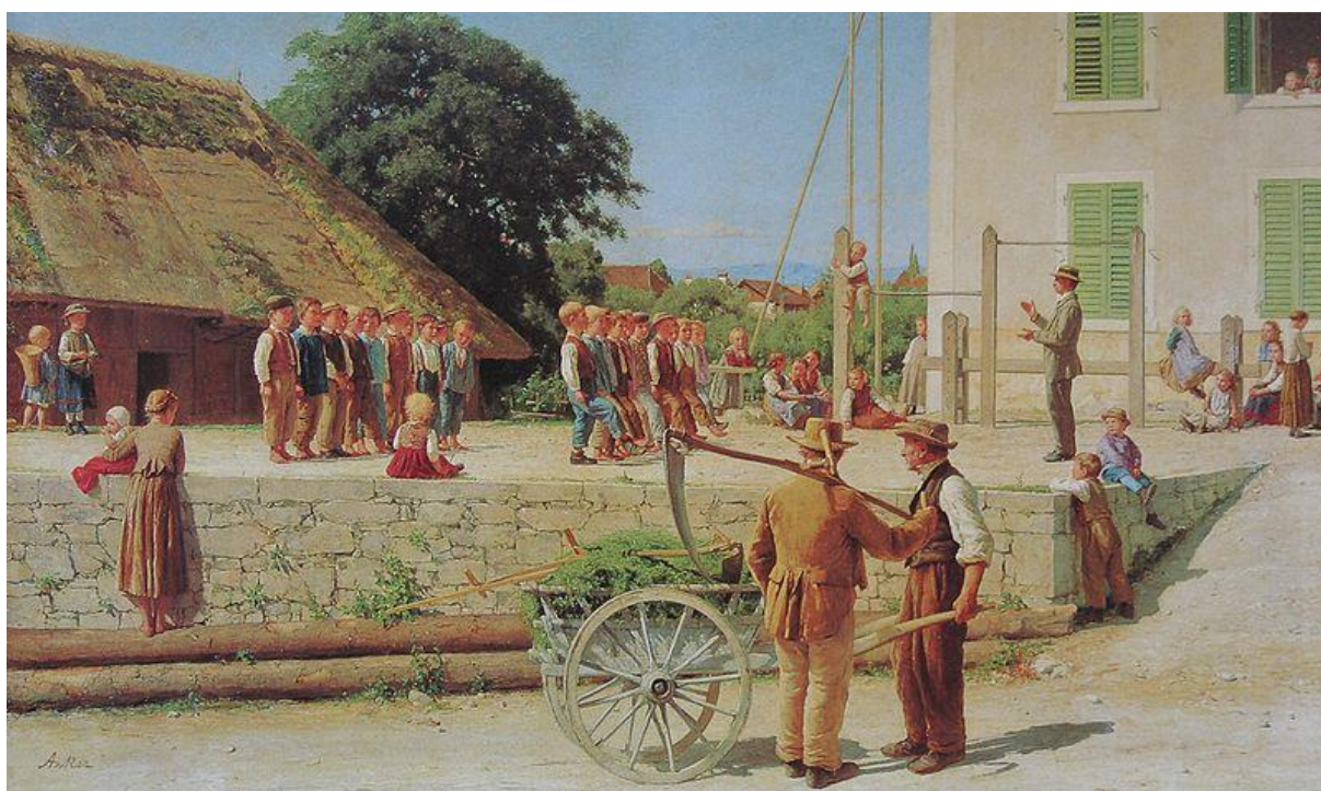
A. Anker: Športový deň v Ins (1879)