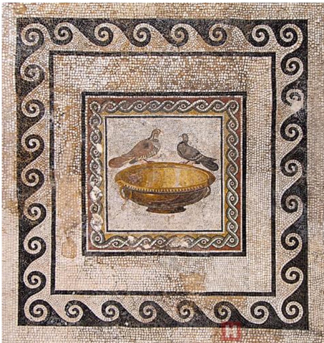
Miska s hrdličkami (opus tessellatum)