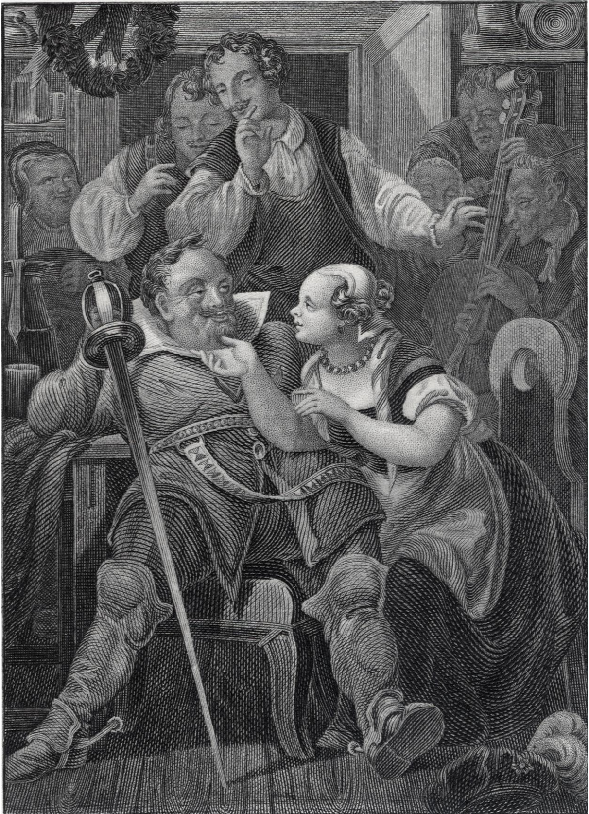
P. C. Geissler: Henri IV. (ocel'orytina, 19.st.)