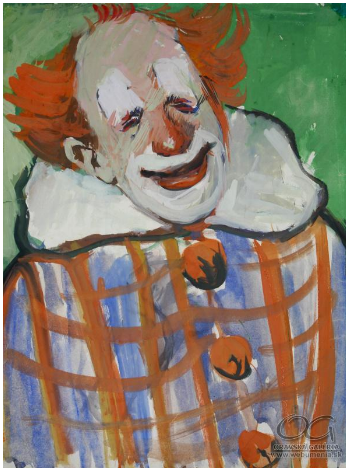
E. Špitz: Clown