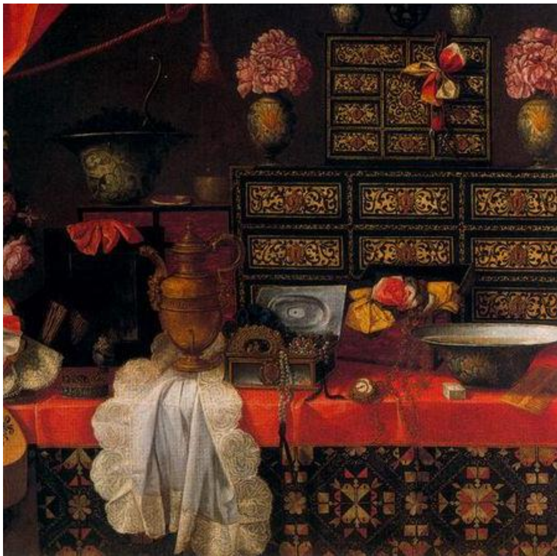
T. Yepes: - (detail, 17.st.)