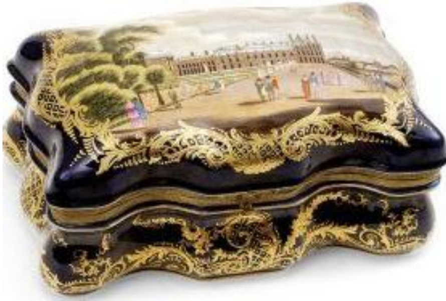
Porcelánová šperkavnica (Nemecko, okolo 1900)

špiciak - čes. špičák; typ sochárskeho dláta s ostrým hrotom; pozri zubák , sochárske nástroje , kamenické nástroje ; oškrdlík