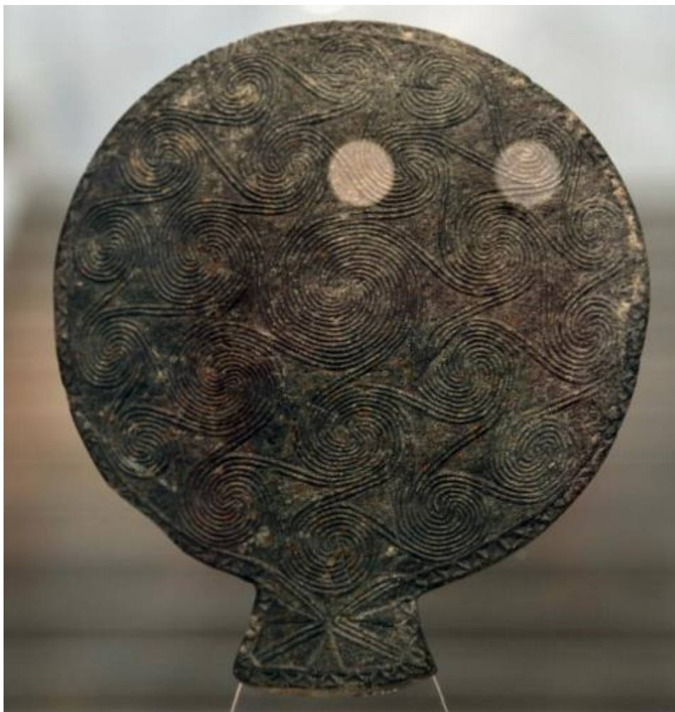
Panvica (bronz, kykladská kultúra, 2800-2300pr.Kr.)